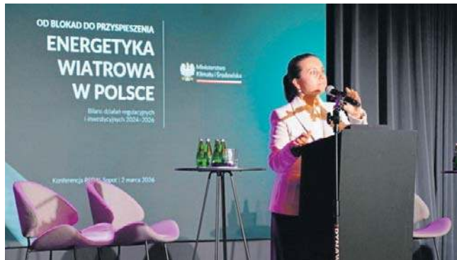
W Sopocie wskazywano wyraźnie, że prezydenckie weto spowolniło rozwój sektora energetyki odnawialnej