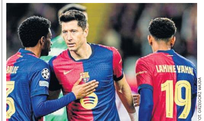
Tym razem w roli głównej wystąpił Lamine Yamal, ale Robert Lewandowski też swoje strzelił. Niestety, doznał kontuzji i po krótkiej pauzie będzie musiał grać w masce

Polka przebywa na zgrupowaniu w Dausze od niespełna dwóch tygodni. W Katarze przygotowuje się do startów w 2026 roku.