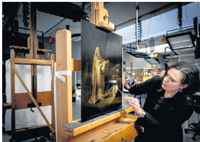
„Wizja Zachariasza” przedstawia scenę biblijną: kapłan Zachariasz słyszy wieść od archanioła Gabriela