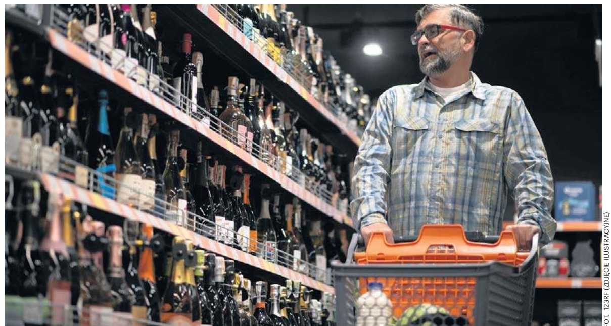
FOT. 123RF (ZDJĘCIE ILUSTRACYJNE)

Czy w Gdyni będzie obowiązywała nocna prohibicja?