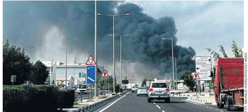
Irańskie pociski spadły także na Dohę, stolicę Kataru. W poniedziałek rano w całym mieście słyhać było serię głośnych wybuchów

Co najmniej 555 osób zginęło dotąd w Iranie w wyniku ataków USA i Izraela na to państwo - poinformował w poniedziałek irański