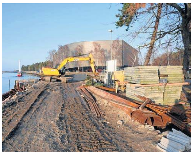
Przebudowa 140-metrowego odcinka nabrzeża Maltańskiego to pierwszy etap inwestycji w porcie

- Nie znamy jeszcze konkretnych dotyczących dostępu do plaży. Rozmowy z Urzędem Morskim są cały czas w toku - podkreśla Agnieszka Derba, burmistrz Łeby. - Mamy wyznaczone o jedno kąpielisko mniej, ze względu na budowę. Wyznaczone są też punkty usługowe na dojazdach do plaż, natomiast czekamy co będzie z lokalizacjami punktów na samych plażach. Ustalamy to z Urzędem Morskim w Gdyni. Zależy nam na tym, żeby w sezonie było jak najmniej utrudnień, natomiast Urząd Morski chce szybko i sprawnie przeprowadzić inwestycję, na którą ma mało czasu.