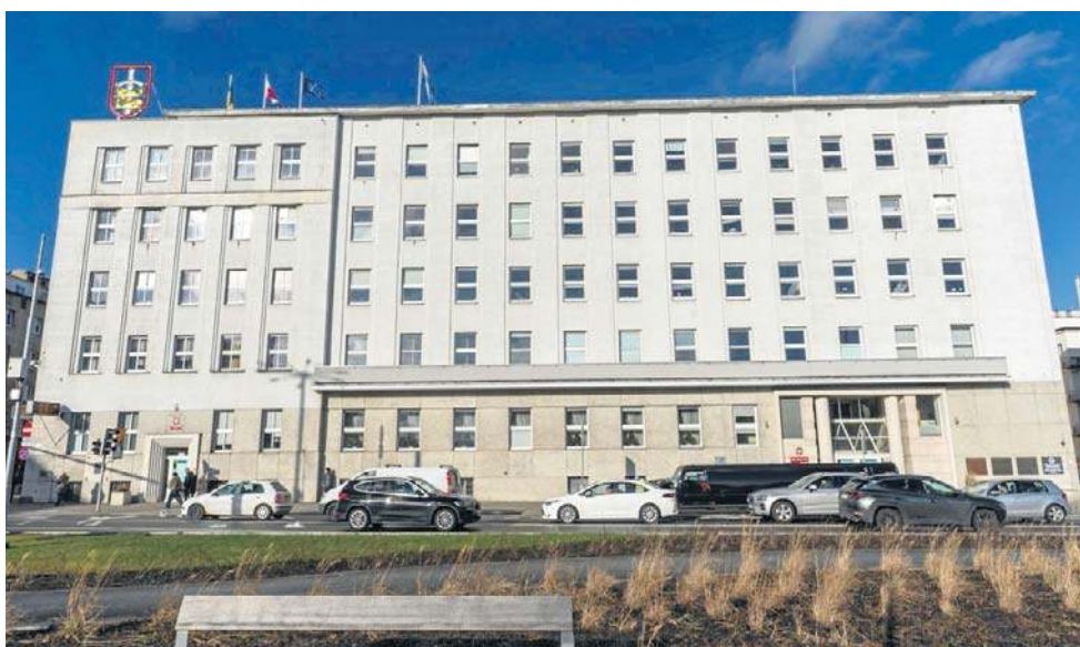
Radni dzielnicowi zagłosowali niezgodnie z oczekiwaniami władz miasta?

- Proces zajmie znacznie więcej czasu niż trzeba, ale w międzyczasie przyjrzymy się też liczbie koncesji, ponieważ dane GUS-owskie wskazują, że znacząco spada konsumpcja alkoholu - mówi Łukasz Piesiewicz. - Nasylenie w niektórych dzielnicach koncesjami alkoholo-