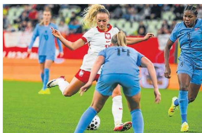
Polki znów zmierzają się z Holenderkami w Gdańsku, ale tym razem stawka spotkania będzie dużo wyższa

- Spotkanie z Holandią miało charakter testowy, grał-