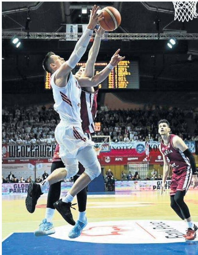
Reprezentanci Polski w koszykówce zrobili do tej pory wszystko, aby po raz trzeci wystąpić na mundialu

Radości z wygranej i pewnego awansu do drugiej fazy eliminacji nie krył także selekcjoner Biało-Czerwonych.