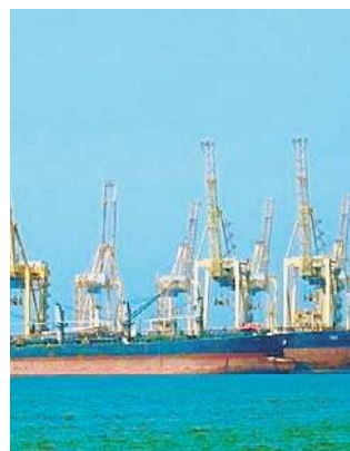
Blokada Cieśniny Ormuz wpływa na ceny ropy

- Jeśli ruch tankowców w Cieśninie Ormuz zostanie szybko wznowiony albo doj-