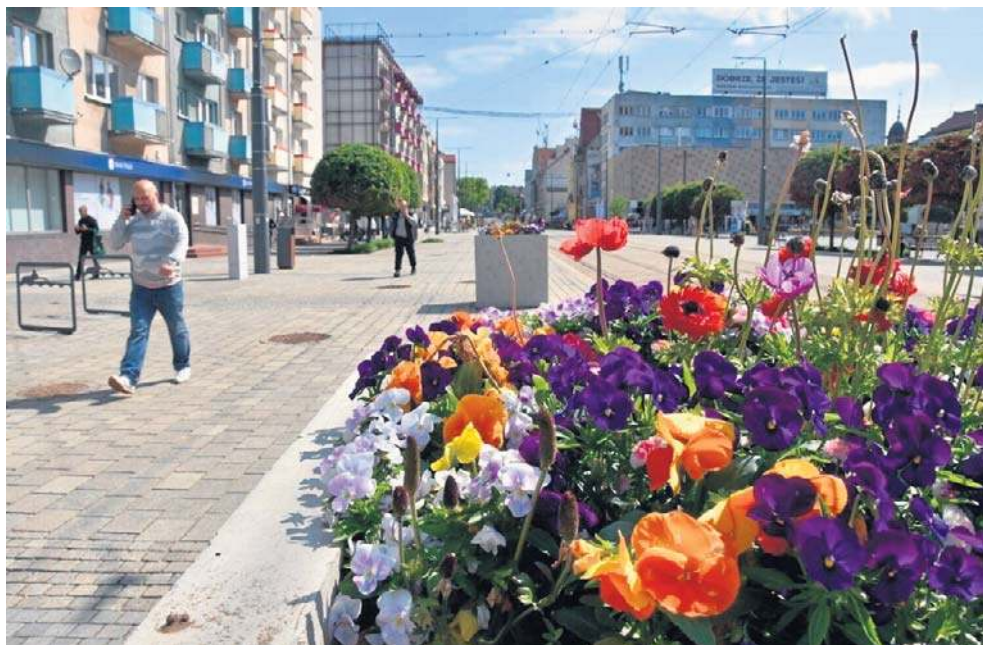
Stary Rynek i deptak Sikorskiego to miejsce, gdzie muzykę słychać regularnie. Za dwa miesiące rozpocznie się tu wakacyjny cykl Dobry Wieczór Gorzów

„W innych miastach można grać, rozwijając pasę i dzielić się muzyką z ludźmi - i nikt za to