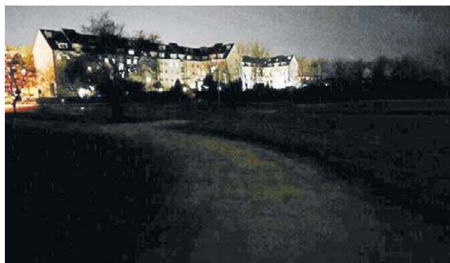
Miasto ustala priorytety w oparciu o dostępne środki finansowe oraz skalę potrzeb - napisano w odpowiedzi

Magistrat w swojej odpowiedzi potwierdza, że wskazany ponad dwustumetrowy odcinek drogi znajduje się w zarządzie miasta. Urzędnicy przy-