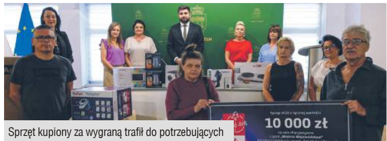
Sprzęt kupiony za wygraną trafił do potrzebujących

internetowego konkursu „Świeć z Energa” o tytuł Świetnej Stolicy Polski. Chełmianie po raz kolejny stanęli na wysokości zadania i choć tym razem nie udało się powtórzyć sukcesu sprzed kilku lat, zdobyć głównej nagrody i tytułu Świetnej Stolicy Polski, bo o włos wyprzedziła nas Skoczów, to w województwie lubelskim zwyciężyliśmy i bodajże już o raz trzeci wygraliśmy 10 tys. zł. Jak widać było warto i mamy nadzieję, że w kolejnej edycji jeszcze więcej z nas weźmie udział w głosowaniu i główna nagroda będzie nasza. (RD)