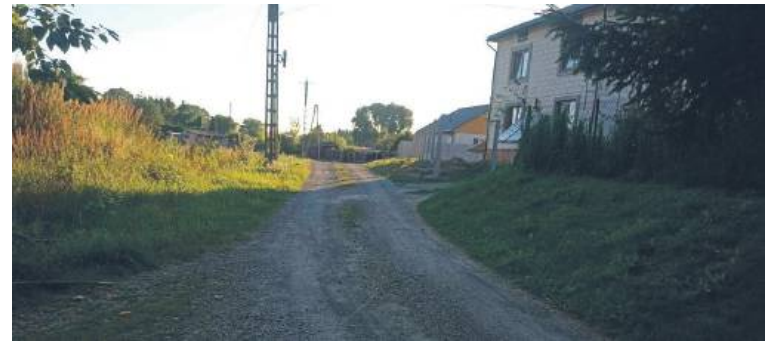
Szutrowa droga po deszczu zamienia się w grzęzawisko, w czasie suszy unoszą się z niej kłęby pyłu