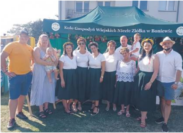
15 sierpnia na stadionie przy budynku urzędu gminy w centrum Fajstawic odbyła się 11. edycja Wojewódzkiego Święta Ziół.