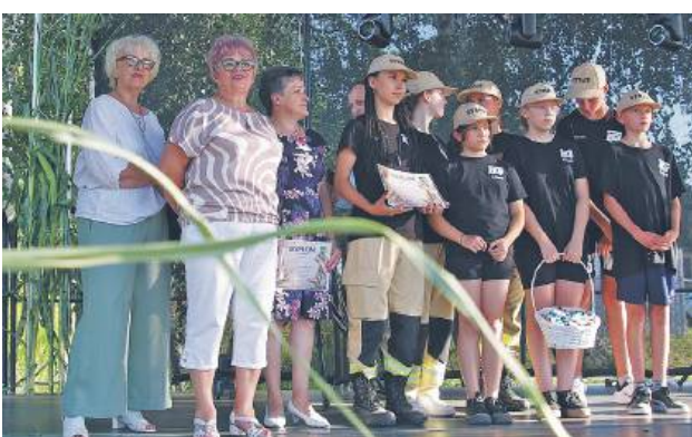
W piątek, 15 sierpnia, na boisku w Łanach (gmina Krasnystaw) zorganizowano imprezę pod nazwą „Dożynki Trzech Wsi”, w której udział wzięli mieszkańcy Kolonii Zastawie/Łany oraz Małochwieja Dużego i Małochwieja Małego.