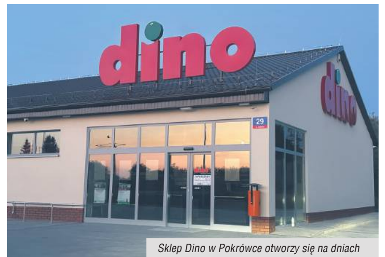
Sklep Dino w Pokrówce otworzy się na dniach

Dla lokalnych przedsiębiorców obecna fala inwazji dyskontów do coraz mniejszych miejscowości, to śmiertelne zagrożenie. Mamy nadzieję, że sercem i portfelem pozostaniemy z naszymi małymi, rodzinnymi sklepami i lokalnymi przedsiębiorcami. (RD)