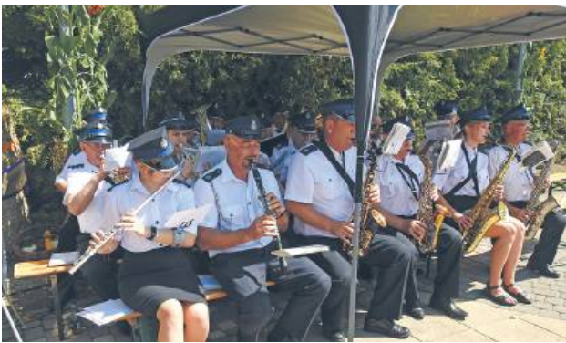
Święto plonów w gminie Izbica odbyło się 15 sierpnia.