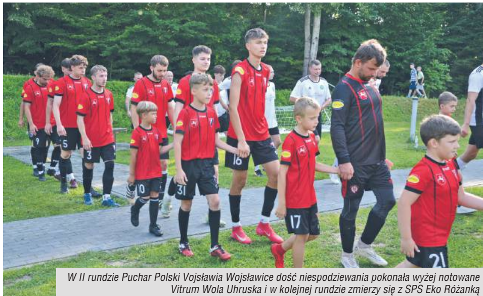
W II rundzie Puchar Polski Wojsławia Wojsławice dość niespodziewanie pokonała wyżej notowane Vitrum Wola Uhruska i w kolejnej rundzie zmierzy się z SPS Eko Różanką

14 sierpnia w siedzibie chełmskiego Oddziału LZPN odbyło się losowanie par III rundy Pucharu Polski. Mecze zaplanowano na 27 sierpnia (środa) o godz. 16.30. Oto zestaw par: Chełmianka II – GKS Łopiennik , Ognio – Brat , Wojsławia – SPS Eko , Astra – Kłos oraz Znicz – Ruch . W IV rundzie (24 września) zagra: 5 zwycięzców III rundy oraz Start Krasnostaw i Bug Hanna z IV ligi i III-ligowa Chełmianka. (kg)