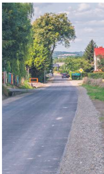
Klinkierniana doczekała się remontu.

Inwestycja na pewno przyczyni się do poprawy komfortu jazdy, ale przede wszystkim zwiększy bezpieczeństwo