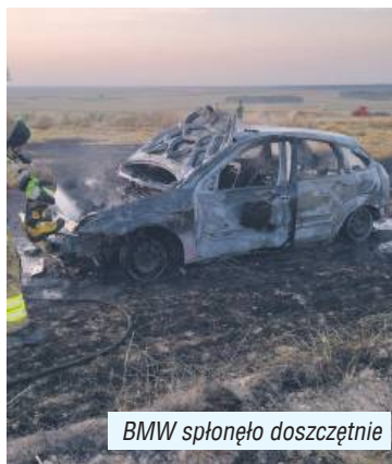
BMW spłonęło doszczętnie

Nikomiu nic się nie stało i policja odstąpiła od dalszych czynności. Kilka dni wcześniej do niemal identycznego zda-