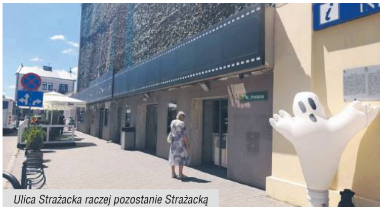
Ulica Strażacka raczej pozostanie Strażacką