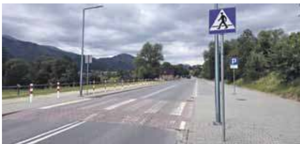
Policja przyznaje, że progów jest dużo, ale odkąd je zamontowano, nie było żadnego zdarzenia drogowego na tym odcinku ulicy.