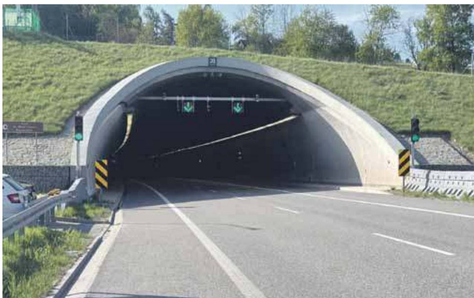
Ponad 22 miliony pojazdów przejechały dotąd tunelem pod Małym Luboniem.

W niedzielę padł nowy rekord przejazdów tunelem na zakopiance. Trasą S7 przejechało 48 040 samochodów. Poprzedni rekord (45 585 z 22 czerwca) przetrwał niespełna miesiąc i został pobity o prawie 2,5 tysiąca pojazdów - informuje Kacper Michna z Generalnej Dyrekcji Dróg Krajowych i Autostrad w Krakowie. - To już dwunasty w tym roku dzień, w którym liczba przejazdów tunelem przekroczyła 40 tysięcy.