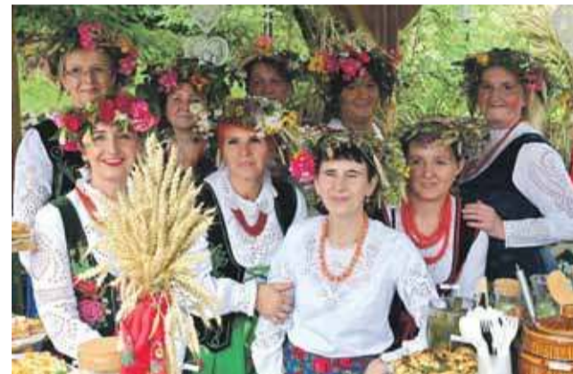
KGW z Waksmundu zachwyliło nie tylko smaczными daniami, ale i kwiecistymi wiankami na głowie.