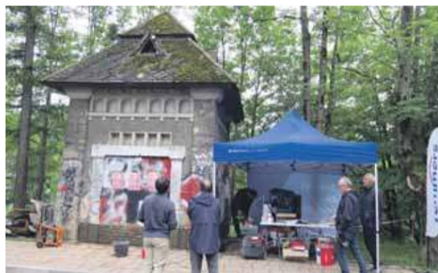
Pierwsze koty za płoty - ruszył remont zabytkowej stacji trafo na Koziańcu.

Fachowcy z firmy Remmers badający obiekt wykryli lekkie pęknięcia konstrukcyjne budynku biegnące od dołu, od strony