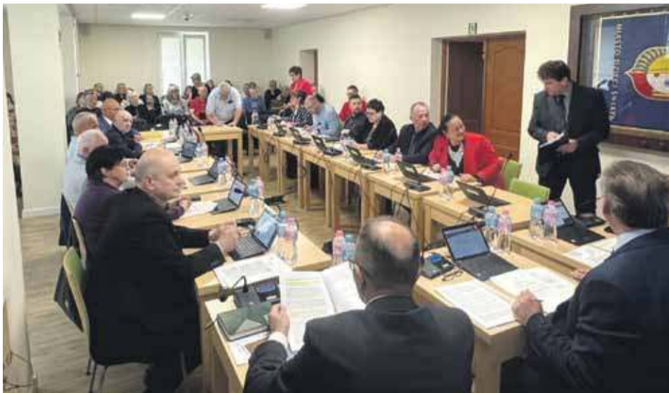
Posiedzenia Rady Miasta Rabki-Zdroju bywają burzliwe.

Pod koniec posiedzenia niektórzy z członków rady nie kryli jednak niezadowolonych z powodu naruszenia pierwotnych ustaleń dotyczących nieorganizowania posiedzeń w czasie wa-