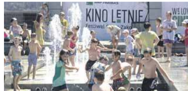
Dzieci z kolonii letniej chłodzą się na Placu Niepodległości w Zakopanem.