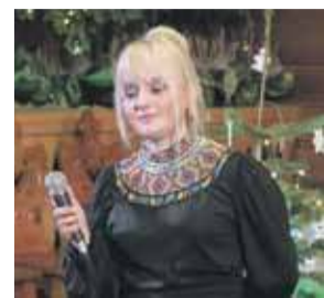
Kolejny sukces w karierze zakopiańskiej wokalistki.

O swoim sukcesie artystka poinformowała również w mediach społecznościowych: „To niezwykle