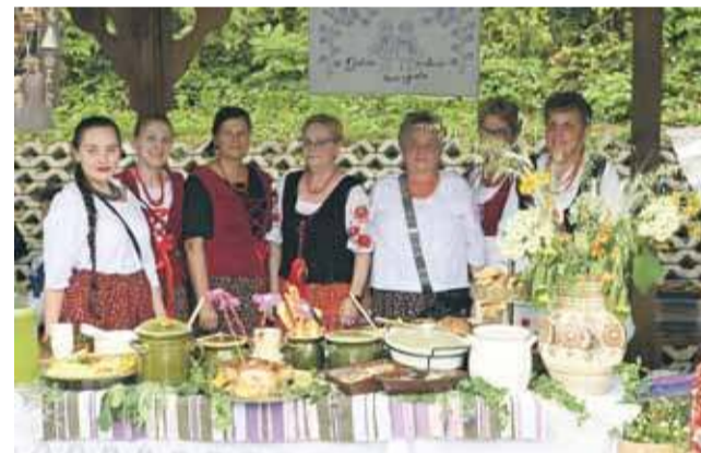
Gaździnki z Ostrowska dopisały jak zawsze!

kursu potraw był też wspólny koncert wszystkich gospodyń. Wybrzmiały śpiewki podhalańskie, spiskie i „międzynarodowa” - jak określiła ją Józefa Kuchta - „Sza dziewczeczka do laseczka”. Wszystkie koła wyróżniono i nagrodzono za trzy najsmaczniejsze potrawy i napitki. Osobne wyróżnienia przyznano też w kategorii „potrawa pogranicza” paniom z Dursztyna i Nowej Białej, a także tym kołom, które zadbały o najpiękniejszy wystrój swoich stoisk. Nagroda główna - voucher o wartości 1500 zł do wykorzystania w Termach Szaflary - drogą losowania trafiła do KGW w Gronkowie.