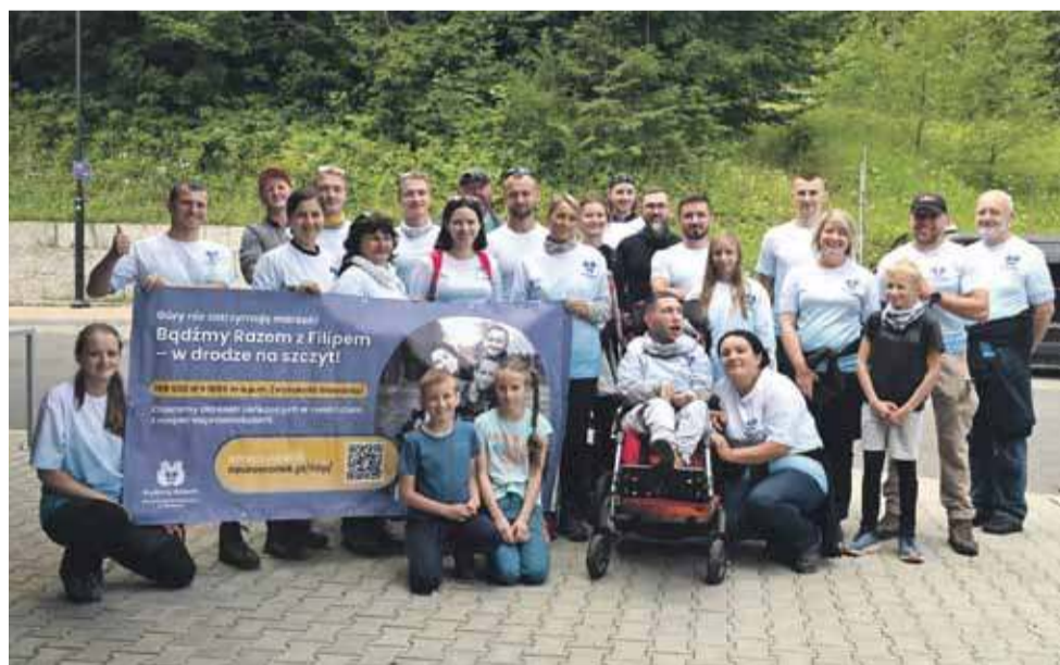
- Zapamiętamy te chwile z piątku 18 lipca na długo! - mówią zgodnie członkowie wyprawy na Giewont.

- Już same przygotowania były pełne emocji, a co dopiero chwile podczas wyprawy. Wszyscy nam gratulowali na szlaku, podziwiali i przyjmowali niesamowicie serdecznie. A dzisiaj na Giewont wychodziło dość sporo osób. Żałujemy tylko jednego, że nie wzięliśmy ze sobą więcej ulotek informacyjnych Stowarzyszenia Hospicyjnego „Bądźmy Razem”, które rozeszły się w górach jak świeże bułecz-