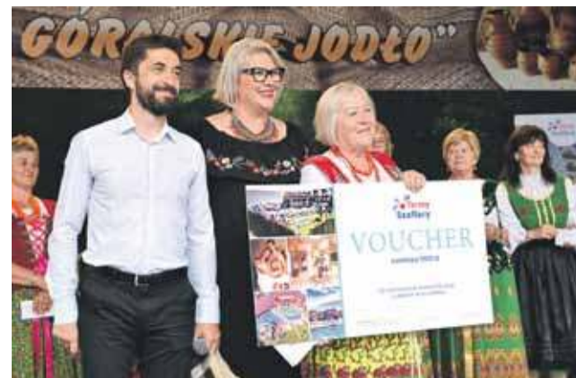
Główna nagroda, choć wybór był trudny, trafiła do KGW w Gronkowie.