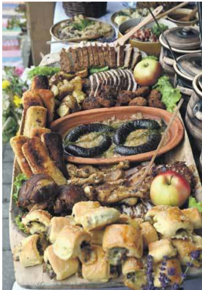
Pod przygotowanymi smakołykami uginały się stoły.

Panie z KGW w Obidowej tym razem postawiły na mariaż tradycji z nowoczesnością. Przy-