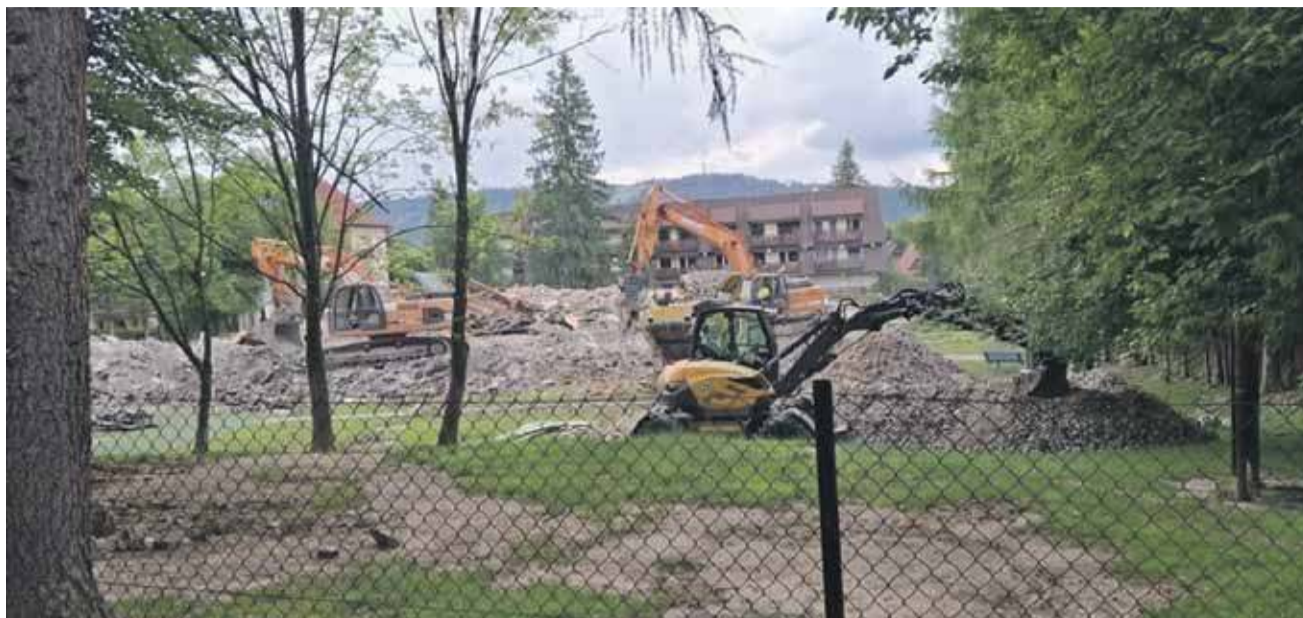
Wycięte podczas rozbiórki starego i budowy nowego przedszkola drzewa zostaną zastąpione nowymi sadzonkami.

Burmistrz zapewnia, że po zakończeniu prac budowlanych wokół przedszkola zasadzonych