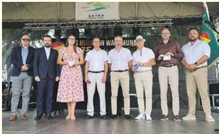
W niedzielę, 20 lipca, stadion w Waksmundzie tętnił życiem - klub LKS Huragan Waksmund świętował swoje 75-lecie istnienia.

i wychowawcze. Dla wielu mieszkańców Waksmundu i okolic to coś więcej niż tylko klub sportowy - to symbol lokalnej tożsamości, tradycji i wspólnoty. Nic więc dziwnego, że jubile-