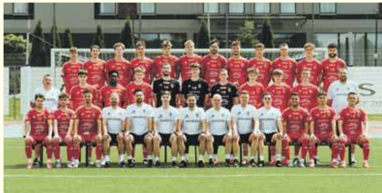
Tak prezentuje się kadra Podhala na zaczynający się sezon drugiej ligi.