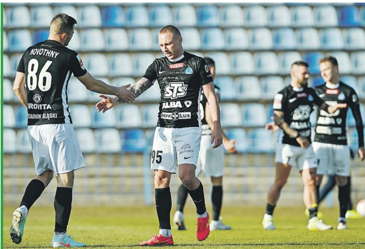
Czy ekipa Ruchu Chorzów wiosną polepszy pozycję w tabeli?