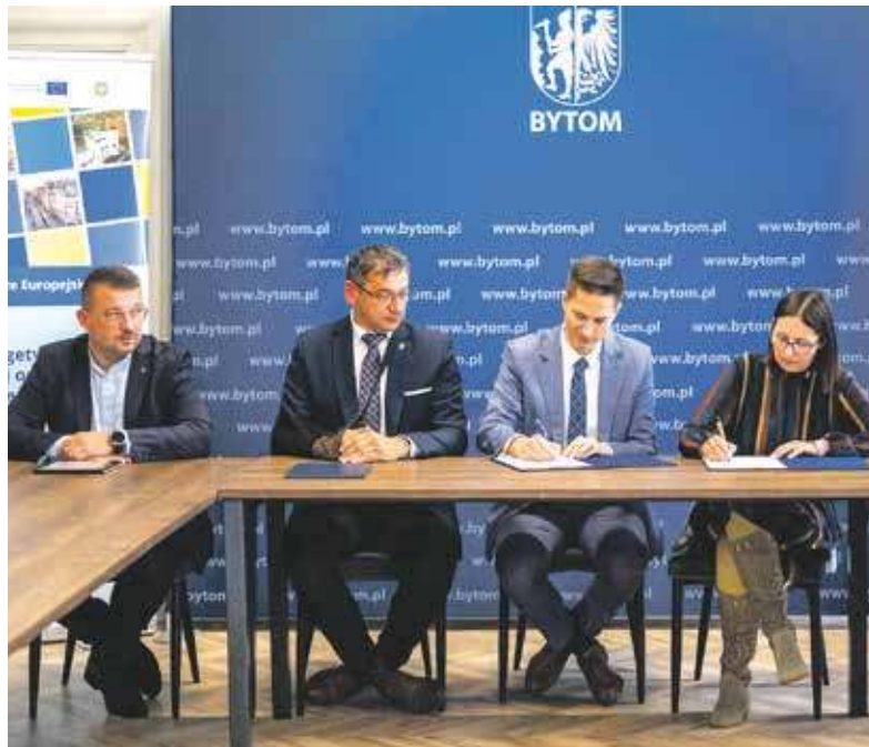
Pierwsza umowa podpisana, będzie ich razem ćwierć tysiąca