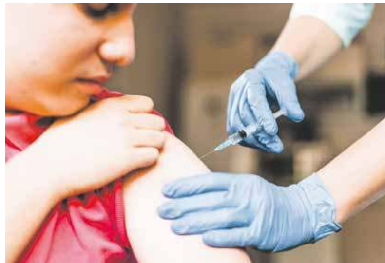
Terozki mocka ludzi bierze szpryca na gripa

Tyz downi we stołówkach i barach wisiała kartka ze takim hasłem: „Proszę nie zostawiać resztek jedzenia na talerzach”. Słonzokowi musieliby napisać: „Niy łostawiać abfali na talyrzach”. A coby richtich sie posuchoł, to szłoby dodać: „Bo ci kucharka bez łeb do uciyrackom abo nudelkuloł”, czyli: „Bo cię kucharka dzieli w łeb ręcznikiem kuchennym lub włkiem do ciasta”. Tej dawnej stołówki lub też poczekalni u lekarza nie sposób sobie wyobrazić bez kartki z zaleceniem: „Przy okienku może znajdować się tylko jedna osoba”. Po naszymu stołoby tam tak: „Wele łokynka może stoć ino jedyn cowiek”. I jeszcze jedno hasło spotykane w wspomnianych miejscach: „Proszę czekać na swoją kolej”, czyli „Dockej, a przidzie na ciebie dran”. A jak już mówimy o kolejkach, to częsty napis informujący: „Kierunek kolejki” na Śląsku