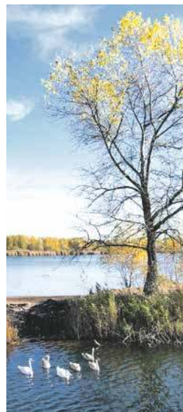
Żabie Doły to urokliwe miejsce

- Ponieważ połączenia hydrauliczne pomiędzy poszczególnymi zbiornikami powstawały w ostatnich dziesięcioleciach bardzo chaotycznie, nie mają one spójnej formy. Ich stan techniczny jest różny, a eksploatację utrudnia m.in. zamulenie. Realizacja projektu pomoże nam ustabilizować warunki wodne i przede wszystkim umożliwi dostęp do prawidłowej konserwacji urządzeń przelewo-