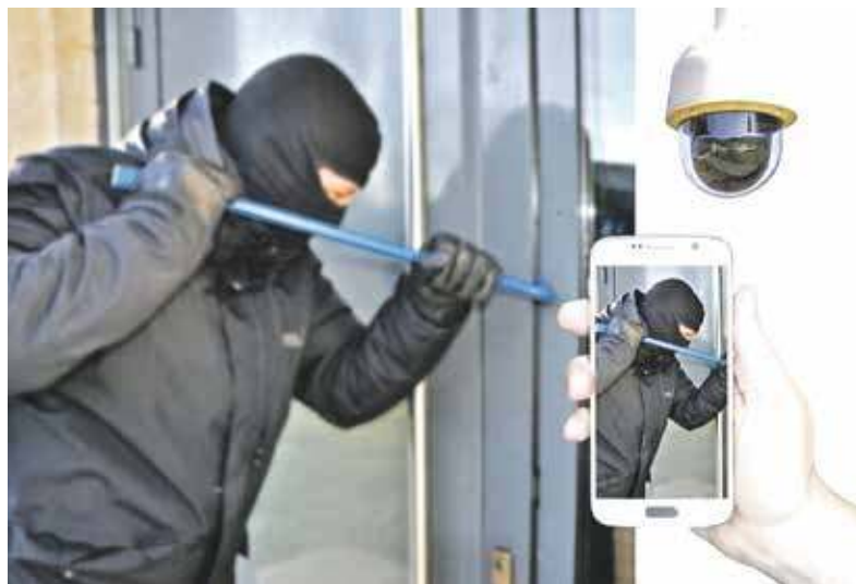
Osoby, które mieszkają w blokach mogą kupić drzwi antywłamaniowe i profesjonalne zamki

Osoby, które mieszkają w domach jednorodzinnych mogą zainwestować w wysokie ogrodzenia, zainstalować monitoring a nawet zapłacić firmie ochroniarskiej za pilnowanie naszych włości. Gdyby to nie pomogło do dyspozycji są rozmaite sejfy, w tym ognioodporne. Zapłacimy za nie od kilkuset złotych do nawet 15 tys. zł. Jeżeli jest co w takim sejfie trzymać, to na pewno taki pomysł będzie