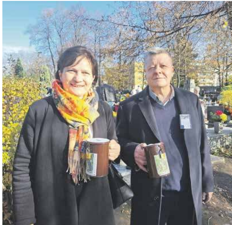
Senator KO i radny PiS. Jak widać, podczas kwesty możliwe jest współdziałanie ponad politycznymi podziałami