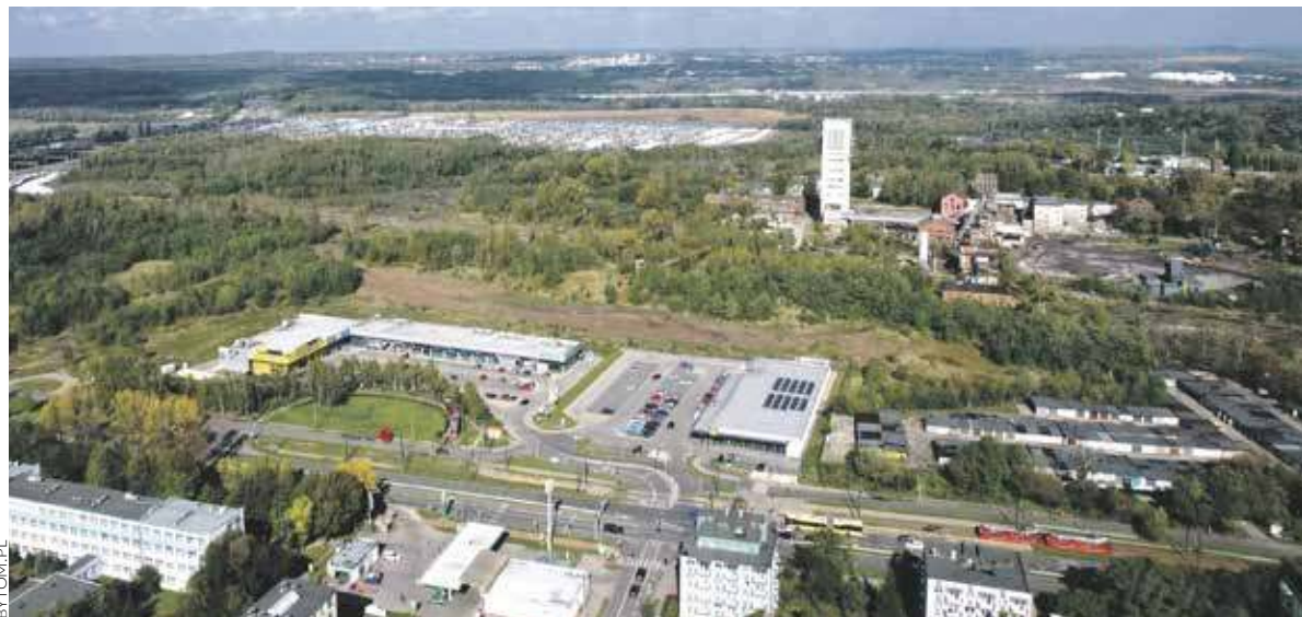
Basen miałby powstać na terenach po kopalni centrum

BYTOM. RADA NADZORCZA SPÓŁKI RESTRUKTURYZACJI KOPALNI NIE ZGODZIŁA SIĘ NA PRZEKAZANIE NASZEMU MIASTU KOLEJNYCH TERENÓW PO DAWNEJ KOPALNI CENTRUM. WŁADZE BYTOMIA UZNAŁY TĘ DECYZJĘ ZA KURIOZALNĄ, A NA DZIAŁCE PLANUJĄ POSTAWIĆ KRYTY BASEN.