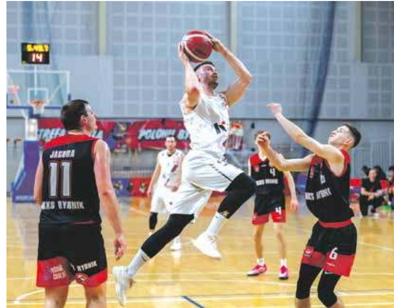
Bytomianie byli w meczu z Rybnikiem nie do zatrzymania

Świetnie dysponowani niebiesko-czerwoni w kolejnym spotkaniu 2. Ligi gościli w hali Na skarpie ekipę z Rybnika. Byli faworytami i nie zawiedli wygrywając aż 30 punktami. Wynik końcowy to 87:57 (26:15, 20:13, 22:13, 19:16). Wszystko było zatem jak za dawnych czasów: rozpedzeni miejscowi już w pierwszej kwarcie wyrobili sobie przewagę, a potem ją konsekwentnie powiększali. Goście nie byli w stanie dotrzymać im kroku, a po raz kolejny bardzo dobrze spisywała się bytomska obrona.