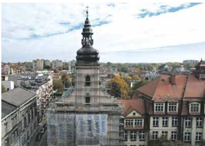
Wokół wieży ustawiono rusztowania

W środku budowli robota wre. W najbliższym czasie wykonawca zamontuje drzwi w przybudówkach, położy posadzki kamienne i weźmie się za roboty wykończeniowe w prezbiterium, gdzie trzeba zająć odnową witraży. Ich ramy zostały już naprawione, zabezpieczone farbą epoksydową i ponownie osadzone w oknach. Natomiast szkła są oczyszczane i odnawiane w specjalistycznej pracowni w Krakowie. Wrócić stamtąd na początek 2026 roku.