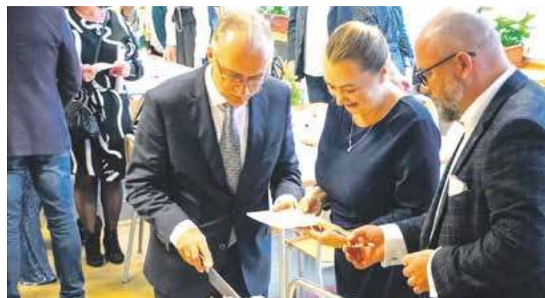
Jubileusz bez tortu? Nie ma mowy!

60-lecie istnienia obchodziła Szkoła Podstawowa nr 4 w Radzionkowie przy ulicy Sikorskiego. Okazały jubileusz stał się okazją do zorganizowania hucznej imprezy.