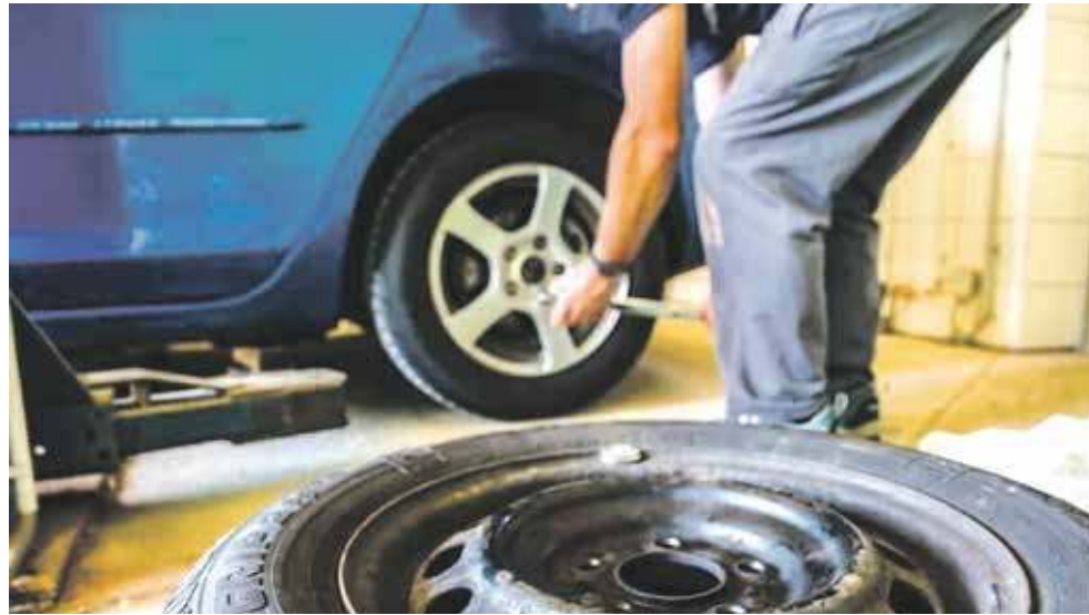
A Ty wymieniłeś już opony na zimowe?

Styl jazdy i warunki drogowe: Jeśli jeździsz głównie w mieście, dobrym wyborem mogą być opony o wszechstronnych właściwościach. Jeśli jeździsz w trudniejszych warunkach, np. w górach, rozważ modele z lepszą przyczepnością na śniegu i lodzie. Do jazdy po autostradach i w zmiennych