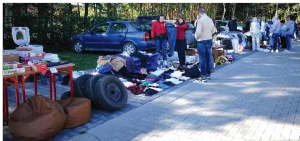
Zainteresowanie wyprzedażą przerosło oczekiwania organizatorów.