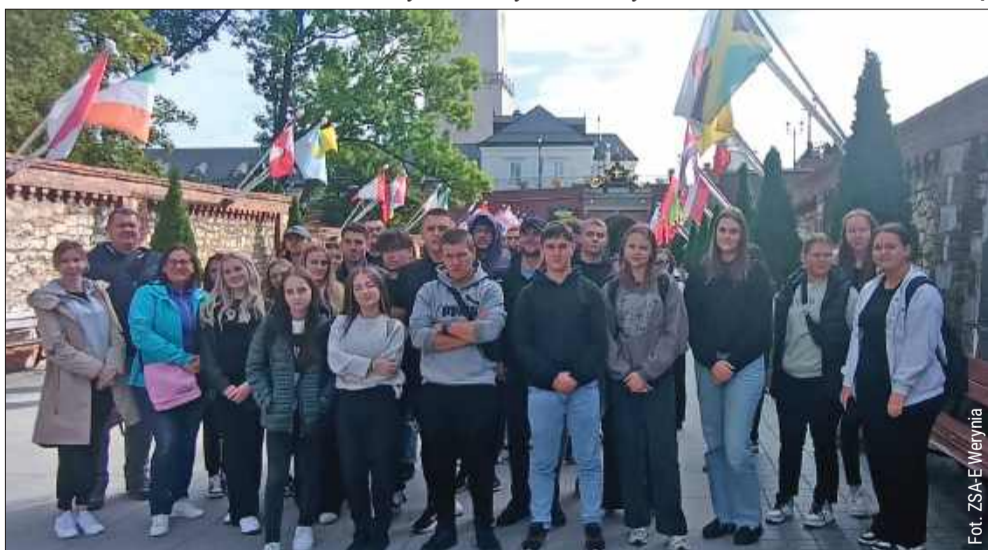
Maturzyści na Jasnej Górze. Tradycyjna wycieczka przed egzaminem dojrzałości.