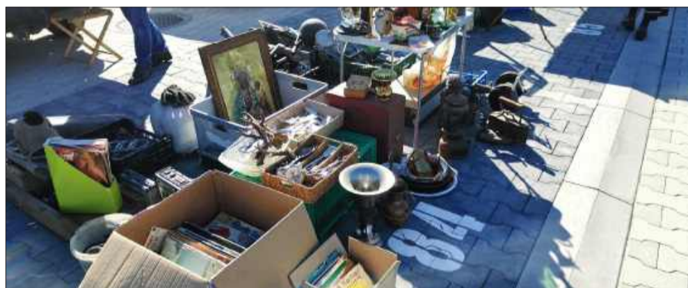
Można było upolować wyjątkowe obrazy, dzieła, czy książki.