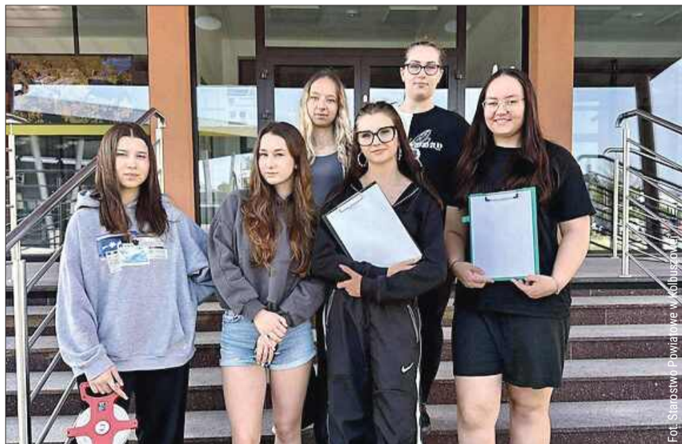
Uczennice klasy IV w zawodzie technik architektury krajobrazu stoją przed niecodziennym, a zarazem bardzo odpowiedzialnym zadaniem. W ramach zajęć projektowych zmierzają się z opracowaniem koncepcji zagospodarowania przestrzeni przy Starostwie Powiatowym w Kolbuszowej.

Polub Korso Tygodnik Regionalny facebook.com/korsokolbuszowskie