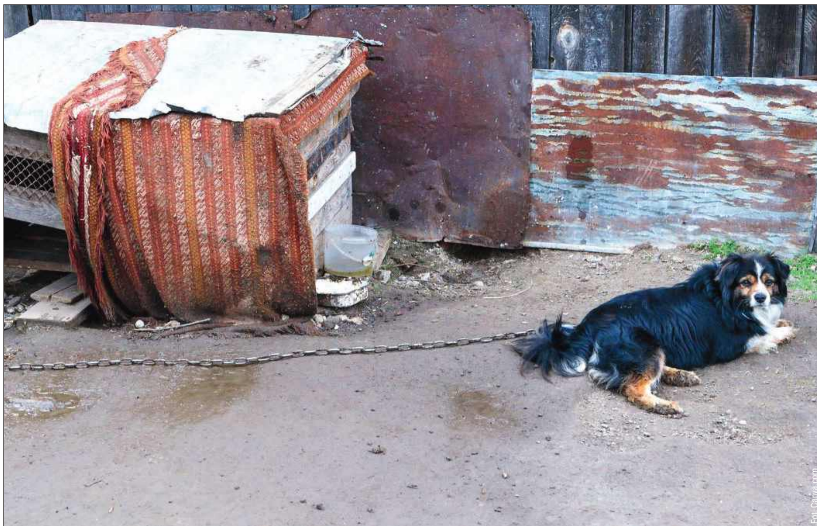
Posłowie zdecydowali o zakazie trzymania psów na łańcuchach.

Do wyjątków należą m.in.: prowadzenie psa na smyczy podczas spaceru, czasowe uwiązanie na czas transportu czy wizyty u weterynarza, sytuacje związane z tresurą lub wystawami, krótkotrwałe pozostawienie psa np. przed sklepem, działania wynikające