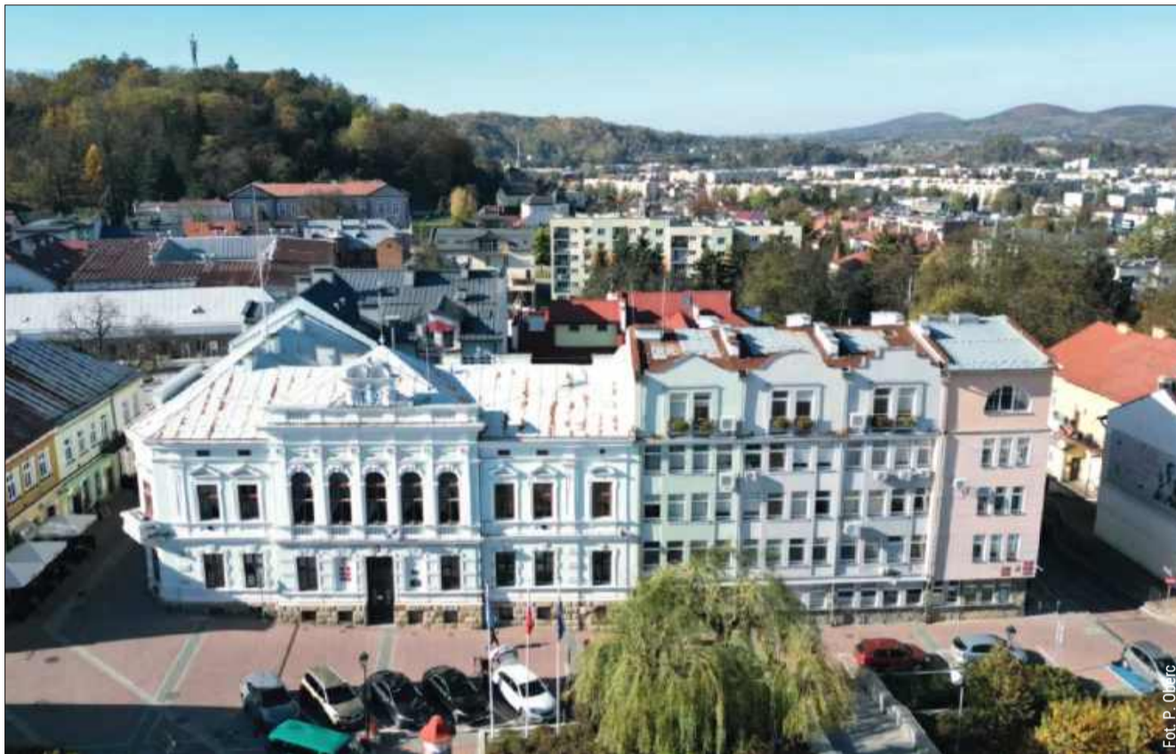
Znany datę referendum w Sanoku. Mieszkańcy zdecydują o przyszłości Rady Miasta

Zbliżające się głosowanie określane jest jako „moment