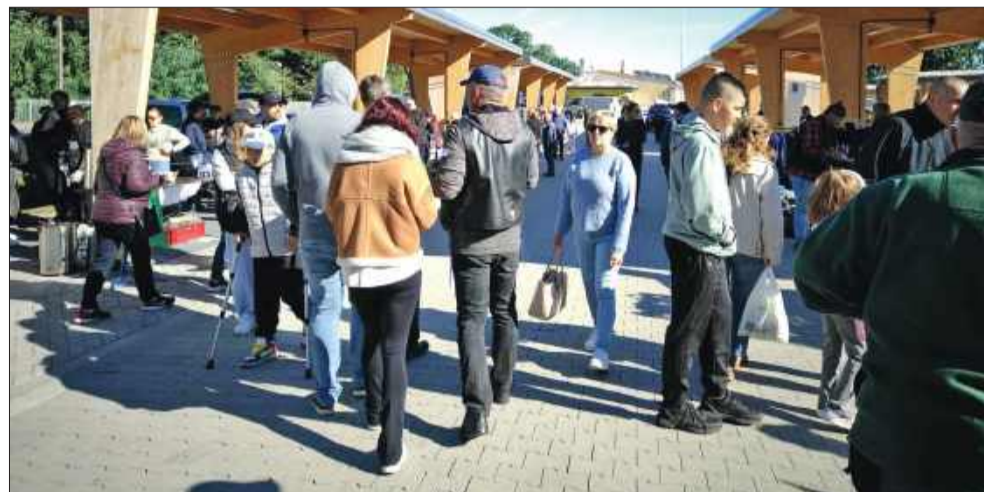
Mieszkańcy i przyjezdni tłumnie przybyli na pierwszą wyprzedaż garażową w Kolbuszowej.