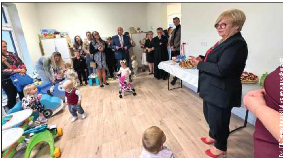
Najmłodszy będą mogli uczęszczać do klubu już od 1 października.