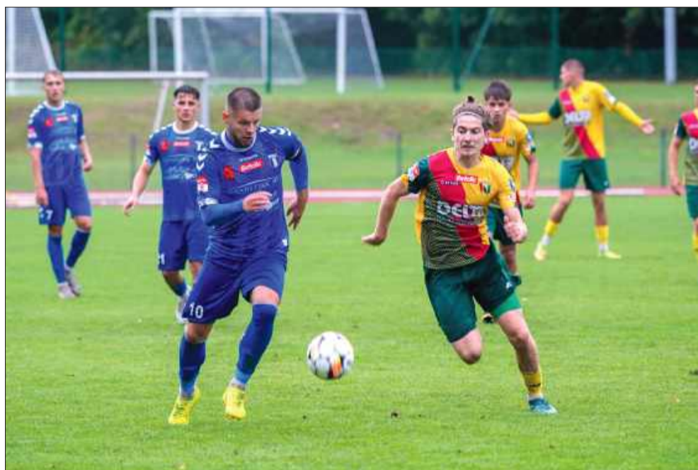
Sokół przegrywa w meczu domowym. Cracovia II lepsza o jednego gola.