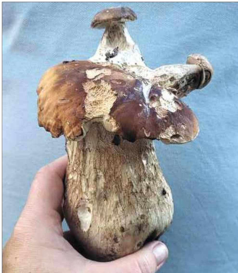
Takiego „szalonego” grzyba znalazł pan Zbigniew w Niwiskach.

Realnie oceniamy swoje możliwości. Las potrafi wciągnąć – czas płynie szybciej,