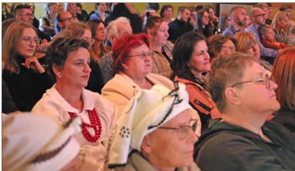
Zaproszeni goście mogli poznać bliżej życie i twórczość strażniczek lasowiackiego dziedzictwa.