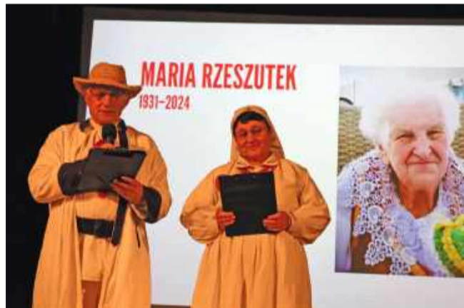
Podczas wydarzenia przybliżono sylwetki i życiorysy obu pań.

Dzięki pasji lokalnych twórców i wsparciu instytucji możliwe jest nie tylko zachowanie tradycji, ale także jej twórcze rozwijanie i prezentowanie młodszemu pokoleniom.