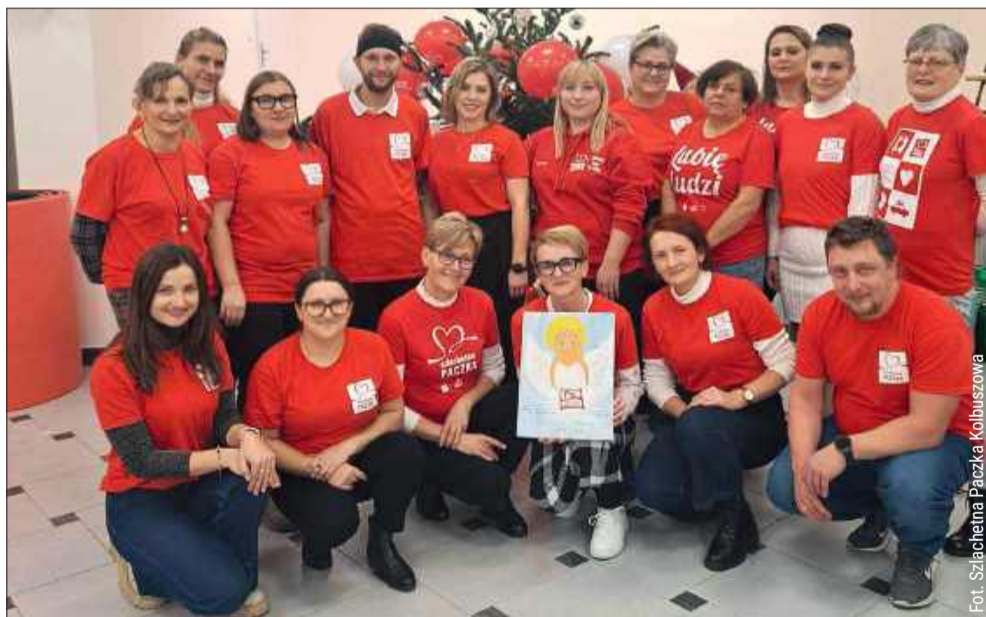
Dołącz do niesamowitej drużyny Wolontariuszy Szlachetnej Paczki z Kolbuszowej.

– Naszym celem jest niesienie mądrej pomocy dla każdej potrzebującej rodziny. Dzięki Waszemu zaangażowaniu może-