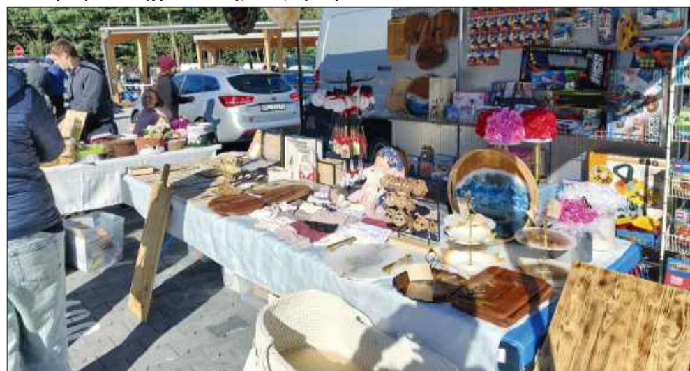
Podczas wyprzedaży można było znaleźć wiele ciekawych przedmiotów.