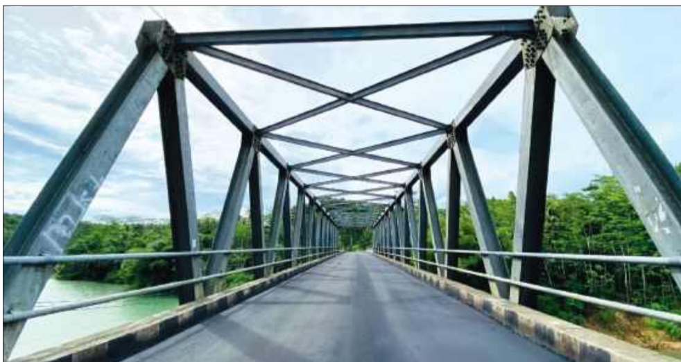
Trzy firmy chcą opracować koncepcję nowego układu drogowego powiatu mieleckiego.

Przedmiotem zamówienia było przygotowanie kompleksowej analizy oraz – na jej podstawie – koncepcji nowych połączeń drogowych na terenie powiatu. Dokumentacja ma obejmować m.in. propozycje budowy drogi zapewniającej bezpośrednie skierowanie transportu ciężarowego do sieci TEN-T oraz opracowanie wariantów dla budowy tzw. południowego odcinka obwodnicy Mielca wraz z mostem na rzece Wisłoce.