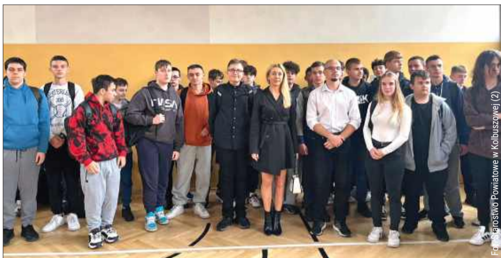
Uczniowie złożyli tradycyjne ślubowanie.