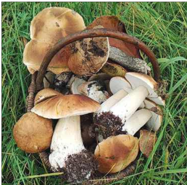
Kosze pięknych i dorodnych prawdziwków - to ostatni zbiór naszej Czytelniczki.