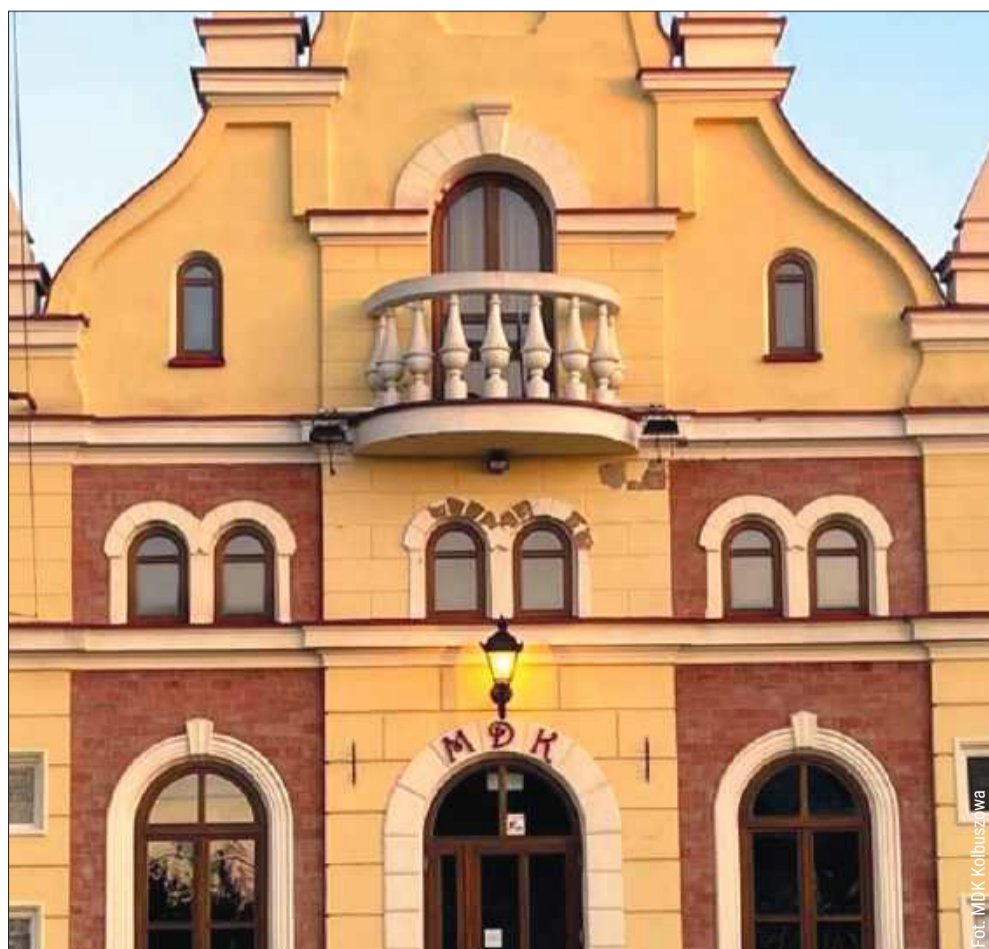
W Kolbuszowej już wkrótce rozpocznie się cykl potańcówek pod hasłem „Nie tylko dla seniorów”.