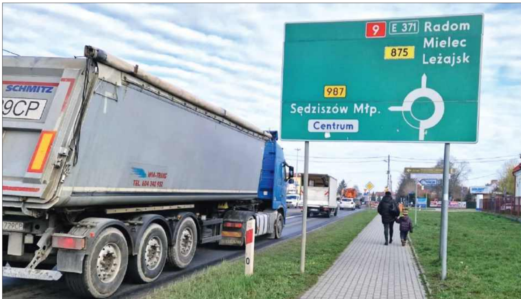
Projektanci przedstawili kolejne 6 wariantów części nowej drogi krajowej nr 9.

Uwagi można zgłaszać nie tylko podczas spotkań, ale również pisemnie – pocztą tradycyjną lub elektroniczną – na