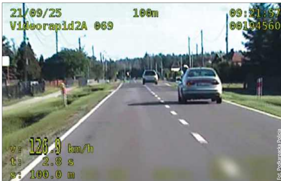
Kierowca z powiatu kolbuszowskiego pędził 126 km/h w terenie zabudowanym.

To niejedyny przypadek skrajnie nieodpowiedzialnej jazdy w regionie. Tego same-