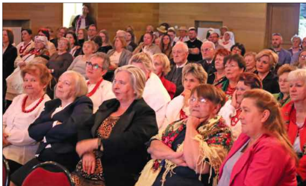
Sala Miejskiego Domu Kultury w Kolbuszowej wypełniła się publicznością.