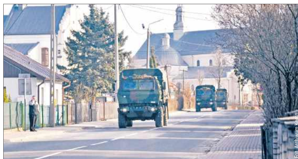
Na ulicach ponownie pojawić ma się większa liczba pojazdów wojskowych.