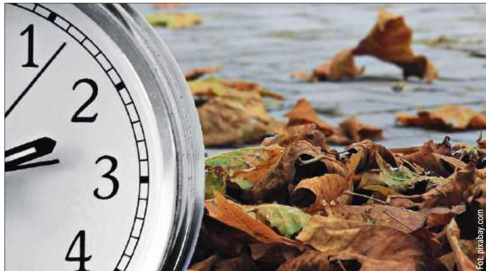
Już niebawem po raz kolejny zmienimy czas z letniego na zimowy.

Choć temat zniesienia obowiązku zmiany czasu powraca co roku, na razie nie ma decyzji o jego likwidacji. Wszystko wskazuje na to, że przynajmniej w najbliższych latach nadal będziemy przestawiać zegarki dwa razy w roku – w marcu na czas letni i w październiku na zimowy. bp