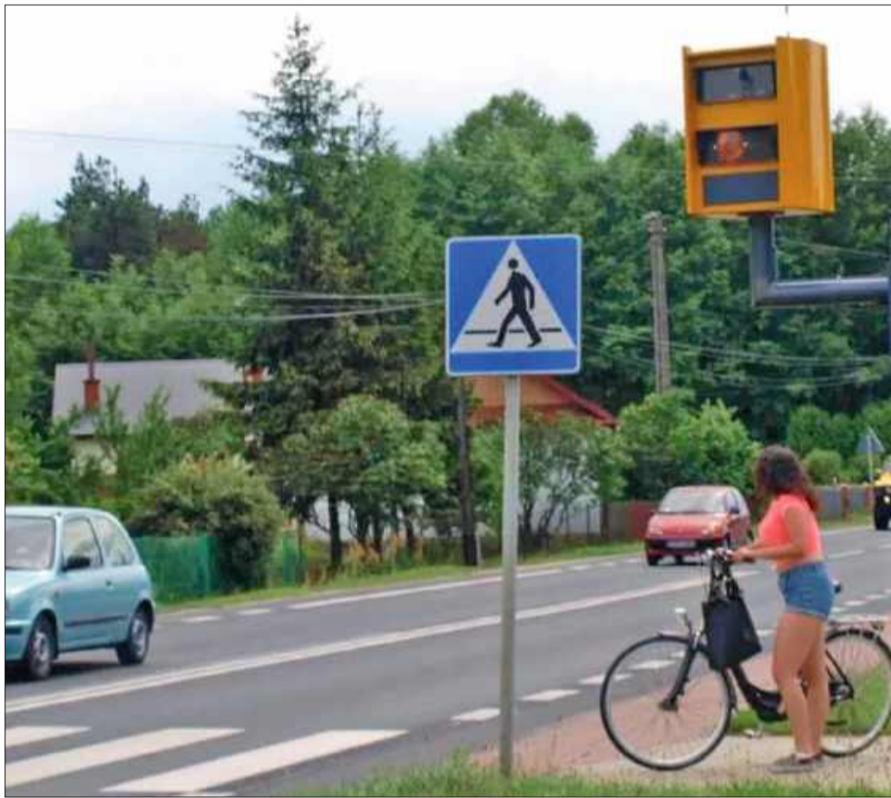
Fotoradar stanąć ma w okolicach skrzyżowania w Przylęku (gmina Niwiska), przy drodze wojewódzkiej.