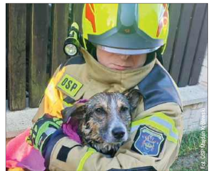
Pomoc dla czworonoga, który wpadł do studni nadeszła błyskawicznie.