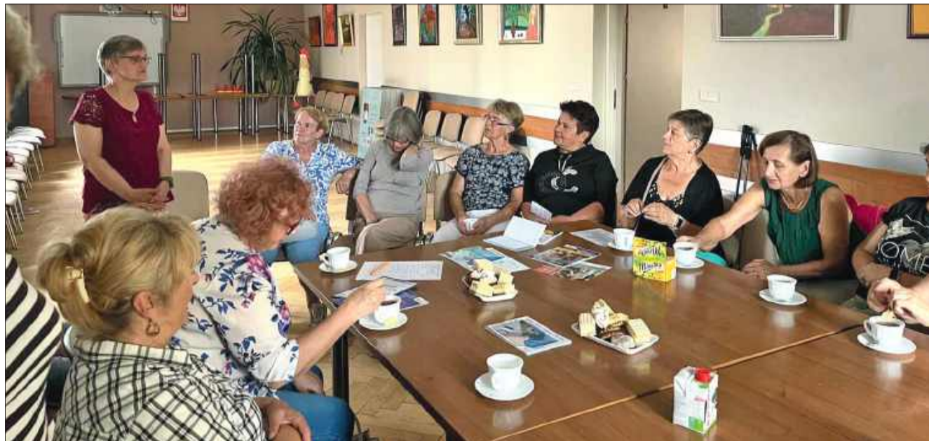
W Kolbuszowej powstało wyjątkowe miejsce. Chcesz dołączyć?

Jednak OCAS to nie tylko taniec. W planach są zajęcia