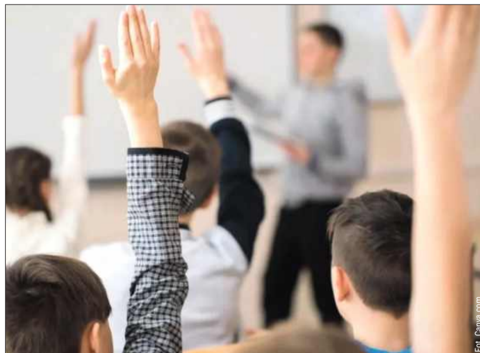
Edukacja zdrowotna w kolbuszowskich szkołach bez zainteresowania. Rodzice masowo wypisują dzieci z zajęć.

Ministerstwo Edukacji podkreślało, że edukacja zdro-