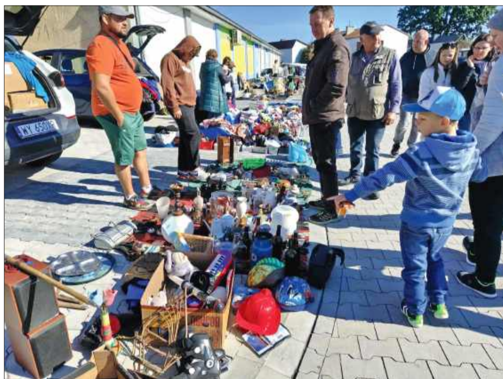
Kupujący chętnie oglądali i kupowali przeróżne artykuły, od ubrań, butów, po wyjątkowe tzw. „perełki”.