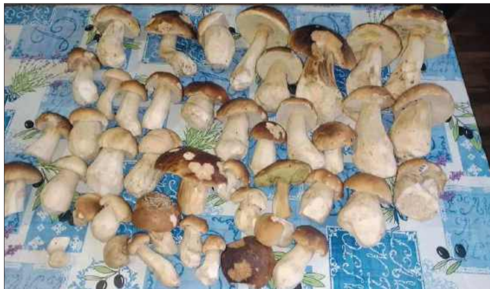
Taki widok ucieszyłby niejednego grzybiarza.