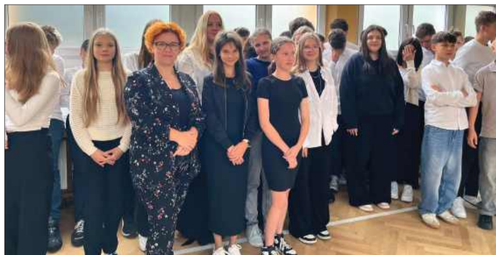
Przed pierwszoklasistami kilka lat nauki i ciężkiej pracy w dążeniu do ukończenia szkoły i zdobyciu wykształcenia.