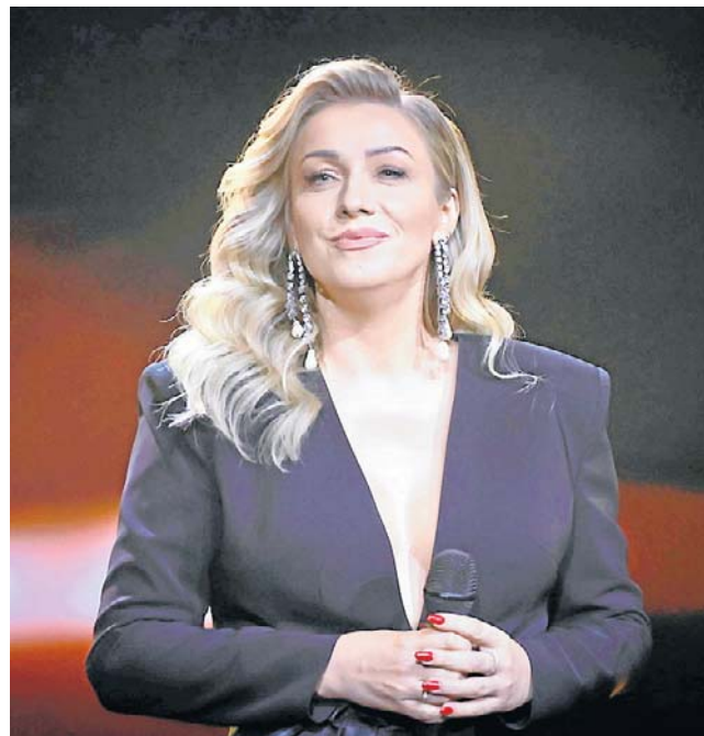
Katarzyna Cerekwicka rzadko dzieli się swym życiem prywatnym. Teraz jednak ogłosiła, że została mamą

Liczne zawirowania w życiu prywatnym sprawiły, że