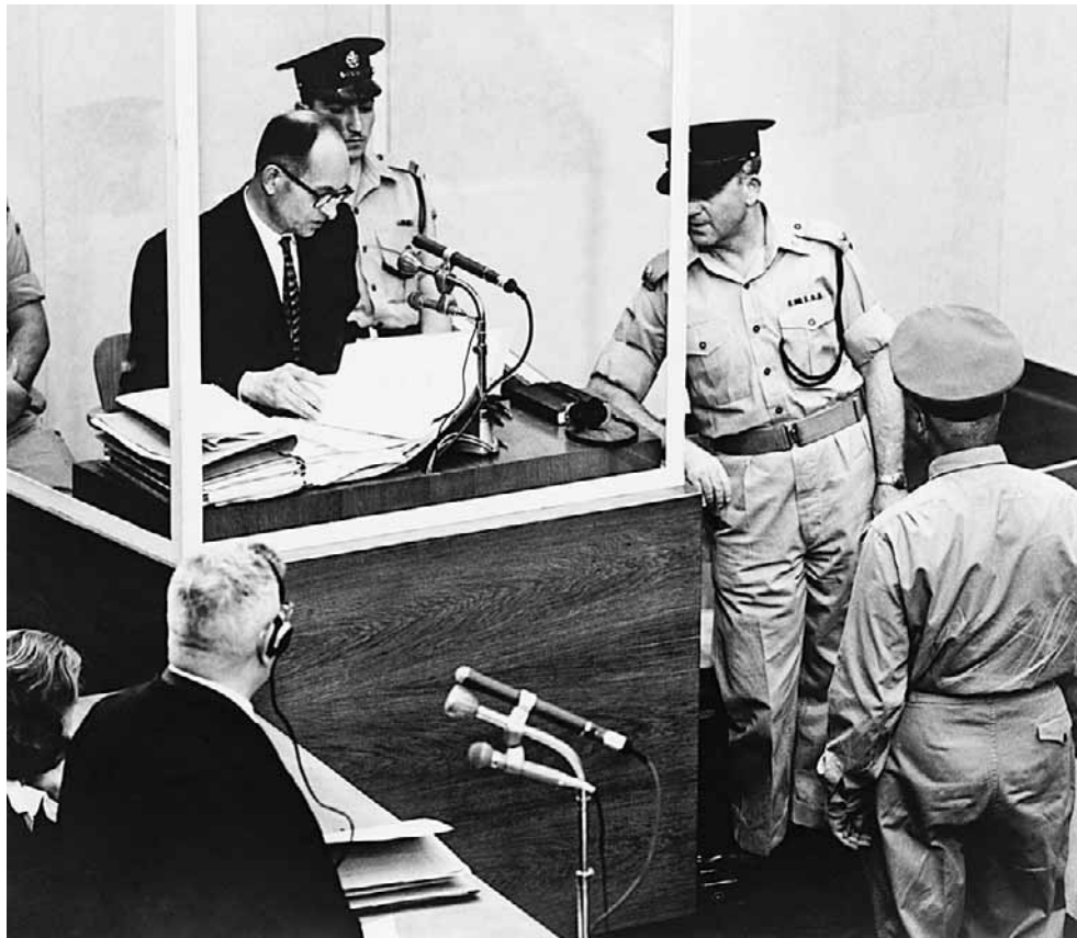
Na procesie było obecnych 700 dziennikarzy z całego świata. Wielu publicystów uznało proces za zbyt zbiurokratyzowany i niepokazujący całego zła Eichmanna