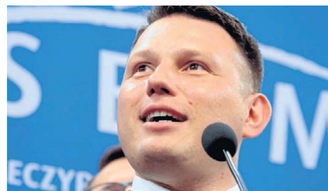
Sławomir Mentzen opublikował w serwisie X bezkompromisowy i niezwykle ostry wpis, uderzający w podstawowe założenia rządowego dokumentu

Podczas konferencji prasowej w Sejmie politycy Konfederacji – poseł Michał Wawer i rzecznik partii Wojciech Machulski – wezwali wszystkie ugrupowania do odwołania ze stanowiska Marty Cienkowskiej i zapowiedzieli rozpoczęcie zbiórki podpisów pod wnioskiem o wotum nieufności wobec minister kultury.