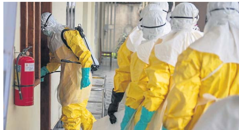
26 MAJA, AFRYKA. Zanotowano już ponad 200 ofiar śmiertelnych wirusa Ebola, która pojawił się w maju w Ugandzie i Demokratycznej Republice Kongo. Wpłyne to na ruch turystyczny i na piłkarski Mundial