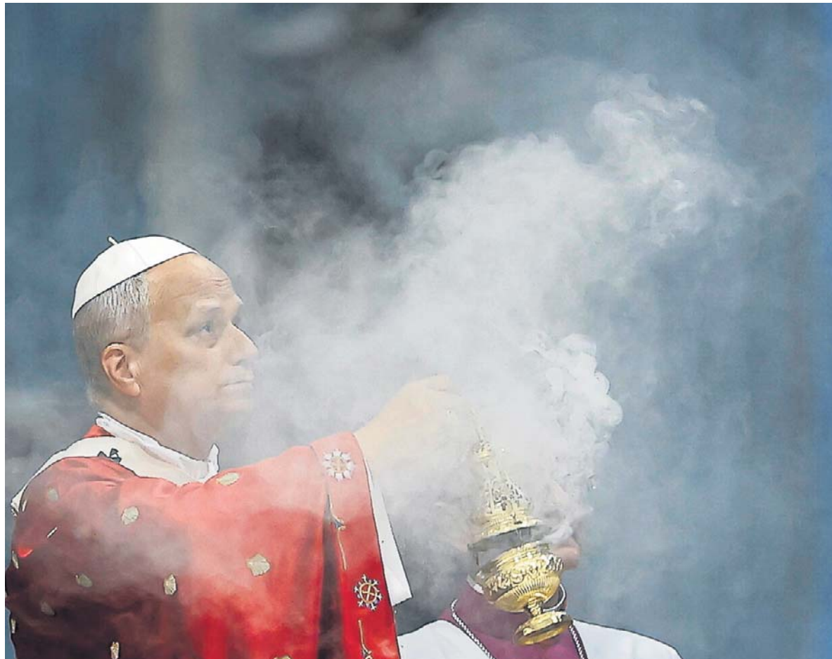
25 MAJA, WATYKAN. Leon XIV opublikował swoją pierwszą encyklikę. Dokument nosi nazwę „Magnifica humanitas” i jest w dużej mierze poświęcony sztucznej inteligencji. Papież podkreślił w niej, że nowa wirtualna rzeczywistość powinna być dostępna po równo dla wszystkich - nie tylko dla najbogatszych