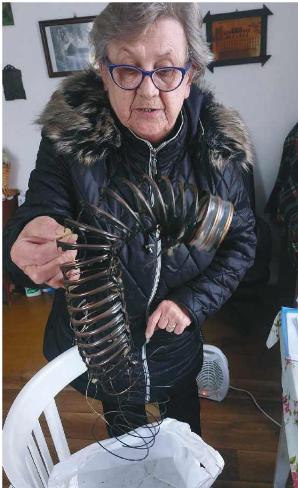
Elementy spalonego pieca

To jest wyrób medyczny. Używaj go zgodnie z instrukcją używania lub etykietą.