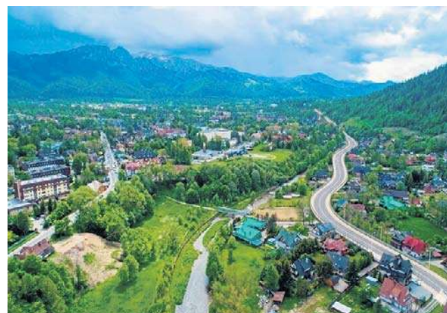
Wizualizacja północnej obwodnicy. Parametry drogi wskazują, że to będzie jedna z dróg lokalnych

Jestem zaskoczony, że wielu osobom, które były na konsultacjach, te projekty nie przeszkadzały. Wydaje się, że dochodzimy powoli do etapu, gdzie mieszkańcy w większości chcą nowej drogi w tym miejscu - dodaje wiceburmistrz. ©©