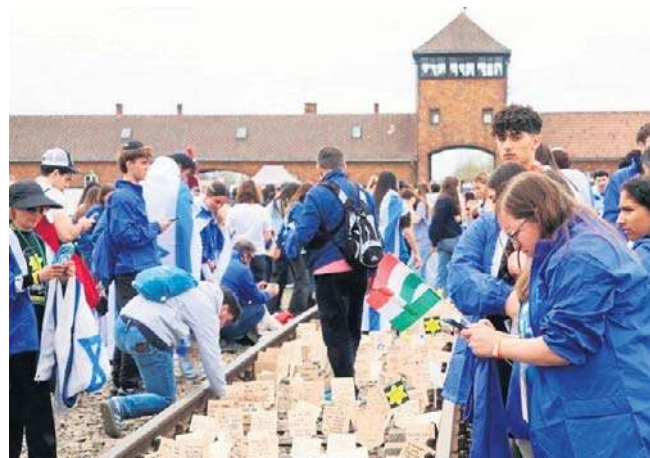
Podczas Marszu Żywych uczestnicy wspominali ofiary Zagłady

Między ruinami dwóch największych komór gazowych i krematoriów w byłym Auschwitz II Birkenau odbyła się główna ceremonia. W jej trakcie wspomniano ofiary Zagłady. ©©