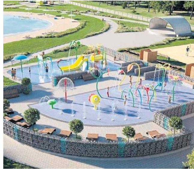
Tak ma wyglądać park wodny w Szerzynie. Obiekt ma być otwarty jeszcze w tegoroczne wakacje