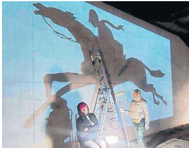
Autorkami graficznej interpretacji szkicu i muralu są artystki Sybilla Skaluba i Małgorzata Rozenau

Wartość całego projektu pod nazwą „Najodważniejszy z odważnych - budowa wieży widokowej im. rtm. Witolda Pileckiego” wynosi ok. 5 mln 280 tys. zł, z czego 2 mln 910 tys. zł pokryte zostało z dofinansowania w ramach Oświęcimskiego Strategicznego Programu Rządowego, którego gmina Chełmek jest jednym z uczestników.