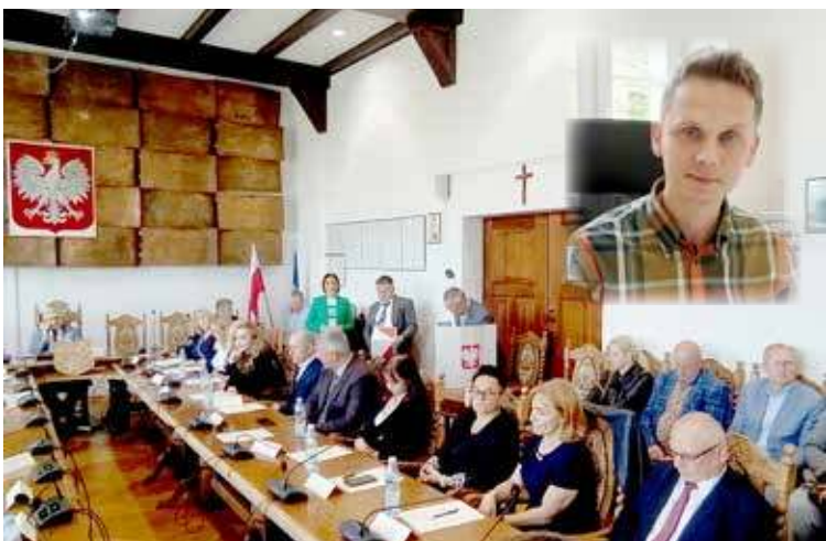
Decyzja ws. wniosku burmistrza ma zostać podjęta w trakcie sesji w środę

Jedną z kluczowych decyzji do podjęcia na sesji Rady Miejskiej w środę, będą zmiany w budżecie miasta na 2025 rok. Rok dopiero co się rozpoczął,