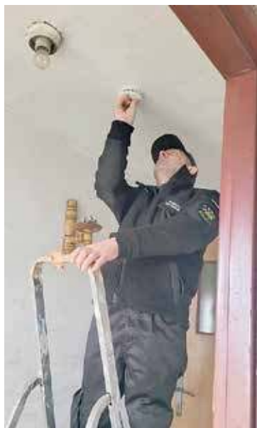
Akcja przeprowadzona została w ogromnej większości przez strażaków

– Program, oprócz tradycyjnych działań edukacyjno-profilaktycznych, wprowadził innowacyjną koncepcję domowych testów bezpieczeństwa pożarowego. Strażacy Ochotniczych Straży Pożarnych, po przeszkoleniu i wyposażeniu w specjalne listy, odwiedzali mieszkania, dokonując kompleksowej oceny bezpieczeństwa pożarowego. Co ważne, usługi świadczone w ramach programu były całkowicie bezpłatne – przyznaje gen.