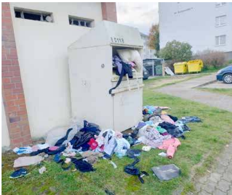
To, że na przestrzeni ostatnich miesięcy pojawia się problem z tekstyliami nie trzeba nikogo przekonywać

Ministerstwo Klimatu i Środowiska przygotowało katalog dobrych praktyk, a więc spis pomysłów jak zorganizować selektywne zbieranie odpadów tekstylnych w gminach. Specjaliści od tekstyliów sugerują