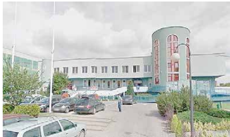
Urząd Skarbowy w Goleniowie

Dla wszystkich, którzy chcą załatwić sprawę w siedzibie urzędu, koniecznie trzeba pamiętać, aby wcześniej umówić wizytę. Wówczas można zostać