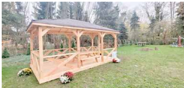
Granty sołeckie mogą zostać przeznaczone na niewielkie zadania inwestycyjne

winno zawierać: Wersję papierową zgłoszenia podpisaną przez sołtysa wraz z ewentualnymi załącznikami. Zgłoszenia należy złożyć w Sekretariacie Urzę-