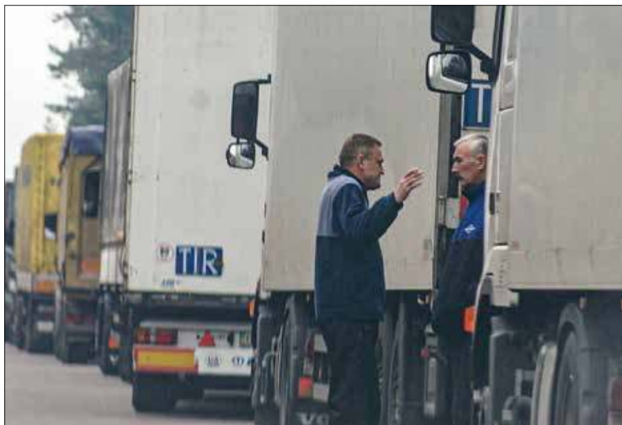
■ Od kilku miesięcy litewskie ciężarówki są zatrzymane po stronie białoruskiej