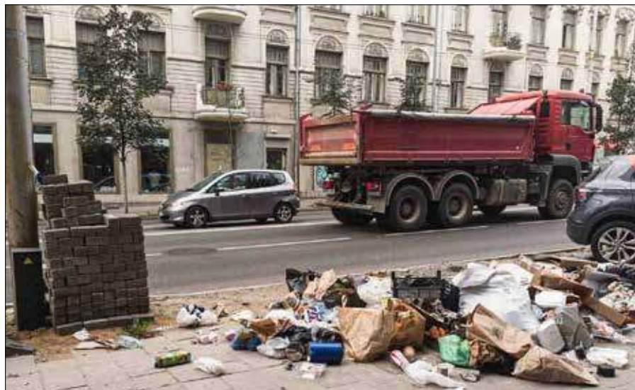
Śmieci wcześniej czy później szkodzą środowisku, czyli — człowiekowi...

Opr. A.K. na podst. mat.pras., Lietuvos draudimas