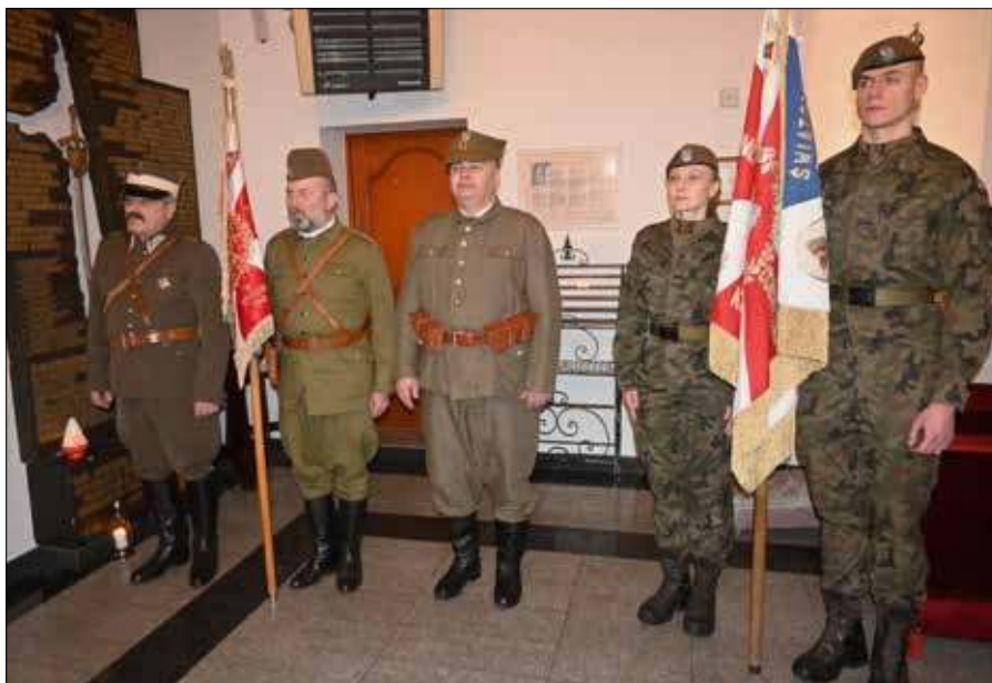
■ Pocztę sztandarową obecne na uroczystościach