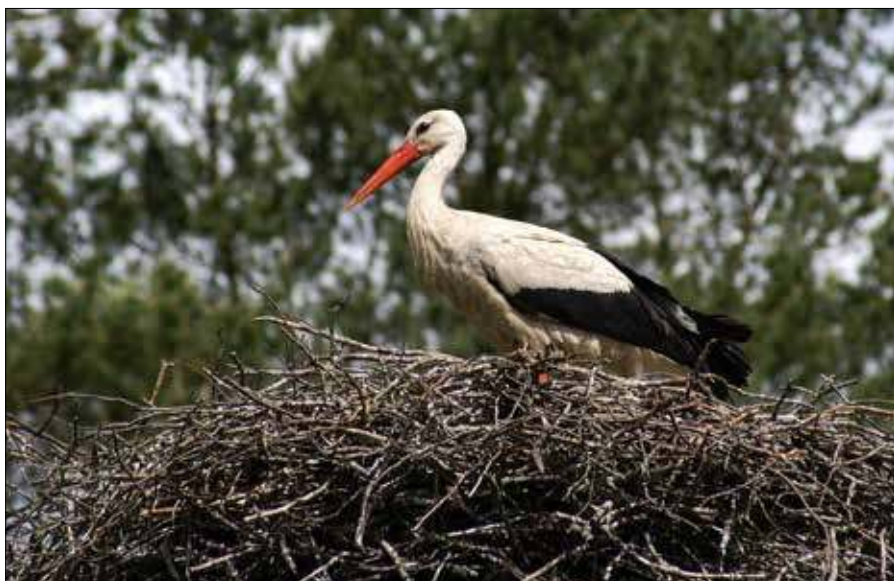
Bociany nazywane są towarzyszami człowieka, ponieważ lubią zakładać gniazda w pobliżu gospodarstw