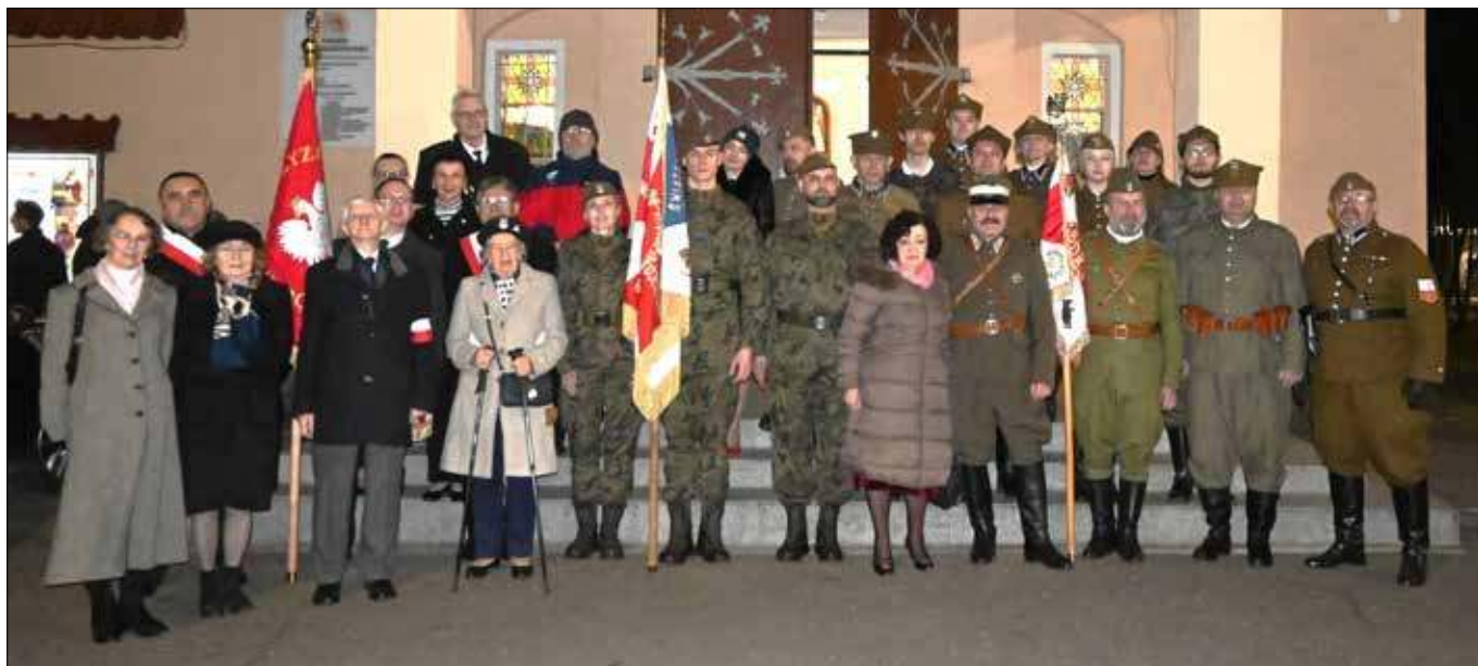
Uczestnicy sobotniej uroczystości przed wejściem do kościoła