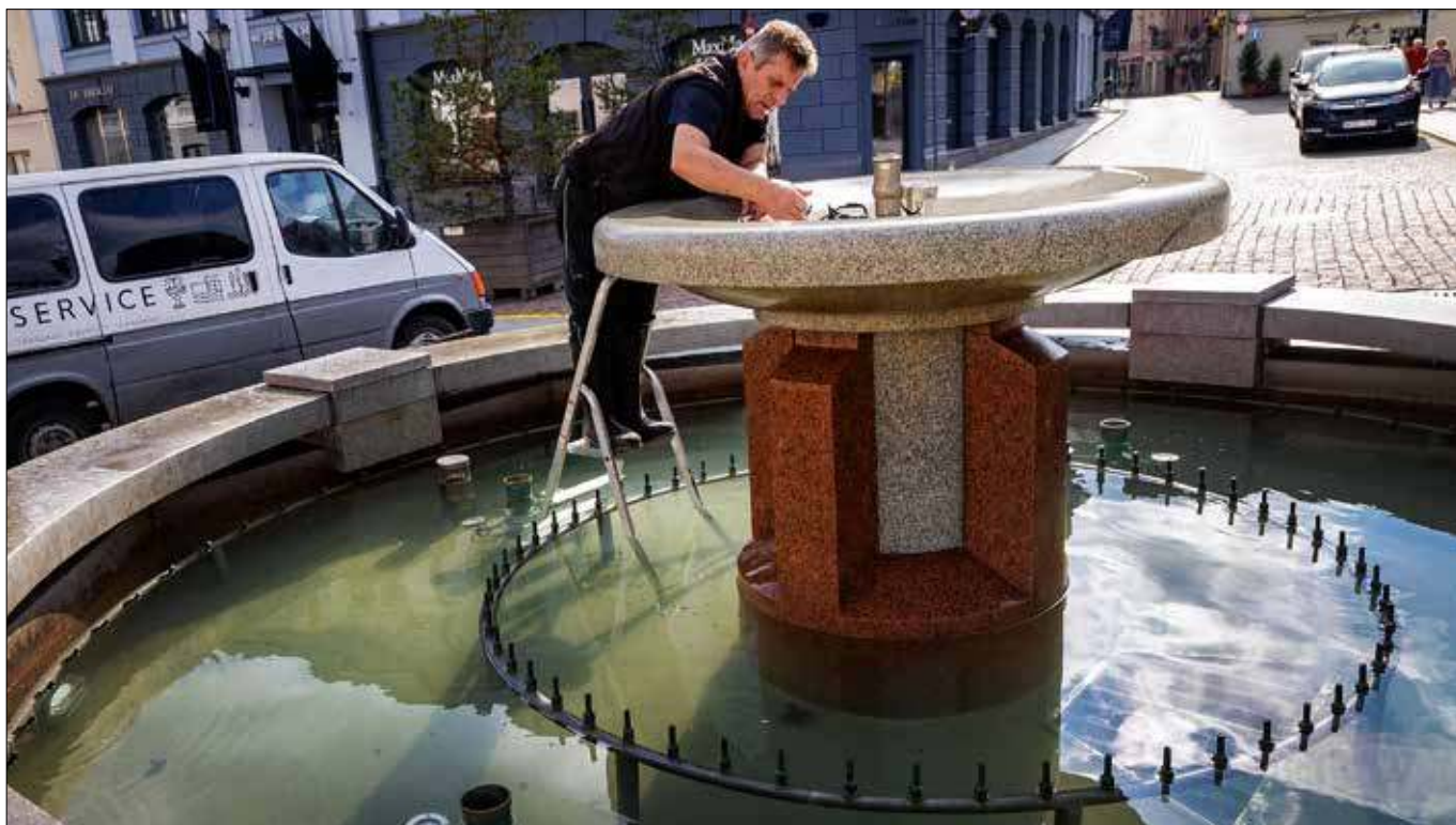
■ Przygotowania do gorącego lata – fontanna też musi być w formie