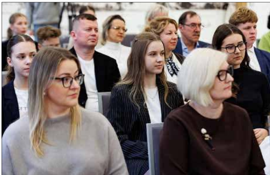
Zaproszenie do dołączenia do rady otrzymali uczniowie wszystkich gimnazjów z polskim językiem nauczania

— Od pewnego czasu zauważyłam, że wśród młodzieży stopniowo zanika polskość, poprawna polszczyzna. Na przykład, jadąc autobusem, dostrzegam, że postronni ludzie nie orientują się, że rozmawiamy po polsku ani że jesteśmy Polakami. Jakos musimy temu zaradzić, mam już nawet pewną wizję. Wymiana uczniowska z młodzieżą z Polski byłaby dla nas niezwykle wartościowym doświadczeniem. Dzięki takiej współpracy moglibyśmy podszlifować nasze