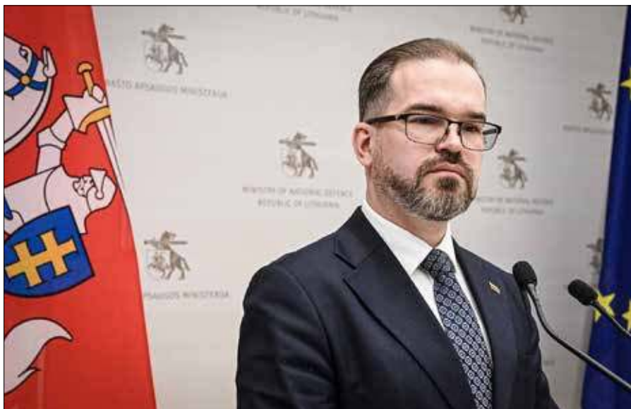
Robertas Kaunas, minister ochrony kraju RL.