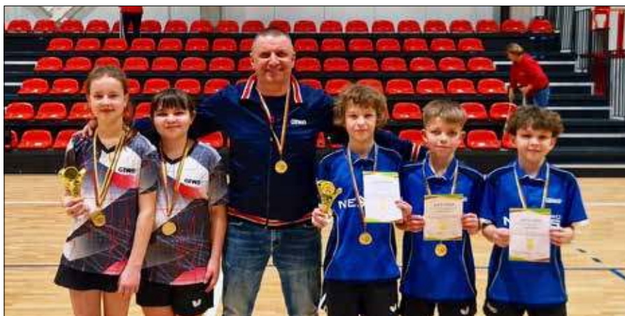
Rejon wileński reprezentowały dzieci Szkoły Sportowej w Niemenczynie

Drużyna dziewcząt też wygrała wszystkie spotkania, mimo że grały tylko dwie zawodniczki i w każdym meczu miała minus jeden punkt. Dziewczęta pokazały charakter i zagrały do-