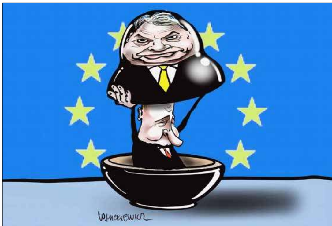
■ Rys. Władysław Mickiewicz