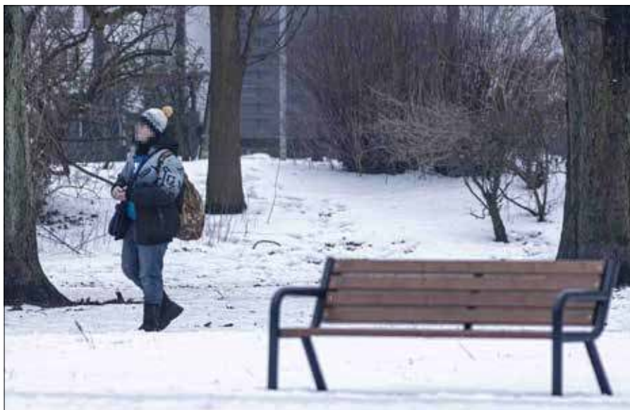
Ekspertka zaznacza, że poczucie obcości u młodych często wynika nie z samych różnic, co z braku otwartego kontaktu

„Młodzi ludzie często czują się niezrozumiani przez rodziców lub