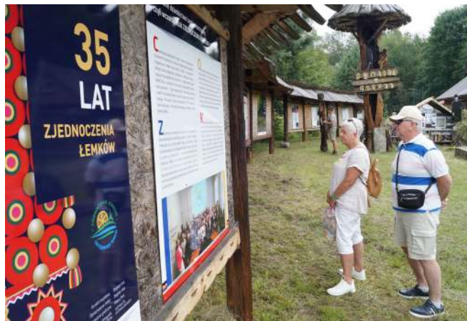
«Лемківська ватра» в Ждині

Важливо зазначити, що ОЛ управляє Центром культури імені Богдана-Ігоря Антонича в Горлицях, де організовує, зокрема, заходи для дітей. Там теж проводять