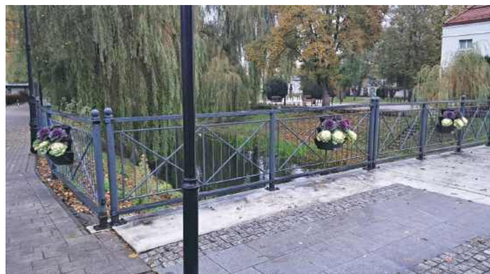
Zniknęły wrzosy i kapusty pięknie zdobiące Most Świętojański

DOM POGRZEBOWY Kraszewski Pułtusk ul. Kościuszki 78 www.kraszewski.info 501634440 236922000