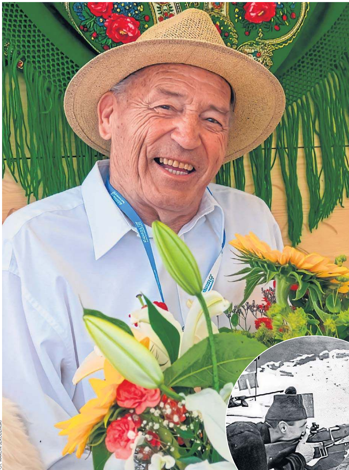
W 2024 roku podczas Pikniku Olimpijskiego w Kościelisku huczne urodziny obchodził Józef Gąsienica-Sobczak, 4-krotny olimpijczyk, przez lata czołowy biathlonista świata

2-krotny mistrz Polski w narciarskim biegu sztafetowym 4 x 10 km (1967, 1969), 4-krotny wicemistrz kraju: na 30 km (1962)