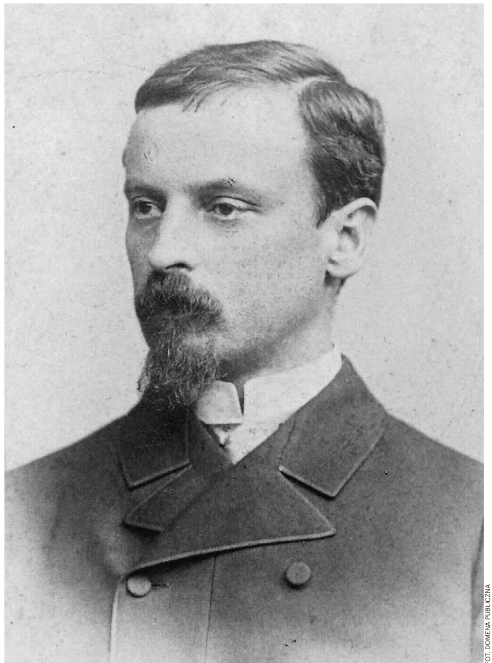
Helena Modrzejewska. Zdjęcie z okresu, gdy trwał jej romans z Henrykiem Sienkiewiczem (pisarz na fotografii z ok. 1885 r.)