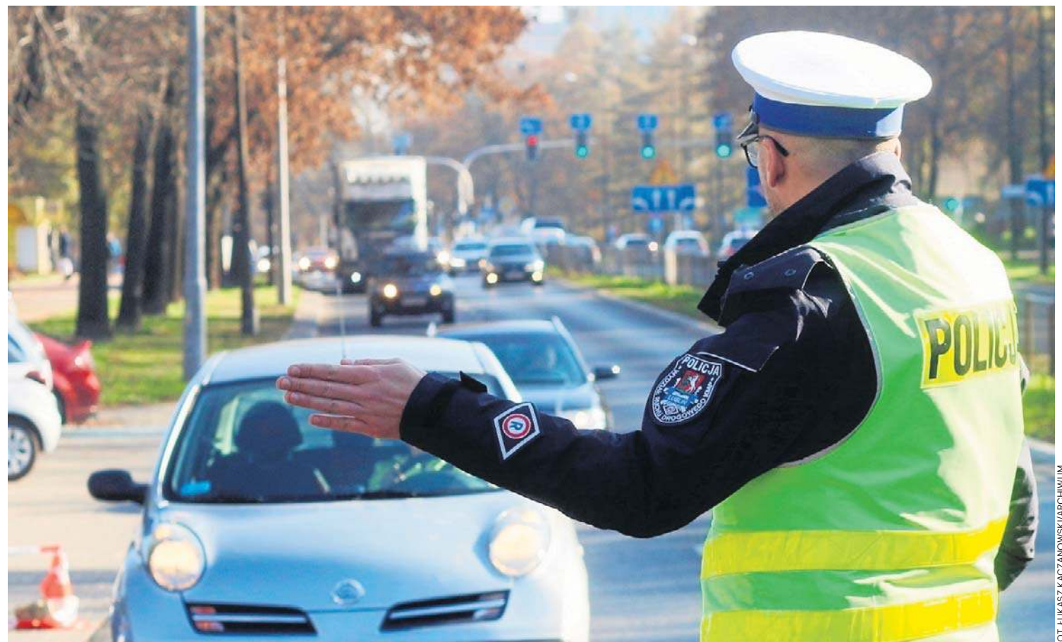
Dopuszczalne prędkości na drogach w Polsce to: 50 km/h w terenie zabudowanym, 90 km/h na drogach jednojezdniowych, 100-120 km/h na drogach ekspresowych, 140 km/h na autostradach. Zawsze należy jednak zwracać uwagę na znaki drogowe

W przypadku kierujących posiadających prawo jazdy krócej niż rok i limit 20 punktów karnych, konsekwencje wyciągane są, kiedy zdobywa minimum 21 punktów, czyli przekracza limit. W ich przypadku starosta wydaje decyzję o cofnięciu uprawnień. Oznacza to ponowne przejście całej procedury ubiegania się o prawa jazdy. Najpierw konieczny jest kurs, a później zdanie egzaminu teoretycznego i praktycznego.