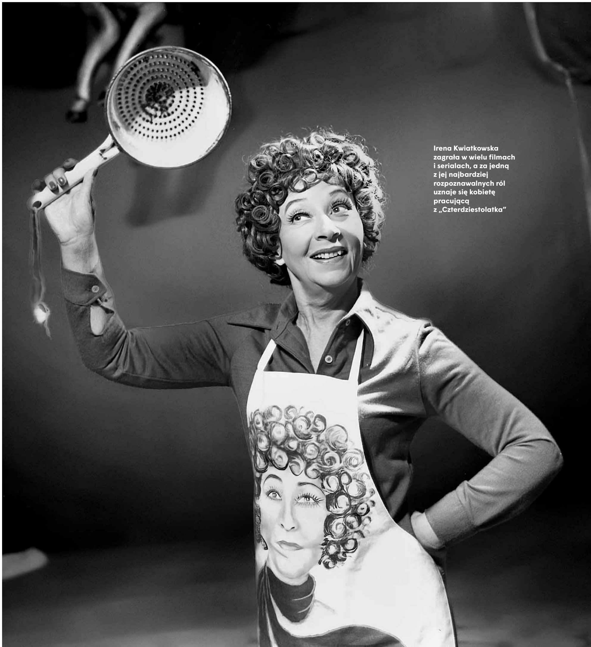
Irena Kwiatkowska zagrała w wielu filmach i serialach, a za jedną z jej najbardziej rozpoznawalnych ról uznaje się kobietę pracującą z „Czterdziestolatka”

● Aktorka przyszła na świat 17 września 1912 roku w Warszawie. Odeszła w marcu 2011 roku, dożyła niemal 100 lat ● Dyplom aktorski uzyskała w 1935 roku w Państwowym Instytucie Sztuki Teatralnej. Zadebiutowała jeszcze przed wojną w „Cyuliku Warszawskim” ● Brała czynny udział w powstaniu warszawskim