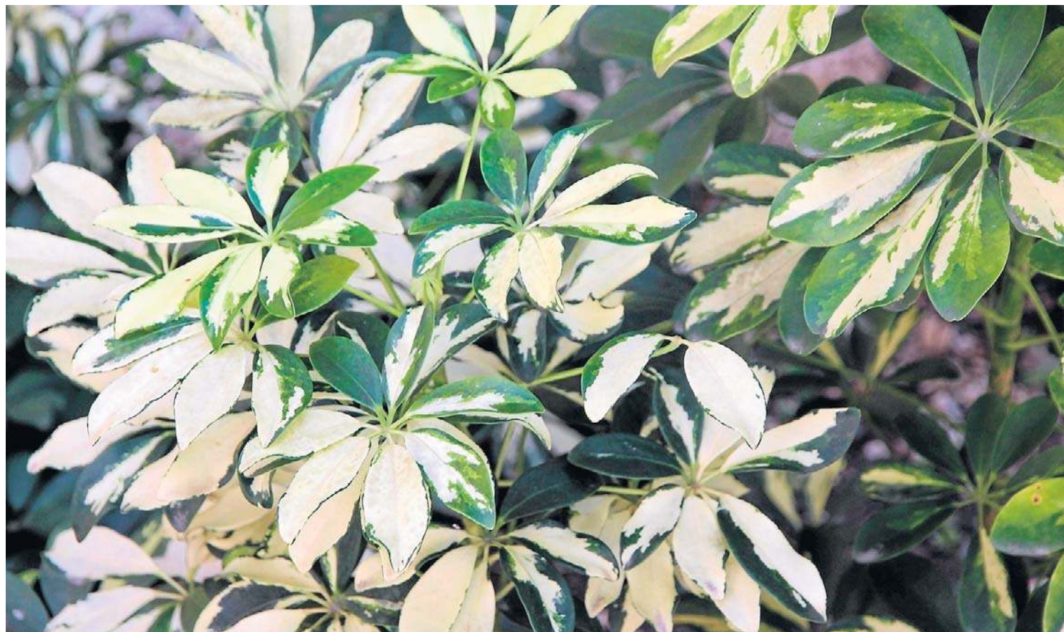
Duże, dłoniaste liście, przypominające pokrojem oryginalne parasolki, są największą ozdobą szeffler

Szefflera parasolowata i drzewkowata to rośliny dość wytrzymałe na różne warunki