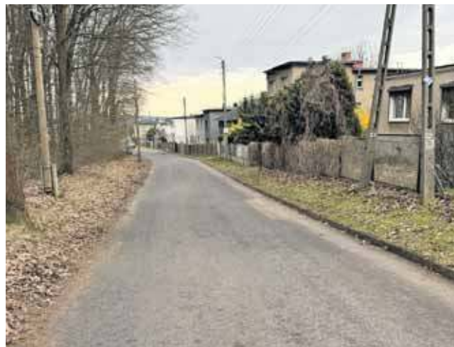
Chodzi przede wszystkim o poprawę widoczności i zwiększenie bezpieczeństwa w rejonie wyjazdu z nowego osiedla na ul. Żeromskiego w dzielnicy Repty Śląskie

Zamiast restrykcyjnych rozwiązań infrastruktural-