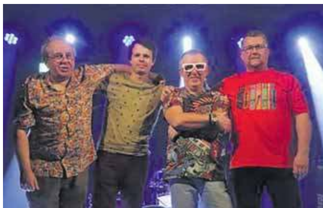
Koncert w TCK odbędzie się 24 kwietnia