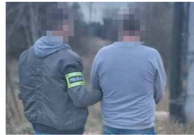
Mężczyzna przyznał się do winy