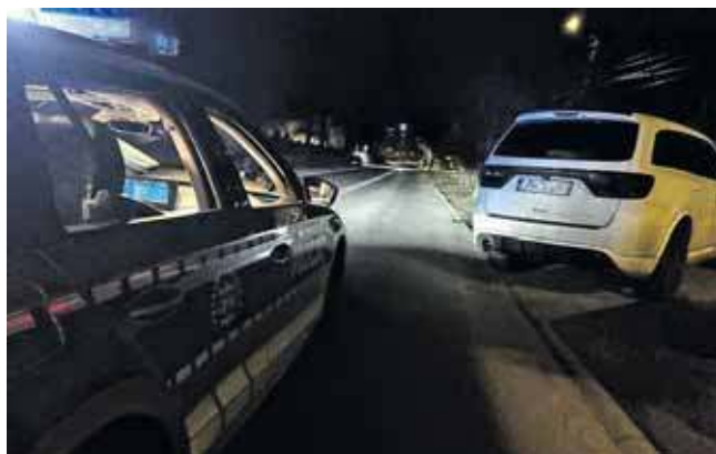
Samochód został skradziony w lutym w Katowicach

Pojazd został zauważony na ul. Gliwickiej. Funkcjonariusze zatrzymali go do kontroli, podczas której szybko potwierdziły się przypuszczenia zgłaszających. Za