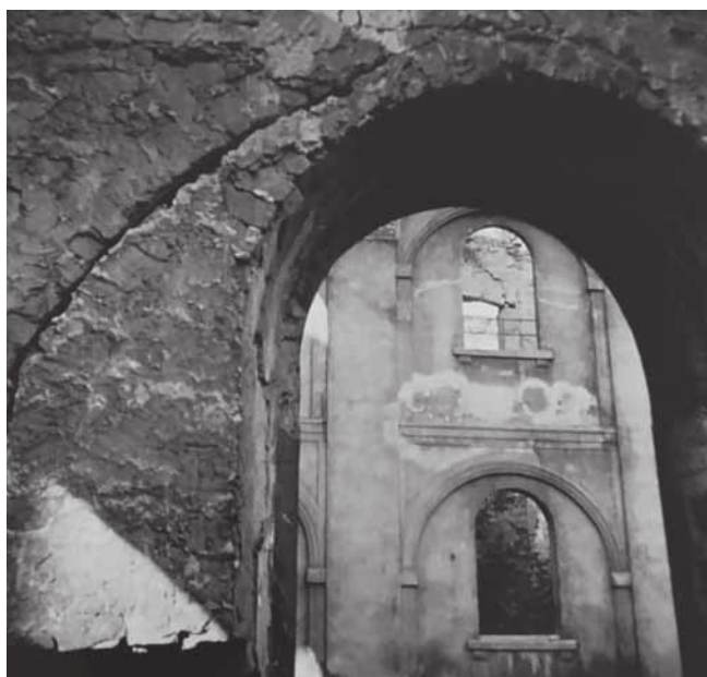
Zamek był przebudowywany przez kolejnych właścicieli

Pod koniec lat 50. minionego wieku w parku w Świerklańcu stały jeszcze ruiny starego zamku. Niestety, niebawem wysadzono je w powietrze.