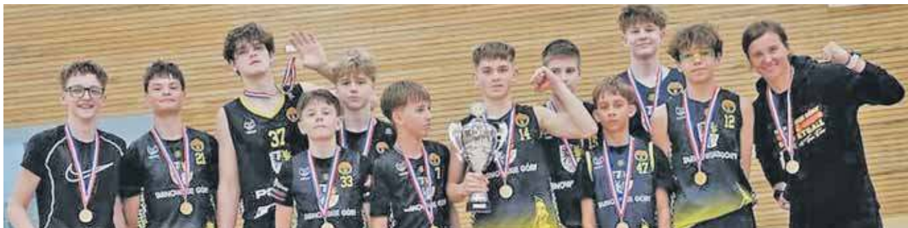
Drużyna U14 KKS Tarnowskie Góry wygrała HNBT – Holland Nordic Basketball Tournament