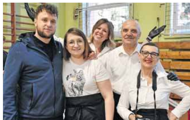
Wolontariusze zrobili dobrą robotę!

Organizatorzy byli przygotowani nawet na 250 gości, choć przyszło ich mniej. Dla