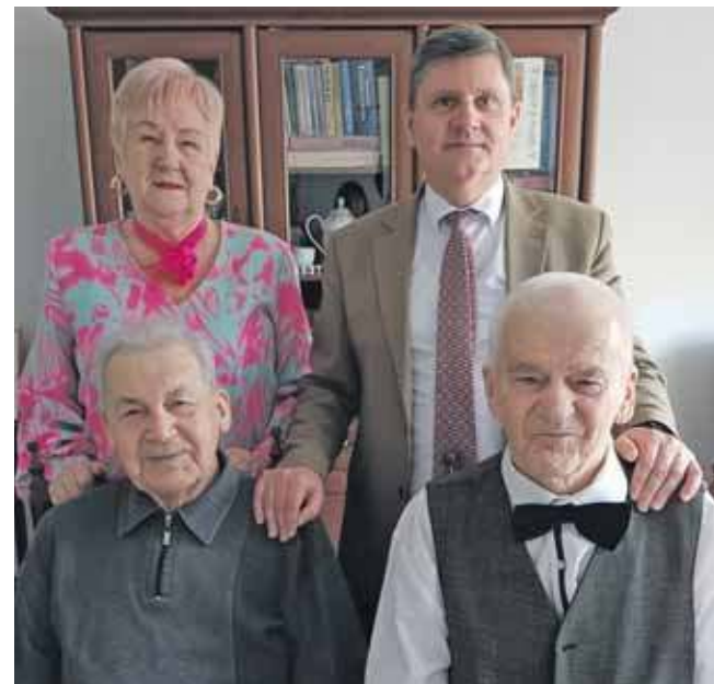
Złoci jubilat z gośćmi