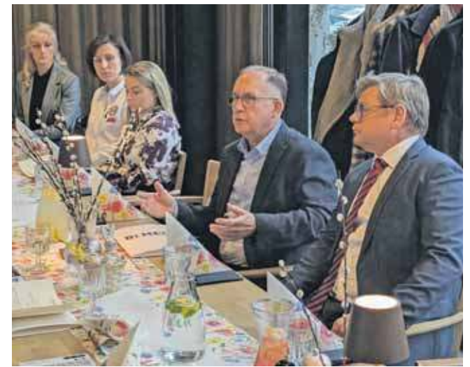
Porozumienie ma dotyczyć bezpłatnych konsultacji chorych wymagających przyspieszonych zabiegów chirurgicznych