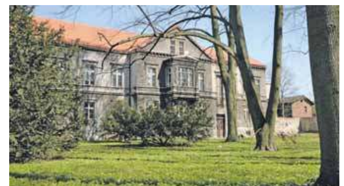
W 1959 roku w głównym gmachu byłego zarządu dóbr otwarto szkołę odzieżową

Budynek Plastyka ma bogatą historię. – Folwark z XVII wieku, XVIII-wieczny pałac, XIX-wieczny biurowiec czy może szkoła z XX stulecia? Wszystkie twarze Karłuszowca są prawdziwe, ale która jest najciekawsza? Te tajemnice poznacie podczas spotkania – zachęcają organizatorzy. Wstęp jest wolny.