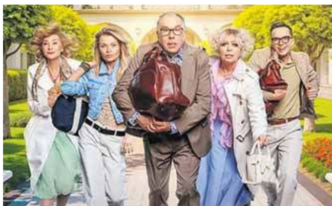
Spektakl zobaczymy w maju

Tak w skrócie wygląda fabuła sztuki teatralnej „Erotic-Zdrój, czyli sanatorium nie