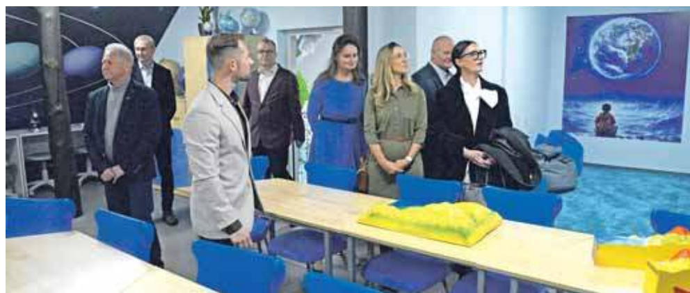
W ubiegłym roku oddano Zieloną Pracownię Podniebne Laboratorium w Szkole Podstawowej im. Królowej Jadwigi w Nowym Chechle

Konkurs „Zielona Pracownia” od lat wspiera rozwój świadomości ekologicznej dzieci i młodzieży. Dzięki programowi uczniowie mają możliwość poznawania zagadnień związanych z ochroną środowiska w praktyczny i atrakcyjny sposób.