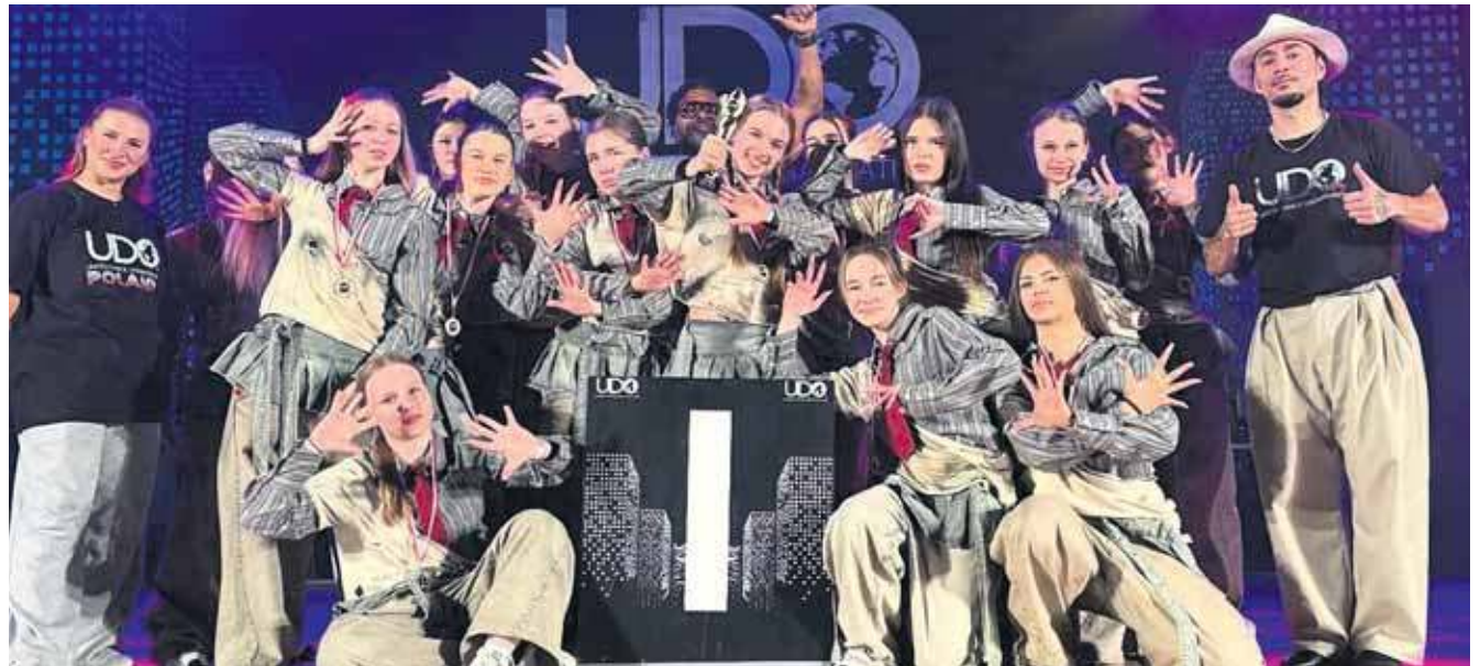
Grupa La Foule została mistrzem Polski

– Jesteśmy niesamowicie dumni z całej ekipy – dziękujemy za pracę, zaangażowanie i emocje, które zostawiliście na scenie – podkreślają przedstawiciele MTJ Dance Academy. Wyjazd na mistrzostwa wiąże się ze sporymi kosztami, dlatego tancerze szukają sponsorów, którzy pomogą spełnić ich marzenia. (ESP)