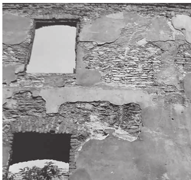
Szkoda, że nie pozostały chociaż ruiny zamku...