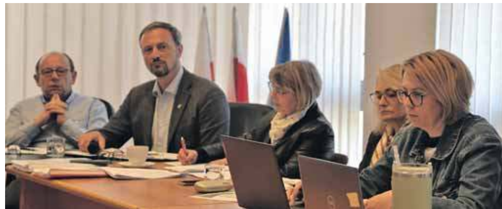
Władze gminy nie odpuszczają i odwołują się od decyzji kuratora

Oceniono, że obie szkoły zapewniają uczniom bardzo dobre warunki nauki. Ta w Potępie jest mniejsza, kameralna, a przez to bar-