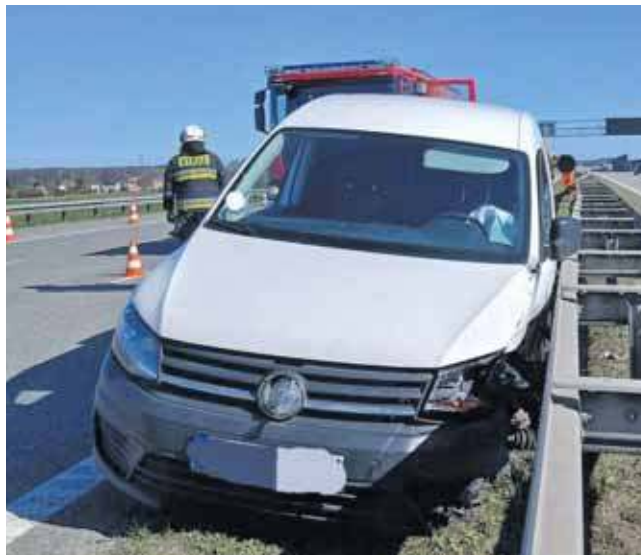
Kierowca Volkswagena trafił do szpitala

Kierowca stracił panowanie nad Volkswagenem, zjechał na pas zieleni i uderzył w bariery energochłonne. Mężczyzna był nieprzytomny, ale na szczęście oddychał. Strażacy udzielili mu pierwszej pomocy i przekazali zespołowi ratownictwa medycznego. Ten zabrał go