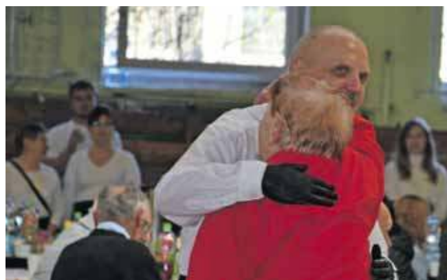
Liczyła się życzliwość i to, by w święta nikt nie musiał być sam

Po raz pierwszy w Tarnowskich Górach zaproszono potrzebujących na śniadanie wielkanocne w samą wielkanocną niedzielę, 5 kwietnia. Śniadanie zorganizowała Tarnogórska Szafa Społeczna, zaangażowało się też Dobre Stowarzyszenie Przedsiębiorców i tarnogórski samorząd. Odbędzie się w sali gimnastycznej Szkoły Podstawowej nr 9 przy ul. Sobieskiego.