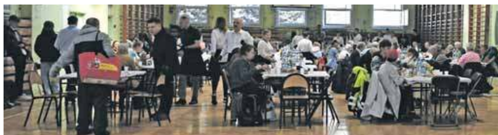
Dla nikogo nie zabrakło miejsca

Dla pomysłodawców przedsięwzięcia bardzo ważne było, by śniadanie przygotować właśnie w Wielkanoc, nie kilka dni wcześniej, bo i z takimi sugestiami się spotykali. Tyle że istotą sprawy było nie tylko samo zjedzenie świątecznych potraw, wśród których były m.in. tradycyjny żurek, biała