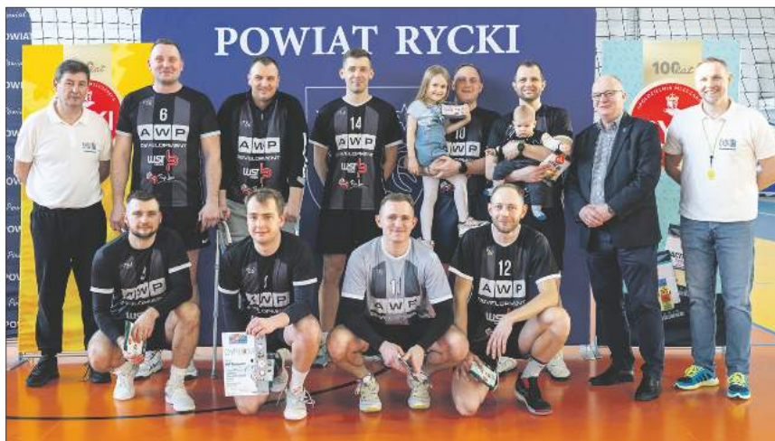
AWP Development, mistrzowie sprzed roku, w tegorocznej edycji zajęli 4 miejsce