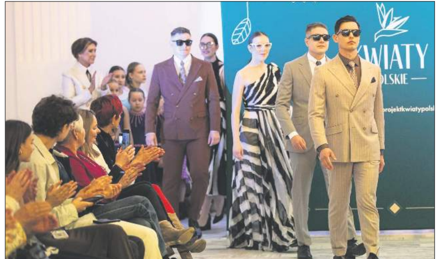
W rolę modeli wcielili się studenci-podchorążowie LAW w Dęblinie