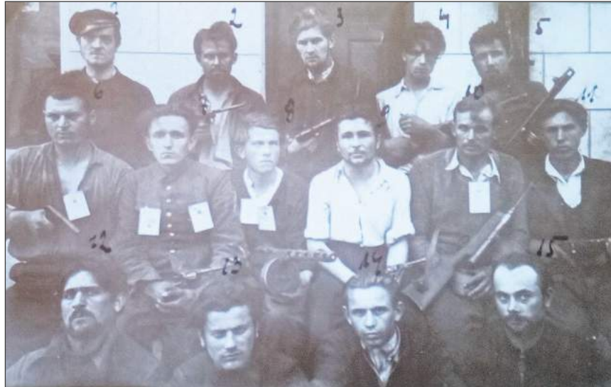
Na terenie dawnego powiatu garwolińskiego głównymi podsądnymi byli partyzanci mjr. Mariana Bernaciaka „Orlika”.

- Korzystali z wzorców niemieckich w okresie okupacji i przepisów prawa II Rzeczypospolitej, które zmienili tak, by jak najwięcej czynów było za-