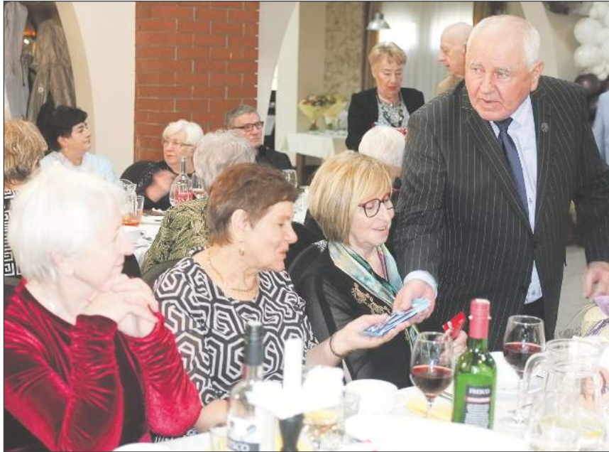
❖ Każda z pań otrzymała od męskiej części Związku słodki prezent w postaci czekolady