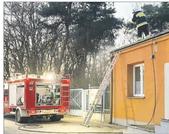
Zadowolone z pomocy strażaków są też gospodynie ze Swat. Druhowie oczyścili dach siedziby koła

- Cała moja nadzieja była w strażakach. Szybko zainterweniowali, podobnie jak gmina. Dziś gniazdo stoi pięknie i czeka na bociany. Nie mogę się doczekać, kiedy przylecą do swojego „nowego” domu - przyzna-