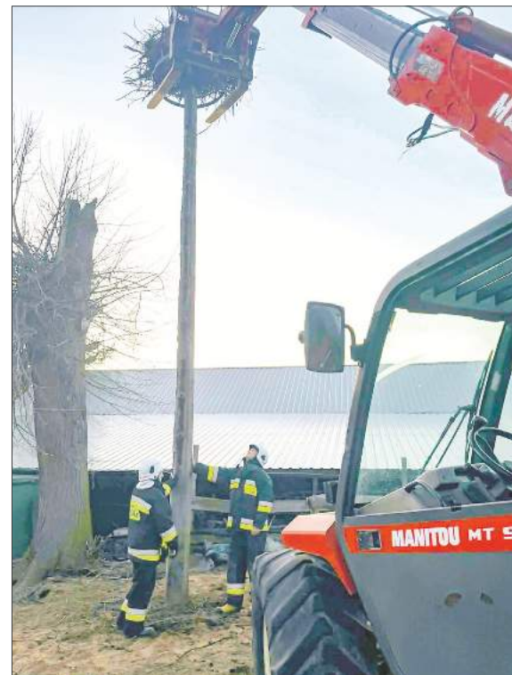
W montażu gniazda na słupie pomógł wysięgnik