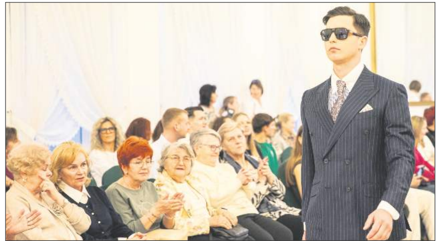
To było Święto Kobiet w otoczeniu eleganckiej mody i przystojnych modeli (fot. Projekt Kwiatki Polskie/Marta Serafin)

Prezentowane podczas pokazu mody kreacje damskie to Carla Ruiz Costura, hiszpańska marka odzieżowa znana z szykownych i perfekcyjnie skrojonych projektów podkreślających indywidualność i siłę kobiecego stylu (fot. Projekt Kwiatki Polskie/Marta Serafin)