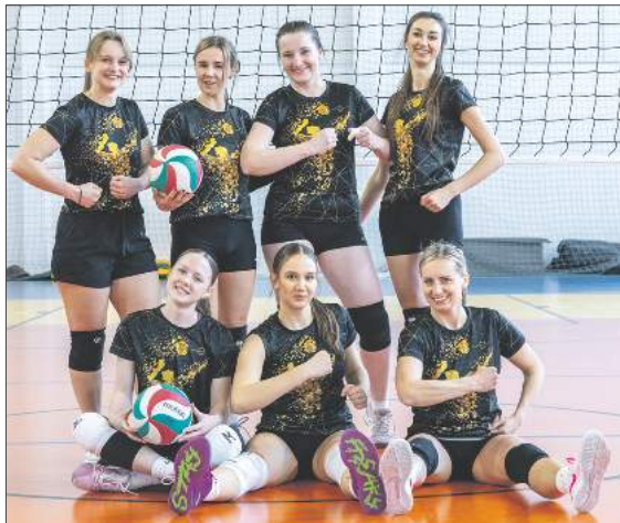
Ubiegłoroczne mistrzyni - DD Team - w tym roku zajęły 4 miejsce

Po zakończeniu rywalizacji pań na parkiet weszli panowie, żeby powalczyć o medale i nagrody. W meczu o trzecie miejsce AWP Development, czyli mistrzowie sprzed roku, grali z Powiślakiem Końskowola. Dwie pierwsze partie pewnie wygrali siatkarze z Końskowoli - do 21 i 23 - i wydawało się, że to spotkanie rozstrzygnie się w trzech setach. Ale w trzeciej partii przebudzili się mistrzowie sprzed roku i wygrali ją do