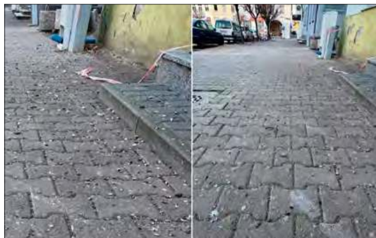
Chodniki wokół krapkowickiego rynku wymagają posprzątania.

Od kilku dni mieszkańcy Krapkowic zwracają uwagę na zaniedbania w porządkach na rynku miasta. Pomimo że prace porządkowe są prowadzone w innych częściach miasta, „serce Krapkowic” wygląda niestety fatalnie. Sytuacja dotyczy zwłaszcza chodników,