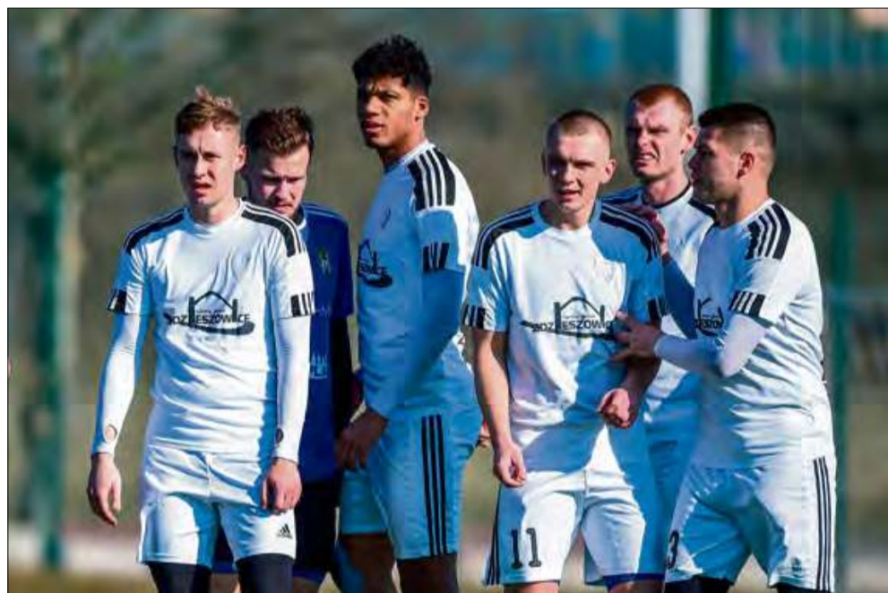
Po wygranej z Porawiem „Zdzichy” znalazły się w najlepszej czwórce pucharowych rozgrywek.

– Cieszymy się z wygranej i awansu, bo już nie mogliśmy się doczekać gry o stawkę. Z Więszycami zagraliśmy bardzo dobrą pierwszą połowę, a szybko zdobytymi bramkami ustawiliśmy sobie ten mecz pod nas. Po przerwie lepiej prezentowali się nasi rywa-