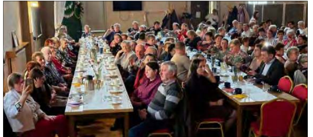
Tłumy gości przybyły na Festiwal Pączków w Strzeleczkach.

Najśladsze święto w gminie Strzeleczki już za nami. We wtorek 25 lutego odbył się Festiwal Pączków. To była impreza, która przyciągnęła tłumy ludzi.