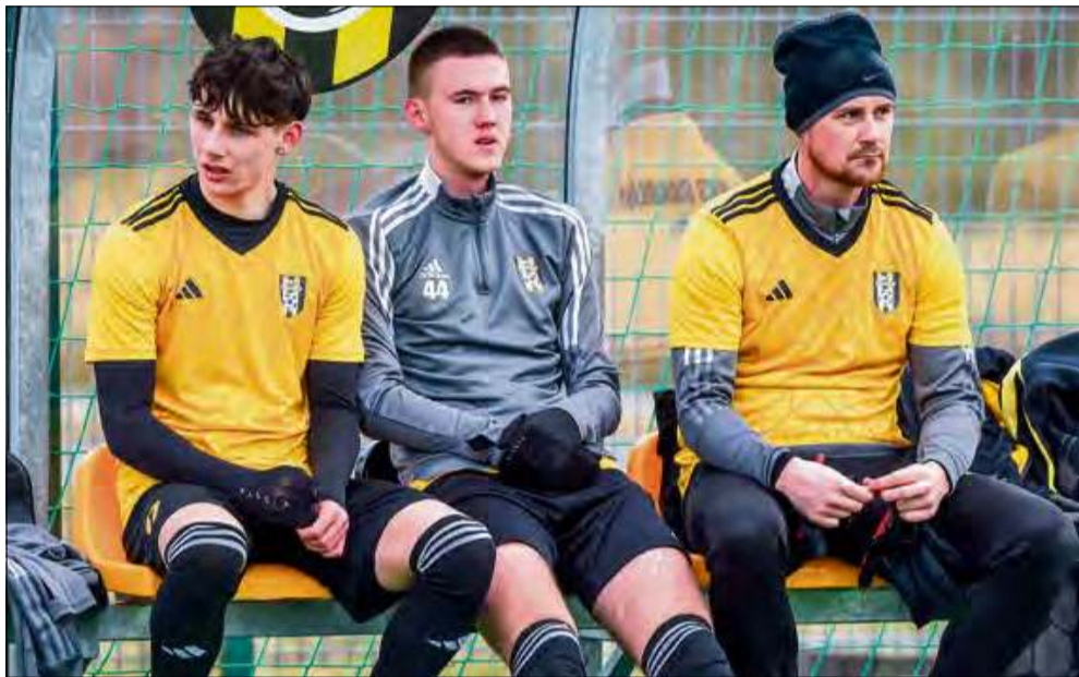
Piłkarze gogolińskiego MKS-u zakończyli swoją pucharową przygodę.