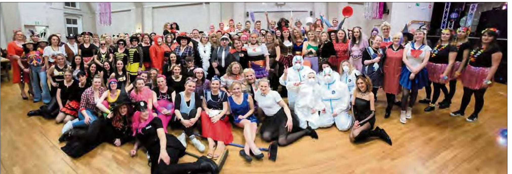
Na sali bawiło się 138 pań. Frekwencja dopisała i pozytywnie zaskoczyła organizatorów imprezy.

W piątek 28 lutego w Strzeleczkach odbył się babski comber. Ta kultowa impreza jak co roku przyciągnęła tłumy pań.