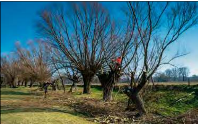
Głowienie wierzby chroni je przed łamaniem.

Miniony weekend upłynął na Starej Odrze w Straduni pod znakiem intensywnych prac na rzecz ochrony lokalnego krajobrazu. Fundacja Siedlisko Silesia zgromadziła przyrodników i aktywistów, którzy wspólnymi siłami dokonali głowienia wierzby na terenie użytku ekologicznego Stara Odra. Wydarzenie odbyło się w ramach Opolskiego Dnia Wierzby Głowiastej.