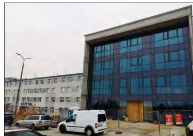
Dofinansowanie w kwocie ponad 17 milionów złotych przyznano na kolejny etap rozbudowy krapkowickiego szpitala.

Władze powiatu przywiązują dużą wagę do polepszenia opieki długoterminowej w zarządzanych przez siebie placówkach medycznych.