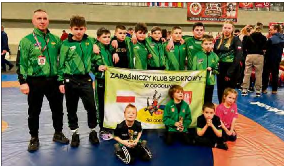
Tak prezentowała się kadra ZKS-u Gogolin na turnieju w Trzyńcu.

Sporo działo się na zapaśniczych matach z udziałem zawodników z naszego regionu. Dwa turnieje oraz udział w zgrupowaniu kadry Polski to tylko wycinek tego, czym ostatnio zajmowali się zawodnicy Zapaśniczego Klubu Sportowego w Gogolinie.