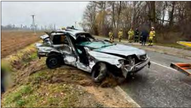
Do zdarzenia doszło na prostym odcinku drogi.

Do tragicznego zdarzenia doszło w powiecie strzeleckim. W wypadku drogowym zginął 20-letni kierowca hondy. Wraz z nim podróżowało jeszcze dwóch innych pasażerów. To młodzi mężczyźni z powiatu krapkowickiego.