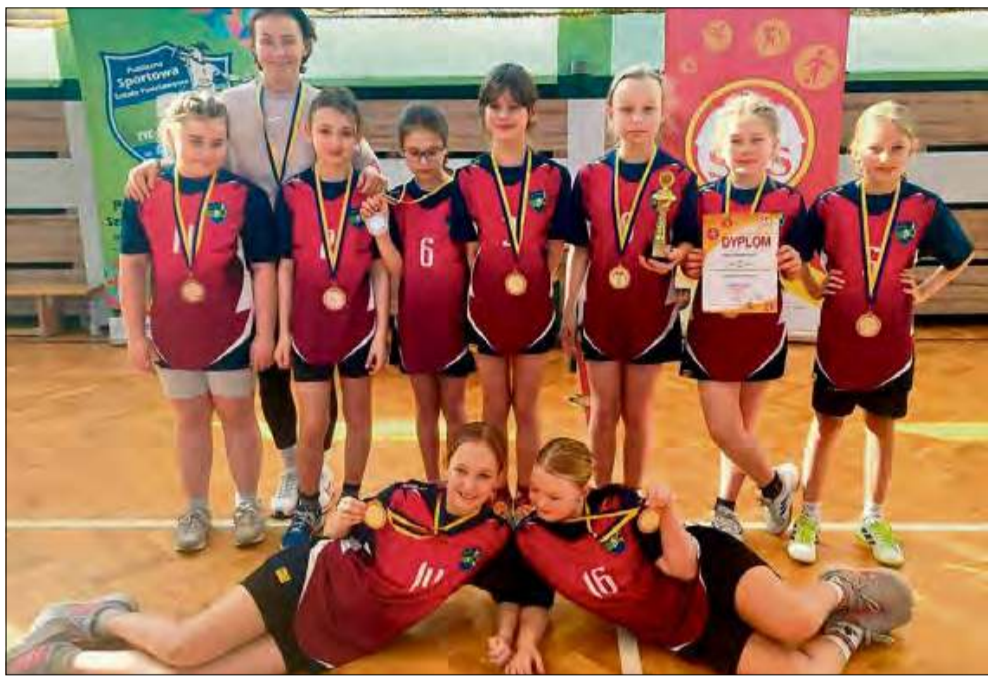
Drużyna dziewcząt z PSP nr 5 w Krapkowicach stanęła na wysokości zadania, rywalizując z najlepszymi zespołami z regionu.

W ostatnich dniach na sportowej arenie rozegrano finał wojewódzki w grze w dwa ognie w ramach Igrzysk Dzieci (rocznik 2014 i młodszy). Wśród najlepszych drużyn województwa znalazły się reprezentacje Publicznej Szkoły Podstawowej nr 5 w Krapkowicach, które zaprezentowały się znakomicie, zdobywając III miejsca zarówno w kategorii dziewcząt, jak i chłopców.