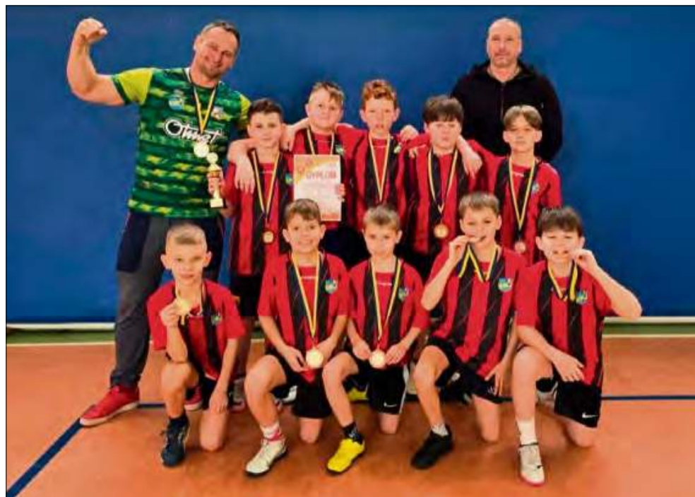
Drużyna chłopców z Krapkowic zajęła III miejsce w wojewódzkim finale w dwa ognie.

Nie mniej imponująco zaprezentowali się chłopcy z Krapkowic, którzy w swojej kategorii rywalizowali z drużynami z Jemielnicy,