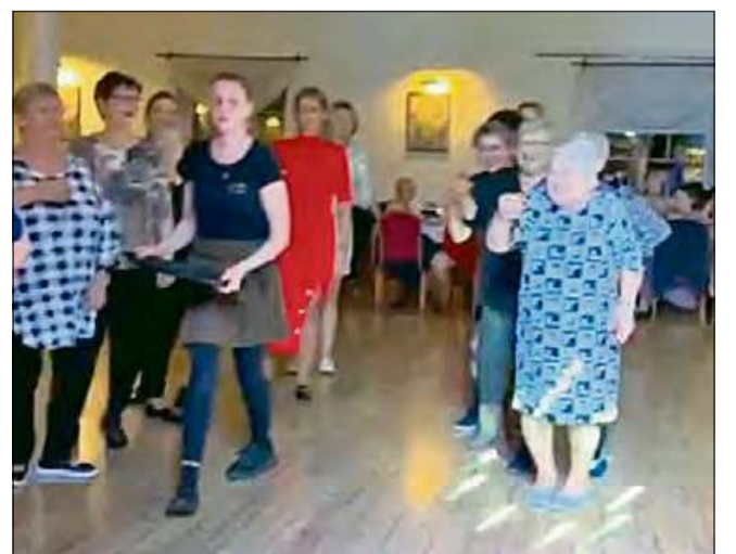
Gorąca zabawa pełna dobrej muzyki.