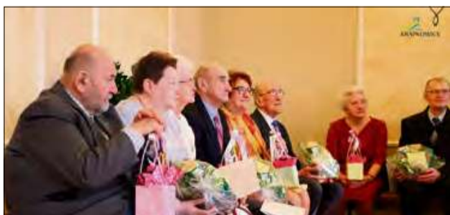
Wydarzenie było doskonałą okazją do wspomnień i podsumowań wspólnych lat.

Tego dnia dostojni jubilanci otrzymali listy gratulacyjne oraz drobne upominki. Dla przybyłych gości wystąpiły przedszkolaki z Zespołu Szkolno-Przedszkolnego nr 4 w Krapkowicach oraz Tęczowej Szósteczki. Wydarzenie było doskonałą okazją do wspo-