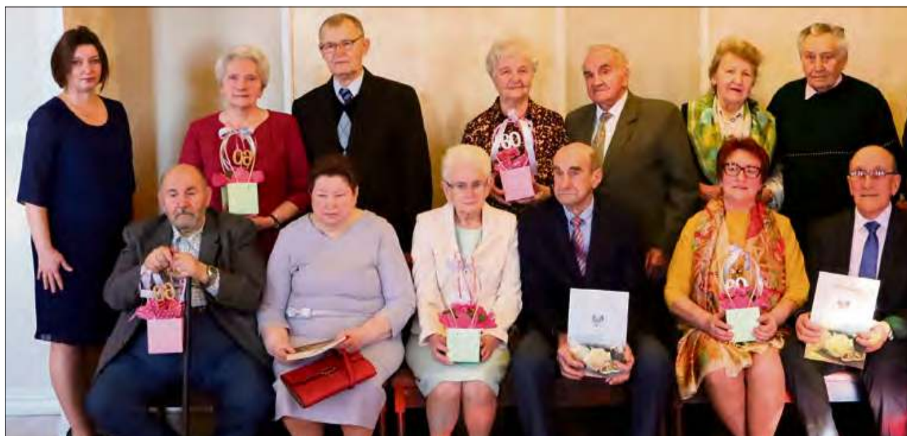
Jubileusz 60-lecia zawarcia związku małżeńskiego mieszkańców gminy Krapkowice.