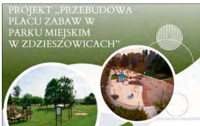
Projekt przebudowy placu zabaw jest już na zaawansowanym etapie przygotowań.

Projekt przebudowy placu zabaw jest już na zaawansowanym etapie przygotowań. Opracowano dokumentację projektowo-kosztorysową, uzyskano pozwolenie na budowę, a także złożono wniosek o dofinansowanie w ramach Funduszy Europejskich. Teraz gmina czeka na wyniki naboru, które zadecydują o dalszych losach inwestycji. Mieszkańcy z niecierpliwością wyglądają na pozytywną decyzję, która pozwoli