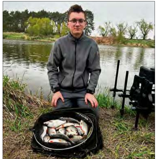
Regularnie organizujemy akcje sprzątania naszego akwenu oraz przygotowujemy stanowiska wędkarskie na coroczne Zawody Wędkarskie.

– Staram się oddzielać i rozróżniać te dwa filary mojej działalności, ponieważ wymagają one innego podejścia. Jeśli chodzi o aspekt ekologiczny, to wciąż zrobiłem zbyt mało, by się tym chwalić. Skupiam się głównie na uświadamianiu ludzi w kwestii renaturyzacji wód, konieczności dbania o czystość środowiska wodnego oraz sportowego podejścia do wędkarstwa. Wśród konkretnych działań warto wspomnieć o inicjatywach naszej nieformalnej grupy społeczników-wędkarzy z gminy Walce – Miłośników Starorzecza Odry. Regularnie organizujemy akcje sprzątania naszego akwenu oraz przygotowujemy stanowiska wędkarskie na coroczne Zawody Wędkarskie z okazji