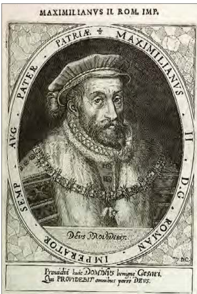
Cesarz Maksymilian II na portrecie wykonanym na początku XVII wieku.

Na kilka lat mieliśmy więc do czynienia z zupełnie nową sytuacją. Po raz pierwszy od uzyskania praw miejskich zyski z krapkowickiego majątku nie szły do kieszeni żadnego prywatnego właściciela. Nie możemy jednak tutaj wyciągać zbyt daleko idących wniosków. Głowa rodu Habsburgów dalej była prawowitym właścicielem krapkowickich dóbr i zamku, jedynie czasowo oddając miejscowe zyski. Nie możemy mówić o jakimś uniezależnieniu się Krapkowic, czy wręcz zbliżeniu się do statusu wolnego miasta cesarskiego. Taki status dotyczył jedynie najsilniejszych organizmów miejskich w ówczesnej Rzeszy Niemieckiej, był obwarowany ścisłymi zasadami i wiązał się między innymi z uzyskaniem reprezentacji na Reichstagu. W przypadku Krapkowic o tym nie może być mowy, nieważne jak bardzo taka wizja rozgrzewa serca lokalnych patriotów. Bardzo podobnie sytuacja miała się zresztą w przypadku szeregu innych miejscowości na Śląsku. Co więcej, Maksymilian ewidentnie był właścicielem miasta nie jako cesarz czy król, ale jako książę opolski. Jako taki rozpoczął też przygotowania do trwałej sprzedaży Krapkowic. Wielka europejska polityka była