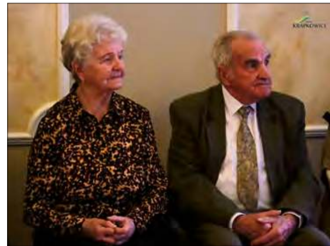
W Urzędzie Stanu Cywilnego w Krapkowicach jedenaście par z naszej gminy świętowało sześćdziesięciolecie pożycia małżeńskiego