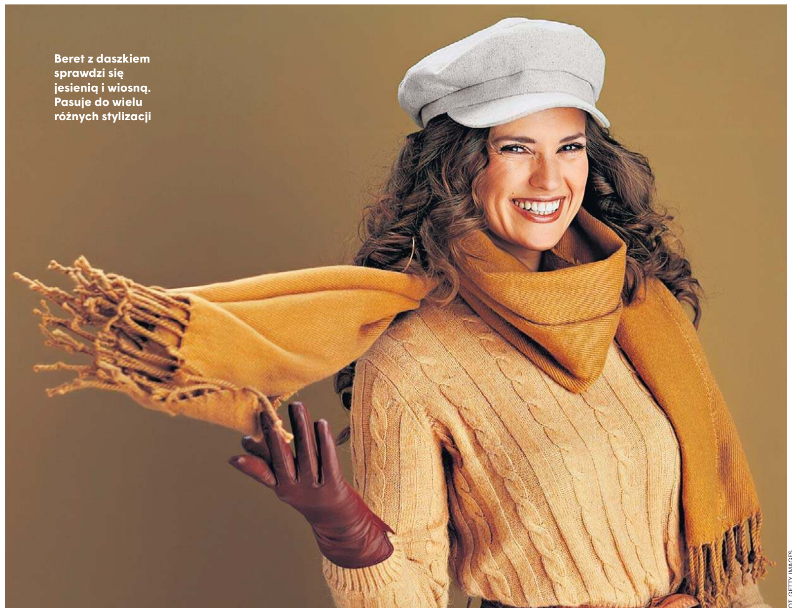
Beret z daszkiem sprawdzi się jesienią i wiosną. Pasuje do wielu różnych stylizacji

Prosta czapka to klasyka, która nigdy nie wyjdzie z mody. Dzięki rodzajowi materiału, z którego jest wykonana, można dopasować ją do pogody i okrycia wierzchniego. Szeroki wybór kolorów, a także ewentualnych zdobień, w tym pomponów, sprawia, że będzie dobrze wyglądać ze wszystkim. Kolor warto dobrać do kurtki i butów, a także swojej karnacji. Mając tendencję do bladoci, lepiej zrezygnujmy z czapek białych i czarnych. Z kolei chcąc rozświetlić stylizację, wybierzmy róż, czerwień, pomarańcz albo niebieski.