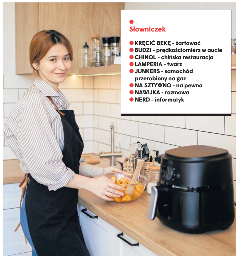
Frytkownica beztłuszczowa jest świetnym rozwiązaniem dla osób mieszkających w pojedynkę. W takim przypadku przygotowywanie dużej ilości jedzenia w piekarniku jest nieekonomiczne

Jeśli jednak gotujesz rzadko, preferujesz tradycyjne metody kulinarne lub Twoja kuchnia jest już wyposażona w wiele podobnych urządzeń, zakup frytkownicy beztłuszczowej może nie być priorytetem. Pamiętaj, że ostateczna opłacalność wynika z częstotliwości użytkowania i korzyści, jakie sprzęt wnosi do Twojego codziennego gotowania.