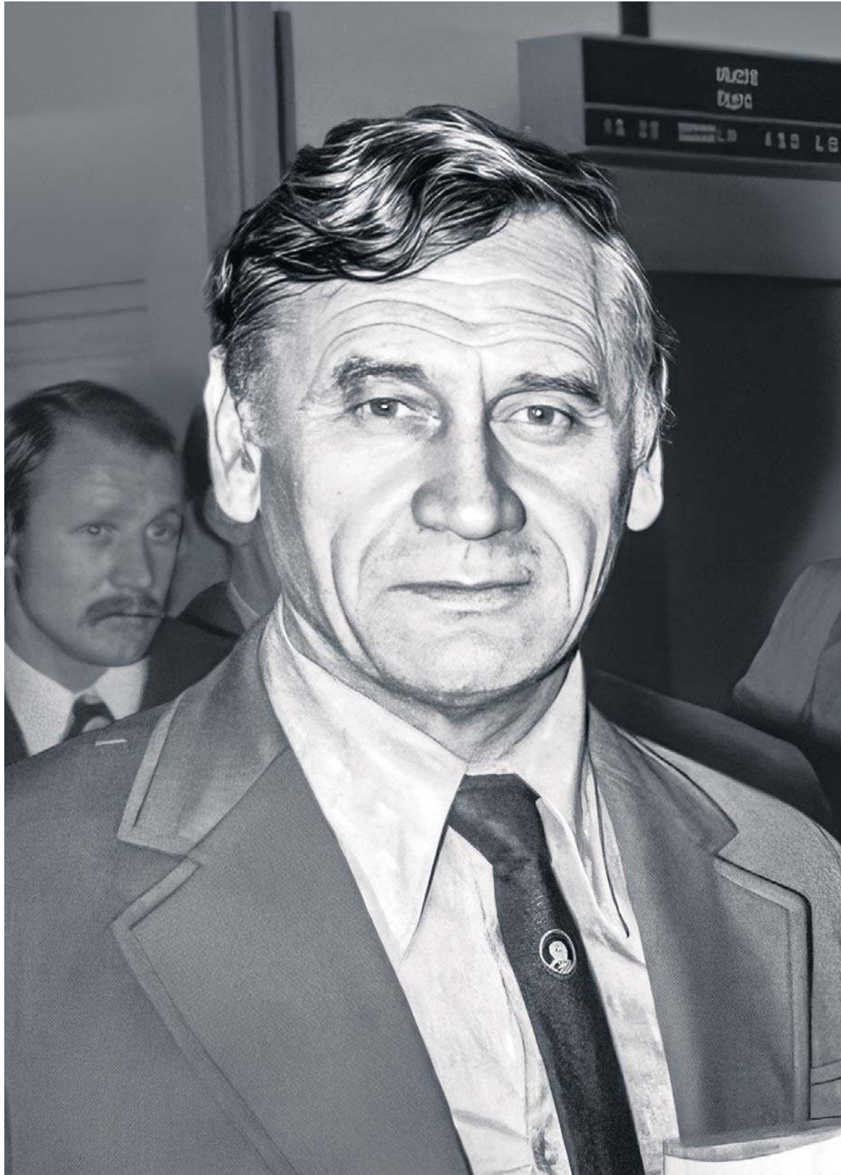
W sumie w dorobku ma trzy krążki, we wszystkich kolorach: złoty olimpijski z Monachium w 1972 roku, srebrny cztery lata później z igrzysk w Montrealu i brązowy z finałów MŚ '74 w Niemczech

W sumie nikogo nie powinno więc dziwić, że jest jedynym Pola-