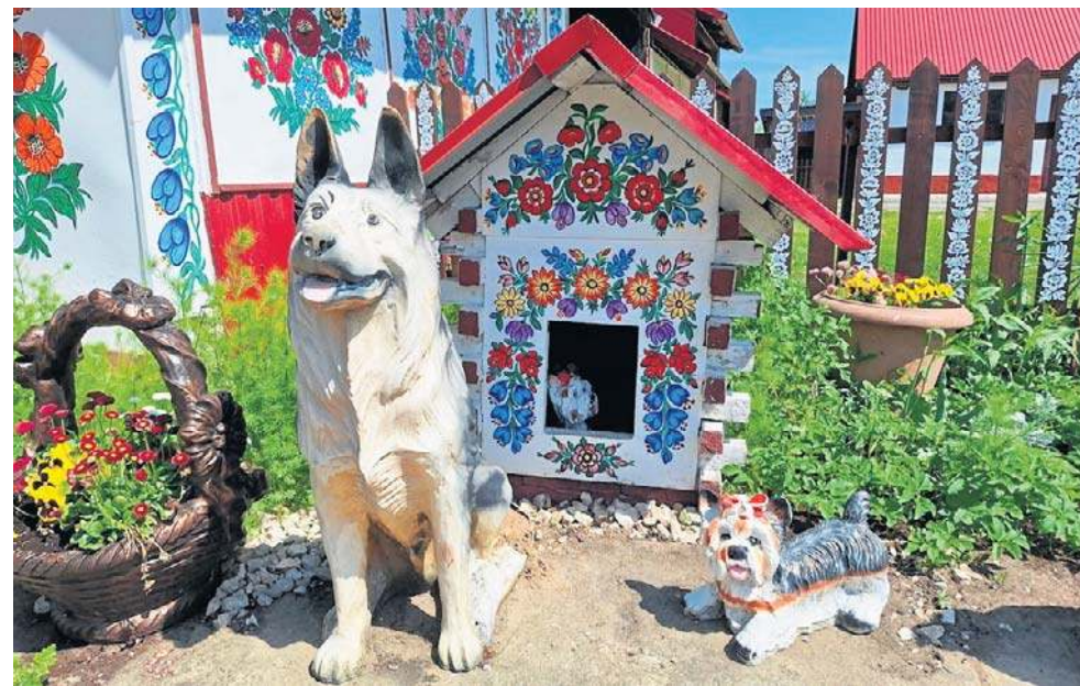
Kwiatowe detale są na altanach, studniach i wiadrach, a nawet psich budach

Konkursy na malowane izby pozwoliły szerzyć kulturę tego regionu. Oceniano w nich zarówno wkład pracy, jak i oryginalność oraz nowatorstwo. Do dziś organizowany jest co roku konkurs „Malowana chata”. Jego celem jest podtrzymanie tradycji malarskich w regionie Powiśla Dąbrowskiego.