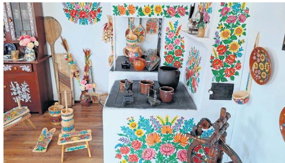
We wnętrzach domów we wsi też królują zalipiańskie malowanki

Dziś już nikt z odwiedzających nie powiązałby pierwotnej sztuki packowania (bielenia) z pięknymi wielobarwnymi malunkami, których pełno na Zalipiu. Oczywiście, obecnie stosowane farby akrylowe długo utrzymują swą barwę, a do samego malowania używa się pędzli. Ale dla mnie najbardziej unikatowe i ciekawe domostwa to właśnie te zdobione glinką z naturalnymi dachami ze słomy.