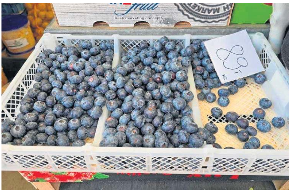
Po raz pierwszy po zimie, na targowiskach można kupić borówki amerykańskie

Jak będzie w tegoroczny sezon dla plantatorów i klientów? Tego jeszcze nie wiadomo. Czas pokaże, czy przyjdą przymrozki, które mają wpływ na mniejsze plony i wyższą cenę.