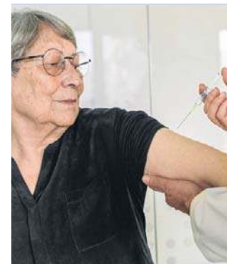
Seniorzy też zyskują dzięki szczepieniu przeciw HPV

- Dane te bezpośrednio podważają przestarzałe wytyczne, że szczepionka „działa tylko przed ekspozycją”. Dowody wskazują, że może być skutecznym narzędziem w walce z istniejącymi zakażeniami HPV i zapobieganiu nawrotom raka, nawet po diagnozie - tłumaczy specjalistka.