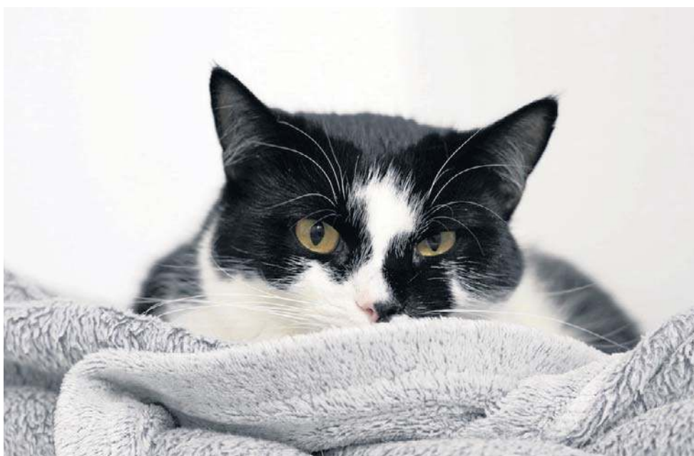
Jeden z wielu kocich podopiecznych na Pomorzu czekających na dobry dom

- Moje koleżanki i ja prowadzimy bardzo duże domy tymczasowe, bo mamy po 30, 40 kotów w naszych domach. I teraz moje pytanie: czy ja mam kupić sobie zamrażarkę na zwłoki ko-