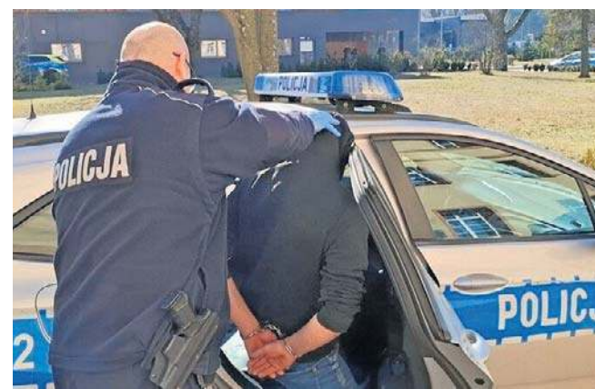
Pijany kierowca zjechał z drogi i zasnął za kierownicą. Został osądzony w trybie przyspieszonym

32-latek stanął przed sądem w trybie przyspieszonym. Sąd orzekł wobec niego 5-letni zakaz prowadzenia pojazdów mechanicznych, 7500 zł grzywny, obowiązek zapłaty 8000 złotych na rzecz Funduszu Pomocy Pokrzywdzonym oraz Pomocy Postpenitencjarnej oraz 5000 zł nawiązki na rzecz Skarbu Państwa. Mężczyzna będzie też musiał zwrócić koszty postępowania sądowego w wysokości 790 zł.