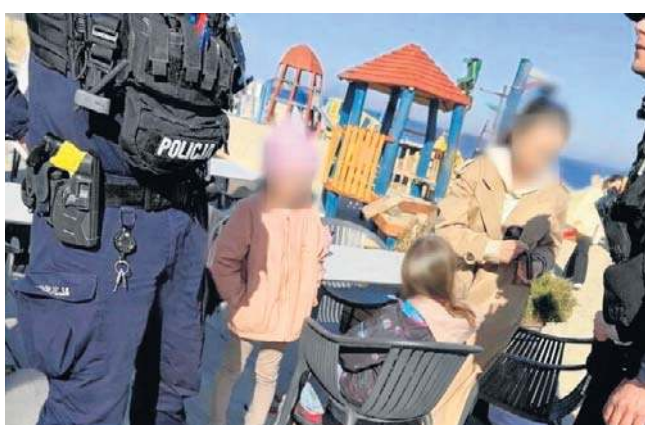
Dzielnicowe potwierdziły tożsamość dziewczynki, a następnie bezpiecznie przekazały ją pod opiekę ojca