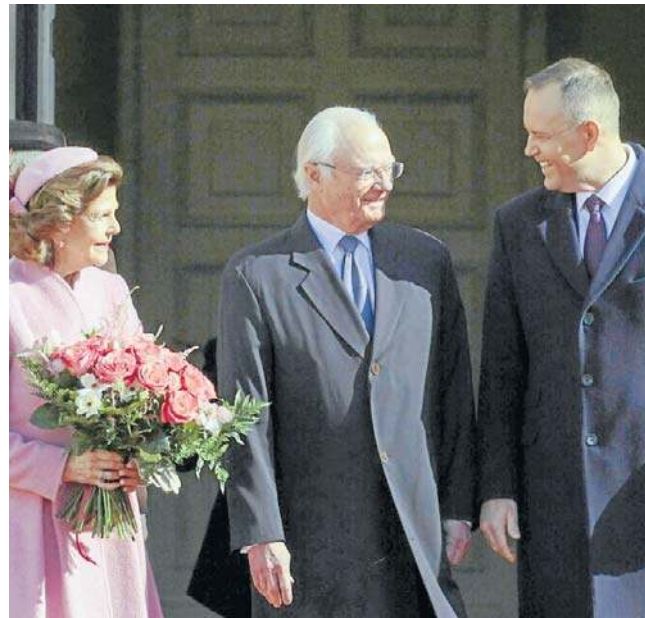
To trzecia wizyta w Polsce Karola XVI Gustawa, który jest królem Szwecji od 1973 roku

To trzecia wizyta w Polsce Karola XVI Gustawa, który jest królem Szwecji od 1973 roku. Wcześniej przyjechał w 1993 roku oraz w 2011 roku.