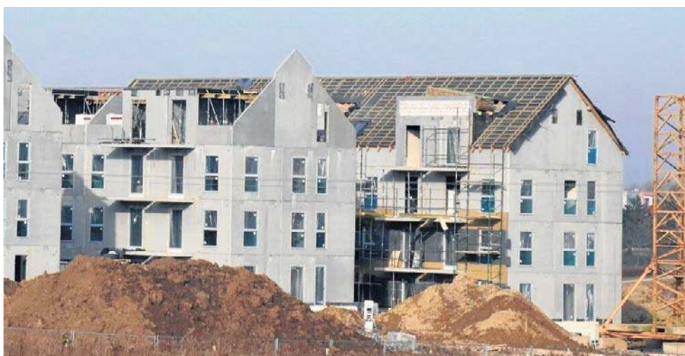
Trwająca budowa trzech domów Społecznej Inicjatywy Mieszkaniowej w Malborku

Budowa ma potrwać do końca czerwca br. W trzech blokach będą mieszkania 1-, 2- i 3-pokojowe z czynszem, który na tę chwilę został skalkulowany na poziomie 24,35 zł za metr kwadratowy. Najemca musi wpłacić partycypację 15 procent kosztów budowy ustaloną przez spółkę w wysokości 2100 zł za m kw.