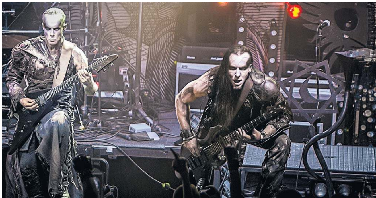
- Od wielu lat dzieją się takie rzeczy zwłaszcza, kiedy pojawia się zespół Behemoth - mówią organizatorzy Mystic Festival

- W dniach 3-6 czerwca 2026 r. na terenie Stoczni Gdańskiej ma odbyć się Mystic Festival - wydarzenie o wyraż-