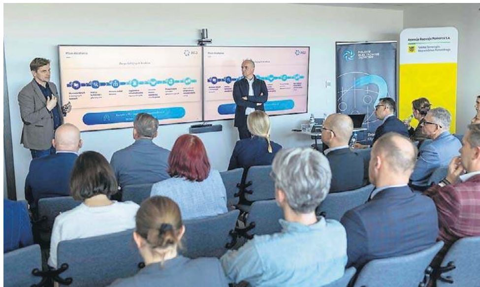
Spotkanie dotyczące bazy noclegowej niezbędnej przy budowie elektrowni

- Cieszy nas tak duże zainteresowanie lokalnych przedsiębiorców przygotowaniami do budowy pierwszej polskiej elektrowni jądrowej. Ponad 500 zgłoszeń, które już wpłynęły pokazuje, że rynek kwater noclegowych na Pomorzu dostrzega potencjał naszej inwestycji i chce aktywnie włączyć się w ten proces. Ścisła współpraca z samorządami oraz lokalnym biznesem jest