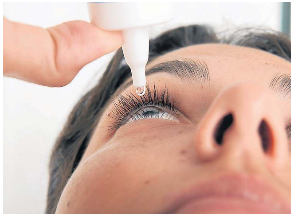
Wylew podspojówkowy zazwyczaj jest niegroźny. Objawia się nagłym pojawieniem się intensywnie czerwonej plamy, której nie towarzyszy ból ani pogorszenie widzenia

Krwawiak najczęściej powstaje wskutek nagłego wzrostu ciśnienia w naczyniach krwionośnych, do którego może dojść podczas wysiłku fizycznego, gwałtownego kaszlu, kichania, intensywnego śmiechu czy wymiotów. Często krwawiak pojawia się również w wyniku urazów mechanicznych, takich jak nieświadome pocieranie oka podczas snu lub ucisk gałki ocznej. U osób starszych przyczyną mogą być kruche naczynia krwionośne lub zaburzenia krzepliwości, które dodatkowo mogą nasilać leki rozrzedzające krew, na przykład po-