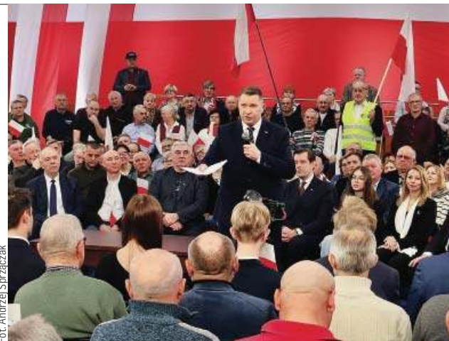
Przemysław czarnek kładł na stół propozycje dla zwykłych Polaków