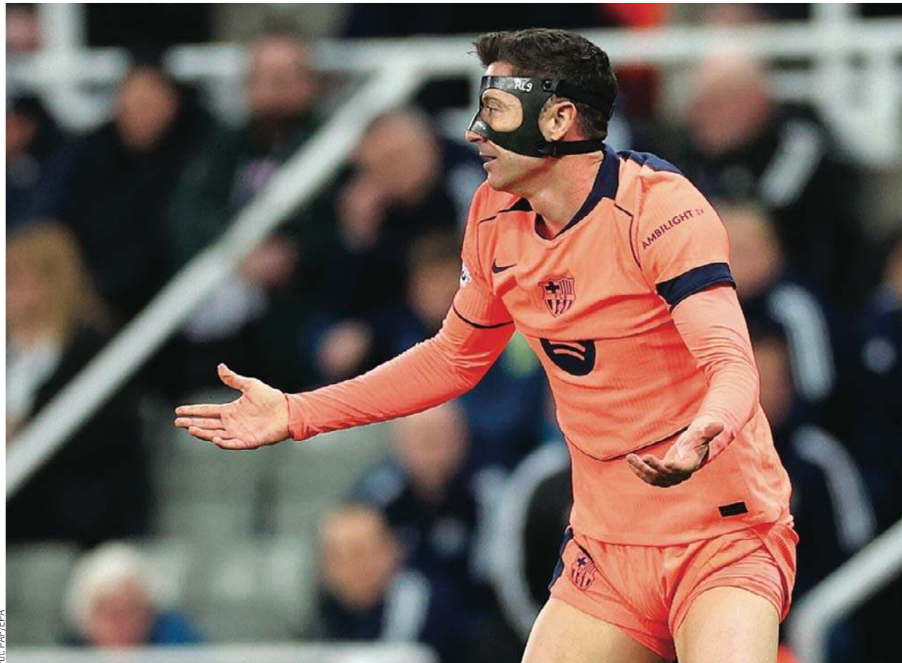
W meczu z Newcastle Robert Lewandowski wyróżnił się tylko dzięki masce chroniącej złamaną kość oczodołu

Tym samym Newcastle nie zostało 41. klubem, któremu w Lidze Mistrzów gola strzeli Robert Lewandowski. 37-letni Polak zdobył dotychczas w tych rozgrywkach 107 bramek. Na jego dorobek składają się trafienia w barwach Borussia Dortmund - 17, Bayernu Monachium - 69 i Barcelony - 21. Do tej pory w tych rozgrywkach odnotował 140 występów.