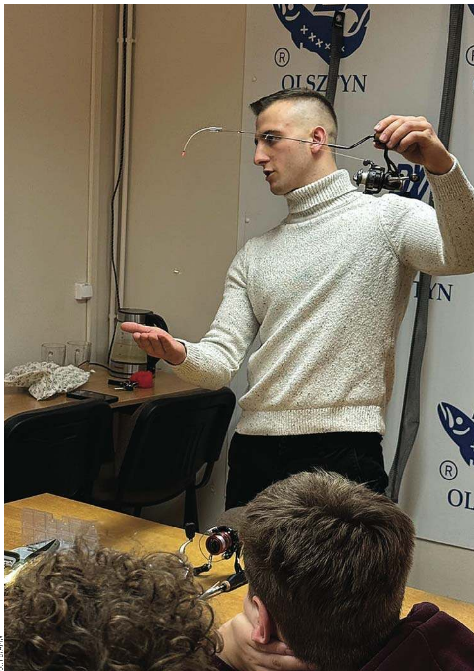
Zajęcia w ramach Akademii Młodego Wędkarza