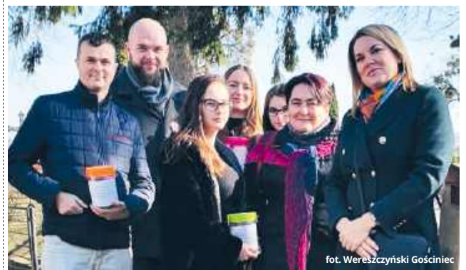
fol. Wereszczyński Gościńiec

na konto stowarzyszenia. Pieniądze są kluczowe, aby zabezpieczyć wkład własny niezbędny do pozyskania dotacji na dalsze prace, o co, zwłaszcza w okresie szybko rosnących cen, jest coraz trudniej. Oprócz renowacji historycznych nagrobków stowarzyszenie finansuje również porządkowanie innych miejsc pamięci w Wereszczynie i najbliższej okolicy.