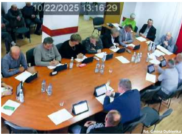
10/22/2025 13:16:29

Wrześniowa nowelizacja rozporządzenia Rady Ministrów z października 2025 roku w sprawie wynagradzania pracowników samorządowych jest już drugą w tym roku nowelizacją dotyczącą samorządowych wynagrodzeń. Dokument z 30 maja 2025 roku podwyższył kwoty minimalnego wynagrodzenia zasadniczego pracowników samorządowych, ale tylko tych, którzy zostali zatrudnieni na podstawie umowy o pracę. Podwyżki, z wyrównaniem od 1 marca br., wynoszą od 5 do 16 proc., w zależności od kategorii zaszerogowania pracownika. Dokonując tej nowelizacji, rząd wycofał się nagle z podwyżek dla zatrudnionych na podstawie wyboru, np. wójtów, burmistrzów, oraz powołań, np. sekretarzy czy skarbników. Decyzja ta została skrytykowana przez organizacje samorządowe, dlatego