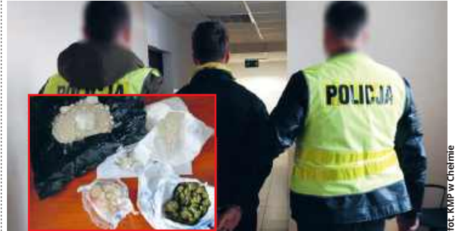
fol. KMP w Chełmie

● CHEŁM Spore ilości środków odurzających zabezpieczyli chełmscy kryminalni w hotelowym pokoju w Chełmie. Zatrzymali przebywającego w nim 19-latkę. Na wniosek śledczych został przez sąd tymczasowo aresztowany.