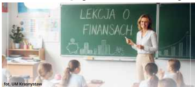
fol. UM Krasnystaw

W ramach programu uczniowie będą uczestniczyli w wycieczkach edukacyjnych do najważniejszych instytucji w Polsce. Wizyta w Sejmie RP, Ministerstwie Finansów, Giełdzie Papierów Wartościowych czy Centrum Pieniądza NBP pozwoli im zobaczyć od kuchni,