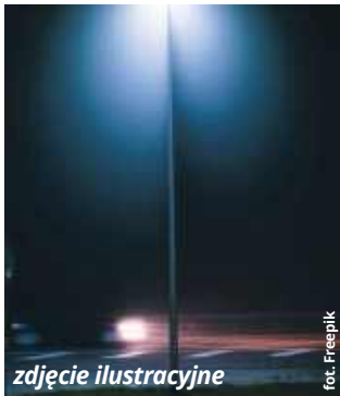
zdjęcie ilustracyjne

O niepokojących zdarzeniach, w których główną rolę odegrało uliczne oświetlenie, zaalarmowały naszą redakcję pani Magda i Alina, mieszkanki osiedla Wschód. - O ile dobrze pamiętam, uliczne lampy na naszym osiedlu nie były konserwowane przynajmniej od kilku lat. I nie dość, że nie działały, to jeszcze w ostatnim czasie doszło tutaj do porażenia psa - przekazała nam jedna z kobiet. Zarząd spółdzielni i władze miasta uspokajają, że już wszystko wróci do normy.