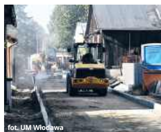
fol. UM Włodawa

● WŁODAWA Mieszkańcy mogą już obserwować zaawansowane prace na ulicy Wąskiej. Na początku bieżącego miesiąca została podpisana umowa na realizację zadania, a obecnie roboty budowlane wchodzą w decydującą fazę.