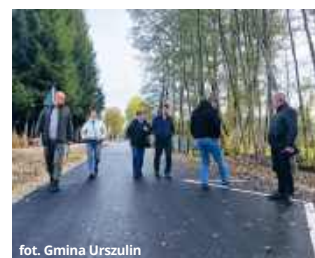
fol. Gmina Urszulin

● GM. URSZULIN Budowa drogi gminnej w Grabniaku dobiegła końca. Wykonano nawierzchnię bitumiczną, pobocza, zjazdy oraz oznakowanie. Projekt został dofinansowany w 80% ze środków zewnętrznych, a jego całkowity koszt wyniósł ponad 1,5 mln zł.