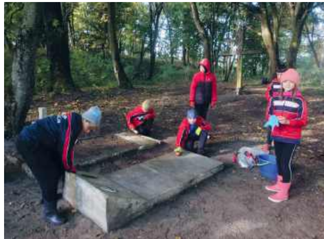
fol. OSP Urszulin

Prace objęły dwa miejsca pamięci: cmentarz ewangelicko-wojenny w Michałowie i cmentarz prawosławny w Andrzejowie. Zakres robót był technicznie prosty, ale rozłożony na kilka czynności terenowych – od oczyszczenia alejek i kwater z samosiewów, przez mechaniczne usunięcie porostów z powierzchni nagrobków, po pionizację wybranych, przechylonych elementów. Zastosowano podział zadań z zespołu,