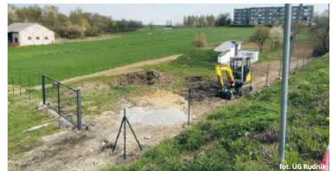
fol. UG Rudnik

niosła 43 665 złotych. Zadanie zostało w całości sfinansowane ze środków pochodzących z uzupełnienia subwencji ogólnej, którą gmina Rudnik otrzymała z Ministerstwa Finansów. Pieniądze te przeznaczone są na wsparcie inwestycji w zakresie wodociągów i zaopatrzenia w wodę.