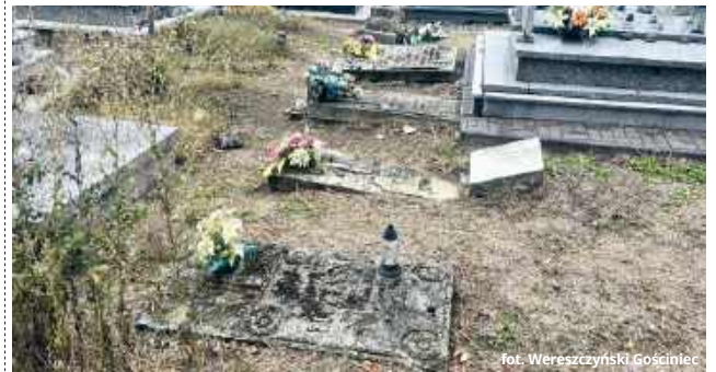
fol. Wereszczyński Gościńiec

Celem działającego od 2012 roku „Wereszczyńskiego Gościńca” jest ocalenie spuścizny historycznej, którą jest cmentarz rzymskokatolicki z wieloma zabytko-