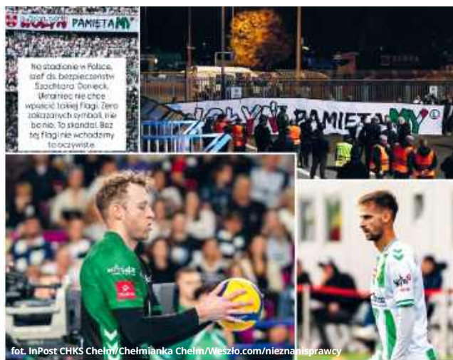
fol. InPost CHKS Chełm/Chełmianka Chełm/Weszło.com/nieznaneprawcy

● CHEŁM W debiutanckim sezonie w PlusLidze siatkarze z Chełma przyciągnęli uwagę całej Polski nie tylko ambitną grą, ale i mocnym przesłaniem. Na ich koszulkach widnieje napis „Wołyń 43 Pamiętamy”, który ma przypominać o ofiarach ludobójstwa dokonanego przez ukraińskich nacjonalistów na Polakach. Tymczasem kibice Legii Warszawa podczas meczu z Szachtarem Donieck w Krakowie doświadczyli zakazu wniesienia na stadion flagi z identycznym hasłem. Sytuacja ta pokazuje, jak trudny i wciąż niewygodny bywa temat pamięci o Wołyniu.