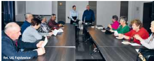
fol. UG Fajslawice

Klub Seniora w Fajslawicach podsumował kolejny rok pełen aktywności, wyjazdów, spotkań i wspólnej pasji. Podczas uroczystego spotkania w sali urzędu gminy seniorzy prezentowali swoje dokonania, a władze gminy dziękowały im za wkład w życie lokalnej społeczności.