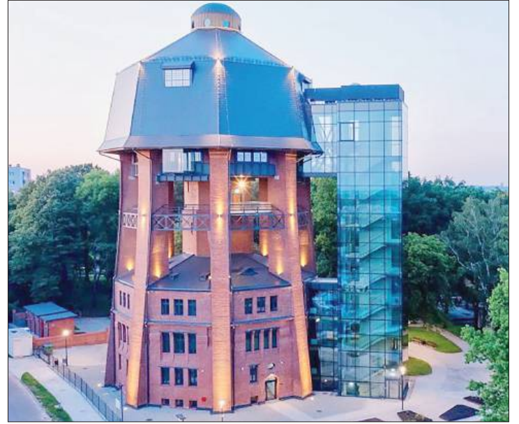
W tej zabytkowej wieży nowy lokal ma Ognisko

– Trzydzieści lat to kawał życia – mówi o swym oficjalnym dyktowaniu OPP3. – W dokumentach początek placówki to rok 1973, ale tak po prawdzie to już od 1971 roku byłem jej dyrektorem, bo właśnie od tego roku ją organizowałem. A powstała z klubu modelarskiego, który prowadziłem już od początku lat siedemdziesiątych. Zajęcia mieliśmy w nieczynnych sklepach, opuszczonych lokalach, mieszkaniach, a nawet w byłej kotłowni... Dopiero z czasem się to formalizowało, ale sprawnie, bo działałem także w harcerstwie i miałem organizacyjne doświadczenie. Bardzo dużo pracowałem z młodzieżą, to były inne czasy... Prowadziłem kronikę, taką z czarnobiałymi zdjęciami, ręcznymi opisami, wycinkami z prasy. Zachowała się do dzisiaj i ma ją w swym archiwum Ognisko.