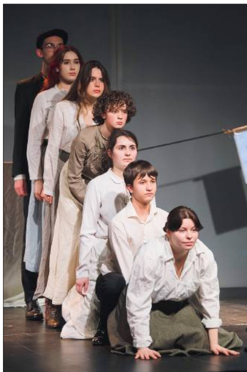
Nioetykietkowani w spektaklu „Rozdroża”