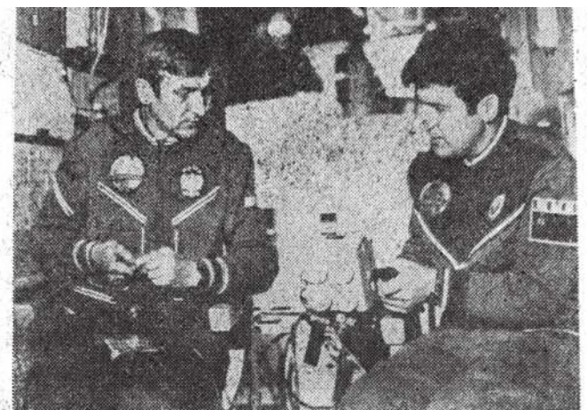
Kosmonauta-badacz mjr Miroslaw Hermaszewski i lotnik-kosmonauta płk Piotr Klimuk w czasie treningu.

Do KOMITETU CENTRALNEGO KOMUNISTYCZNEJ PARTII ZWIĄZKU RADZIECKIEGO Wspólnie z całym narodem polskim, załoga kopalni „Zabrze” z głębokim wzruszeniem i radością przeżywa doniosłe, historyczne wydarzenie – lot pierwszego Polaka w przestrzeń kosmiczną. Jest to wielkie osiągnięcie konstruktywnej współpracy polskiej i radzieckiej nauki i techniki w dziedzinie opanowania Kosmosu dla dobra ludzkości. Dla KPZR dla Towarzysza Breżniewa oraz dla radzieckiej przodującej nauki wyrażamy z tego powodu najgłębsze uznanie oraz składamy najszersze gratulacje i pozdrowienia. W tym historycznym wydarzeniu widzimy praktyczny wyraz proletariackiego internacjonalizmu oraz niewzruszalnej przyjaźni, pomocy i współpracy KPZR i PZPR dla dobra pokoju, postępu i socjalizmu. Tylko bezinteresowna pomoc oraz doświadczenia polityczne Kierownictwa KPZR mogły postawić osiągnięcia nauki i techniki na tak wysokim poziomie. Jesteśmy wdzięczni KPZR za tak doniosłe wyróżnienie naszej partii i naszej socjalistycznej Polski oraz za to, że Polska może uczestniczyć razem ze Związkiem Radzieckim w naukowych działaniach na rzecz opanowania i wykorzystania przestrzeni kosmicznej dla dobra całej ludzkości. Zabrze, dnia 28.VI.1978 r.