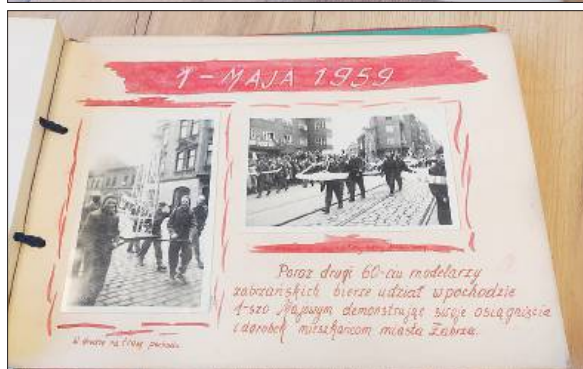
Pierwsze strony kroniki placówki