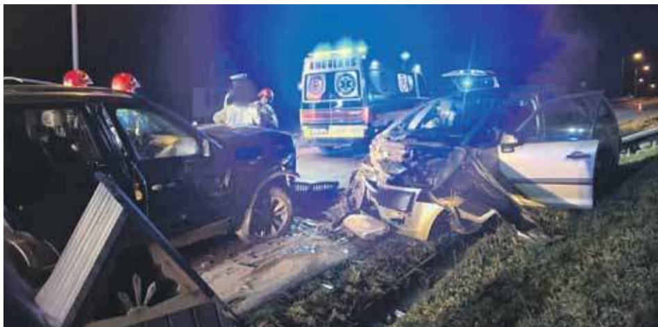
Do czołowego zderzenia doszło na Stasikach w Leśnicy.

- Kierowca citroena uderzył w prawidłowo jadący samochód marki BMW. Sprawca zdarzenia był pod wpływem alkoholu - miał około 1,5 promila w wydychanym powietrzu. Nie posiadał uprawnień do kierowania pojazdami, a samochód, którym się poruszał, nie należał do niego - informuje st. asp. Maciej Kasprzycki z zakopiańskiej policji.