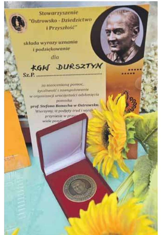
Wszystkich sponsorów, organizatorów, osoby i instytucje, które przyczyniły się do organizacji obchodów 80. rocznicy śmierci Stefana Banacha uhonorowano dyplomami i okolicznymi medalami.

- Kamień wyrasta prosto z ziemi, jest surowy, ale w górnej swojej części nabiera struktury geometrycznej, wchodzi w pewien kanon liczbowy, a na jego szczycie stoi postać na-