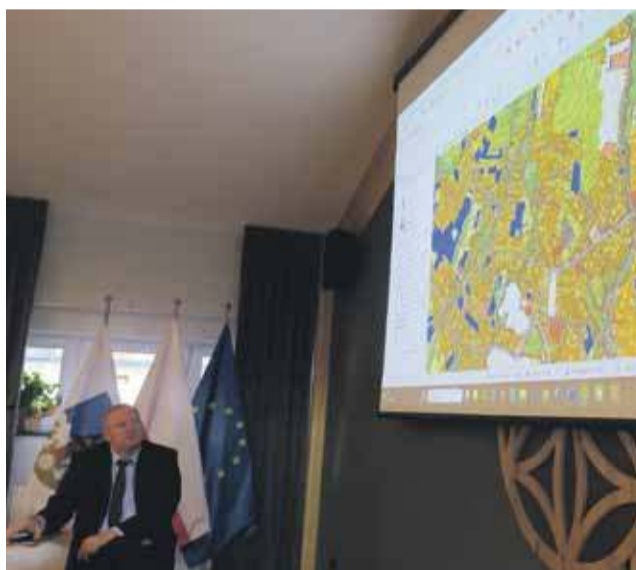
W nowym planie 50 hektarów do zabudowy.