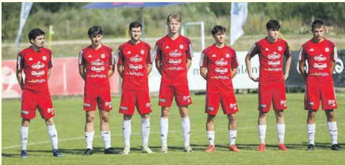
Piłkarze Watry przegrali z Orłem Ryczów 1:2.