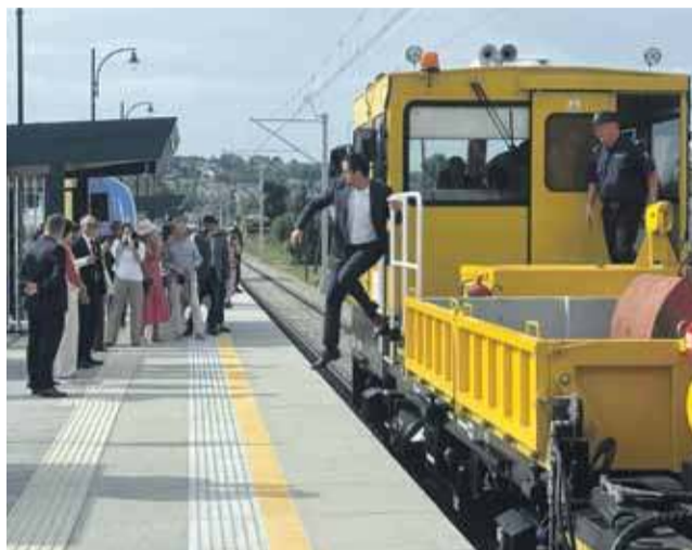
Pociągi wracają do Rabki.