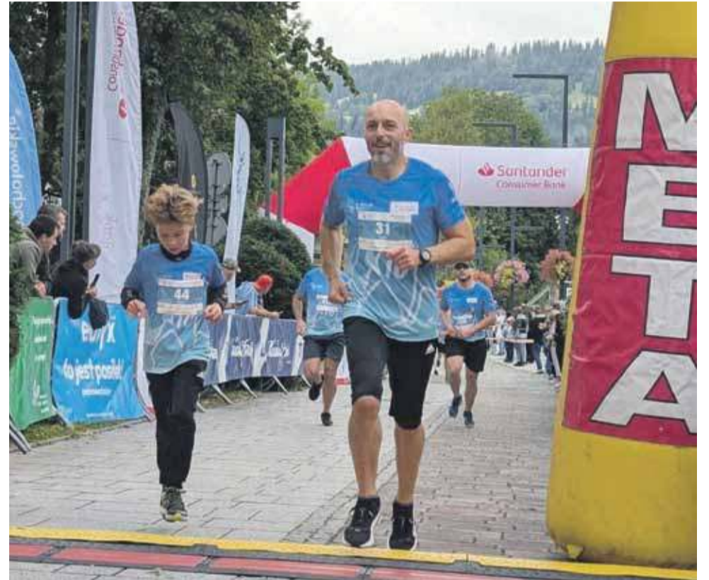
W biegu wzięło udział prawie 900 uczestników.