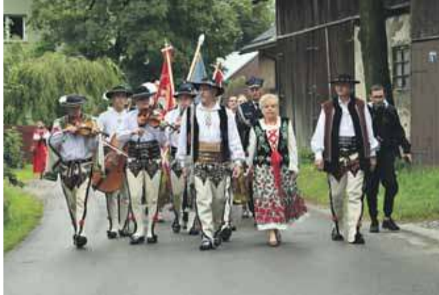
Po uroczystej Mszy św. odprawionej w kościele pw. św. Michała Archanioła poczty sztandarowe i zaproszeni goście przeszli na pl. św. Floriana.