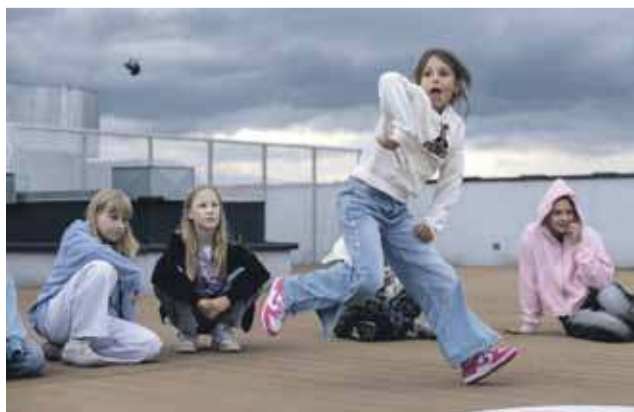
Tak się tańczy na dachu Miejskiego Centrum Kultury.