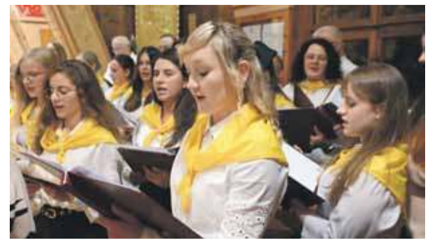
Chór Kanto z Białego Dunajca wprowadził uczestników uroczystości w muzyczny klimat wspomnień o „Solidarności”.

Po Mszy św. odbył się koncert chóru Kanto z Białego Dunajca. Wierni zgromadzeni w świątyni usłyszeli m.in. „Mury” Jacka Kaczmarskiego, „Modlitwę o wschodzie słońca” Przemysława Gintrowskie-