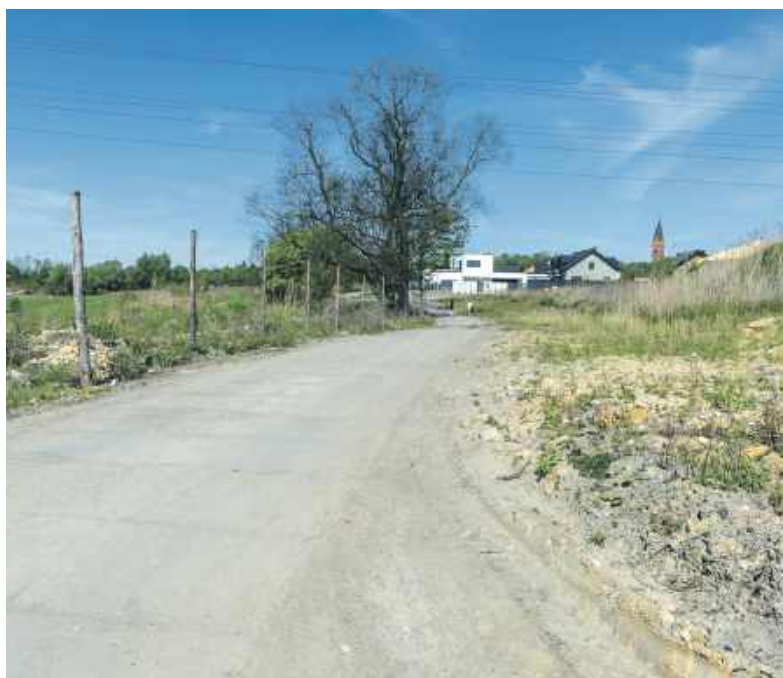
Ulica Bażantowa ma połączyć Bobrek z Szombierkami

W ramach Funduszu 6,6 mln dostanie Radzionków. Po dołożeniu 5,4 mln od siebie będzie mógł przebudować (na odcinku od ul. Wandy