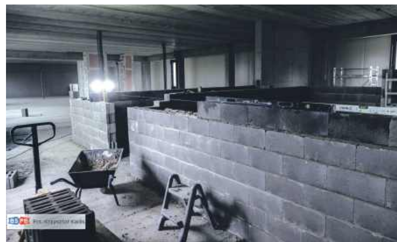
Prace na boisku Polonii potrwają 12 miesięcy

Przypomnijmy, że trybuna wschodnia, także zakryta dachem