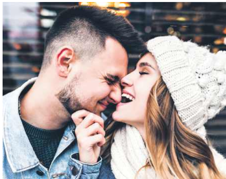
Zdo sie, co łoni sie fest przajom

Na pewno każdy frela chce usłyszeć, jak karlus prosto we łocy powiy ji: „jakoś ty gryfno”, abo „jakoś ty piykno i szykowno. A te szaty fest ci lejom” („jaka ty jesteś piękna i elegancka, a ta sukienka tak ci dobrze pasuje”). A zaś frela dobrze zrobi, jak powiy karlusowi: „ales ty szfarny” („ale jesteś przystojny”). Wyincy godać ani niy musi, chopu tyła styknie - wiyw co godom.