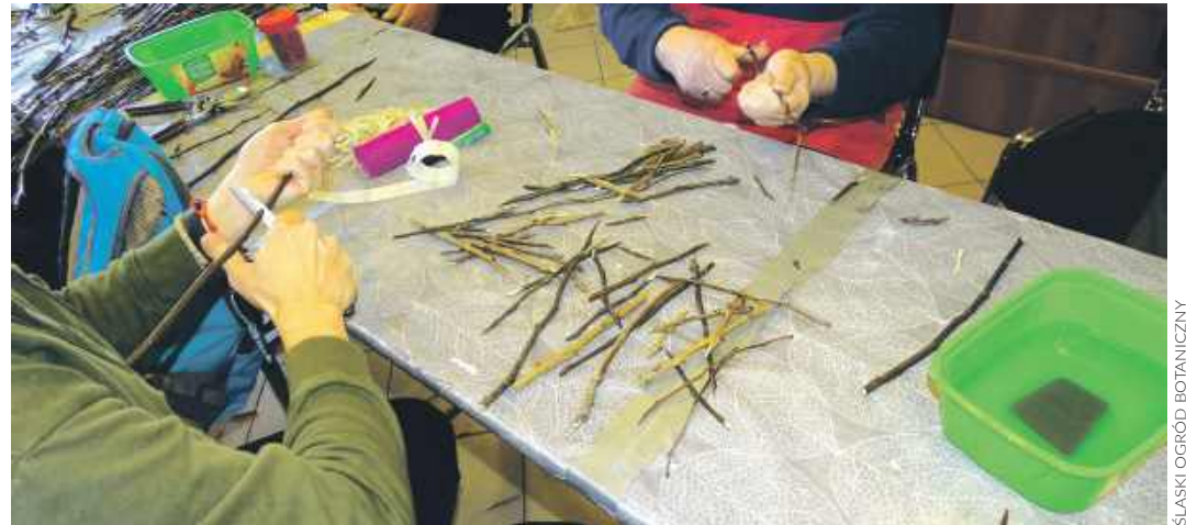
Pracownicy radzionkowskiego Ogrodu fachowo zajmują się zrazami

Odzew na apel jest spory. - Zgłasza się wiele osób, większość mówi, że chodzi o kwestie sentymentalne. Chcą ocalić jabłka z sadu dziadka, bo ich oryginalny