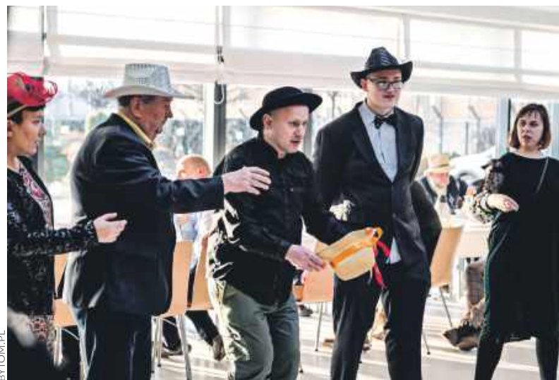
Lwów parkietu na tym balu nie brakowało

Tradycja rzecz święta. Także jeśli dotyczy zabawy karnawałowej. Choćby takiej, jaka co roku organizowana jest dla podopiecznych bytomskiego Domu Pomocy Społecznej dla Dorosłych.