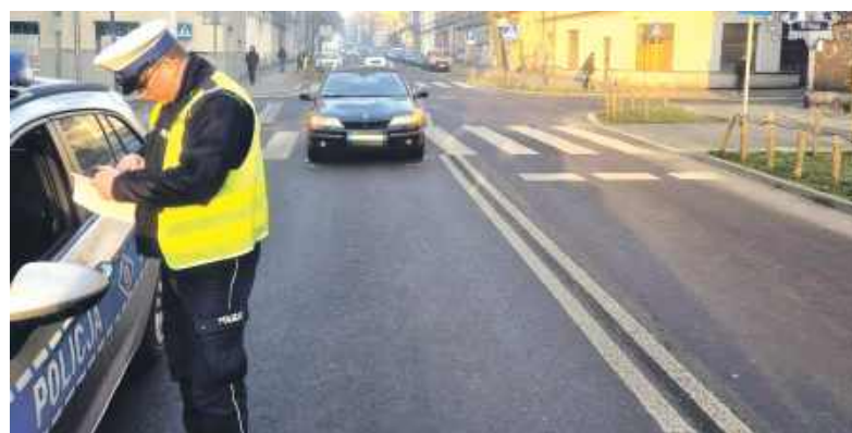
Przejście jest oznakowane, widoczność była dobra, a mimo to doszło do wypadku

44-letnia kobieta została potrącona przez samochód, gdy prawidłowo przechodziła przez pasy u zbiegu ulic Smolenia i Żołnierza Polskiego. Pieszą odwieziono do szpitala.