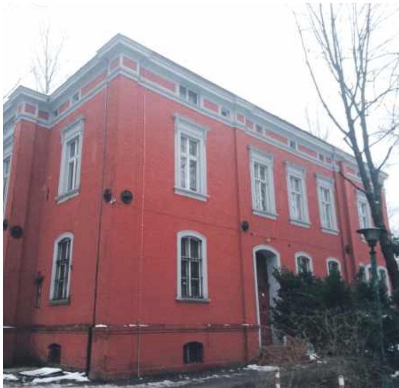
Zabytek dostanie drugie życie

Przetarg wygrał Klub Sportów Siłowych i Wspinaczkowych Skarpa Bytom, który sukcesywnie i przede wszystkim z ogromnym powodzeniem przeobraża i rewitalizuje teren i zabudowania pozostałe po Rozbarku. Teraz wydzierżawił on budynek dawnej dyrekcji, cen-