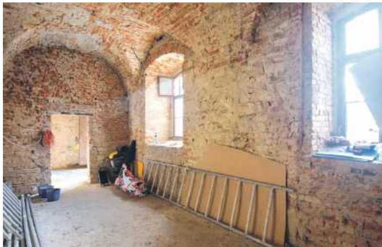
Ze ścian zakrystii skuto stare tynki