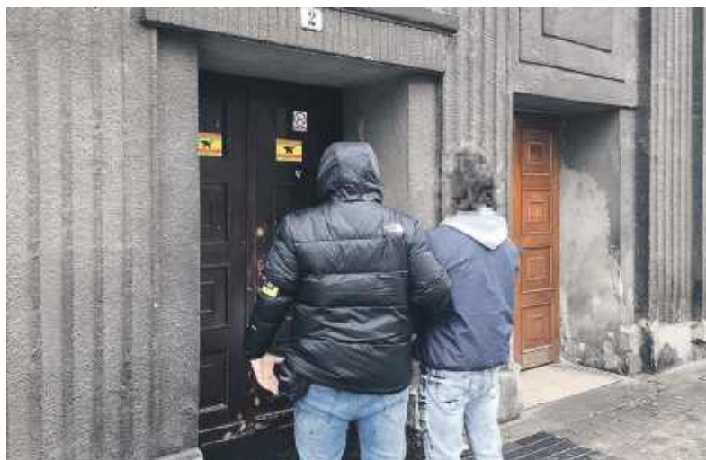
Policjanci z Tarnowskich Gór zatrzymali dwóch mężczyzn i kobietę z Bytomia z dużymi 13 tysiącami działek narkotyków.