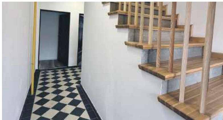
Wnętrze zabytkowych familoków po remoncie wyglądają bardzo nowoczesnie

Trudno się dziwić. Wszystkie mieszkania zajmują przeszło 90 mkw., a składają się z czterech pokoi, w tym jednego z aneksem kuchennym, przedpokojem ze schodami oraz łazienką z toaletą. Zgodnie z przyjętymi zasadami o prawo zajęcia lokalu mogą się ubiegać osoby nie posiadające prawa własności do lokalu mieszkalnego, budynku mieszkalnego lub jego części oraz nie będące w trakcie budowy