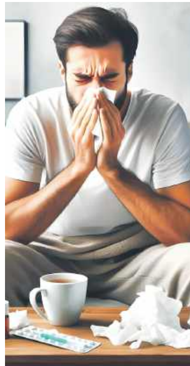
Żeby otrzymywać zasiłek podczas choroby, musimy opłacać składkę zdrowotną

Co robić, gdy choroba się niestety przedłuża i wciąż nie możemy wrócić do pracy zawodowej, a limit dni