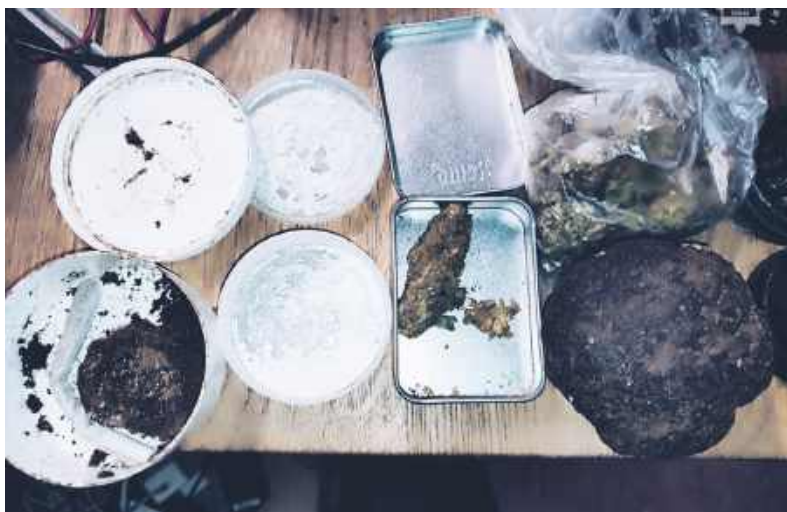
Ponad pół kilograma amfetaminy i marihuany przejęto nieco ponad tydzień temu w jednym z mieszkań w Bytomiu.

BYTOM. OD POCZĄTKU ROKU NA TERENIE NASZEGO MIASTA MIAŁO MIEJSCE PRAWIE 30 ZATRZYMAŃ OSÓB POSIADAJĄCYCH NARKOTYKI. W NIEKTÓRYCH PRZYPADKACH PRZEJĘTO NAPRAWDĘ DUŻE ICH ILOŚCI PRZEZNACZONE NA SPRZEDAŻ, ALE MIAŁY TEŻ MIEJSCE ZATRZYMANIA MNIEJSZYCH PORCJI.