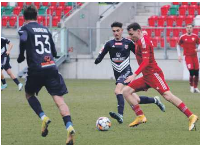
Na razie w sparingach Polonia częściej przegrywa, niż wygrywa

Tymczasem sztab szkoleniowy Polonii zdecydował, że dwóch wychowanków klubu wiosną uda się na