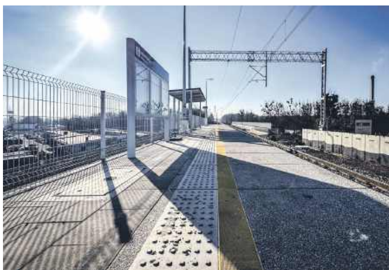
Przesunięta o 600 metrów stacja Bytom-Stroszek prezentuje się okazale

W poniedziałek, 10 lutego rusza kolejna część remontu. Ruch samochodowy pod wiaduktem w jego trakcie będzie odbywać się jak zwykle, ale kierowcy muszą być przygotowani na utrudnienia, bo czasowo wyłączone