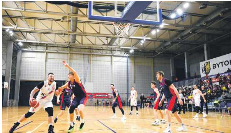
Nasi koszykarze pokonują każdą przeszkodę