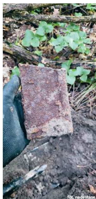
Magazynek z karabinu maszynowego Browning