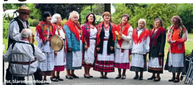
fol. Starostwo Włodawa

- Takie spotkania pokazują, jak ważna jest bliskość i wspólnota. Polityka senioralna to nie tylko liczby i inwestycje, ale przede wszystkim ludzie - powiedział starosta, dziękując