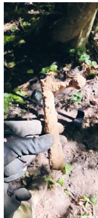
Zamek pochodzi najprawdopodobniej z karabinu Mauser wz. 1898