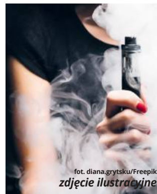
zdjęcie ilustracyjne

wana jest osobą niepełnoletnią, sprawa zostanie przekazana do sądu rodzinnego.