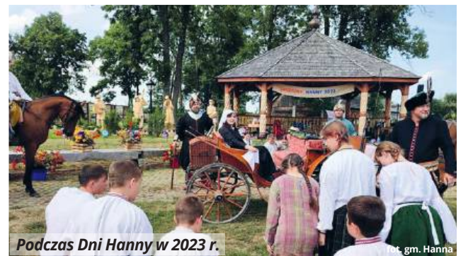
Podczas Dni Hanny w 2023 r.

Projekt „Czas w drewnie zaklęty”, dofinansowany z programu Narodowego Centrum