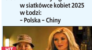
22.20 R.I.P.D. - Agenci z zaświatów - komedia sensacyjna, USA, 2013, reż. Robert Schwentke, wyk. Ryan Reynolds, Jeff Bridges, Mary Louise Parker, Kevin Bacon