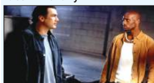
21.35 Mroczna dzielnica - film sensacyjny, USA 2001, reż. Andrzej Bartkowiak, wyk. Steven Seagal, DMX, Isaiah Washington, Anthony Anderson, Michael Jai White, Bill Duke