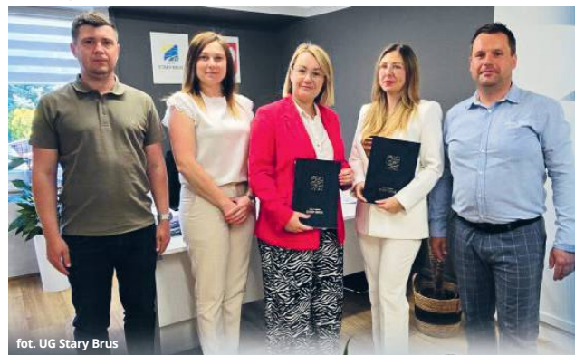
fol. UG Stary Brus

Planowane prace obejmują kompleksową termomodernizację budynku, w tym docieplenie ścian i stropów, wymianę okien i drzwi na energooszczędne, a także modernizację systemu grzewczego. W ramach zadania pojawią się również odnawialne źródła energii, takie jak: pompy ciepła i panele fotowoltaiczne, co wpłynie na zmniejszenie kosztów