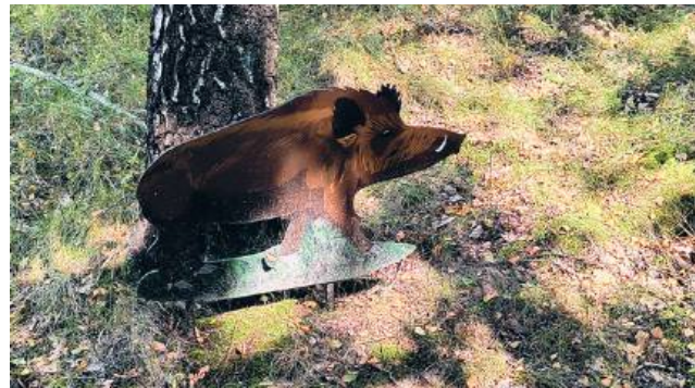
Leśną galerię udało się zorganizować w ramie starego okna

- Trzeba ocalać to, co jeszcze można ocalić. I nie mam tutaj na myśli tylko i wyłącznie przedmiotów, takich niemych świadków historii. Chciałabym ocalić coś, co ja pamiętam z życia tej wsi. Z ludzkich postaw, sposobu bycia. Wie pan, nieopodal odkopaliśmy po wielu latach taką starą studnię. Liczy 33 metry. Próbowaliśmy ją uruchomić, ale wymaga to bardziej skomplikowanych zabiegów. Pamiętam jednak, że kiedyś w Majdanie funkcjonowało siedem takich studni, a z jednej korzystało prawie dwudziestu gospodarzy. Kobieta, która przychodziła do studni po wodę, a nosiła się ją przy pomocy specjalnych nosideł na plecach, musiała iść póź-