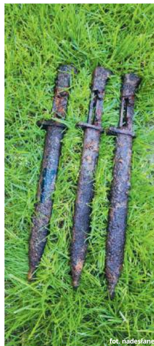
Takie bagnety stanowiły standardowe wyposażenie żołnierzy, którzy służyli w przedwojennym Wojsku Polskim