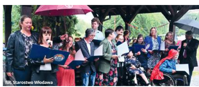
fol. Starostwo Włodawa

za zaproszenie. Jak podkreślił samorząd powiatowy nie tylko dostrzega potrzeby starszych mieszkańców, ale sukcesywnie zwiększa nakłady na poprawę ich jakości życia.