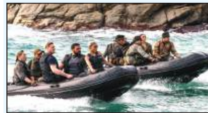
19.55 Uncharted - film przygodowy, USA, Hiszpania, 2022, reż. Ruben Fleisher, wyk. Tom Holland, Mark Wahlberg, Antonio Banderas, Sophia Ali, Tati Gabrielle, Steven Waddington