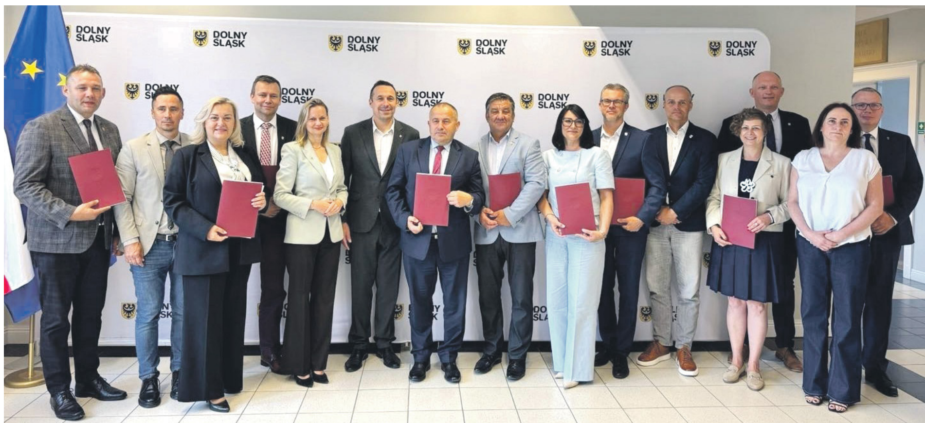
Promesy odebrali przedstawiciele dziesięciu dolnośląskich samorządów