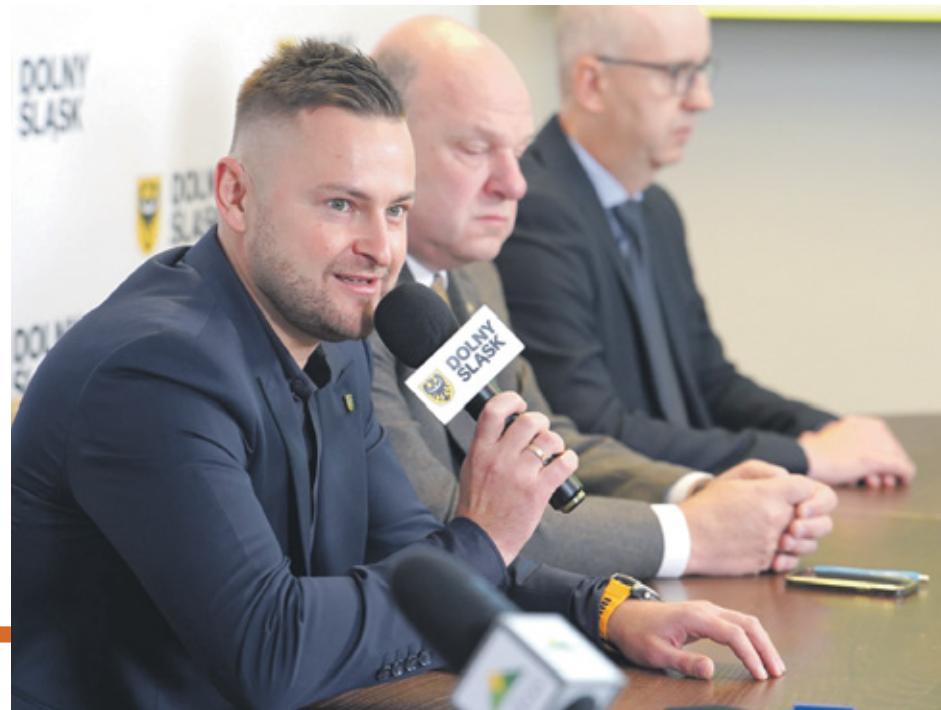
Dotacje pozwolą poprawić poziom bezpieczeństwa i jakość codziennego życia mieszkańców - informuje wicemarszałek Michał Rado