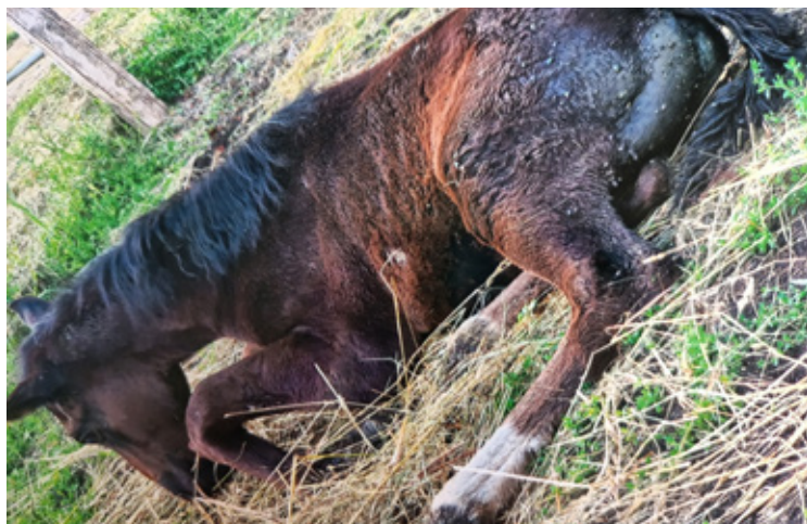
Źrebak, który według niektórych był zdrowy.

Zwierzę było osłabione i wycieńczone. Należało do księdza, który w trakcie zdarzenia przebywał w szpitalu. W tym czasie opiekę nad końmi przejęła inna