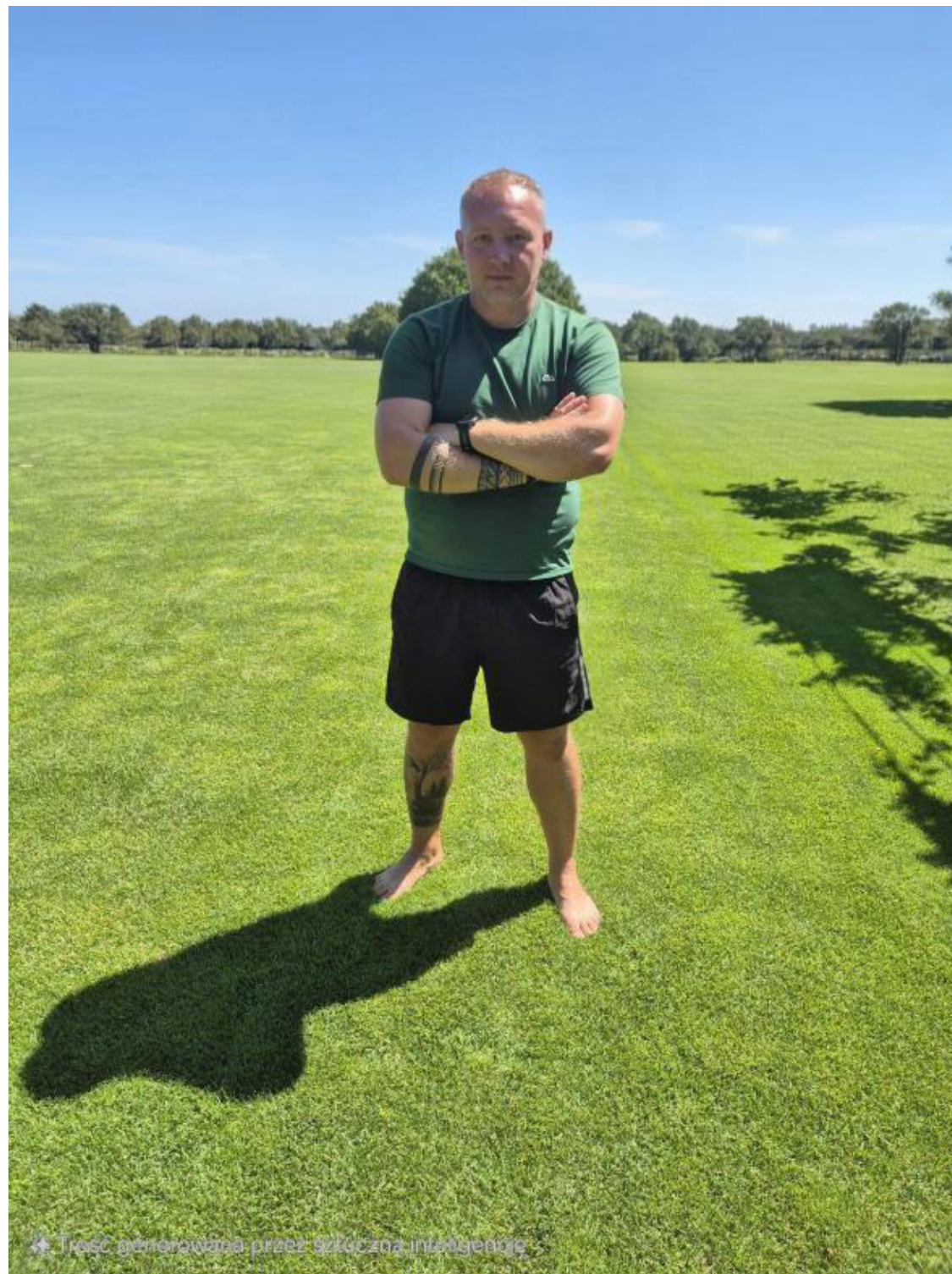
✦ Treść generowana przez sztuczną inteligencję

- Korty wymagają gruntownej modernizacji. Jesteśmy po dwóch etapach prac ziemnych, a projekt