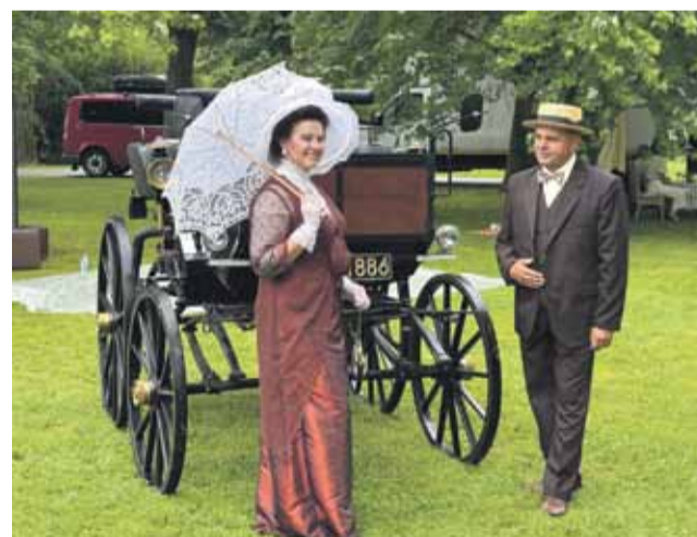
Stowarzyszenia „Dawnej Rabki Czar” od ośmiu lat organizuje w Rabce słynne retro-pikniki.