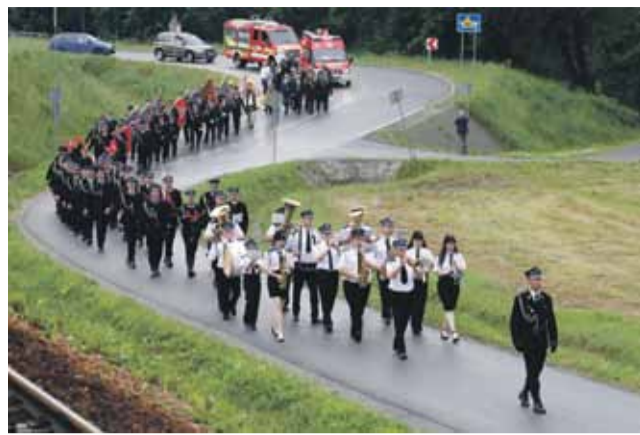
100-lecie OSP w Chabówce.

W 2000 roku nad drzwiami remizy została zamocowana figura św. Floriana, a na wyposażenie jednostki trafił nowy wóz Star 244. Reaktywowana drużyna młodzieżowa znów zaczęła odnosić sukcesy sportowe, po-