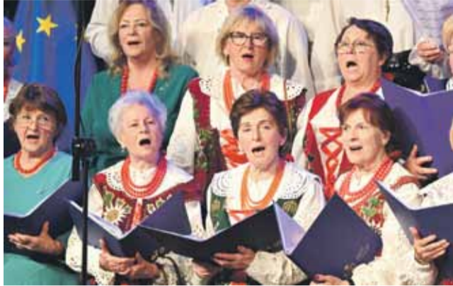
Chórzystki z trzech chórów złączyły siły i zaśpiewały razem hymn miasta.

- Dzisiejszy Nowotarżanin wykorzystuje położenie Nowego Targu już nie tylko do rozwijania działalności handlowej związanej z przecinającymi go