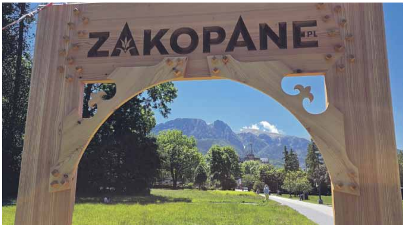
Ukraińcy stali się dopełnieniem rynku pracy w Zakopanem, bez nich przedsiębiorcom byłoby ciężko.

- Nie wynika to z tego, że ktoś nie chce zatrudniać Polaków. Po prostu często brakuje