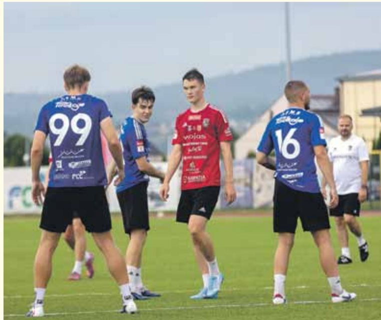
Przygotowania do nowego sezonu rozpoczęły się także od porządkowania kadry.