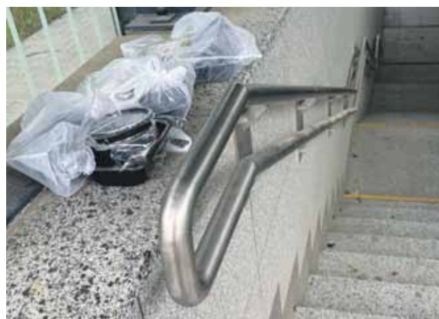
Tak wygląda nowe podziemne przejście pod torami kolejowym w Rabce.