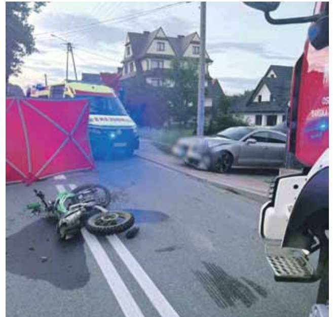
32-letni mieszkaniec gminy Szaflary, wyjeżdżając samochodem osobowym z posesji, nie ustąpił pierwszeństwa przejazdu kierującemu motocyklem.