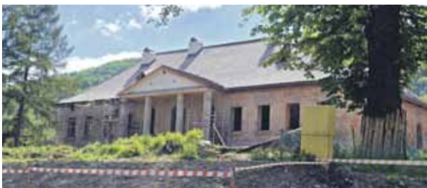
Dwór Berskich w Tylmanowej.