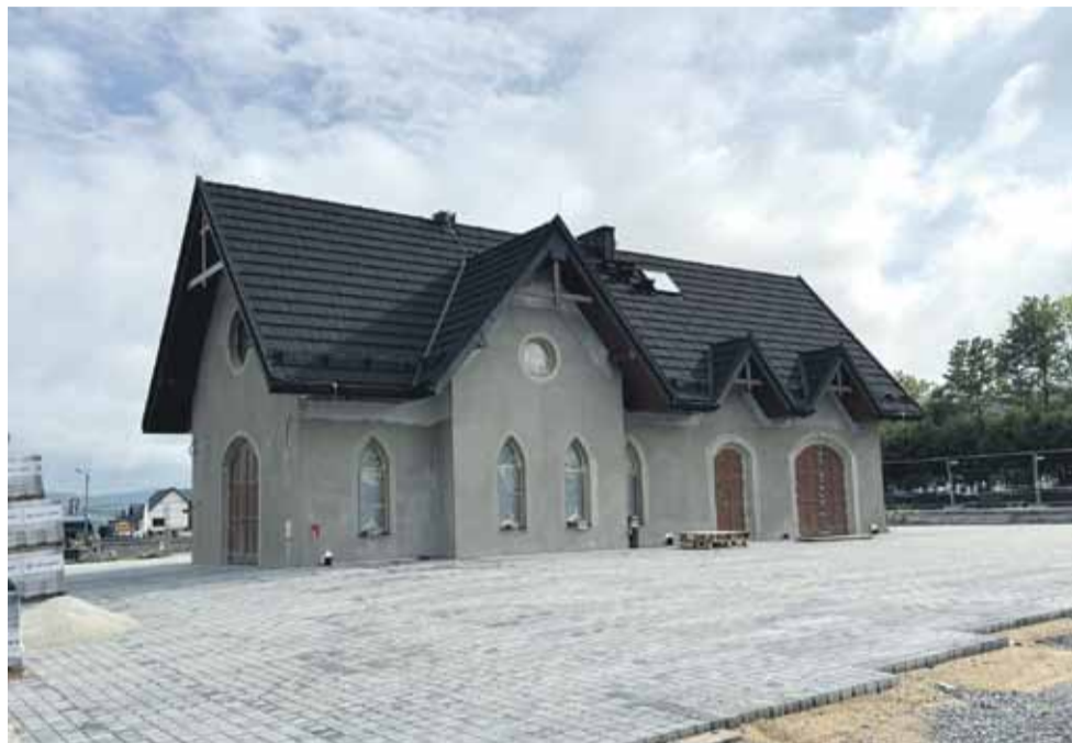
Nowa kaplica już niemal gotowa.