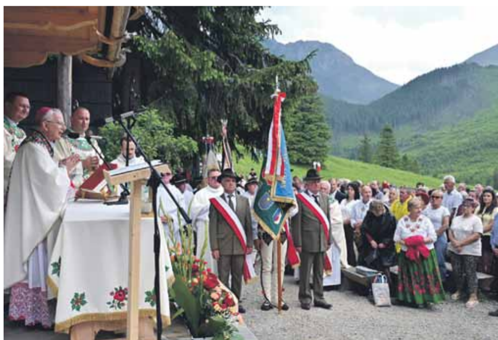
Uczestnicy świętowania na Chochołowskiej nie przestraszyli się pogody.

Jędraszewski. Hierarcha poświęcił nowy sztandar z okazji 206-lecia Wspólnoty Leśnej Uprawionych 8 Wsi w Witowie, która zarządza tamtejszą częścią Tatr.