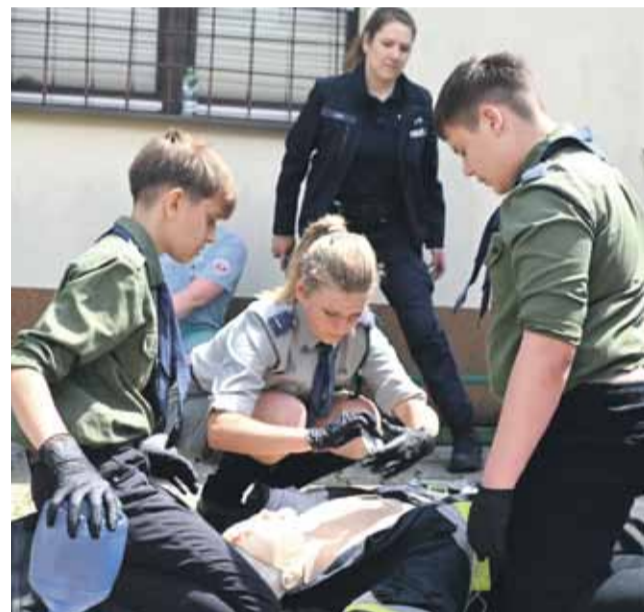
Poszczególne reprezentacje musiały poradzić sobie z różnymi zadaniami.

Kolejnym zadaniem było opatrzenie rannego, która bardzo krwawiła. Na uczestników konkursu „Jestem gotów do pomocy” czekał też ledwo siedzący uczeń na podłodze w szkolnej toalecie, którego można było podejrzewać o bycie pod wpływem narkoty-