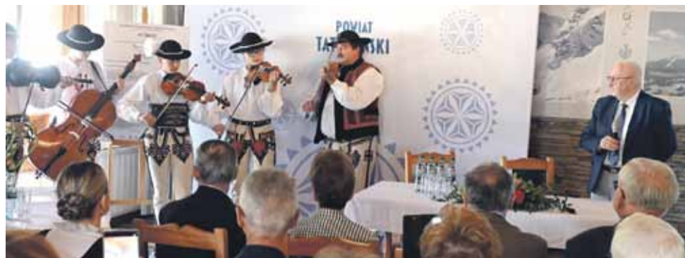
Przygrywała między wystąpieniami kapela regionalna.