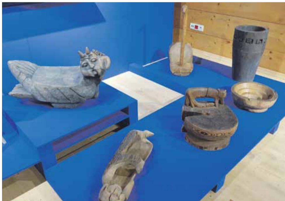
Meblorzeźby sprzed lat robią wrażenie