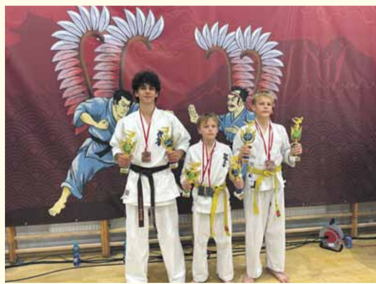
Łącznie reprezentanci SSK Yokozuna wywalczyli sześć medali mistrzostw Polski.

Znakomicie zaprezentowali się reprezentanci Nowotarskiego Stowarzyszenia Sportowego Karate Yokozuna podczas Mistrzostw Polski Karate Kyokushin, które 20 czerwca odbyły się w Mińsku Mazowieckim. Zawodnicy z Nowego Targu wrócili z tej prestiżowej imprezy z dorobkiem aż sześciu medali.