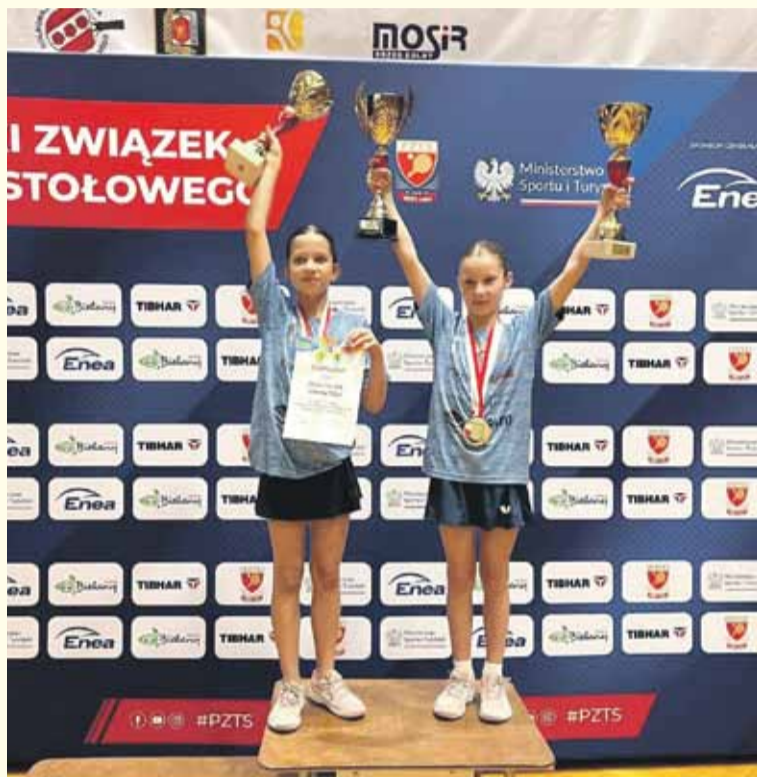
Dwa złote i brązowy medal – to dorobek naszych młodych tenisistek stołowych w Mistrzostwach Polski Żaków.