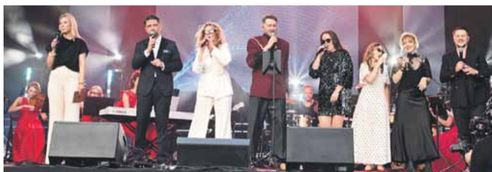
Artyści zostali ciepło przyjęci przez publiczność.