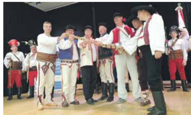
Laska Zjazdu Karpackiego została przekazana Wałachom z Morawskiej Wołoszczyzny.

Zjazd zapoczątkowała konferencja poświęcona ochronie dziedzictwa przyrodniczego i kulturowego w regionach górskich Karpat. W drugim dniu odbył się zbór baców. To było spotkanie pasterzy i hodowców owiec z Karpat. Odsłonięto tablicę pamiątkową Szlaku Kultury Wołoskiej. W programie znalazło się seminarium „Kultura pasterska w Karpatach”. Uczestnicy im-