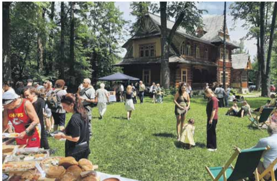
W niedzielę zaroilo się od łasuchów pod Kolibą

Prawdziwym kulinarnym hitem okazało się malinowe masło podawane na chrupiącym chlebie. Produkt przywieziony z Opola Lubelskiego wzbudził tak duże zainteresowanie, że jego