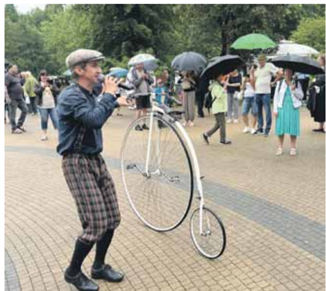
Stowarzyszenia „Dawnej Rabki Czar” od ośmiu lat organizuje w Rabce słynne retro-pikniki.

pięknie odziani letnicy w strojach z epoki, gdy zdroj był miejscem znanym w całej Europie. Na ulice wyjechały wspaniałe, błyszczące w słońcu stuletnie automobile i oryginalne bicykle.