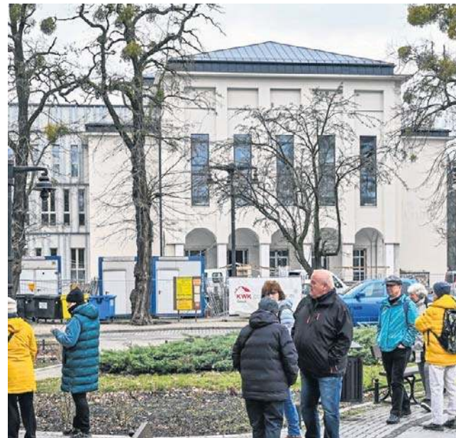
Z zewnątrz budynek od miesięcy prezentuje się dobrze, ale w środku jest jeszcze nad czym pracować

- Inwestycja jest na ostatnim etapie. W marcu br. wprowa-