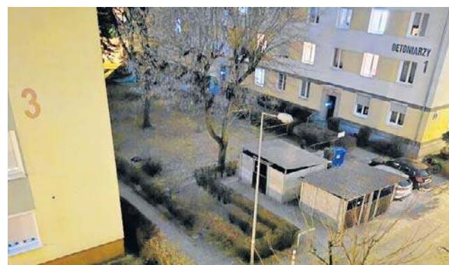
Ciemno na bydgoskich Kapuściskach. Zgłoszenie w tej sprawie dostaliśmy od naszego Czytelnika

„Kilka osiedlowych latarni zostało wyłączonych „w związku z oszczędnościami”. Niestety, jedna z latarni przy blokach na ulicy Nokowskiego 2 a Betoniarzy 3 realnie wpływa na bezpieczeństwo pieszych. Otóż do jezdni (droga osiedlowa) bezpośrednio dochodzi chodnik, m.in. od przedszkola.