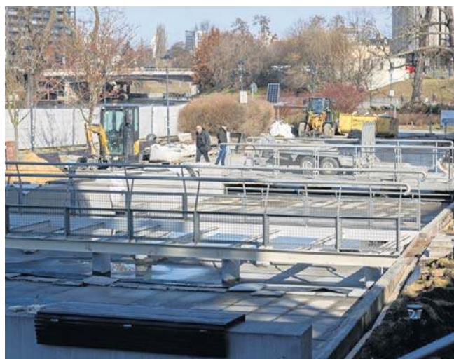
Aktualnie trwa drugi etap robót przy rewitalizacji Wyspy Młyńskiej w Bydgoszczy

Jak dodano, równocześnie prowadzone są roboty związane z modernizacją istniejącego oświetlenia. Nowe rozwiązanie pozwoli efektywniej doświetlić tereny rekreacyjne oraz charakterystyczne obiekty, a dodatkowo technologia LED zapewni ograniczenie zużycia energii. ©