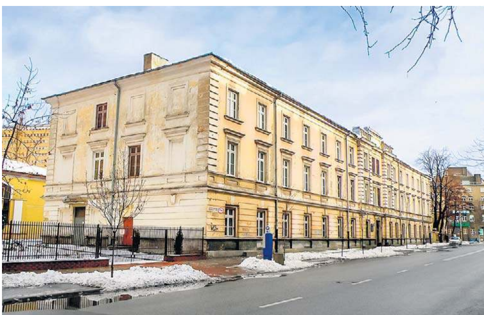
Ulica Koszykowa 82 w Warszawie. Tu w latach 1946-1950 mieścił się Wojskowy Sąd Rejonowy. Wydano w nim 878 wyroków, 328 wykonano