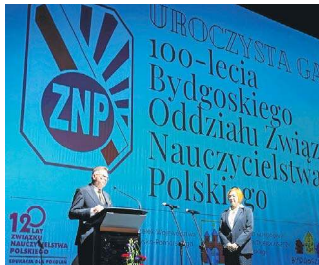
Parę dni po świętowaniu 100-lecia istnienia, radni zdecydowali, że bydgoski oddział ZNP otrzyma Medal Kazimierza Wielkiego