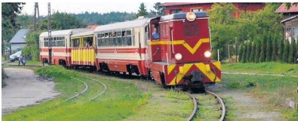
Pociąg Żuławskiej Kolei Dojazdowej wjeżdża na dworzec w nadmorskiej Steganie

Liczący około 30 km odcinek między Nowym Dworem Gdańskim a położonym nad morzem Stegną, Sztutowem, Jantarem i Mikoszewem to pozostałość po rozbudowanej mocno w tej części Pomorza