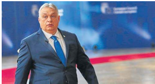
Na ostatnim szczycie UE w Brukseli 25 państw unijnych, bez Węgier i Słowacji, poparło dalsze wsparcie Ukrainy

Wcześniej, reagując na przerwanie dostaw rurociągiem Przyjaźń, Węgry i Słowacja uwolniły swoje strategiczne rezerwy ropy naftowej, wstrzymały dostarczanie oleju napędowego do Ukrainy oraz zagroziły wstrzymaniem przesyłu energii elektrycznej. Budapeszt blokuje również 20. pakiet sankcji UE wobec Rosji oraz unijną pożyczkę dla Kijowa o wartości 90 mld euro. PAP