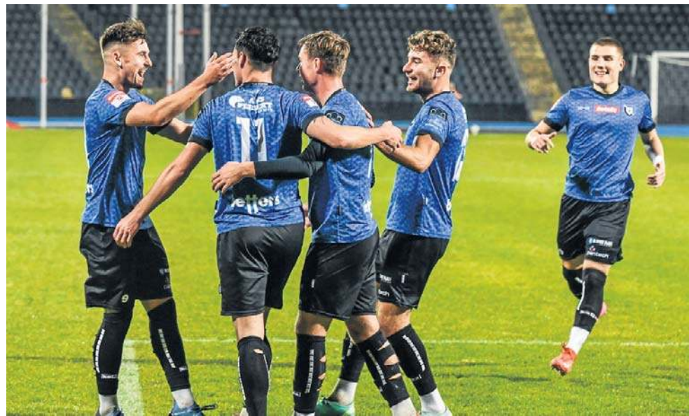
Piłkarze Zawiszy mają powody do zadowolenia. Są w 1/4 finału K-PZPN

Przypomnijmy, że Zawisza broni trofeum. ©©