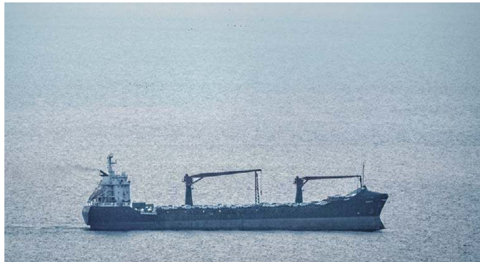
Iran domaga się myta za płynięcie Cieśniną Ormuz. Tym szlakiem przed wojną transportowano około 20 procent światowej ropy i gazu

Żądania Iranu dotyczą także kluczowej pod względem strategicznym Cieśniny Ormuz. Ajatollahowie chcą, by statki przepływające przez nią płaciły im myto. Przesmyk ten był przed rozpoczęciem wojny drogą dla 20 procent światowego transportu ropy naftowej.