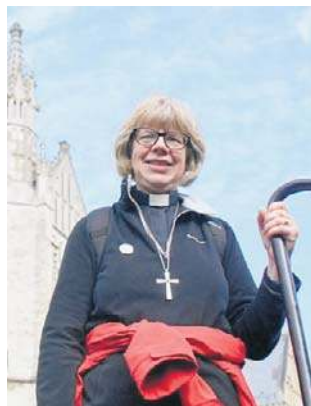
Sarah Mullally, arcybiskup Canterbury

Nowa arcybiskup od 1980 roku pracowała jako pielęgniar-ka, a w 1999 roku została najmłodszą w historii Pierwszą Pielęgniarką Kraju, czyli główną doradczynią rządu ds. pielęgniarstwa. Wciąż pełniąc tę funkcję, w 2002 roku została duchowną kościoła anglikańskiego.