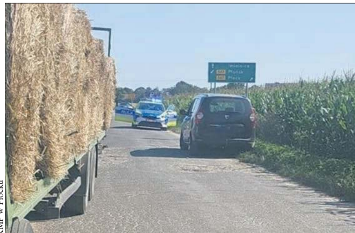
Policjant zatrzymał na drodze pijanego kierowcę

Policjanci apelują, by reagować na każdy przypadek nietrzeźwego kierowcy za kółkiem. To potencjalne zagrożenie dla życia i zdrowia innych uczestników ruchu drogowego. A tego typu podejrzaną sytuację na drodze można zgłaszać, dzwoniąc pod numer alarmowy 112. BS