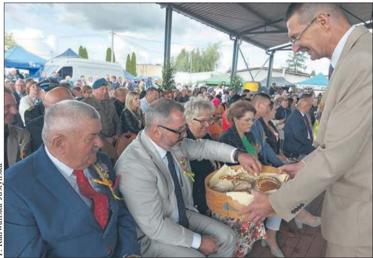
Niedzielnym elementem dożynkowych uroczystości było dzielenie chlebem wypieczonym z tegorocznych plonów