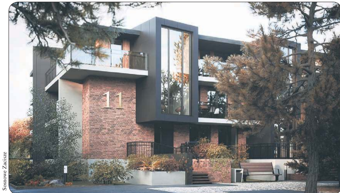
Tak będzie wyglądało Sosnowe Zacisze w Soczewce

Znajdzie się w nim coś zarówno dla miłośników długich leśnych spacerów czy zbierania grzybów, jak i dla wielbicieli sportów ekstremalnych – uprawiający downhill. Wszyscy będą zadowoleni z porośniętych drzewami terenów polodowcowych nadających