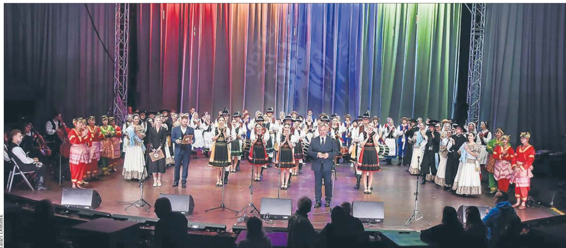
Wszyscy uczestnicy 13. Vistula Folk Festival na scenie amfiteatru