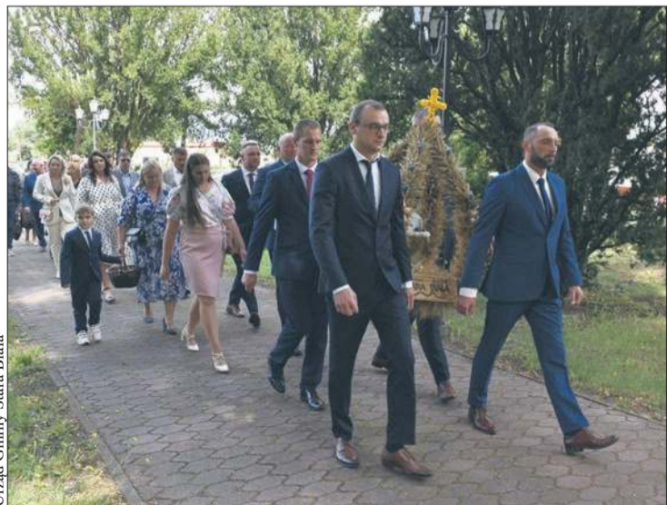
Uroczystości dożynekowe w gminie Stara Biała

Skuteczne wykorzystanie środków europejskich