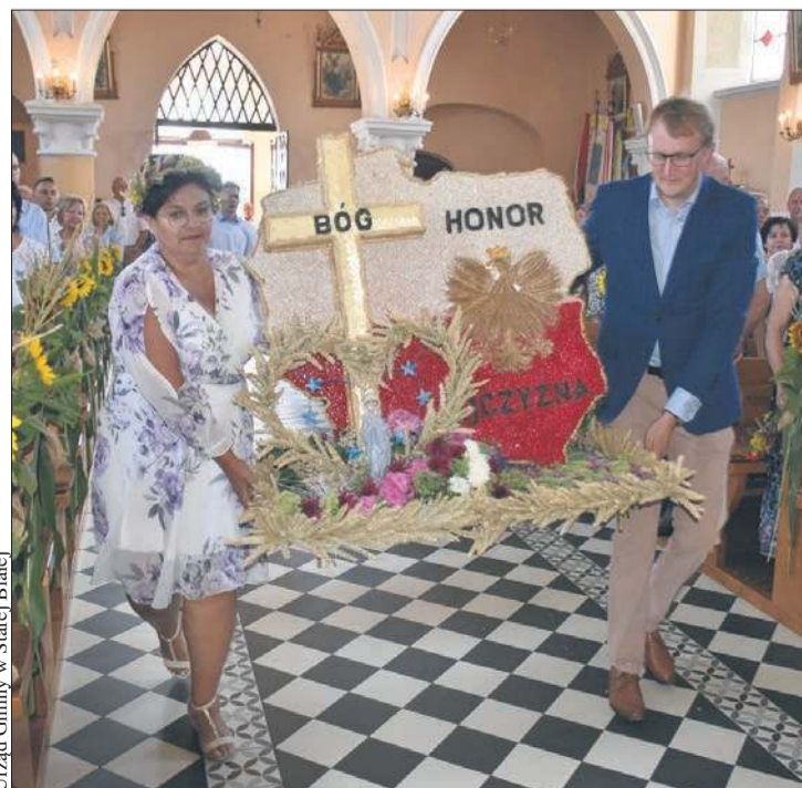
Urząd Gminy w Starej Białej

„Dożynkowy piknik rodzinny” w Proboszczewicach