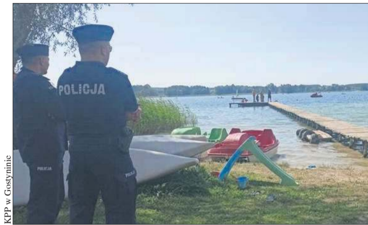
KPP w Gostyninie

W wyniku kontroli wobec rowerzystów zastosowano 159 środków prawnych: 76 mandatów, 73 pouczenia i 10 wniosków o ukaranie do sądu. W przypadku użytkowników hulajnog elektrycznych podjęto 86 działań, w tym