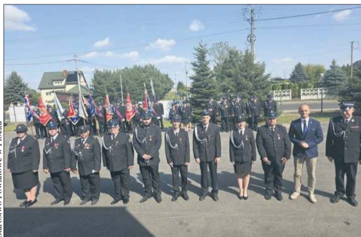
Starostwo Powiatowe w Płocku