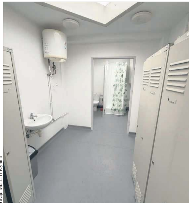
W wakacje przeprowadzono remonty w gostynińskich obiektach sportowych

* Źródło: Urząd Miasta Gostynina Opr. (kw)