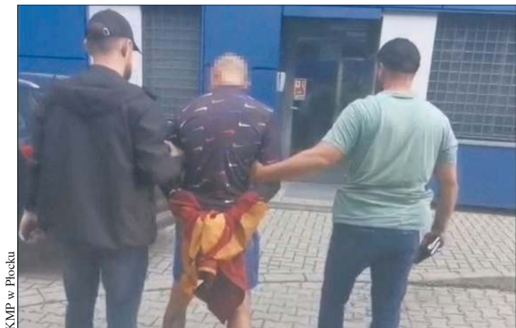
KMP w Płocku