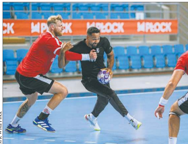
SPR Wisła Płock

W sobotnie popołudnie w One Veszprém Arenie odbyło się starcie dwóch mistrzów swoich krajów. W sparingu zagrały drużyny ONE Veszpremi i ORLEN Wisła Płock. Wygrali gospodarze – 31:29.