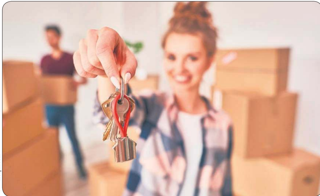
Odbiór kluczy do własnego mieszkania to jeden z najważniejszych momentów w życiu

Nie można zapominać, że ta decyzja ma również wymiar emocjonalny. Wybierając mieszkanie, wybieramy jednocześnie miejsce, które będzie świadkiem naszych codziennych radości, wyzwań i sukcesów. To w nim będziemy spędzać czas z bliskimi, odpoczywać, rozwijać pasje i przechowywać najcenniejsze wspomnienia. Właśnie dlatego zakup nowego lokum warto traktować