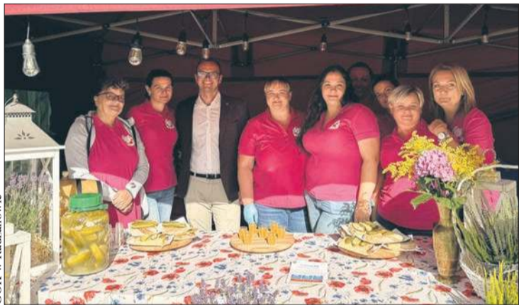
Jedną z atrakcji Dni Radzanowa była strefa gastronomiczna

To był wyjątkowy weekend w Radzanowie. Po raz drugi mieszkańcy gminy bawili się na Dniach Radzanowa. Wydarzenie zorganizował Gminny Ośrodek Kultury w Radzanowie.