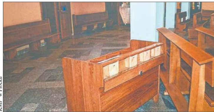
Zdjęcia z miejsca kradzieży w kościele św. Józefa w Płocku

Policjanci dziękują wszystkim osobom, które po publikacji materiału rozpoznały sprawcę i przekazały informacje. BS