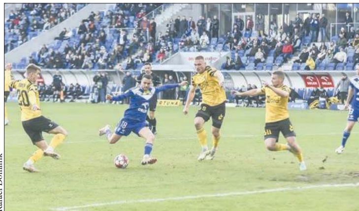
W zeszłym sezonie w meczach 1. ligi Nafciarze najpierw przegrali 4:1 na wyjeździe, a następnie pokonali GKS Katowice na ORLEN Stadionie 2:1