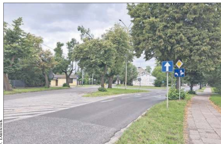
Czas na remont ulicy Wyszogrodzkiej

W ubiegłym tygodniu zostały otwarte oferty dodatkowe, które