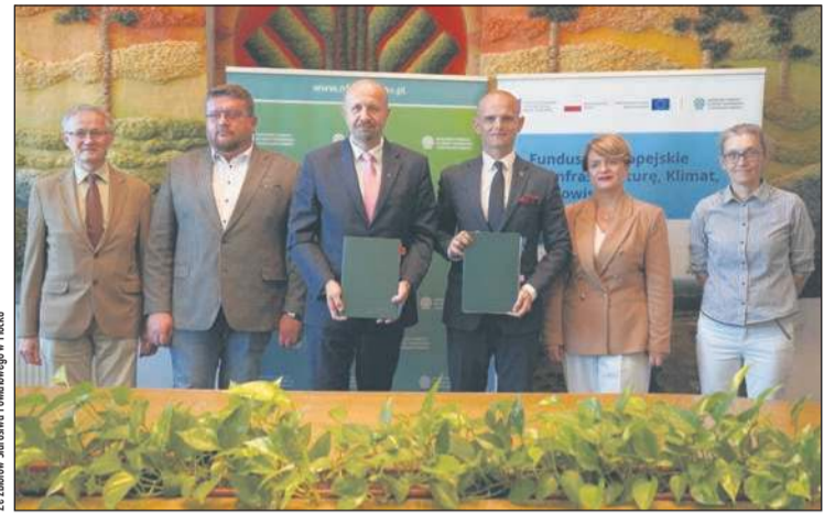
W ubiegłym tygodniu w siedzibie NFOŚiGW przedstawiciele Powiatu Płockiego podpisali umowę na dofinansowanie renowacji parku wokół DPS w Goślicach

zbiorników wodnych zostaną zasadzone nowe rośliny, a na ich powierzchni umiejscowione będą platformy dla ptactwa wodnego. Zieleń parkowa zostanie uzupełniona o rodzime gatunki, rośliny miododajne oraz dzikie odmiany jabłoni i gruszy. Powstaną ogrody terapeutyczne zasilane wodą opadową, dzięki zastosowanym rozwiązaniom opartym na przyrodzie. Zaplanowano system przejść dla drobnych zwierząt oraz utworzenie nowych miejsc dla bytowania ptaków, płazów i owadów.