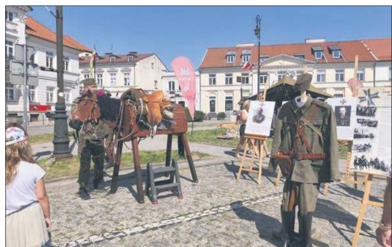
Stoisko członków Stowarzyszenia Jeździeckiego im. 4 Pułku Strzelców Konnych Ziemi Łęczyckiej