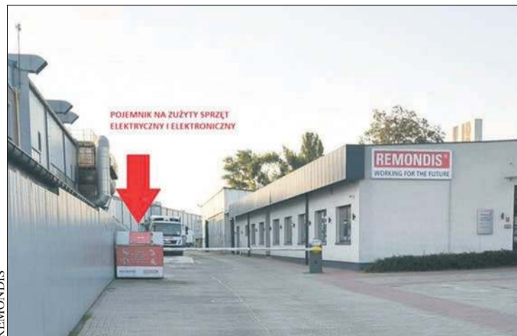
Przy siedzibie firmy REMONDIS można oddać elektroodpady