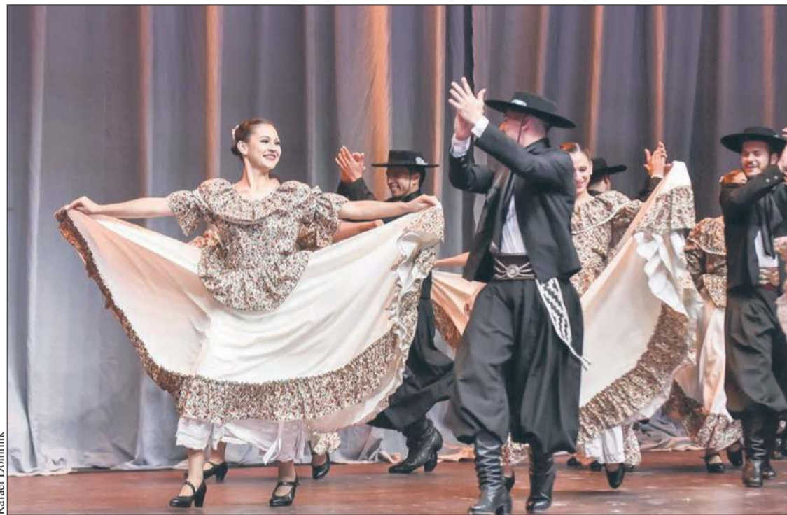
Zespół z Argentyny