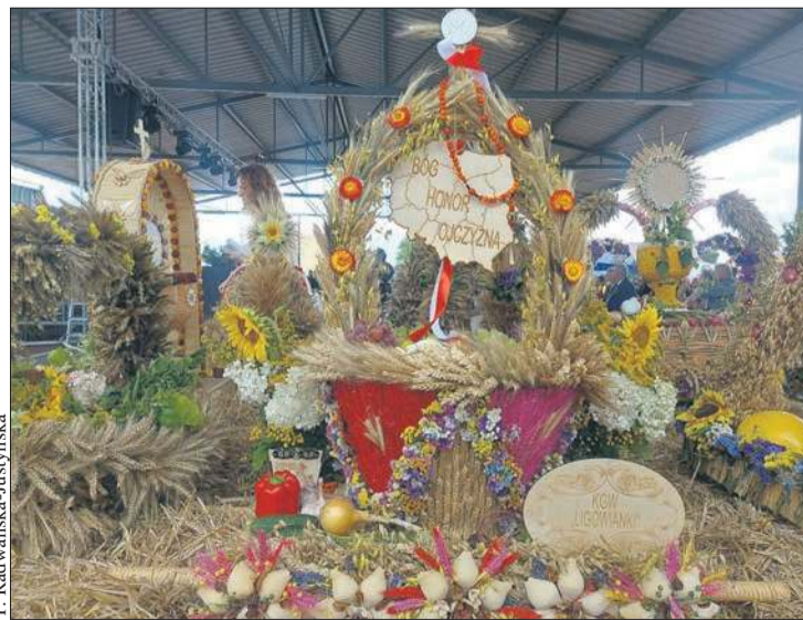
Podczas dożynek gminnych w Mochowie zaprezentowano aż 13 wieńców przygotowanych przez sołectwa i KGW