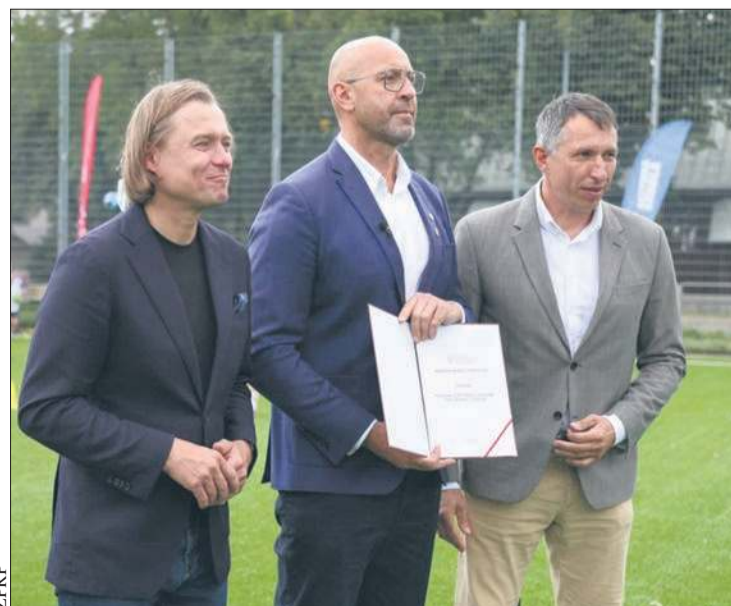
Dokument został podpisany, plany zostaną wdrożone w życie