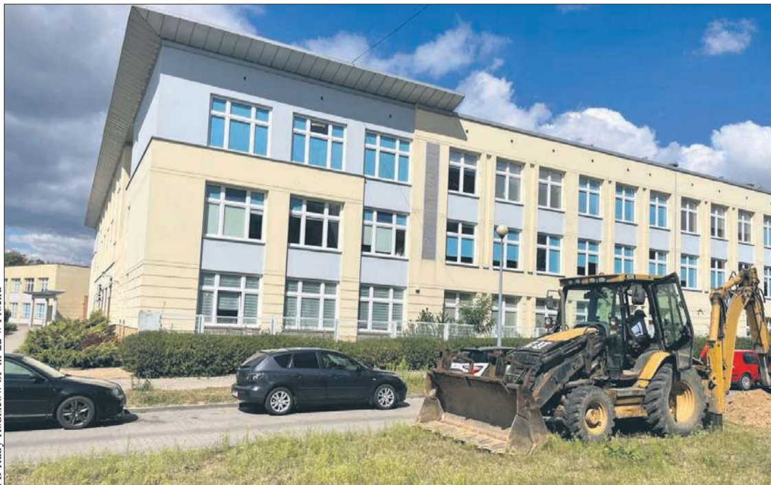
Przy Szkole Podstawowej nr 22 w Płocku na osiedlu Podolszyce Południe powstaje strefa „Kiss &amp; Ride”

– Dzięki tej udanej współpracy udało się stworzyć rozwiązanie, które przyniesie korzyści całej naszej szkolnej społeczności – informuje Rada Rodziców. Z pewnością zadowoleni będą również mieszkańcy sąsiadujących ze szkołą bloków. Zwiększy się nie tylko bezpieczeństwo uczniów, ale też komfort ruchu na osiedlowych uliczkach, zwłaszcza w godzinach porannych. BS