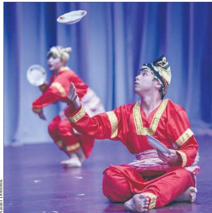
Zespół z Indonezji