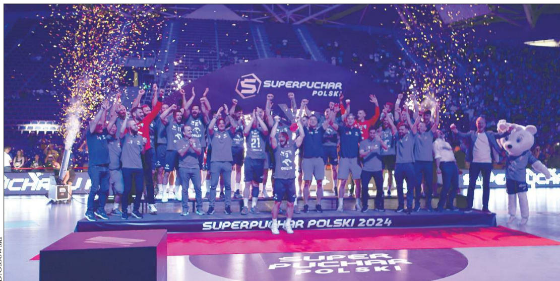
Drużyna ORLEN Wisły z Superpucharem 2024

ściu łódzkich halach. To kolejny event promujący piłkę ręczną w mieście, po czerwcowym Łódzkim Festiwalu Piłki Ręcznej, który zgromadził około 400 młodych adeptów tej wyjątkowej dyscypliny. Serdecznie zapraszam do Atlas Areny wszystkich mieszkańców i gości do wspólnego świętowania i kibicowania najlepszym zawodnikom.