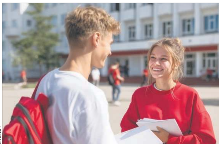
Podczas dotychczasowych 16. edycji programu stypendia „Mam pasję powyżej średniej” otrzymało prawie 3200 uczniów

Po raz 17. Fundacja ORLEN nagrodzi uczniów mających wielkie pasje, wielkie talenty i super osiągnięcia. Stypendia przyznawane są w ramach fundacyjnego programu „Mam pasję powyżej średniej”, skierowanego do dzieci i młodzieży z Płocka i powiatu płockiego. To ostatnia chwila, by powalczyć o stypendium Fundacji ORLEN i dołączyć do grona blisko 3200 stypendystów. Uczniowie na zaprezentowanie swoich pasji i aplikację o stypendium mają czas do 29 sierpnia!