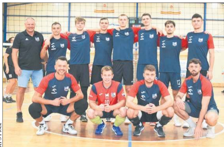
Drużyna KPS Płock w sezonie 2024/25 wywalczyła utrzymanie w rozgrywkach. Jak będzie w tym sezonie?

Zespoły II ligi II grupy rozpoczną sezon 27 września. Na początek KPS zagra na wyjeździe, w Wyszku. Kibice będą mogli obejrzeć zmagania swojej drużyny tydzień później, 4 października, w pojedynku z SwK KARTPOL Kobyłka. Wstęp na mecze siatkówki w Blaszaku jest wolny, a na sympatyków czeka zwykle wiele atrakcji.