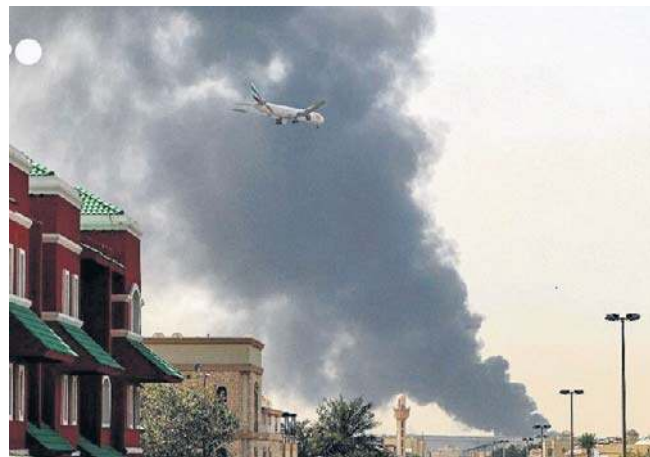
Amerykany nigdzie nie mogą czuć się bezpiecznie. Pokazał to irański atak na ambasadę USA w Bagdadzie

To kolejny atak na ambasadę USA w Iraku. W sobotę placówka została trafiona przez irański pocisk rakietowy. W poniedziałek wieczorem w pobliżu budynku ambasady doszło do ataków i wybuchów. Z powodu uderzenia drona wybuchł pożar na dachu hotelu w pobliżu placówki, ale nie spowodował on strat i szkód. PAP