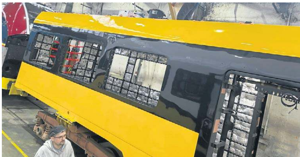
W hali Pesy powstają pociągi dla RegioJet. Obecnie są na różnych etapach zaawansowania produkcji. Gotowy pojazd przechodzi testy homologacyjne w Czechach

Jak już pisaliśmy, Radim Jančura, w 100 procentach właściciel RegioJet powiedział, że jest gotowy do zlecenia w Polsce (w Bydgoszczy) produkcji kolejnych pojazdów w ramach