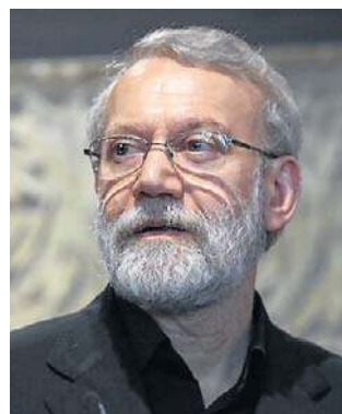
Ali Laridżani był jednym z najważniejszych irańskich polityków

– Laridżani i przywódca Basidż zostali wyeliminowani w nocy (z poniedziałku na wtorek - PAP) i dołączyli do przywódcy programu zagłady (poprzedniego najwyższego przywódcy duchowo-politycznego Iranu, ajatollaha Alego) Chameneiego, i wszystkich innych wyeliminowanych członków osi zła, w piekło – powiedział Israel Kac, minister obrony narodowej Izraela.