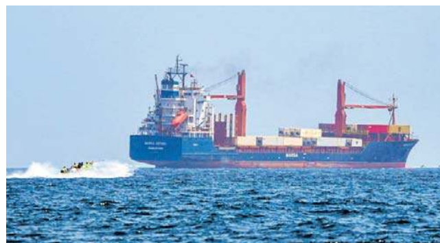
Większość sojuszników USA jest niechętna interwencji w Cieśninie Ormuz

Potwierdził to także kanclerz Friedrich Merz. – Brakuje mandatu ONZ, Unii Europejskiej lub NATO, wymaganego zgodnie