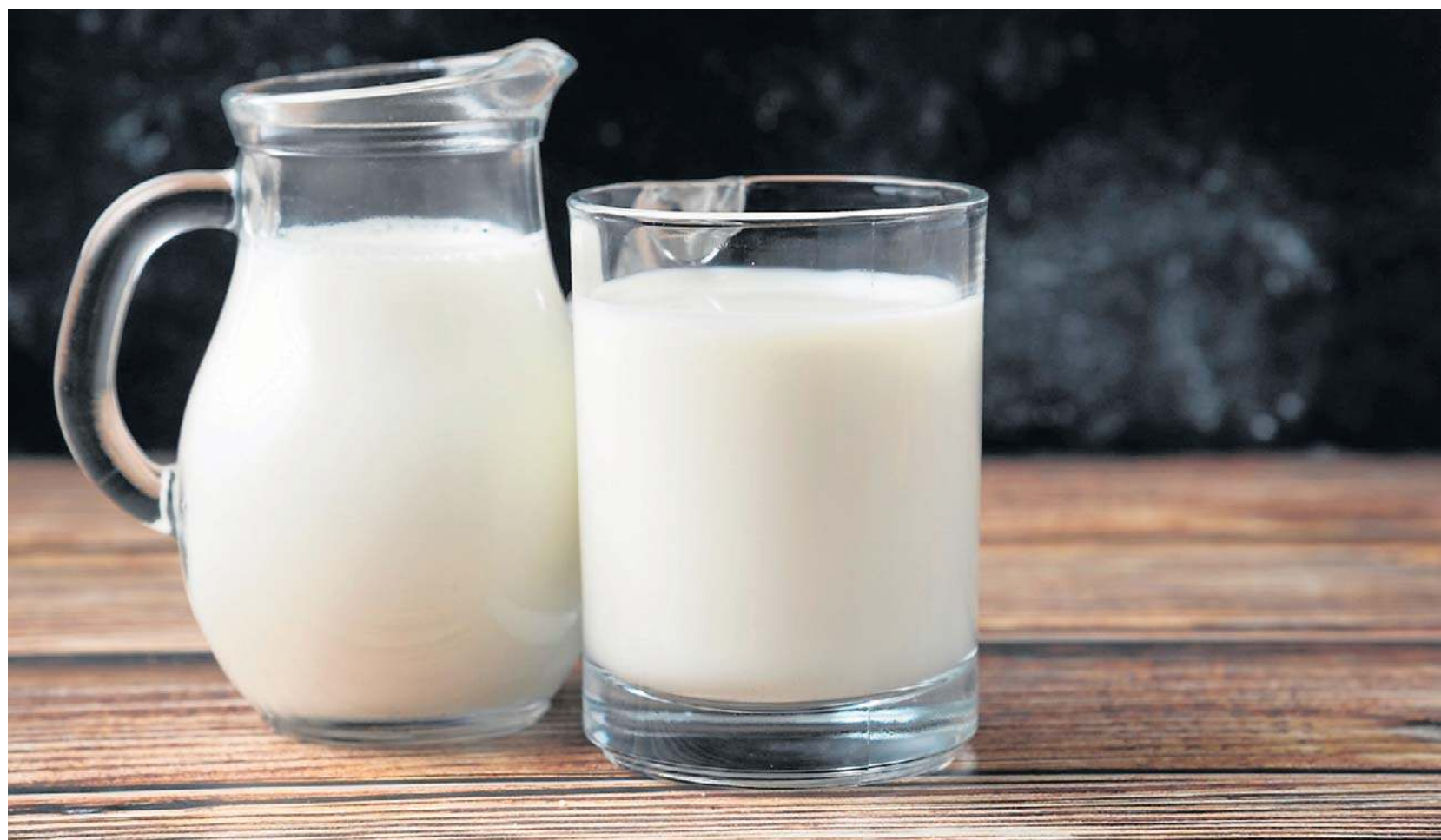
W utrzymaniu nawodnienia mleko okazało się bardziej skuteczne niż woda

Jeszcze bardziej kompleksowe było badanie z 2016 roku, opublikowane w American Journal of Clinical Nutrition, w którym porównano 13 różnych napojów