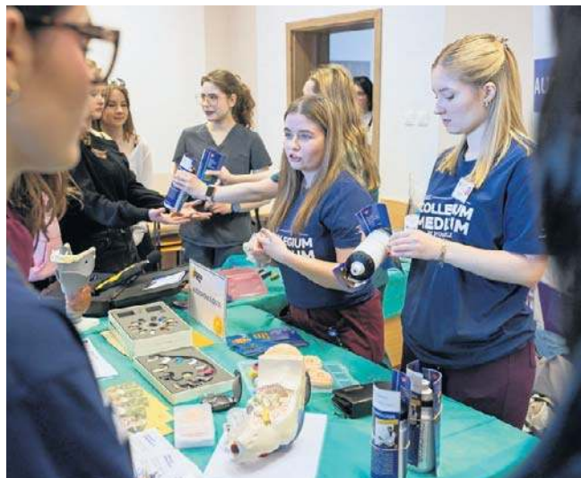
W czasie drzwi otwartych w Collegium Medicum UMK dla uczestników przygotowano wiele warsztatów