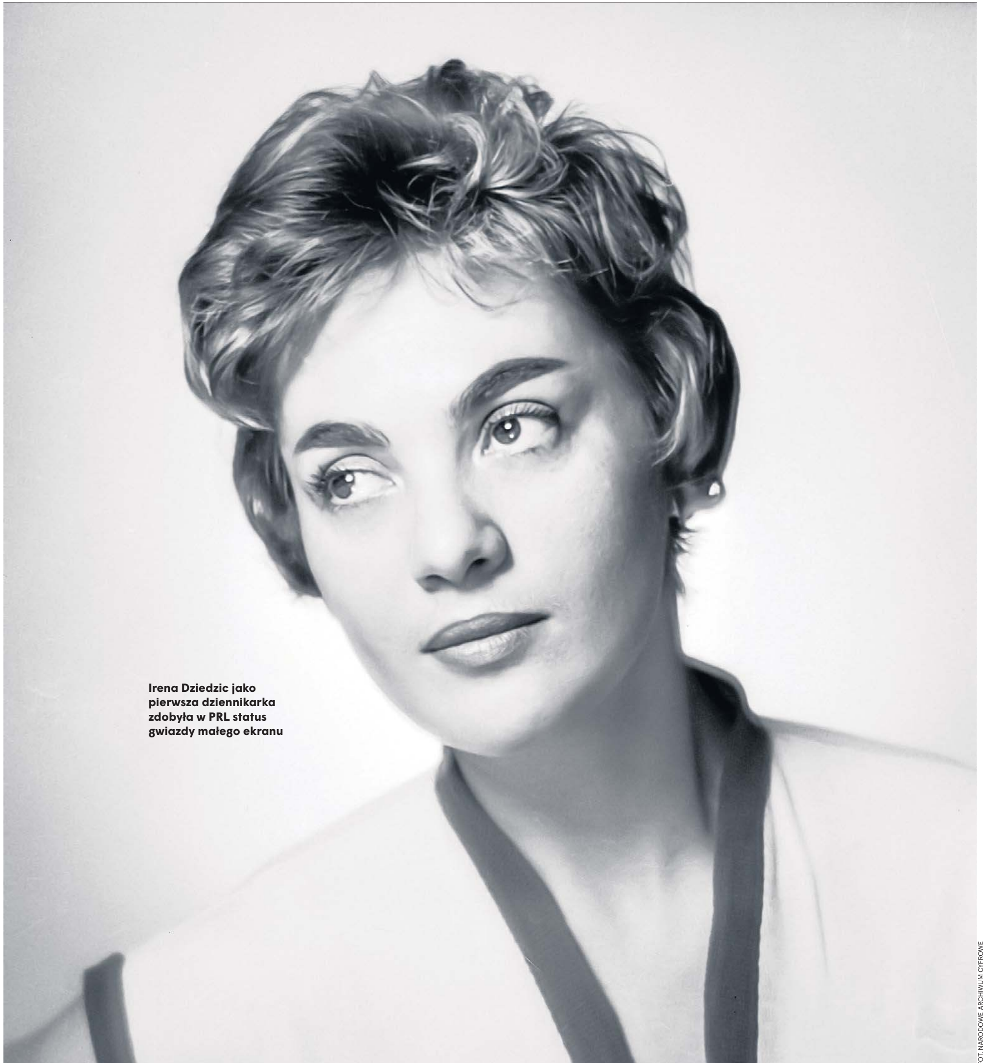
Irena Dziedzic jako pierwsza dziennikarka zdobyła w PRL status gwiazdy małego ekranu