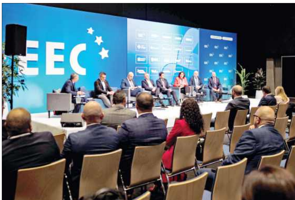
■ EKG 2025 to liczne panele dyskusyjne z udziałem specjalistów i praktyków wielu dziedzin

Tuskiem widzi dla niej nowe funkcje strategiczne i geopolityczne, bo Rafako ma się przebranzowić i wejść w przemysł zbrojeniowy.