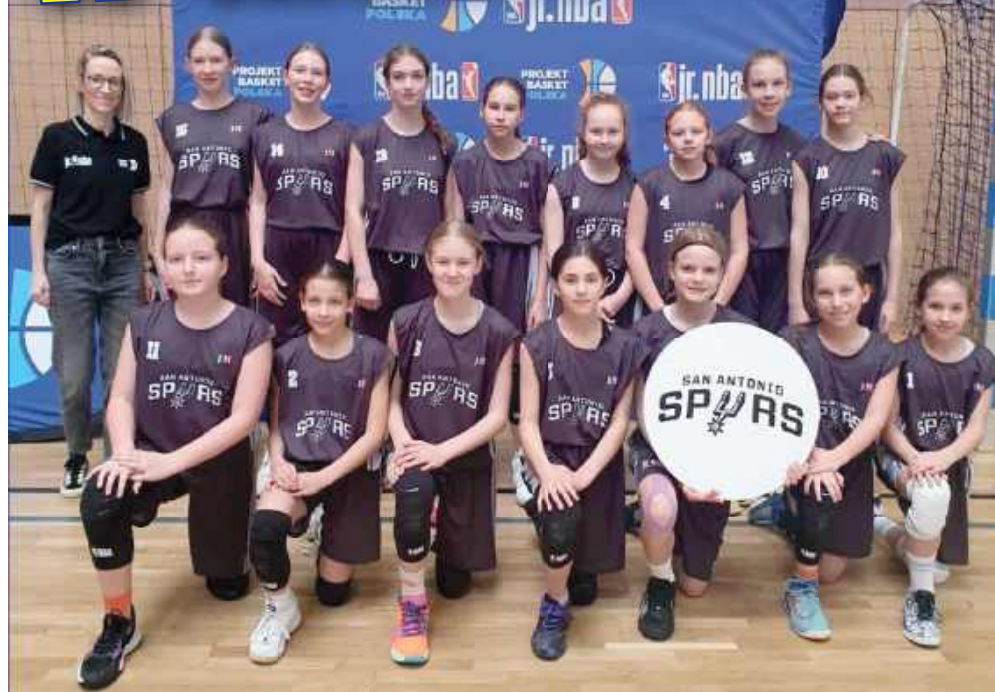
■ Drużyna, która powalczy o podium tegorocznej edycji NBA Junior Girls w Katowicach

24 maja drużyna Mini Basketball Racibórz zagra w Katowicach w wielkim finale ligi JUNIOR NBA o 3 miejsce.