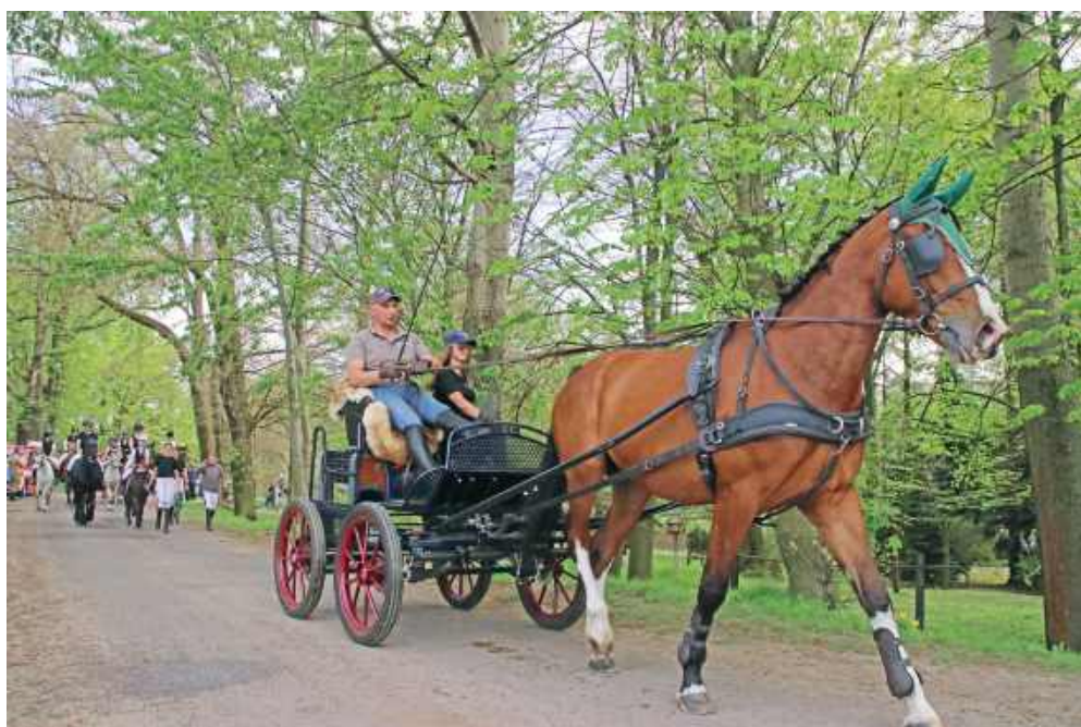
■ Procesja odbyła się w Wielkanocny Poniedziałek 21 kwietnia

Herud wierzy, że tradycja Wielkanocnej Procesji Konnej w Pietrowicach Wielkich będzie kontynuowana. – Myślę, że będzie trwać na wieki, wieków, amen – dodał. W tegorocznej procesji uczestniczył na pięcioletniej klaczy o imieniu Beti. (mad)