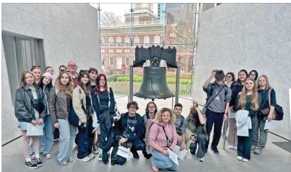
■ Raciborzanie przyjrzeni się z bliska amerykańskiej historii

ju – Filadelfią. – Tam ulice były pustawe, sklepy pozamykane, a im dalej od centrum, tym bardziej robiło się nieciekawie – przyznają uczestnicy wyjazdu.