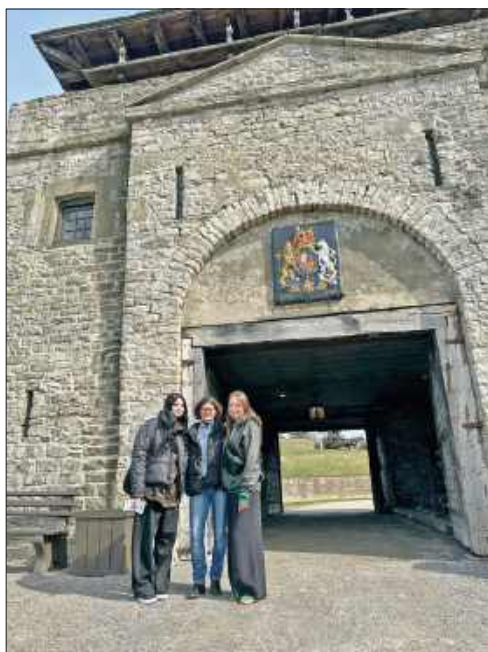
■ Przed zabytkowym fortem na granicy amerykańsko-kanadyjskiej

Jeśli chodzi o kontrasty, to wycieczkowiczów uderzyła różnica między tętniącym życiem Nowym Jorkiem, a historyczną stolicą kra-