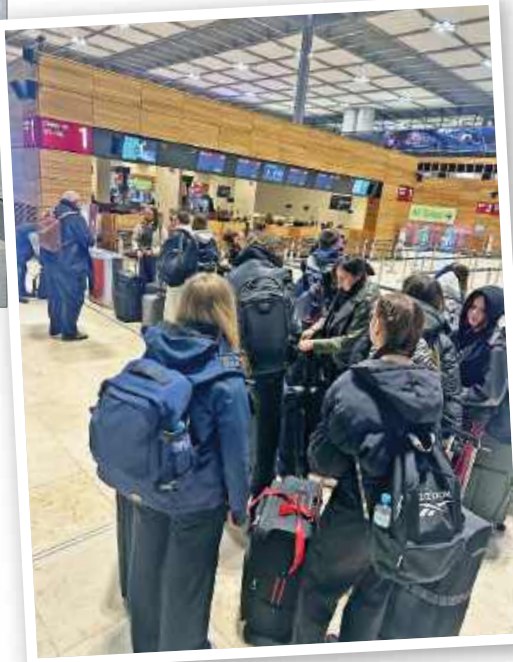
■ Powrót ze Stanów był łatwiejszy niż wyjazd. Początkowo obawy budziła nawet rozmowa z celnikiem