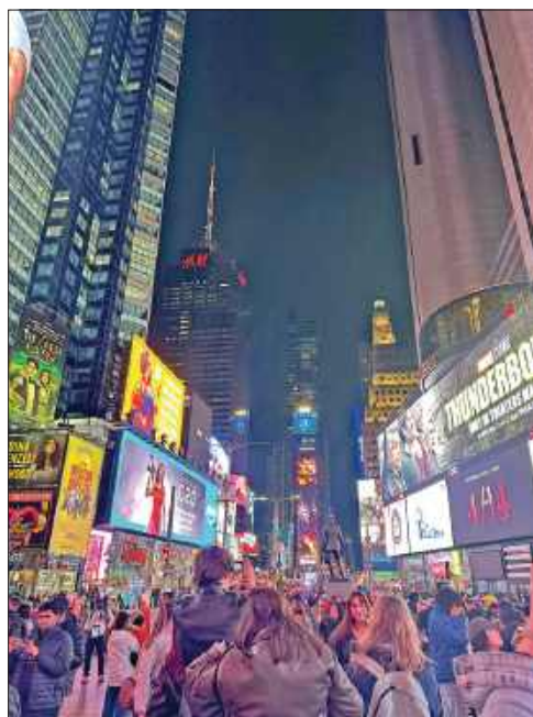
■ Na Time Square było jak w filmie