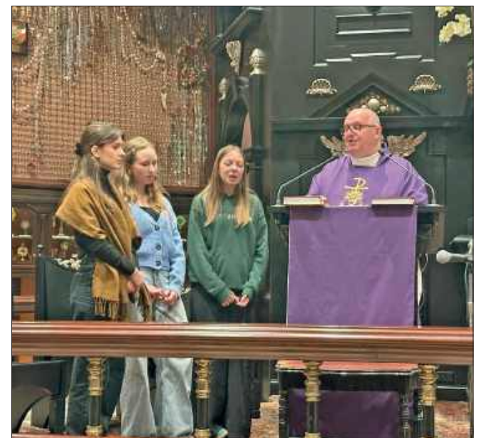
■ Polska msza w amerykańskiej Częstochowie