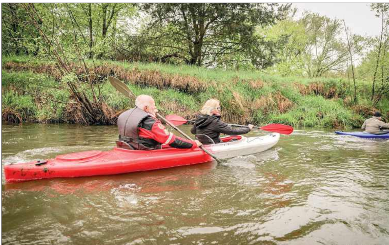
■ Rzeka Ruda niezmiennie przyciąga kajakarzy i cieszy się ogromnym zainteresowaniem