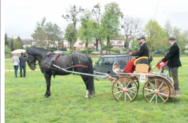
■ Kadr z wydarzenia z 2019 roku – ostatniej Majówki Konnej w Kornicach. Kolejna odbędzie się już w tym roku.

Majówka Konna wraca do Kornic po kilku latach przerwy. W programie przejażdżka bryczką, zawody i zabawa do późna