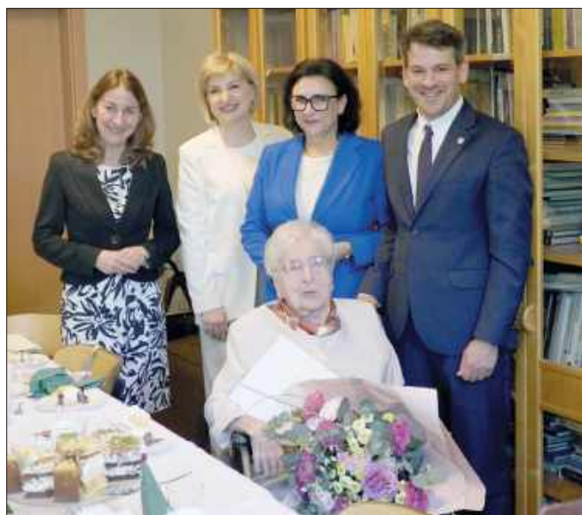
■ Jubilatkę odwiedzili przedstawiciele władz Miasta i Powiatu

Europejski Kongres Gospodarczy to wielka impreza dla biznesu i polityki. Zawitała do stolicy Śląska, region chciał pokazać się licznym gościom z różnych stron świata. Było też stoisko raciborskie. Wyróżniało się cukierkami z Mieszka i piwem Browaru Zamkowego. Słodkości i złocisty napój rozchodziły się szybko. Od obsługi stoiska dowiedziałem się, że wiele osób kojarzy smaki Mieszka, ale nie wie, że to firma z Raciborza. Cóż, Michaszki czy praliny nie mają w nazwie nic wspólnego z naszym miastem. Z piwem jest znacznie łatwiej, jeśli chodzi o nazwę. Pomyślałem, że samorząd mógłby postarać się o ściślejszą współpracę z producentem słodczy i postawić na wspólną promocję, być może jakiś nowy produkt skojarzony z Raciborzem. Na przykład obok Zozoli mogłyby się pojawić Raciborki. Pole do popisu jeśli chodzi o pomysły jest szerokie. Do słodkiej współpracy składania przeszłość urzędu miasta, który dawniej był fabryką czekolady. Mieszko właśnie inwestuje w Racibórz spore środki, budując nową fabrykę. Szkoda stracić taką okazję. Bo inaczej zostanie nam tylko gorycz i to nie ta związana z piwem.