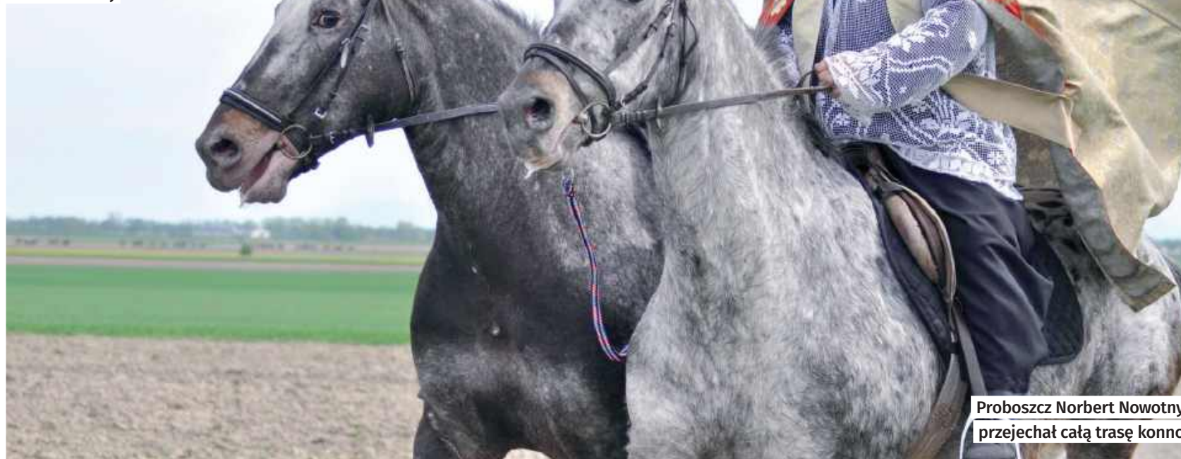
Proboszcz Norbert Nowotny przejechał całą trasę konno