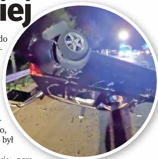
■ BMW dachowało na łuku drogi w Bolesławiu.

Na podstawie zgromadzonego materiału dowodowego, śledczy szczegółowo ustalą okoliczności i przebieg zdarzenia drogowego. (red)