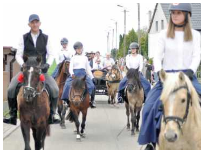
■ W procesji można było podziwiać 78 koni