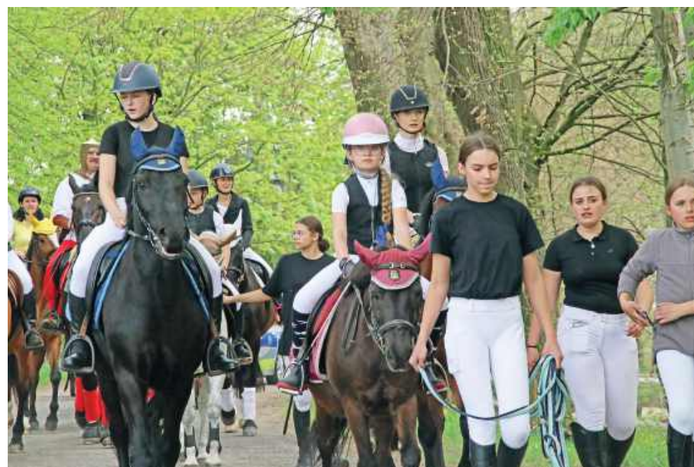
■ Organizatorzy doliczyli się 89 koni biorących udział w tegorocznej procesji