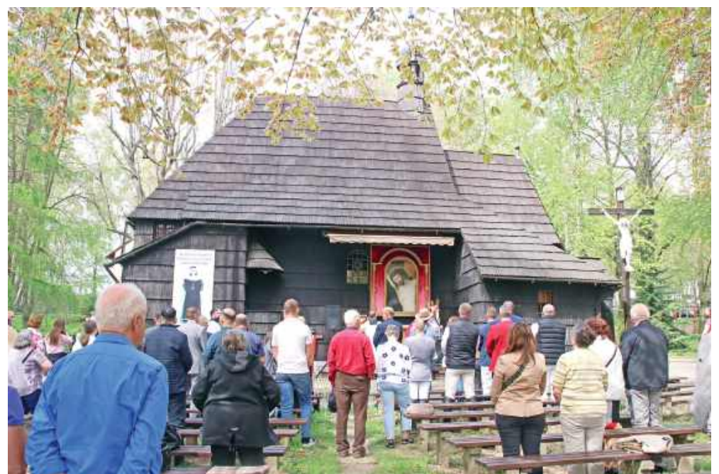
■ Tradycyjnie przy drewnianym kościółku pw. św. Krzyża odbyło się nabożeństwo