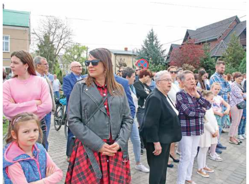
■ Wydarzenie cieszyło się sporym zainteresowaniem nie tylko mieszkańców gminy, ale także spoza niej

– W czasie procesji będziemy o nim pamiętać. To tradycja chrześcijańska, dlatego chcemy uczcić go