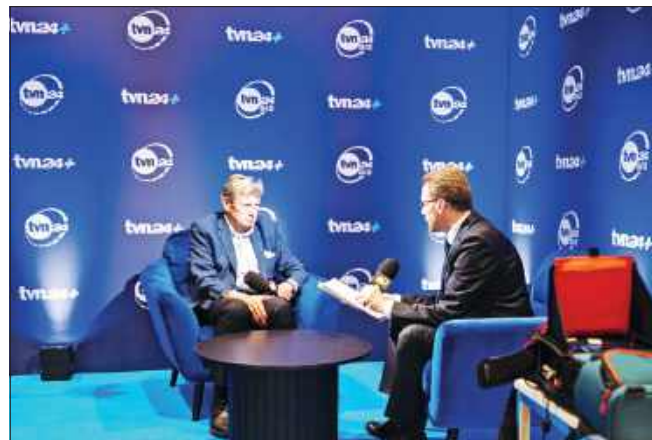
■ Wśród gości znalazł się słynny ekonomista Leszek Balcerowicz