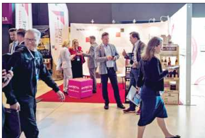
■ Stoisko Miasta Racibórz z ofertą inwestycyjną, cukierkami Mieszka i piwem Browaru Zamkowego