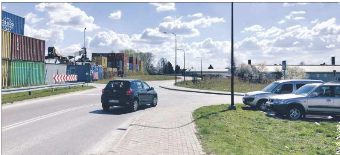
Na skrzyżowaniu ul. Ruczki i Towarowej nie będzie zmiany pierwszeństwa.