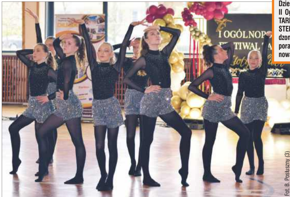
Hala sportowa przy LO w Kolbuszowej tętniła tego dnia życiem.