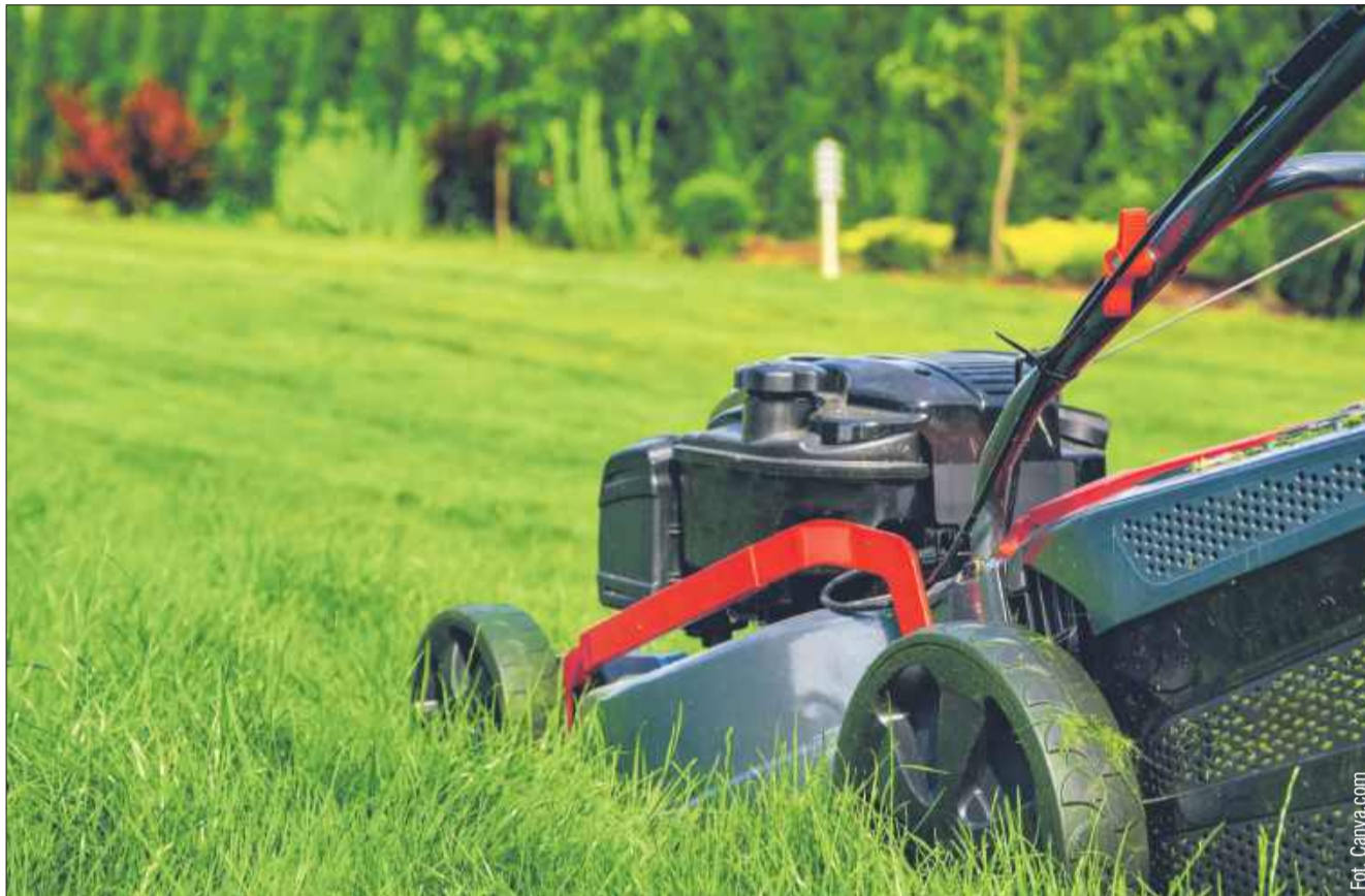
Jak zadbać o nasz trawnik wiosną, by cieszył oczy przez cały sezon?

Wiosna to idealny moment na odnowienie trawnika, który po zimie może wymagać nieco pracy, aby znów wyglądał zdrowo i bujnie. Niezależnie od tego, czy masz mały ogródek, czy dużą przestrzeń do pielęgnacji, odpowiednie zabiegi wczesną wiosną zapewnią Ci piękny trawnik przez całe lato. Jak więc zadbać o trawniki, aby były zielone i gęste?