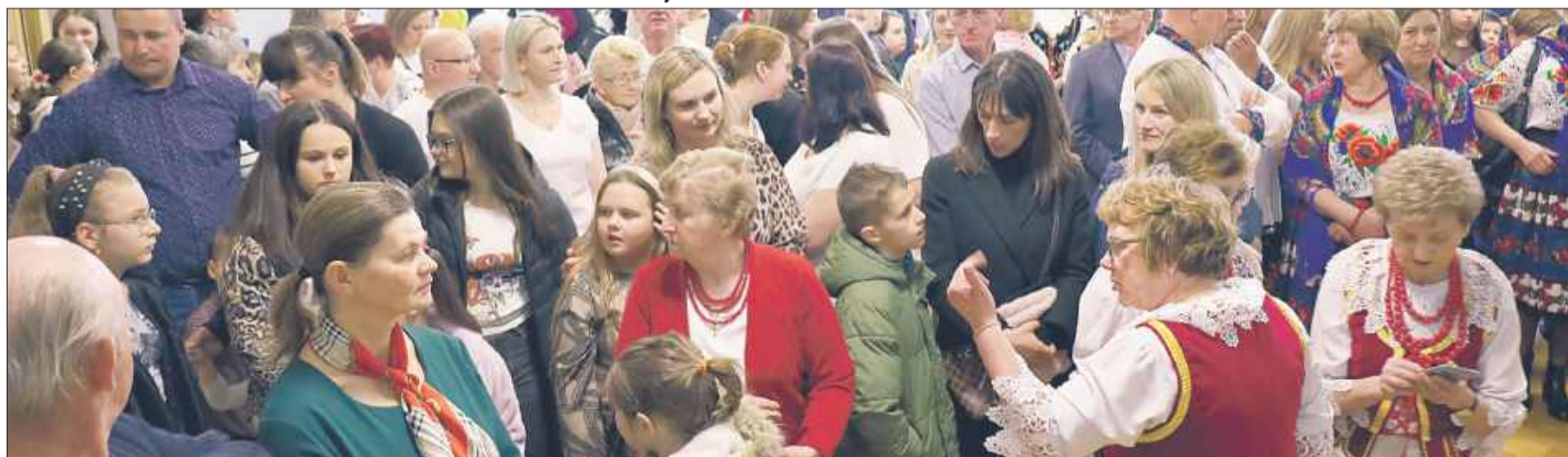
Mieszkańcy jak co roku tłumnie przybyli na wydarzenie.