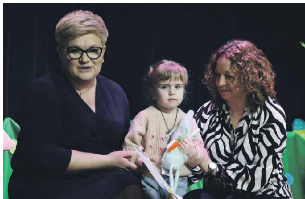
Gminny Konkurs Plastyczny Pisanka Wielkanocna cieszył się dużym zainteresowaniem wśród młodszych i starszych dzieci.