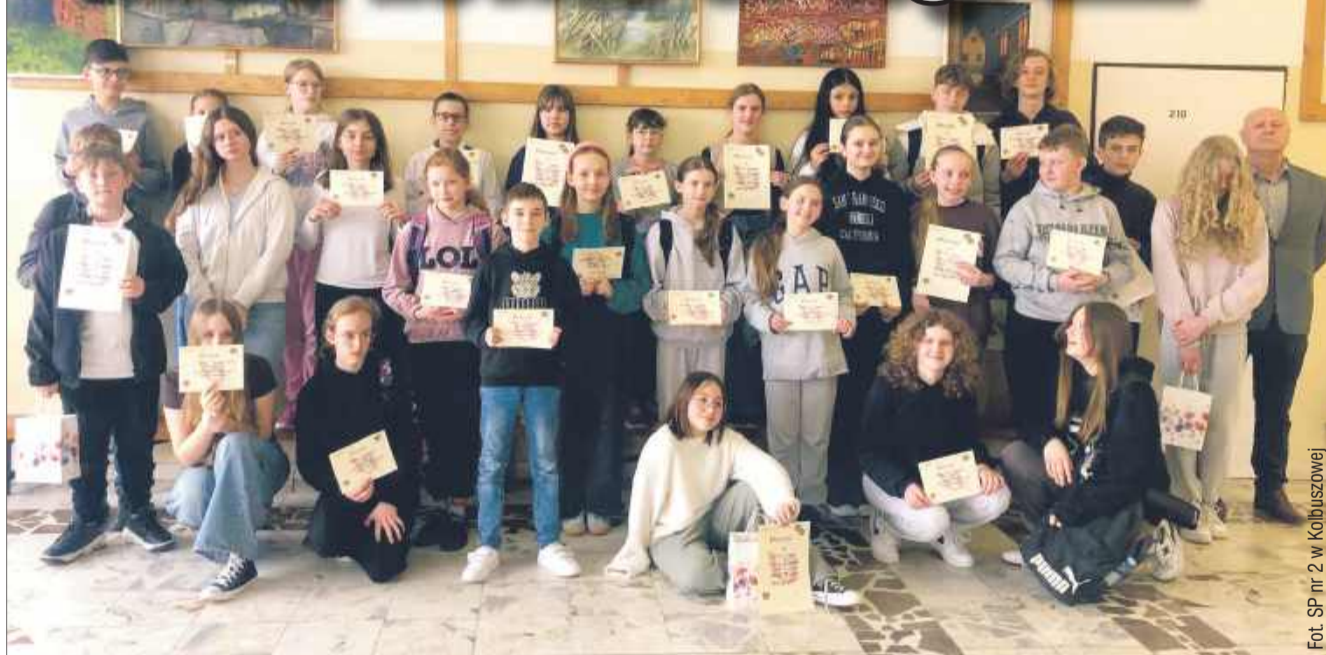
Konkurs ortograficzny cieszył się dużym zainteresowaniem wśród uczniów.

W czwartek, 27 marca w Szkole Podstawowej nr 2 w Kolbuszowej odbył się Gminny Konkurs Ortograficzny pt. „Mały Mistrz Ortografii”, który był skierowany do uczniów klas IV-VIII.