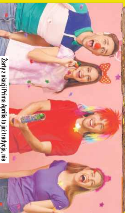
Żarty z okazji Prima Aprilis to już tradycja, nie mogło ich zabraknąć także u nas na stronie.