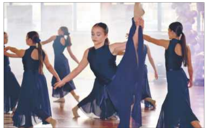
Pierwszy tego typu festiwal w Kolbuszowej został zorganizowany na bardzo wysokim poziomie.