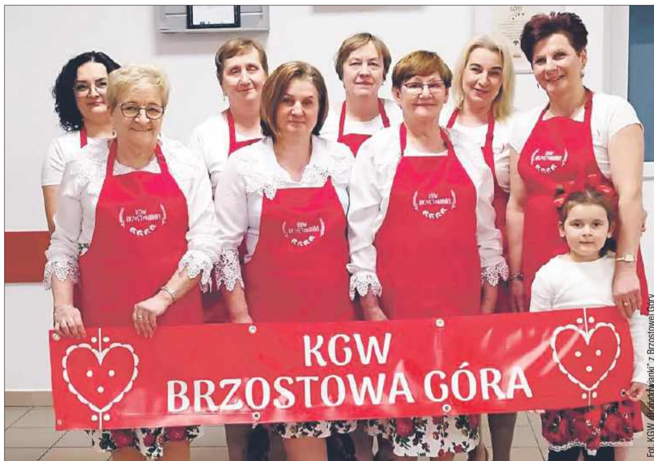
KGW „Brzostowianki” z Brzostowej Góry to prężnie działające koło.

Kontynuujemy nasz cykl pod nazwą „Poznajemy Koła Gospodyń Wiejskich”, w którym co tydzień przedstawiamy Państwu KGW działające i rozwijające się w powiecie kolbuszowskim. Dzięki temu będziecie mogli bliżej poznać ich historię, zwyczaje, osiągnięcia i działalność. W tym numerze przedstawiamy Państwu KGW „Brzostowianki” z Brzostowej Góry, które powstało już w latach 70.