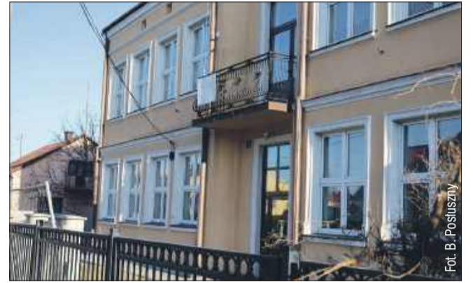
Piątka rodziców postanowiła czekać całą noc, by następnego dnia, o godz. 6.30 jako pierwsi zapisać swoje dzieci do żłobka w Raniżowie.

Rodzice z Woli Raniżowskiej nie poddają się i nadal walczą o powstanie żłobka w ich miejscowości. Czekają na odpowiedź ze strony władz gminy, licząc na pozytywne