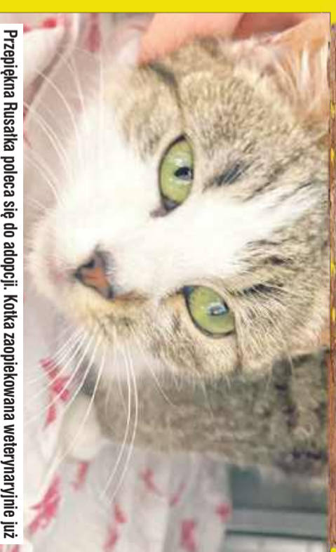
Przejękna Rusalka poleca się do adopcji. Kotka zaopiekowana weterynaryjnie już po sterylizacji. Miła tulaśna młoda. Szuka dobrego domu. Kontakt: 727 167 727