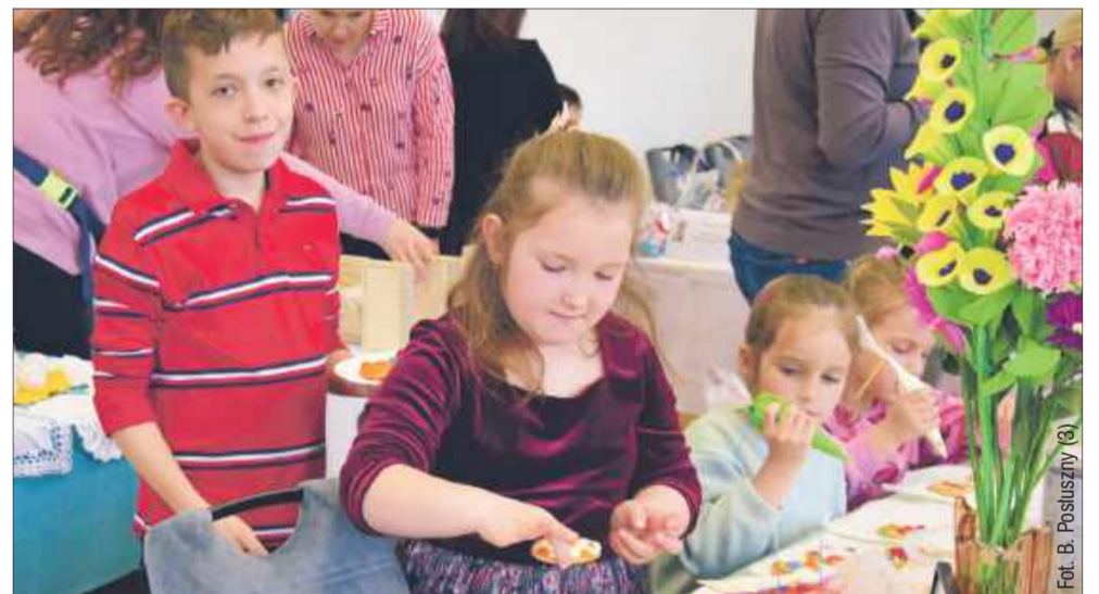
Najmłodszy uczestnicy mieli okazję stworzyć niepowtarzalne świąteczne dekoracje.