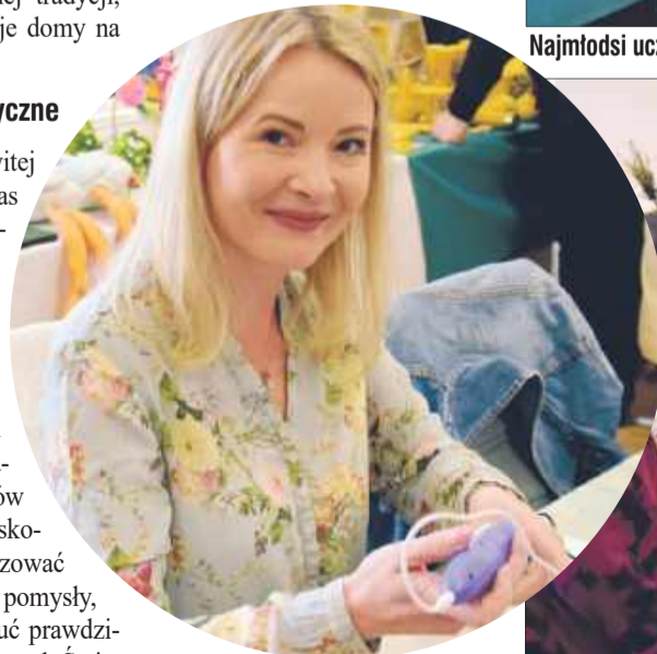
W warsztaty z wielką chęcią zaangażowali się także dorośli.

Na zakończenie pełnego wrażeń dnia, o godzinie 17:00, wyświetlono film – dramat historyczny, który pozwolił uczestnikom na chwilę relaksu i refleksji po całym dniu pełnym atrakcji. To było idealne zwieńczenie wydarzenia. bp