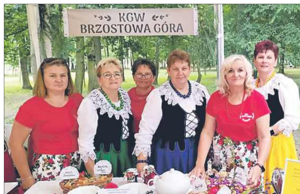
KGW bierze udział w przeróżnych wydarzeniach, prezentując własne wyroby.

W latach 70-80 panie organizowały różne kursy dla mieszkańców wsi takie jak kursy gotowania, pieczenia,