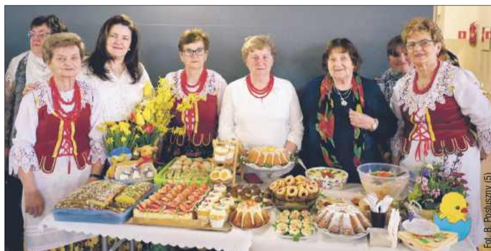
Świąteczne smakołyki serwowało m.in. KGW z Cmolasu.