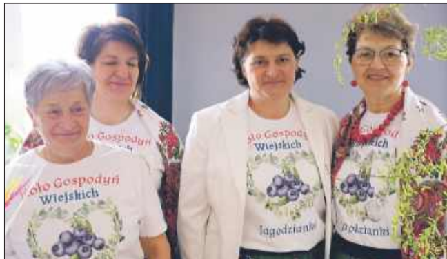
Swoje stoisko miały także panie z KGW Jagodnik.