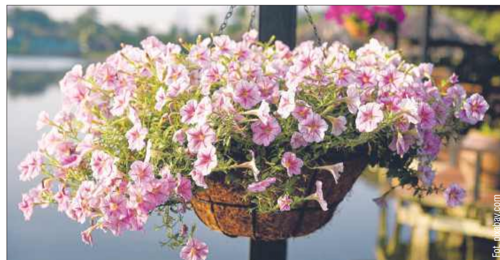
Jedną z popularniejszych roślin w ostatnim czasie jest surfinia. Idealna na tarasy, balkony i do donic.

Zielony taras lub balkon to świetny sposób na poprawienie jakości życia w mieście. Wystarczy kilka roślin, odpowiednie donice i trochę troski, by stworzyć miejsce pełne spokoju i relaksu. Zaczynając wiosnę, zadбай o to, by Twój balkon stał się prawdziwą miejską oazą. bp