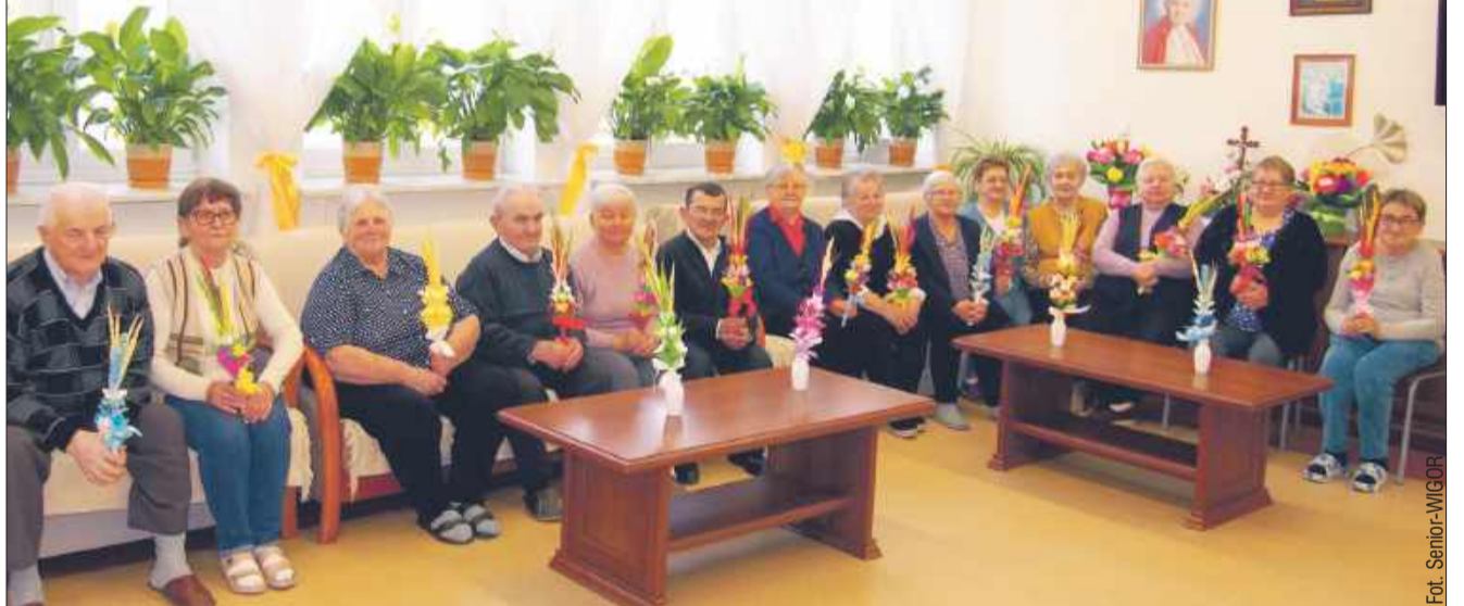
Seniorzy z Domu Seniora „Senior-WIGOR” w Niwiskach własnoręcznie przygotowali palmy wielkanocne.