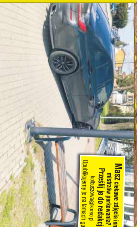
Parkowanie z serii: „Ja tylko na chwilę”. Parking przy ul. Jana Pawła II w Kolbuszowej.