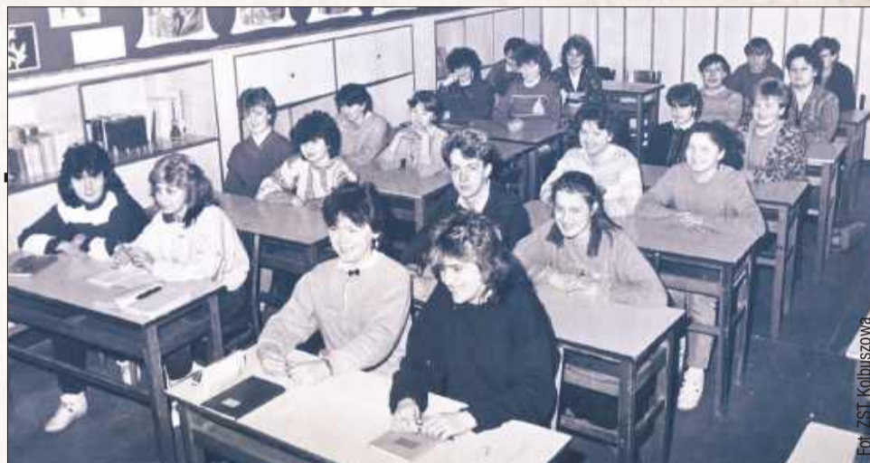
Absolwenci ZST w Kolbuszowej z nostalgią wspominają młodzieńcze lata.