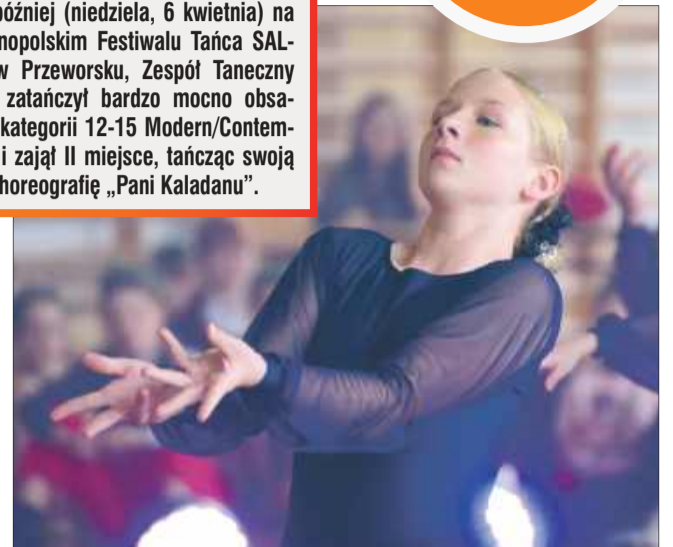
W zmaganiach podziwiać mogliśmy tancerzy z całego Podkarpacia.

Dzień później (niedziela, 6 kwietnia) na II Ogólnopolskim Festiwalu Tańca SALTARE w Przeworsku, Zespół Taneczny STEPS zatańczył bardzo mocno obsadzonej kategorii 12-15 Modern/Contemporary i zajął II miejsce, tańcząc swoją nową choreografię „Pani Kaladaru”.