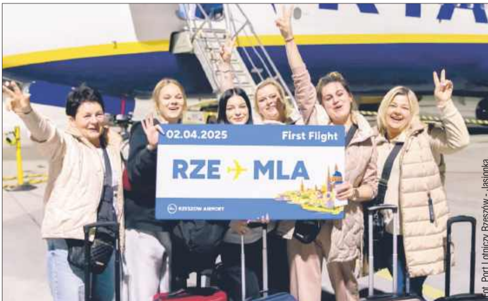
Chcesz polecieć na Maltę? Z Rzeszowa jest już to możliwe.