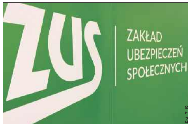
Pierwsze „trzynastki” trafiły już do emerytów.

- Zasadą jest, że wypłaty są realizowane w taki sposób, aby