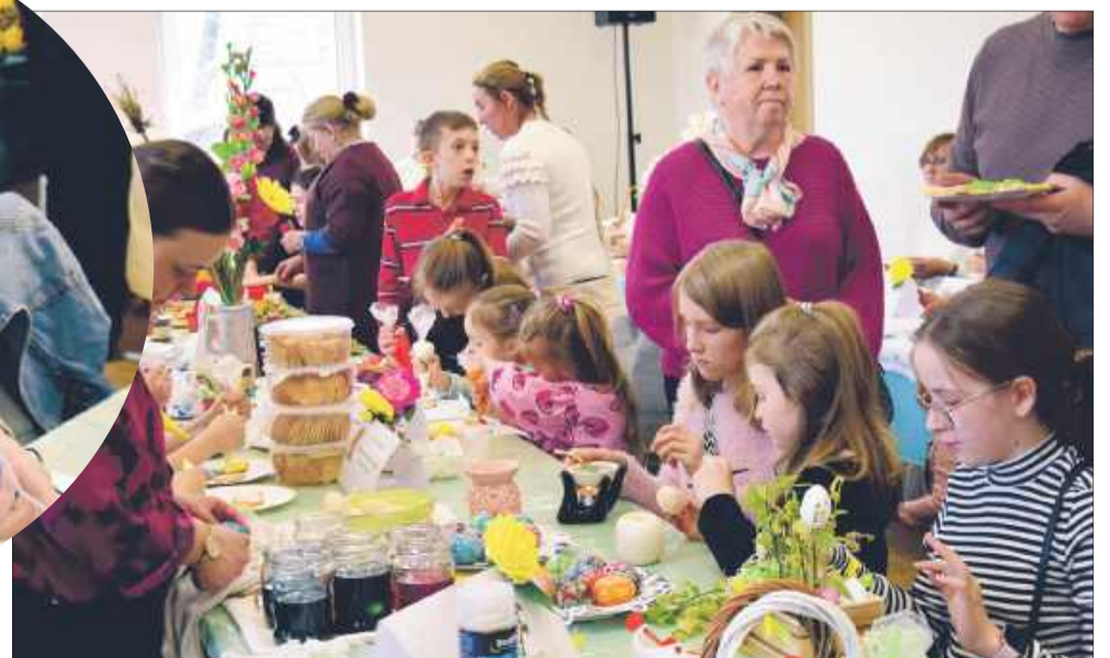
Mieszkańcy bardzo chętnie wzięli udział w wydarzeniu pod nazwą „Pisanka Świerczowska”.