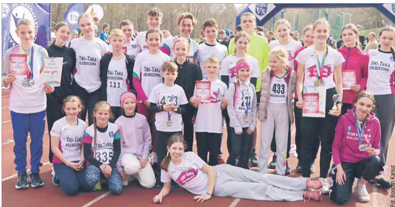
Zawodnicy Tiki Taki po raz kolejny zdobyli medale na mistrzostwach.

Lekkoatleci z Tiki Taki Kolbuszowa zdobyli cztery medale podczas Mistrzostw Podkarpacia w biegach przełajowych, które odbyły się w Stalowej Woli. Na tym nie konie sukcesów.