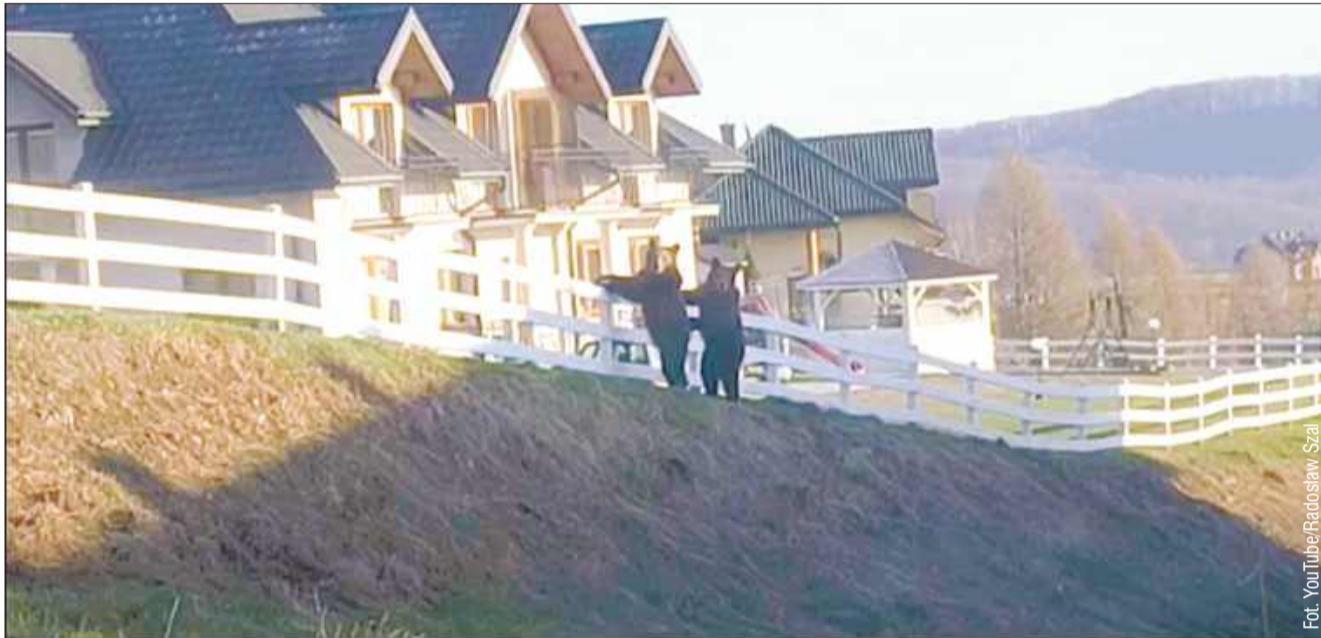
Trzy niedźwiedzie spacerowały po Polańczyku.

Nagranie wzbudziło duże poruszenie wśród mieszkańców i turystów. To kolejne potwierdzenie, że dzikie zwierzęta coraz śmielej zbliżają się do ludzkich osiedli. Powodem takiego zachowania może być łatwa dostępność pożywienia w pobliżu