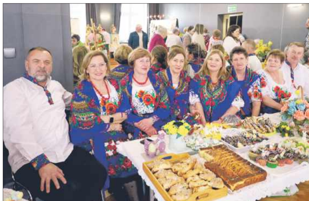
KGW Poręby Dymarskie także przygotowało przeróżne świąteczne smakołyki.