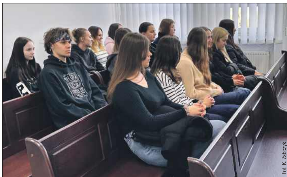
Uczniowie ze szkoły w Weryni mieli okazję zobaczyć, jak działa sąd „od środka”.

W ostatnich dniach w Sądzie Rejonowym w Kolbuszowie odbyły się rozprawy karne, w których udział wzięli uczniowie szkół średnich, w tym młodzież z Zespołu Szkół Agrotechniczno-Ekonomicznych w Weryni. Uczestnictwo w tych rozprawach miało na celu przybliżenie młodym ludziom realiów pracy sądu oraz zasady funkcjonowania wymiaru sprawiedliwości w Polsce.