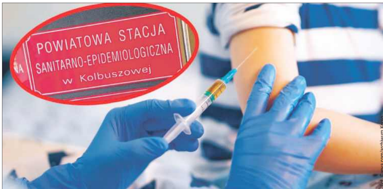
Wielka kontrola szczepień dzieci w całej Polsce. Sanepid skontroluje także ośrodki w Kolbuszowej i okolicach.

Co jeżeli po rozmowach z sanepidem, rodzice nadal uchylają się od obowiązkowego szczepienia? Wówczas sanepid daje upomnienie. Jeśli po tym dziecko