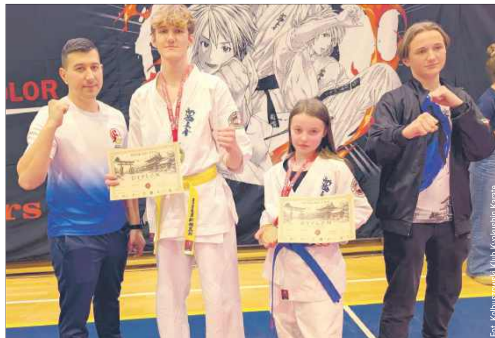
W zmaganiach wzięli udział także zawodnicy Kolbuszowskiego Klubu Kyokushin Karate.