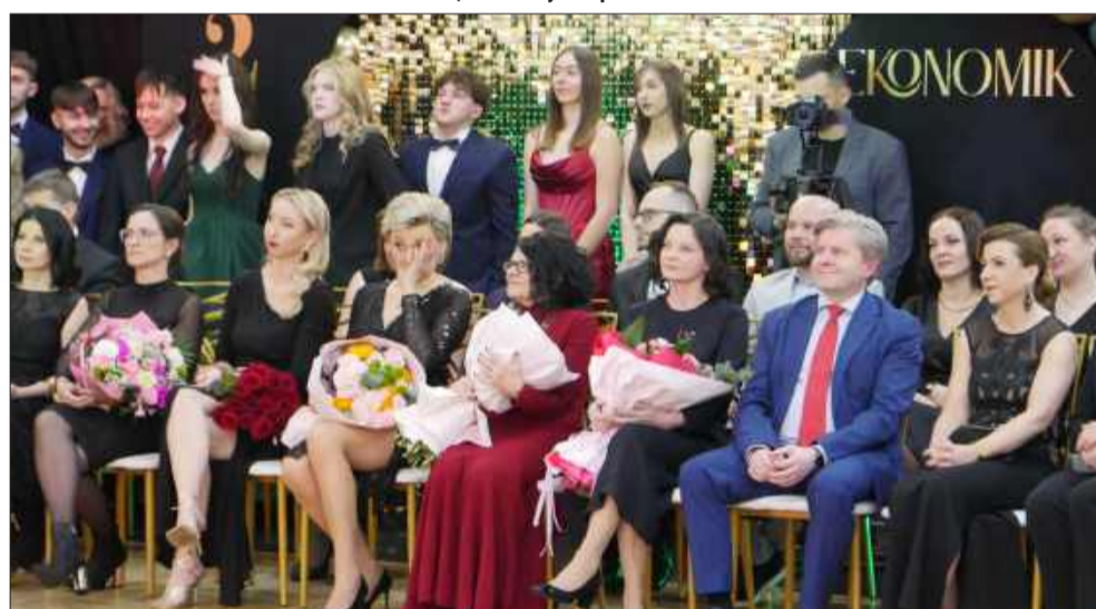
Studniówka – tradycja, która wciąż łączy pokolenia.