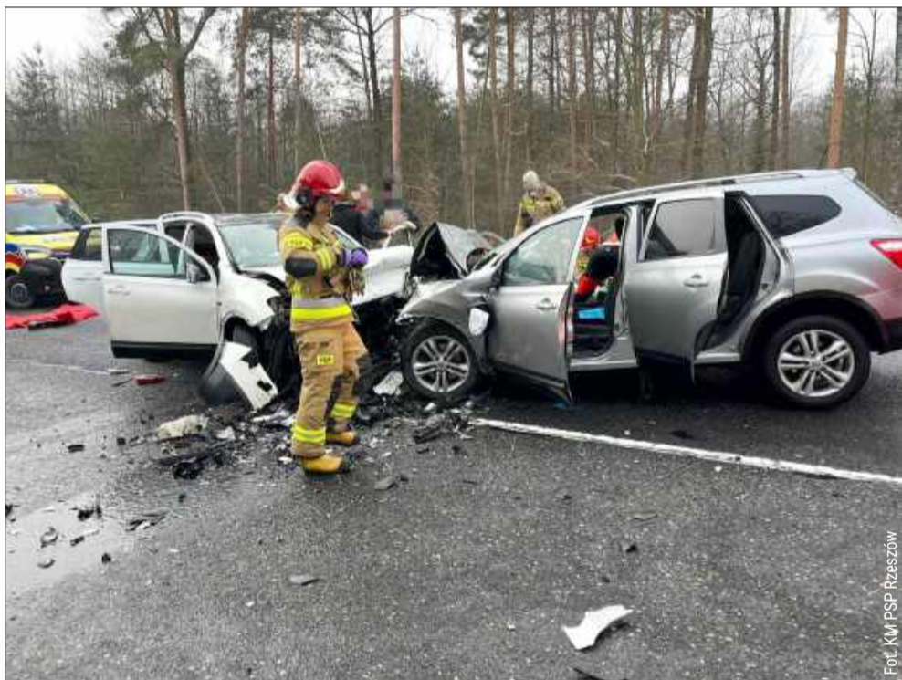
Miejsce tragicznego wypadku.

W piątek, 23 stycznia, w tragicznym wypadku na drodze krajowej numer 9 w Głogowie Małopolskim zginęły trzy osoby. Wśród ofiar jest małżeństwo pochodzące z powiatu kolbuszowskiego, jak również 12-letnia mieszkanka Rzeszowa.