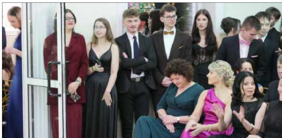
Sto dni do matury rozpoczęte tanecznym krokiem.