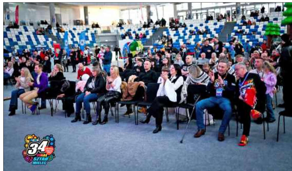
Wielu mielczan przyszło wspierać 34. finał