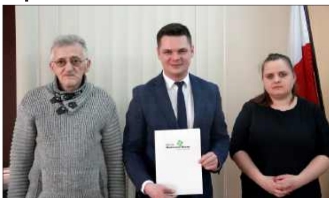
Gmina Wadowice Górne wspiera lokalne kluby

Mówi się, że Mielec sportem stoi. Ale prawda jest taka, że to samo można powiedzieć o całym powiecie mieleckim.