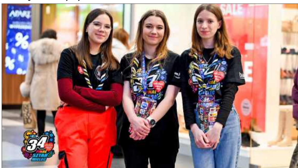
90 wolontariuszy pomogą przy zbieraniu pieniędzy dla małych brzusków.