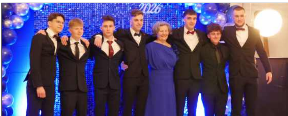
Bal studniówkowy ZSB na długo pozostanie w pamięci maturzystów.