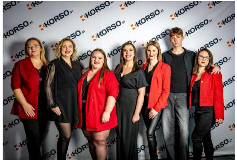
Grupa wokalna „BeeZies”