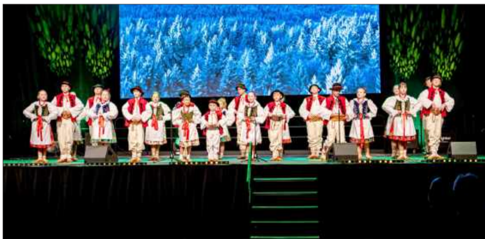
„Ziemia Mielecka” zaprezentował się w barwnej i dynamicznej odsłonie.