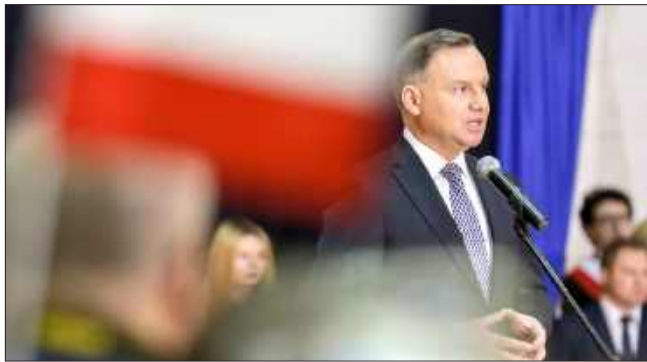
Odznaczenie dla Andrzeja Dudy podzieliło Podkarpacie. Głos zabiera KOD i zarząd województwa

„Nie był prezydentem wszystkich Polek i Polaków, bo wielu z nich po prostu odmawiało szacunku” – pisze KOD, przywołując wypowiedzi, które miały dzielić społeczeństwo. Autorzy wskazują, że były prezydent „był rzecznikiem polityki jednej partii, nie próbując rozmawiać z tymi, którzy na niego nie głosowali, a wręcz pogłębiał podziały polityczne”.