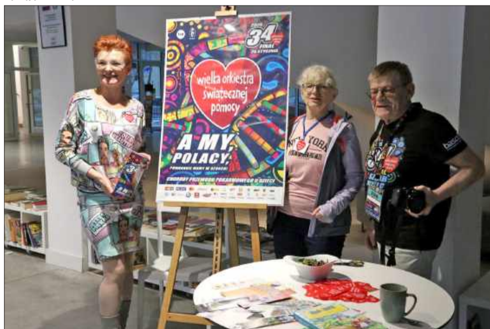
Orkiestra grała też w miejskiej bibliotece.