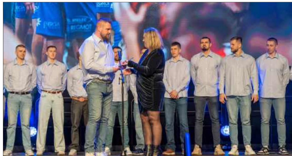
Nagroda Specjalna dla Drużyny Roku 2025, którą otrzymała Handball Stal Mielec.

Wyróżnienie za 4. miejsce w Plebiscycie Sportowca Roku