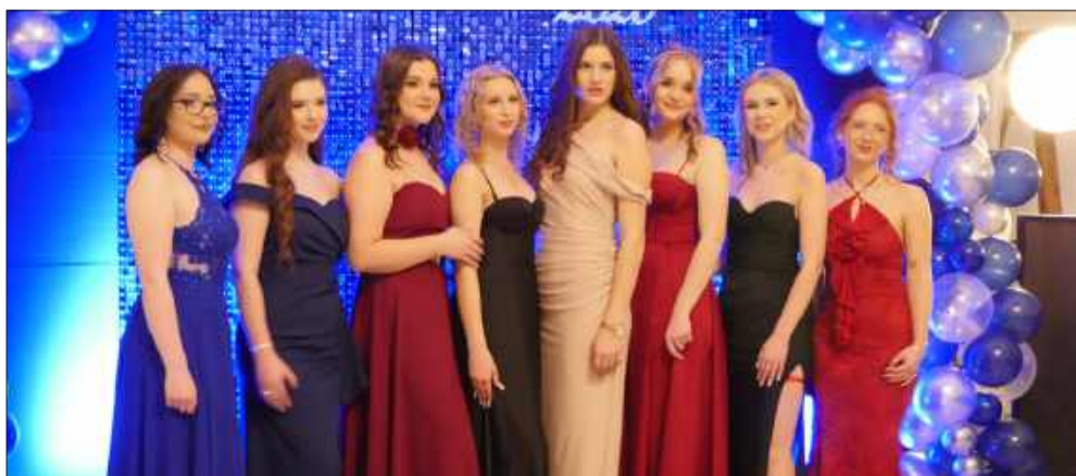
Eleganckie kreacje i odświeżony wystrój sali podczas studniówki ZSB.