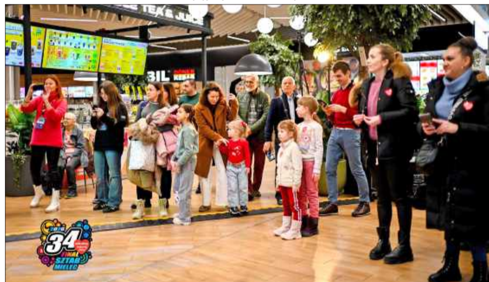
Pomaganie to świetna zabawa!