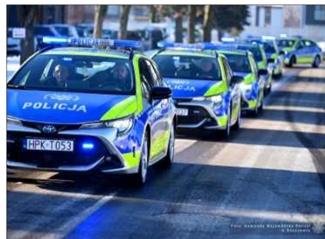
Nowe radiowozy w Mielcu.

Mielecka policja zyskała kolejne nowoczesne radiowozy, które już wkrótce pojawią się na drogach powiatu. Do Komendy Powiatowej Policji w Mielcu trafiły dwa pojazdy nowej generacji, które będą wykorzystywane zarówno przez funkcjonariuszy ruchu drogowego, jak i policjantów z Radomyśla Wielkiego. To kolejne wzmocnienie taboru, które ma bezpośrednio przełożyć się na skuteczność działań i bezpieczeństwo mieszkańców regionu.