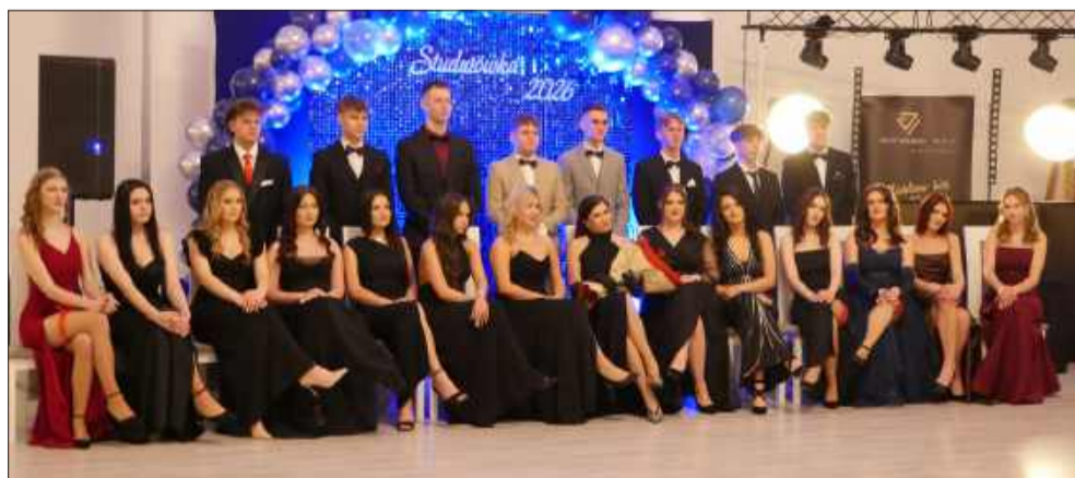
Studniówkowa ścianka zdjęciowa cieszyła się dużym zainteresowaniem maturzystów i nauczycieli.