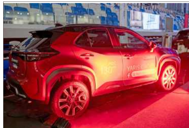
Toyota zaprezentowała na Gali nowoczesny model Yaris Cross.