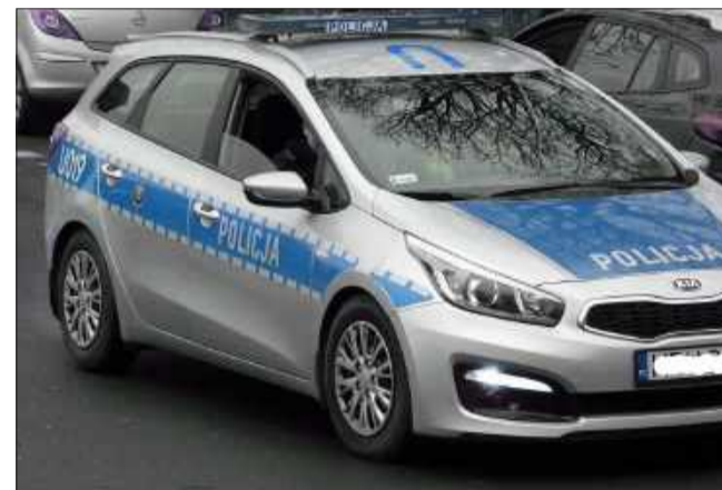
Policja zajmuje się sprawą.