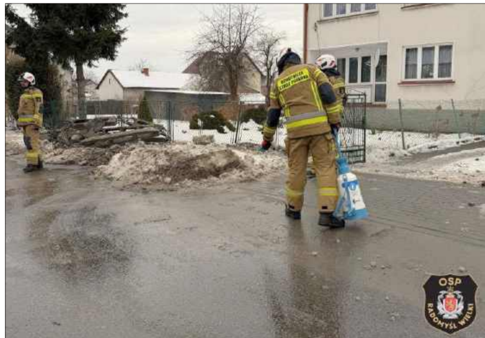
Utrudnienia na ul. Piłsudskiego trwały kilka godzin.