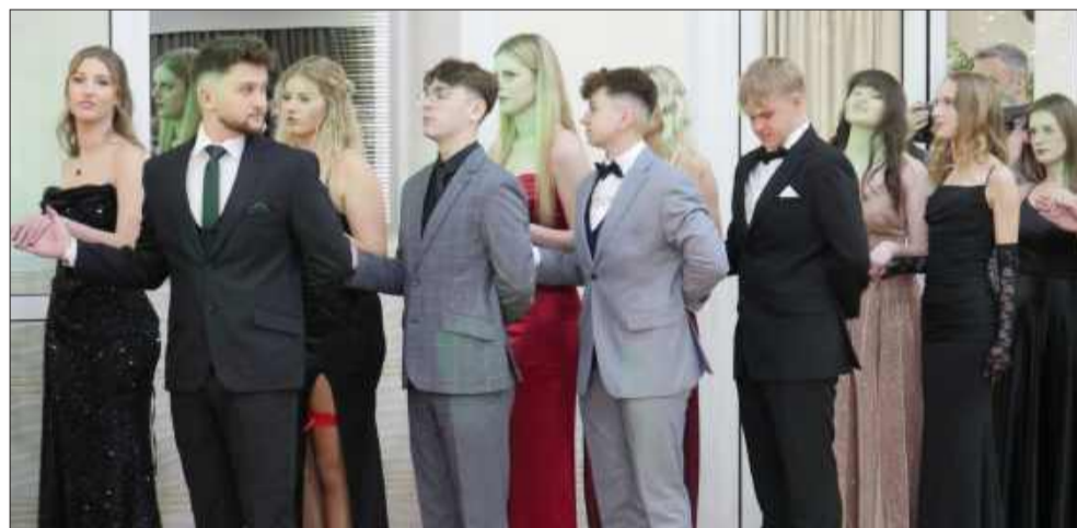
Maturzyści ZSE wspólnie rozpoczęli symboliczne odliczanie do matury.