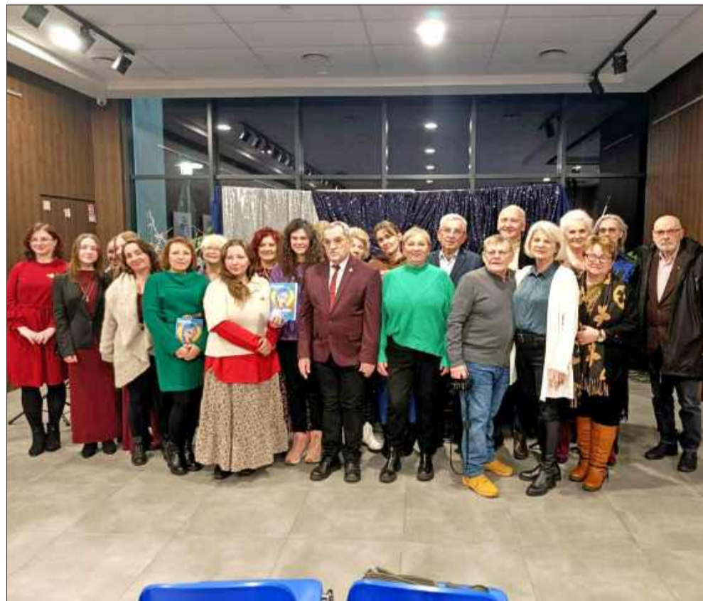
Literacki wieczór w Przecławiu – premiera 9. numeru „Dygresji”.