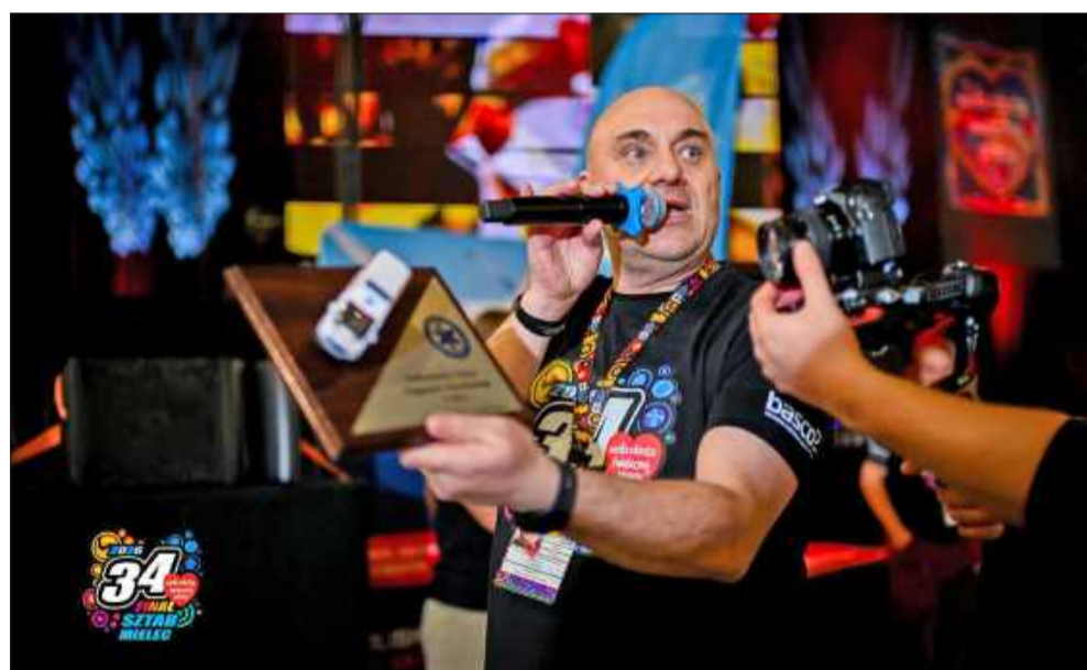
Było mnóstwo wspaniałych licytacji