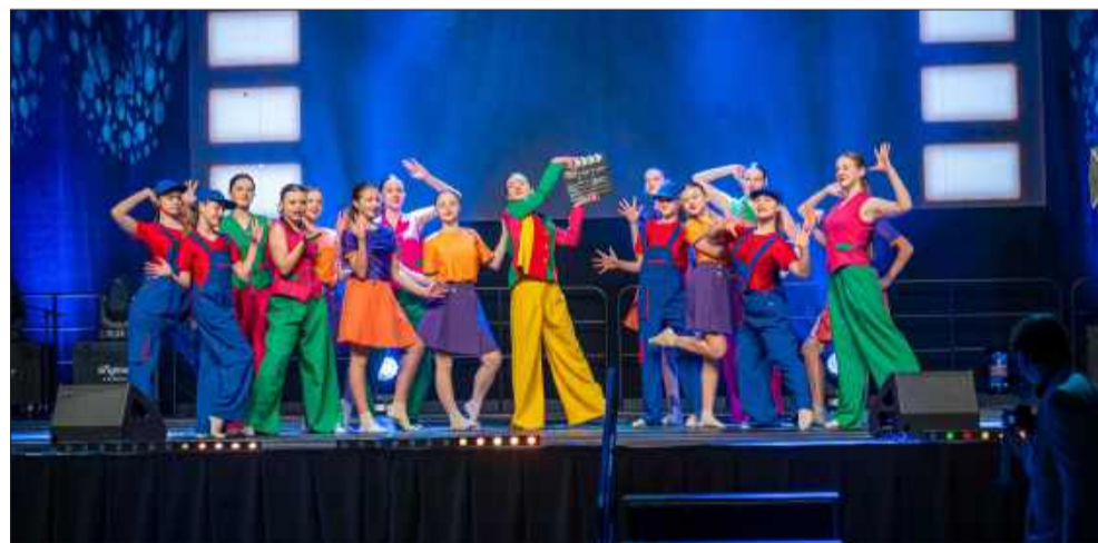
Teatr Tańca „AleToNic” zaprezentował dwa wyjątkowe układy taneczne.