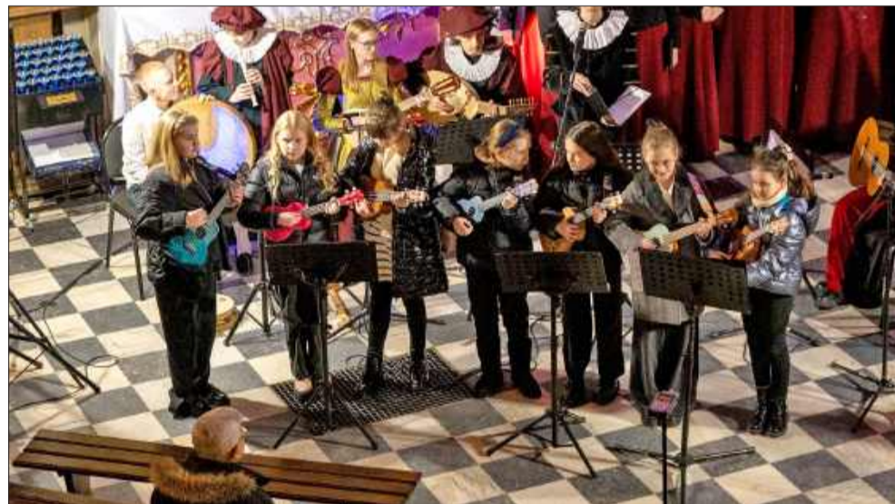
Od staropolszczyzny po współczesność – niezwykle kolędowanie w Mielcu.