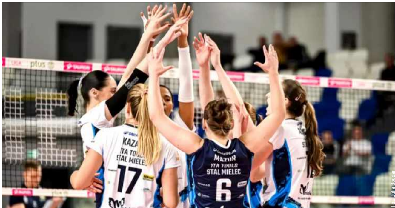
Siatkarki z Mielca przywoziły z Bydgoszczy dwa punkty.