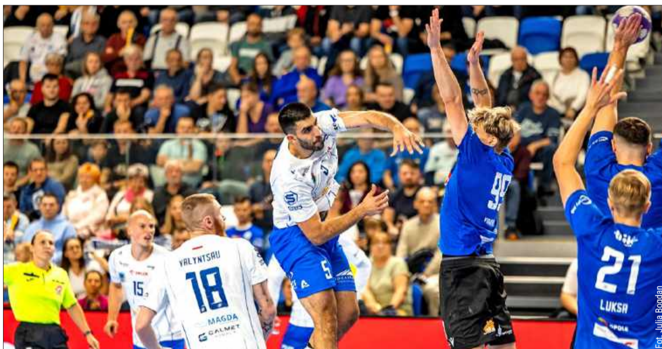
Szczypiornicy z Mielca odpadli z Orlen Pucharu Polski.