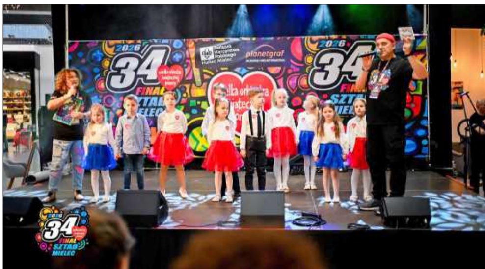
Występy młodszych na scenie.