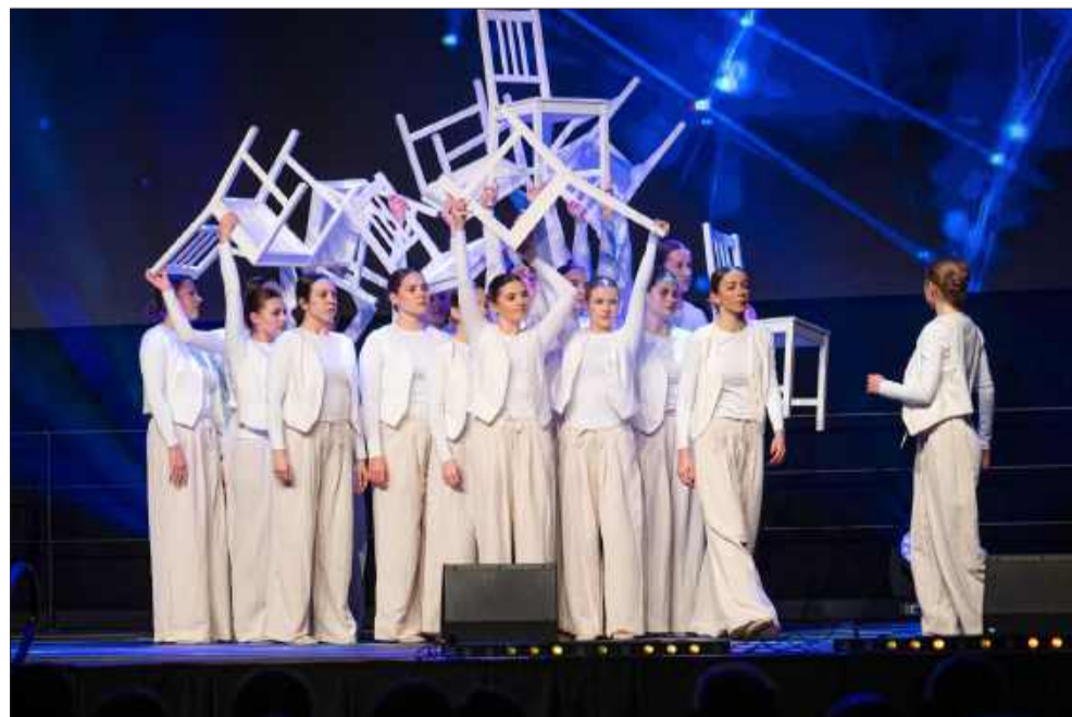
Zespół „AleToNic” znany jest z różnorodnego repertuaru.