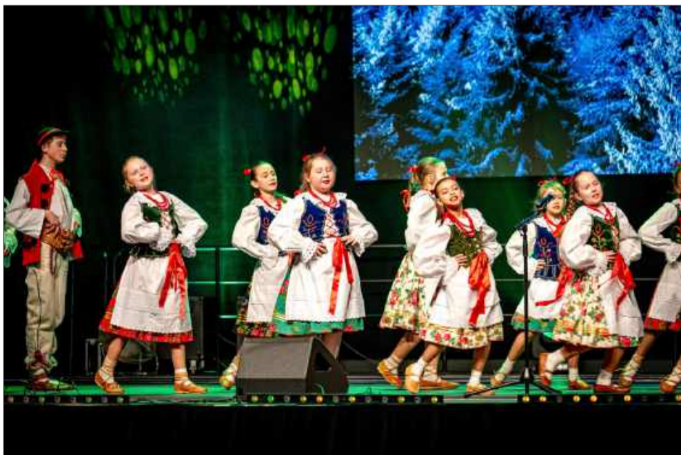
Program „Ziemi Mieleckiej” oparty na ludowych śpiewankach i tańcach.