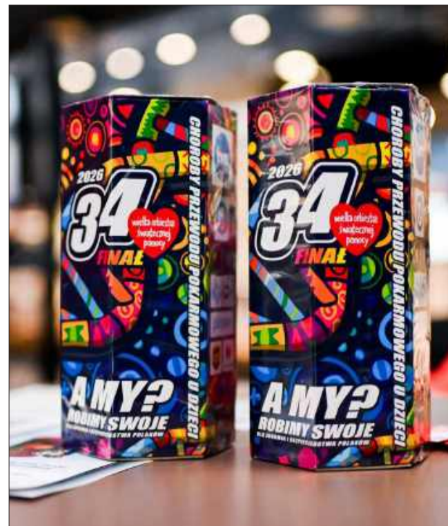
JB Tradycyjne puszki z czerwonym serduszkciem.

Wstępne liczenie zebranych środków trwało do późnych godzin wieczornych. Kwota podana o godzinie 23:00 - 278 624,54 zł z pewnością nie jest jeszcze ostateczna. Finalny wynik zbiórki poznamy w najbliższych dniach, jednak już teraz wiadomo, że mieszkańcy Mielca po raz kolejny pokazali wielkie serce i ogromną solidarność.