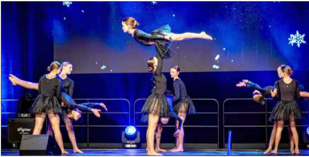
Mieleskie Centrum Akrobatyki „AkroMielec”