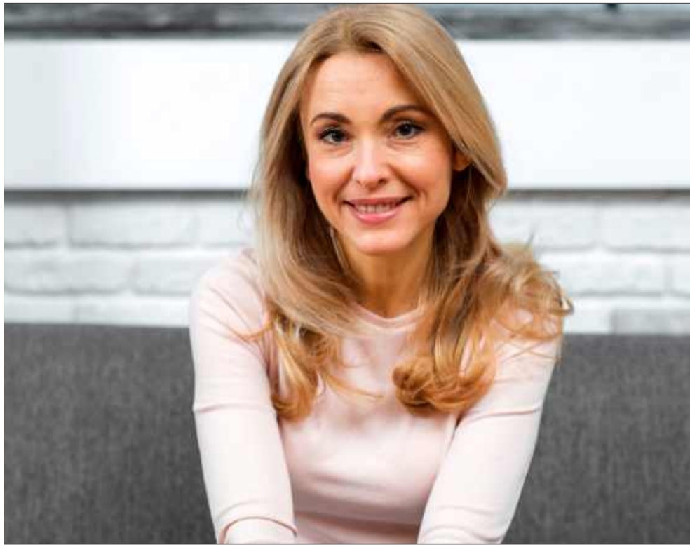
Zamiast traktować kryzys jako koniec, warto postrzegać go jako początek nowego życia.

W tym okresie wiele kobiet może poczuć się zagubionych lub niezadowolonych z dotychczasowego życia. Przemiany, takie jak wejście w okres meno-