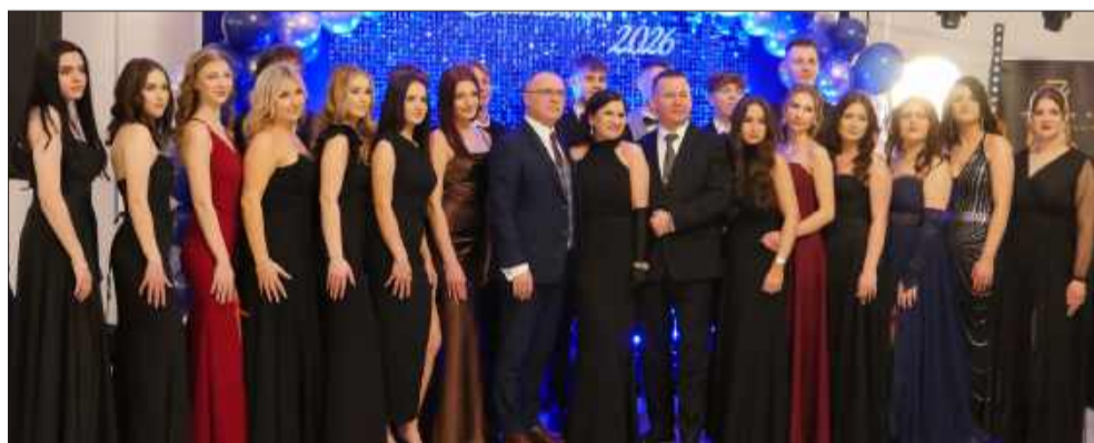
Wspólne zdjęcia z nauczycielami i dyrektką podczas balu studniówkowego.