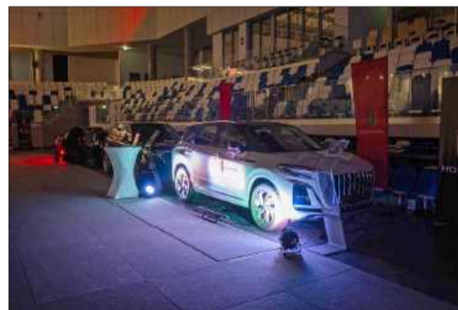
Sponsor Gali Hongqi zaprezentował swój flagowy model H9.