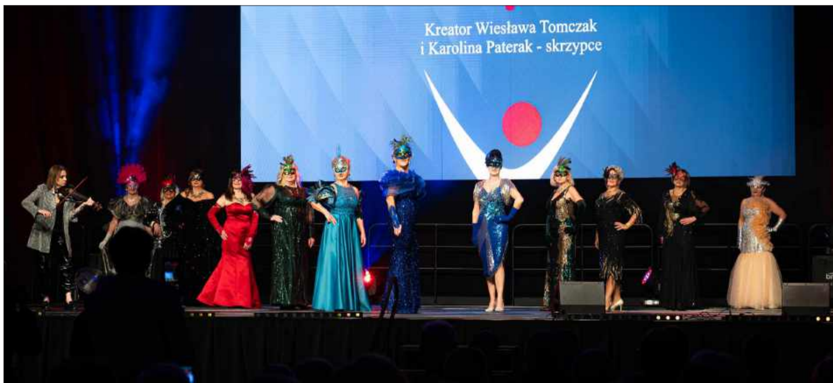
Grupa „W&modowe szaleństwa”