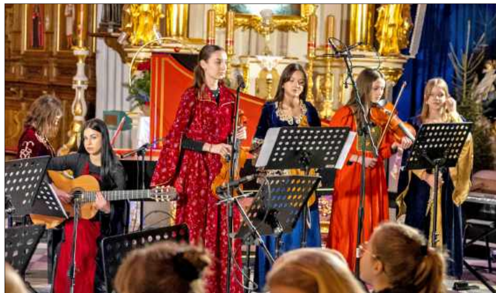
Wspólna pasja, wspólny śpiew.

Koncert potwierdził, że kolędowanie w Mielcu potrafi zaskakiwać, łącząc tradycję z nowoczesnością i pokazując, jak niezwykle siłę ma wspólne muzykowanie. MW