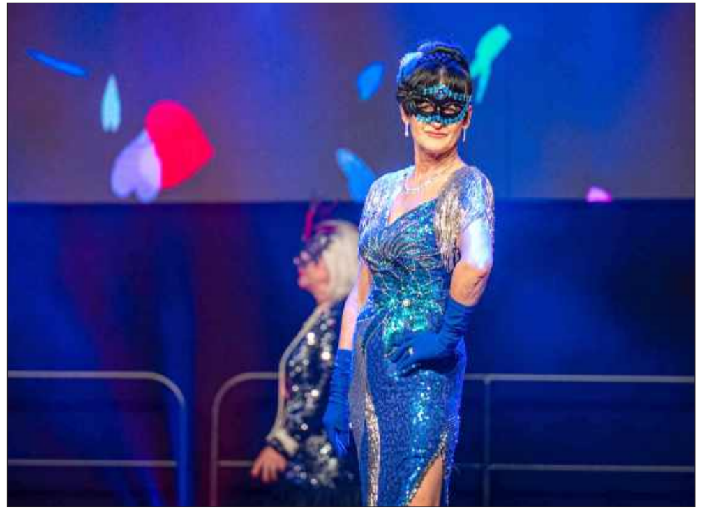
Piękne karnawalowe stroje