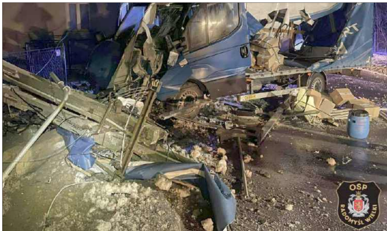
Kierujący został przewieziony do szpitala.