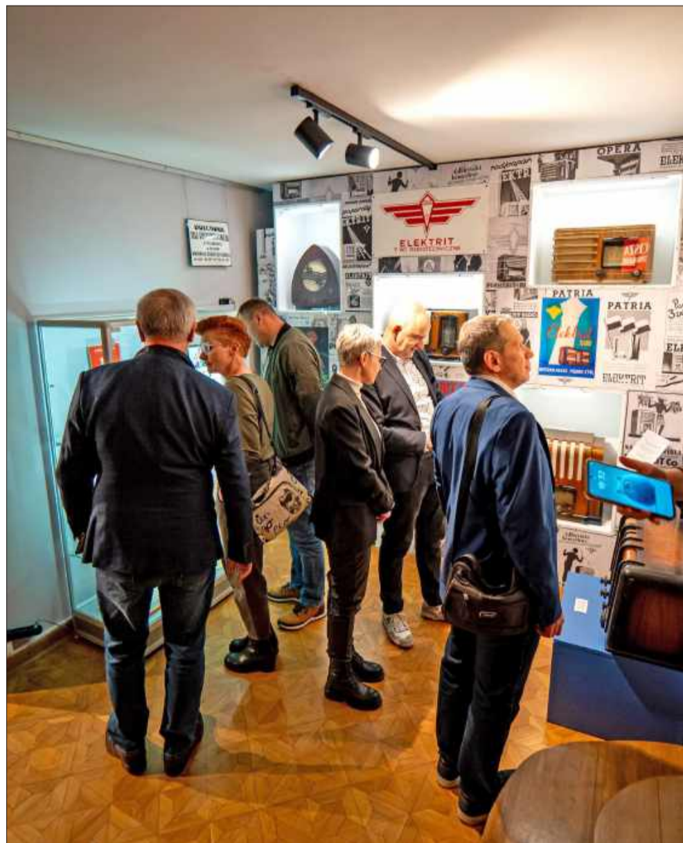
Zabytkowe radia i radiowe perełki na nowej wystawie w Mielcu.