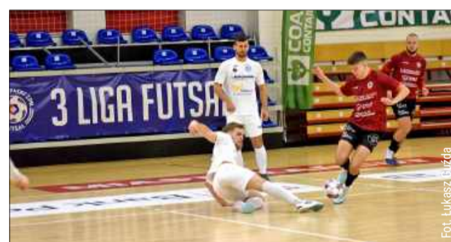
Mielczanie musieli uznać wyższość drużyny z Jarosławia