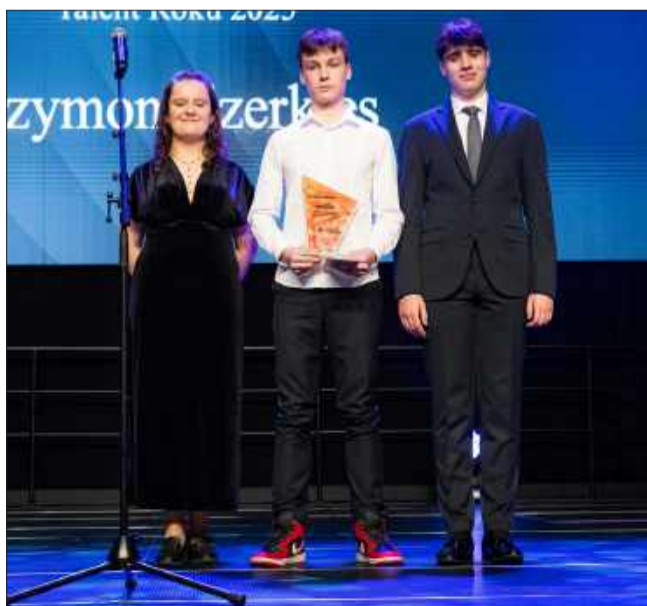
W kategorii Talent Roku nagrodę wręczali przedstawiciele Młodzieżowej Rady Miejskiej w Mielcu.