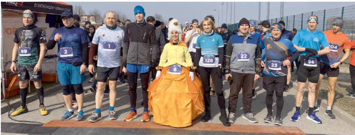
Zgodnie z tradycją, na biegu pojawiła się także „księżna Ogińska”.

W sportowych zmaganiach nie zabrakło również przyden-