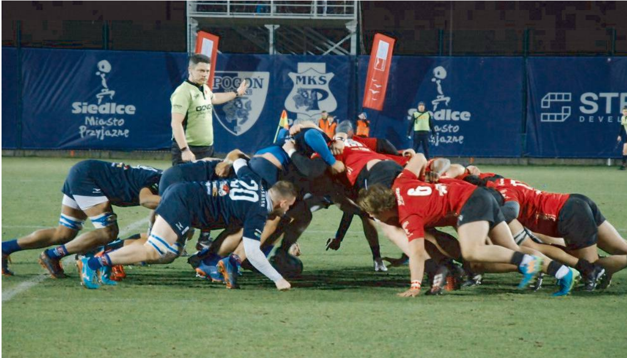
Pierwsza połowa była niezwykle wyrównana.