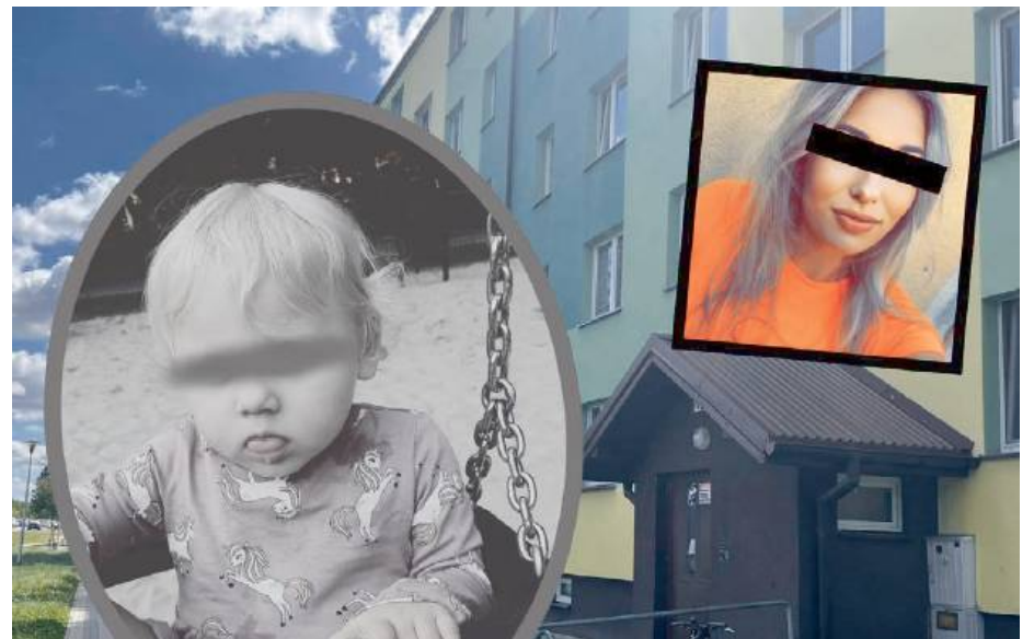
Tej tragedii można było zapobiec.