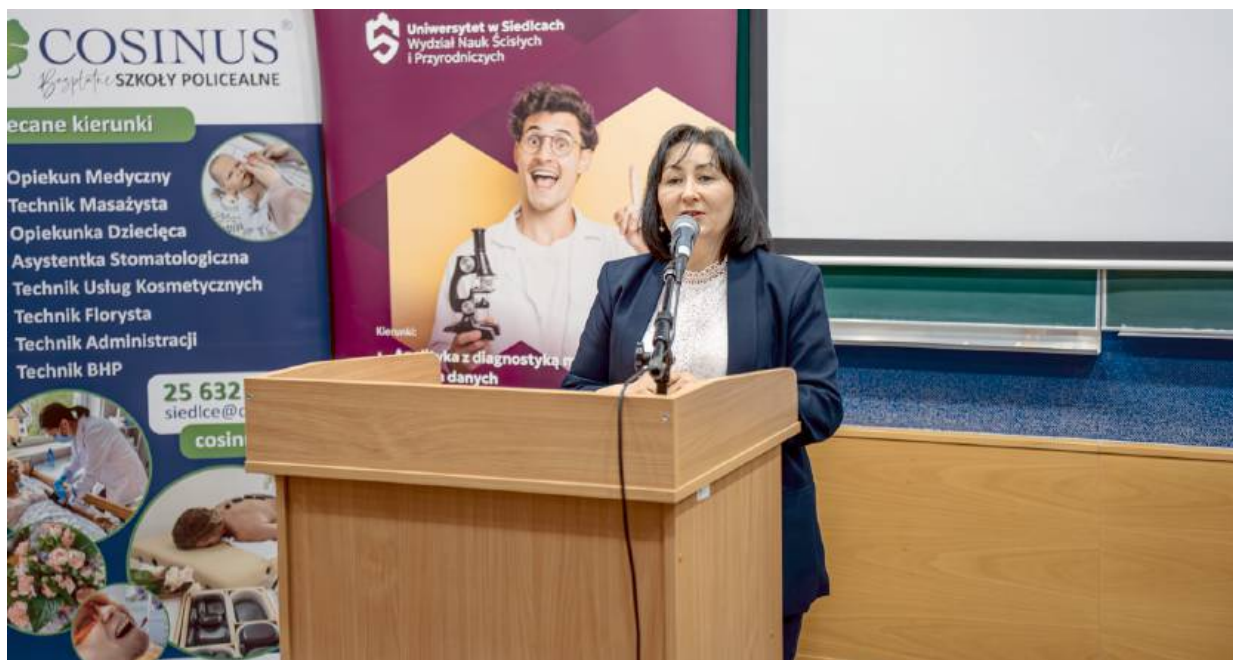
Tego wiosennego dnia w przystępny sposób o naukowych sprawach opowiadali młodym ludziom pracownicy Wydziału.