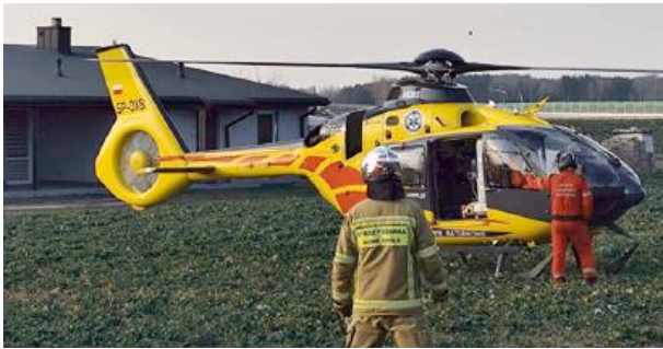
Ogień rozprzestrzenił się na poddaszu budynku.

W Żelkowie Kolonii podczas czyszczenia komina doszło do nagłego zapłonu ognia. Dwie osoby zostały ranne i trafiły do szpitala. Policja bada okoliczności zdarzenia.