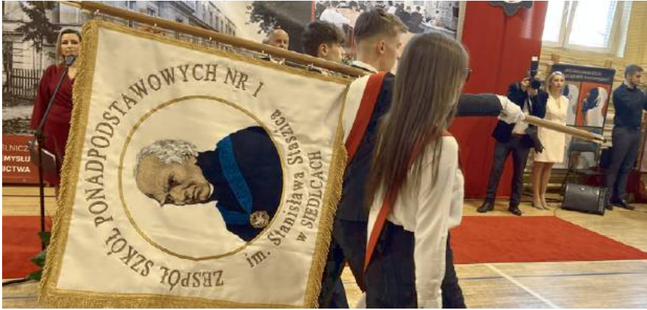
Nowy sztandar to symbol tradycji, wartości i tożsamości „Elektryka”.

To był wyjątkowy dzień w historii Zespołu Szkół Ponadpodstawowych nr 1 im. Stanisława Staszica w Siedlcach. 21 marca społeczność szkolna obchodziła uroczystość nadania nowego sztandaru, symbolu tradycji, wartości i tożsamości „Elektryka”.