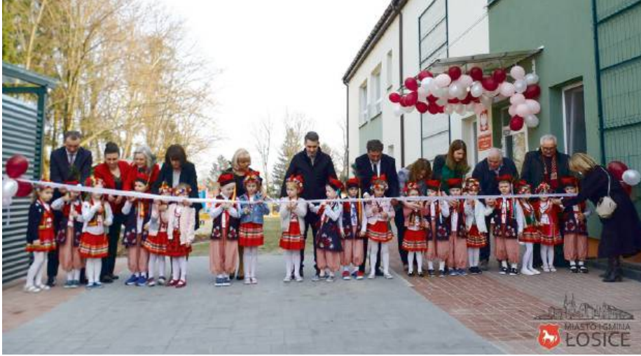
Oba projekty kosztowały łącznie ponad 12 milionów złotych.

Oba projekty kosztowały łącznie ponad 12 milionów złotych, z czego aż 10 milionów pochodziło z zewnętrznych źródeł finansowania - w tym z rządowego programu Polski Ład, programu Maluch+ oraz środków Urzędu Marszałkowskiego. Pierwszy samorządowy żłobek