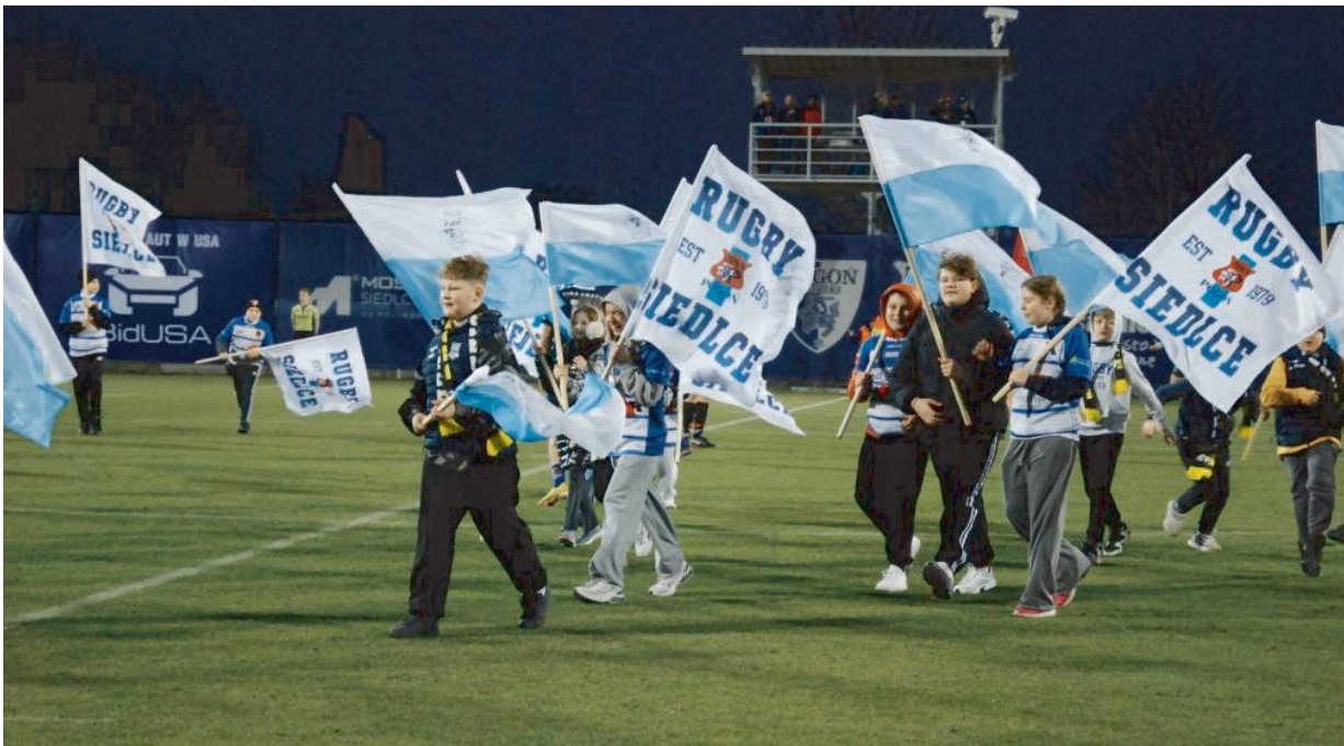
Dzięki wygranej Pogon Siedlce umocniła swoją pozycję w tabeli Ekstraligi Rugby.