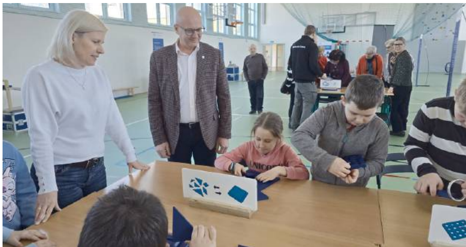
Wszystkie zaplanowane aktywności miały ukryte nowe umiejętności naukowe

Mobilna wystawa, realizowana w ramach programu „Nauka dla Ciebie”, stanowi część inicjatywy Ministerstwa Nauki i Szkolnictwa Wyższego oraz Centrum Nauki Kopernik. Jej celem jest popularyzacja nauki wśród mieszkańców mniejszych miejscowości, którzy na co dzień nie mają dostępu do tego typu atrakcji. Naukobus, pełniący rolę mobilnego laborato-