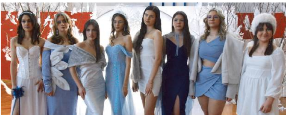
Zadaniem uczestników było połączenie elegancji z zimowym klimatem.

20 marca w siedleckiej „Budowlance” odbyła się druga edycja Wewnątrzszkolnego Konkursu Stylizacji Ubioru pod hasłem „Zima jest Kobietą”. Młodzi projektanci, inspirowani zimowym krajobrazem, zaprezentowali swoje unikalne wizje modowe, które oczarowały jury i publiczność. Konkurs okazał się nie tylko platformą dla kreatywnych talentów, ale również dowodem na to, że moda to sztuka, która pozwala wyrazić siebie w pełni.