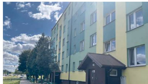
Dramat rozgrywał się w jednym z mieszkań na ul. Wyszyńskiego.

strony matki. Lista tych zaniechań jest długa: niedobory pokarmowe, brak odpowiedniej higieny i pielęgnacji, zaniedbanie leczenia i rehabilitacji dziecka. Biegli wskazali również na brak reakcji matki na objawy choroby, które powinny były wzbudzić niepokój.