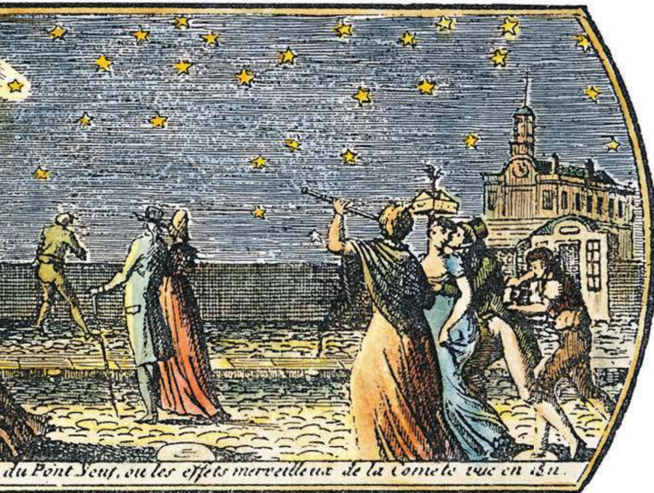
Kometa z 1812 r. widziana z Pont Neuf w Paryżu