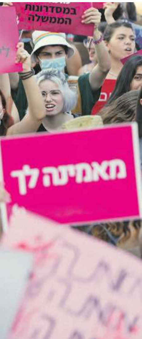
Marsz przeciwko przemocy wobec kobiet, Tel Awiw, 15 października 2021 r.

den z czynników, który tłumaczy niską wykrywalność morderstw arabskich kobiet. Krewni działają w porozumieniu. Nawet jeśli część z nich nie zgadza się z wyrokiem na kobietę, są zastraszeni i odmawiają współpracy z policją – wyjaśnia dr Zielińska.