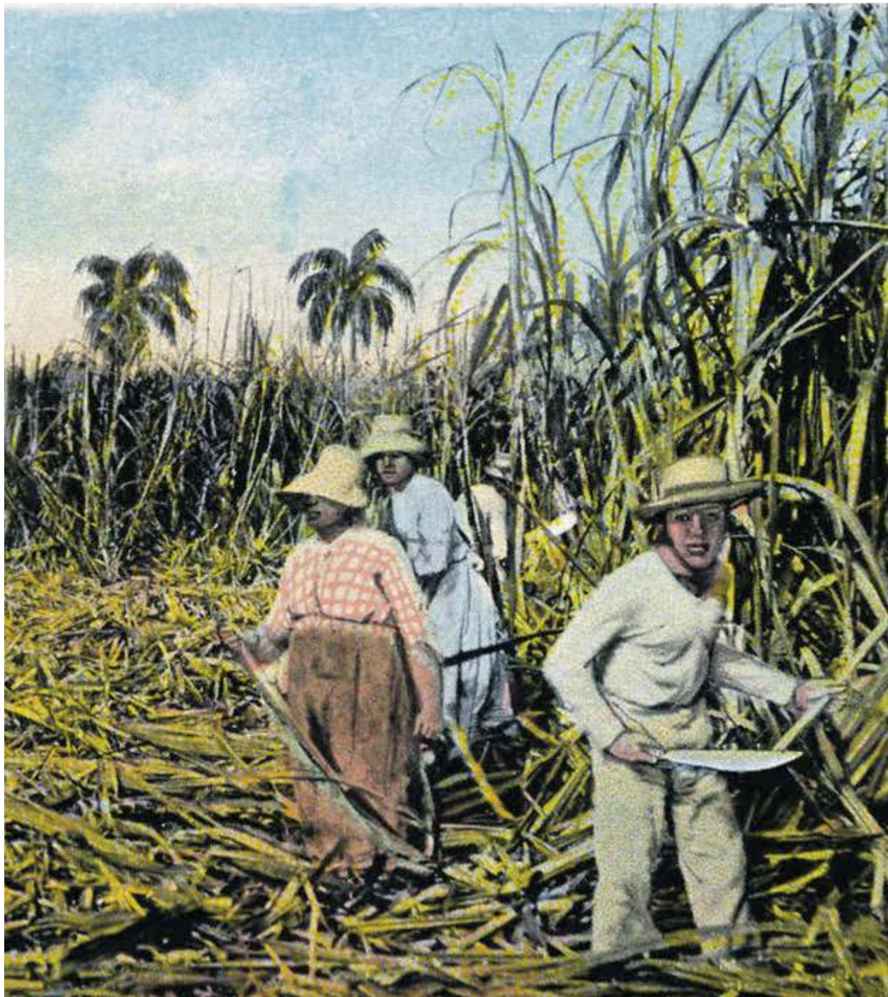
Plantacja trzciny cukrowej na Kubie

Stany Zjednoczone wydarły Kubę hiszpańskim kolonizatorom, obiecując jej mieszkańcom wolność i demokrację. Jednak największe korzyści z interwencji odnieśli amerykańscy plantatorzy