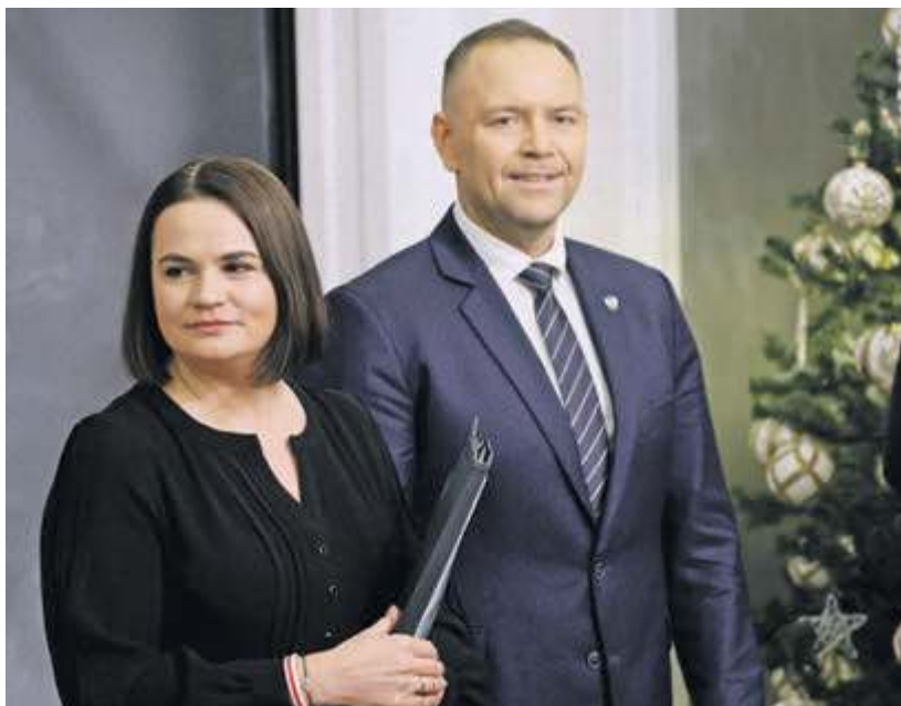
Swiatłana Cichanouska na spotkaniu z prezydentem Karolem Nawrockim, 13 stycznia 2026 r.