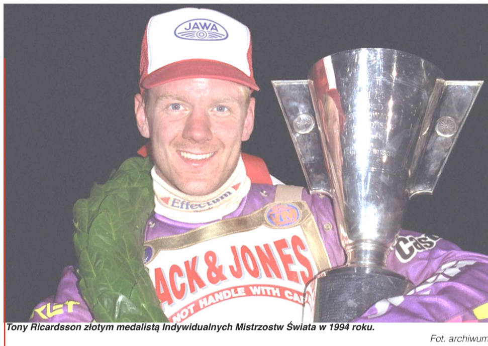
Tony Rickardsson złotym medalistą Indywidualnych Mistrzostw Świata w 1994 roku.