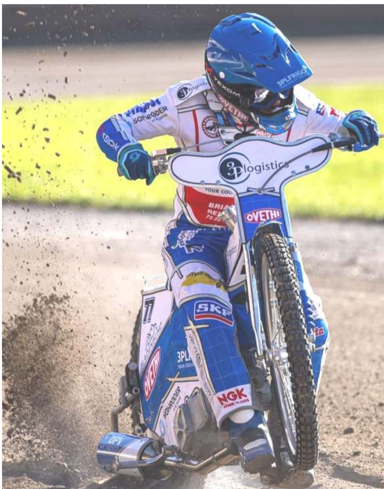
- Moim życiem był żużel i to była jedyna rzecz, w której byłem naprawdę dobry — twierdzi Nicki Pedersen.

W Gdańsku, podczas spotkania promującego autobiografię, Duńczyk zdyktował sobie pancerz legendy. Zamiast opowieści o trofeach i medalach były historie o strachu, presji i codzienności, w której żużel nie był wyborem ani spełnieniem marzeń, lecz koniecznością. To właśnie tam Pedersen pokazał, kim naprawdę był, zanim stał się mistrzem i kim musiał się stać, żeby przetrwać.