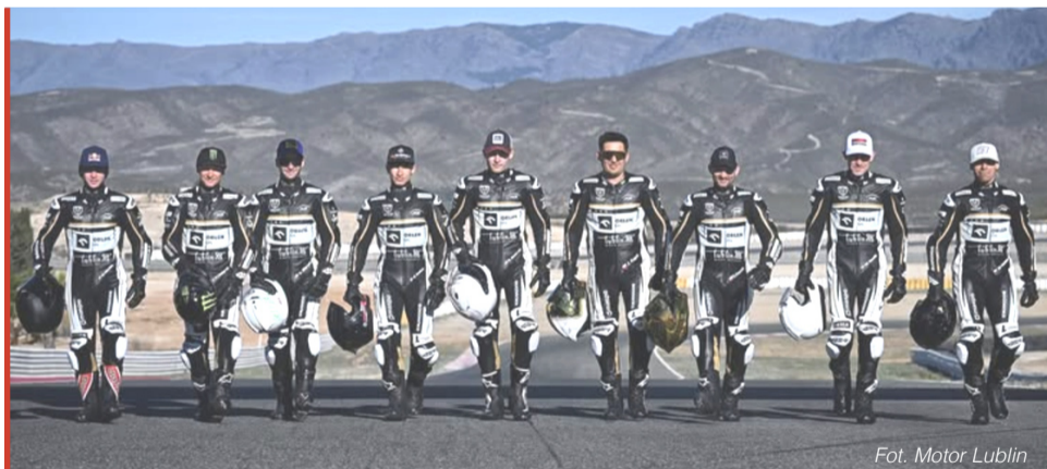
Drużyna Motoru Lublin w nowych kevlarach.

- Fascynuje mnie duża szybkość. Po takiej dawce jazdy na ścigaczu, potem wydaje ci się, że na żużlu jedziesz jak ślimak. A poza tym, czas przewidywania na żużlu powiększa się, bo masz wrażenie, że w speedwayu robisz to w wersji slow motion w porównaniu do asfaltu! Zwróć uwagę, że jeżeli na żużlu osiągamy maksymalną prędkość, strzelam, te 127 km na godz., a jadąc na motorze wyścigowym z pojemnością do 600 cc, rozpędzam się do ponad 200 km na godz. Dohamowuję do zakrętu, a czas reakcji przeznaczony na przewidy-