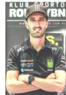
To sport, który czasem zabiera więcej, niż daje — mówiły osoby z otoczenia Chrisa Holdera.

Los Chris Holdera pokazuje drugą stronę żużla. Mistrz świata z 2012 roku był jednym z największych talentów swojego pokolenia — szybki, efektowny, nieprzewidywalny.