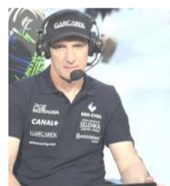
Każdy upadek czegoś uczy. W żużlu musisz odbudować ciało, ale przede wszystkim głowę — mówi Tomasz Gollob.

Dla polskiego sportu żużlowego nazwisko Tomasz Gollob to coś więcej niż sportowa biografia. To symbol epoki, determinacji i nieustannej walki. Jego kariera była pasmem sukcesów, ale także bólu i powrotów, które hartowały charakter.