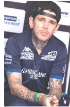
Kontuzja uczy pokory. Nagle rozumiesz, że nie wszystko kontrolujesz — mówi Tai Woffinden.

świata imponował przygotowaniem fizycznym, precyzją i mentalną stabilnością. Wydawało się, że jest jednym z najlepiej przygotowanych zawodników swojego pokolenia a dodatkowo łączył to z pasjami. A jednak nawet jego nie ominęła brutalna strona żużla.