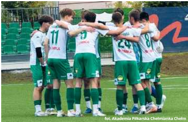
fol. Akademia Piłkarska Chełmianka Chełm

● PIŁKA NOŻNA Wynikiem 2:2 zakończyło się spotkanie juniorów Chełmianki z równolatkami z Górnika Łęczna w ramach następnej kolejki I ligi wojewódzkiej.