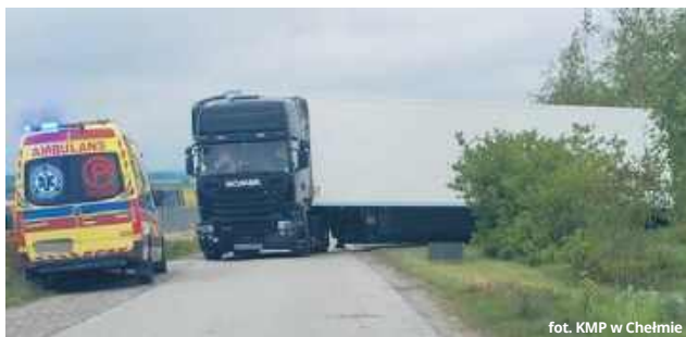
fol. KMP w Chełmie

● GM. CHEŁM W piątek, 16 maja, tuż przed godziną 7:00, na drodze w Srebrzyszczu doszło do tragicznego zdarzenia. Ciężarówka z naczepą nagle zjechała na pobocze, a jej kierowca stracił przytomność. Wszystko wskazuje na to, że 63-letni obywatel Ukrainy zasnął podczas jazdy i w ostatnim momencie próbował bezpiecznie zatrzymać pojazd.