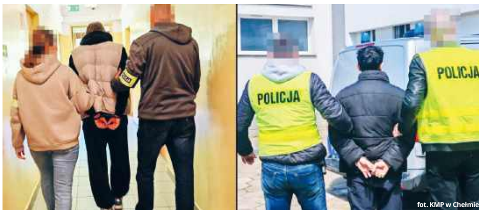
fol. KMP w Chełmie

Niedługo po tym przez komunikator internetowy skontaktowała się z nią osoba zainteresowana ich zakupem, przysyłając jednocześnie fałszywy link do płatności. Pokrzywdzona, będąc przekonana o autentyczności strony, zalogowała się przez nią do bankowości internetowej – informuje nadkomisarz Ewa Czyż, rzeczniczka