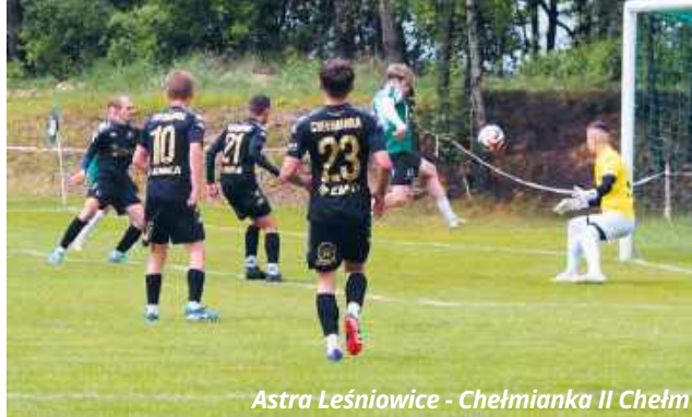
Astra Leśniowice - Chełmianka II Chełm