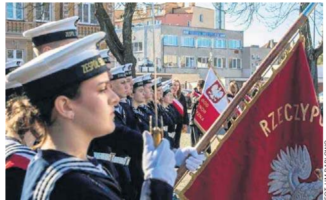
W uroczystości uczestniczyli przedstawiciele Straży Granicznej, Policji, Straży Miejskiej oraz delegacje szkół

W uroczystości uczestniczyli także przedstawiciele służb mundurowych: Straży Granicznej, Policji oraz Straży Miejskiej, a także delegacja szkół i lokalnych instytucji oraz przedstawiciele Klubów Pionierów z Koszalina i Kołobrzegu. Podczas uroczystości wspomniano także żyjących pionierów miasta Darłowo, podkreślając ich rolę w odbudowie i tworzeniu polskiej społeczności w powojennym mieście. Uczczono również minutą ciszy pamięć zmarłych pionierów, cześć ich pamięci.