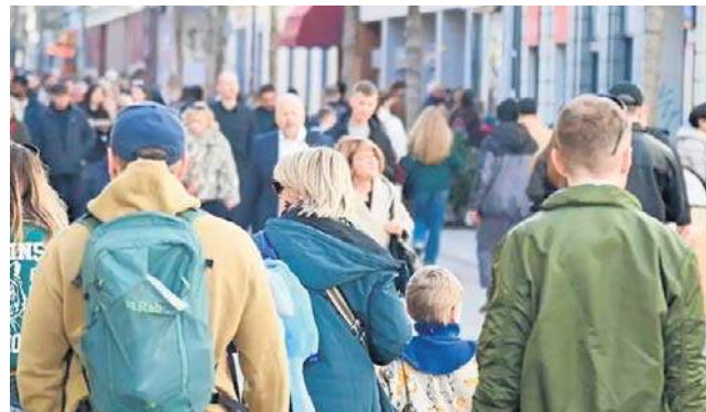
W 2025 r. wzrosła liczba zwolnień lekarskich jednodniowych, szczególnie przed weekendami

Najniższy wskaźnik absencji odnotowano w grupie wiekowej pracowników do 29. roku życia - 2,13%. Najwyższy wskaźnik dotyczył pracowników powyżej 50. roku życia i wyniósł 4,87%, czyli