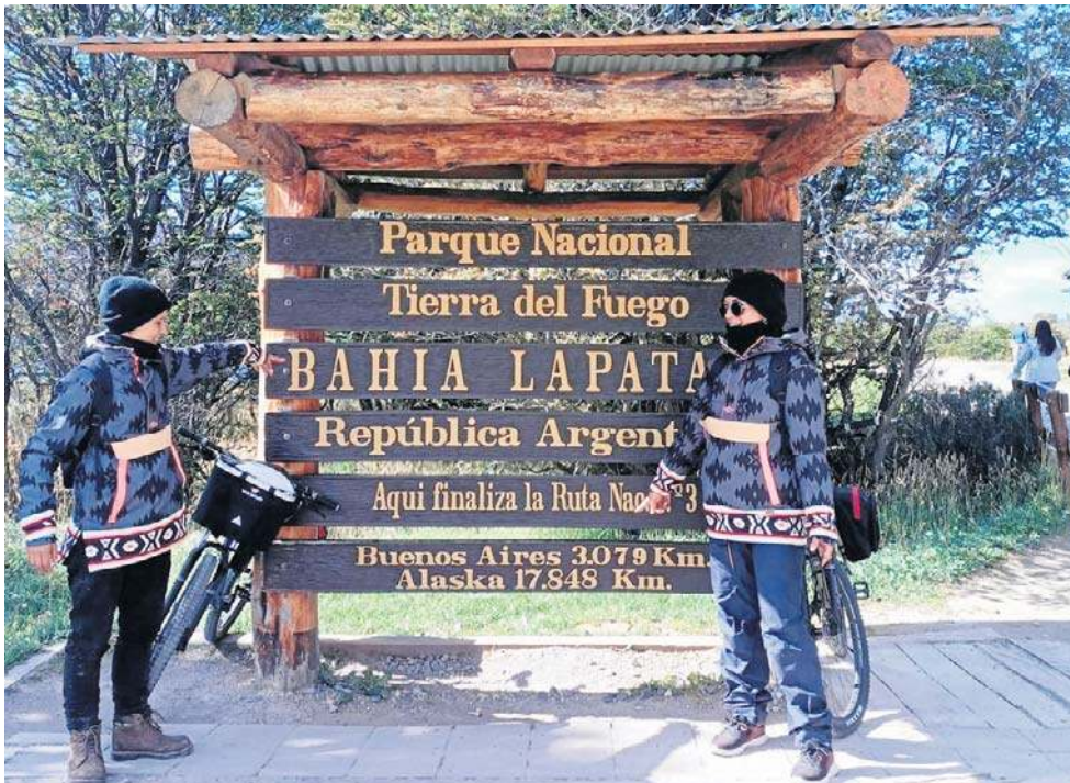
Ruszyły 8 marca, w Dzień Kobiet, z Argentyny, z miasta Ushuai, położonego najbliżej jak się da Antarktydy. Mają na to wszystko przygotowane 100 tysięcy złotych

Dziewczyny jadą najpierw do stolicy Argentyny. Planują dokonać tego w dwa - trzy miesiące. Potem pojadą do Santiago de Chile