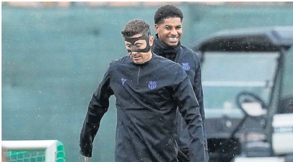
Robert Lewandowski (w masce ochronnej) i Marcus Rashford szykują się do starcia na St. James' Park. Stawką jest ćwierćfinał Ligi Mistrzów

Większość meczów na ławce spędza Wojciech Szczęsny. Były reprezentant Polski pełni rolę rezerwowego i gra tylko, gdy nie może wystąpić Joan Garcia. Lewandowski i Szczęsny we wtorek zmierzają się na St. James' Park z Newcastle. Średniak z Anglii jest groźny, zwłaszcza u siebie. W ostatnim meczu ligowym, „Sroki”, ograły Manchester Uni-