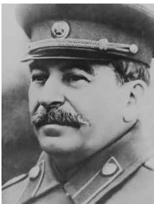
Józef Stalin zmarł 5 marca 1953 roku

Na grobie Stalina, w formie hermy, codziennie leżą świeże kwiaty. Podobnie jak na jego dwóch innych moskiewskich pomnikach: w Parku Poległych i w Ogólnorosyjskim Centrum