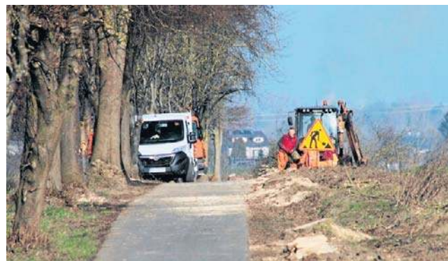
Wykonawca od podpisania umowy będzie miał 120 dni na wykonanie prac. Okres gwarancji to pięć lat.

Oferty na przetarg, jaki ogłosił Powiatowy Zarząd Dróg z siedzibą w Manowie, zostały otwarte tuż przed weekendem. Chodzi o gruntowną przebudowę ścieżki rowerowej z Mścic do Mielna oraz w samym Mielnie w powiecie koszalińskim. To łącznie blisko 5 kilometrów nowoczesnej trasy dla rowerów. Ma mieć aż 3 metry szerokości, powstaną