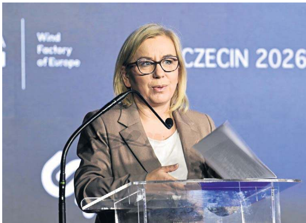
Paulina Hennig-Kloska, minister klimatu i środowiska, podkreśliła, że w ubiegłym roku Polska wyprodukowała ponad 31 proc. energii z OZE

Dodała, że rozwój tego typu inwestycji otwiera także przestrzeń do budowy własnych kompetencji technologicznych. Jako przykład wskazała powstający w Polsce, w Żarnowcu, jeden z największych magazynów energii w Europie. Podkreśliła, że takie podejście wzmacnia bezpieczeństwo energetyczne i pozwala budować bardziej niezależny, oparty na krajowych zasobach system energetyczny.