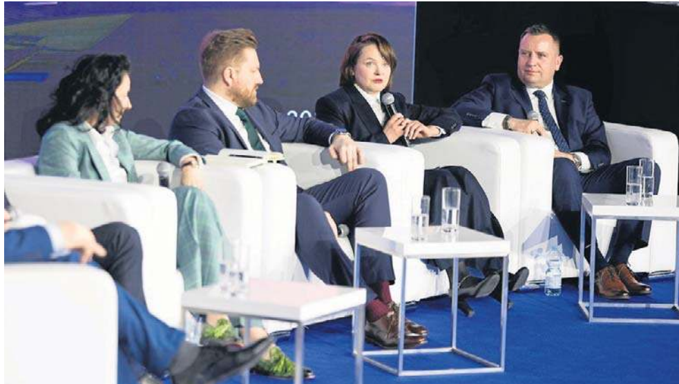
Trzeba obniżyć koszty i dostosować kontrakty do krajowych wykonawców

- Jeśli chodzi o onshore, nasza aktualna strategia, która została przyjęta w styczniu zeszłego roku, mówi o blisko 13 GW mocy zainstalowanej w OZE - przypomniał jednocześnie.