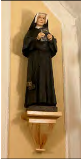
(mim)