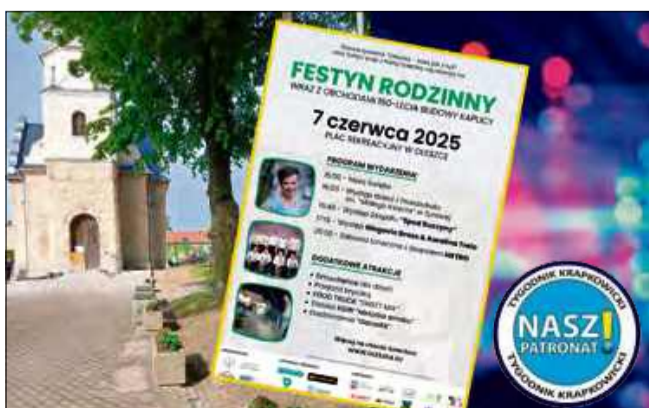
7 czerwca na placu rekreacyjnym w Oleszce odbędzie się wyjątkowy Festyn Rodzinny.

Już w najbliższą sobotę 7 czerwca na placu rekreacyjnym w Oleszce odbędzie się wyjątkowy Festyn Rodzinny, połączony z obchodami 150-lecia budowy miejscowej kaplicy. To doskonała okazja, by spędzić czas w gronie rodziny i sąsiadów, ciesząc się występami artystycznymi, smacznym jedzeniem i licznymi atrakcjami dla dużych i małych.