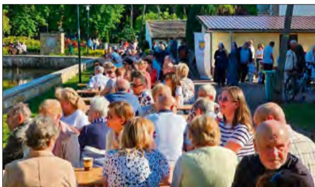
Tłumy ludzi wysłuchali pierwszego koncertu.

Można powiedzieć, że cykl koncertów na Placu Myśliwca w Kamieniu Śląskim to już mała, lokalna