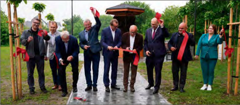
Uroczyste przecięcie wstęgi przy nowej strefie relaksu.

Boiska, tężnia solankowa, ścieżki rekreacyjne, strefy relaksu - gmina Walce inwestuje w jakość życia mieszkańców. 30 maja otwarto w Walcach, Kromolowie, Grocholubiu i Straduni cztery nowe obiekty sportowo-rekreacyjne o łącznej wartości ponad 5,5 mln zł. Cztery lokalizacje, cztery różne potrzeby - i jedna wspólna koncepcja: funkcjonalna przestrzeń dla mieszkańców.