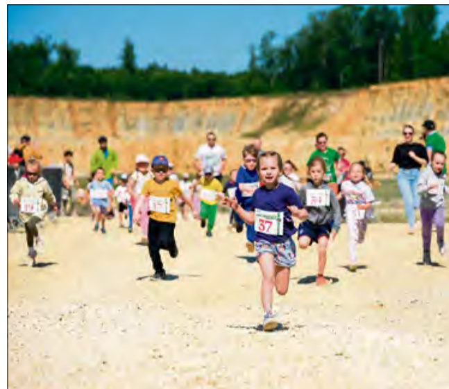
O godzinie 10.00 wystartowały dzieci.

Po zakończeniu rywalizacji zaprosiliśmy naszych zawodników i kibiców na piknik. O smakołyki z grilla i nie tylko zadbała stołówka z Choruli. Z kolei na najmłodszych czekało mnóstwo atrakcji: popcorn, wata cukrowa, malowanie