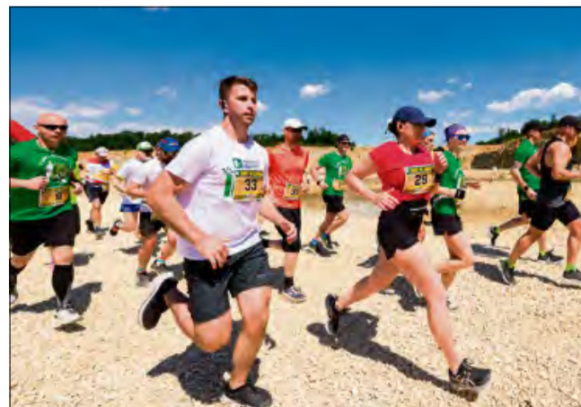
Wydarzenie cieszy się wielkim powodzeniem.