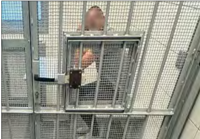
I tak zawiadamiający... sam trafił za kratki.

Policjanci, zgodnie z procedurą, poprosili o dokumenty. Sprawdzili dane w systemie. I tu niespodzianka – mężczyzna powinien już od jakiegoś czasu siedzieć.