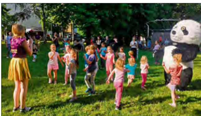
Dzieci chętnie bawiły się razem z misiem pandą podczas Dnia Dziecka w parku „Magnolia” w Krapkowicach.

Z kolei panie z Miejskiej i Gminnej Biblioteki Publicznej w Krapkowicach wykazały się nie lada talentem plastycznym. To one