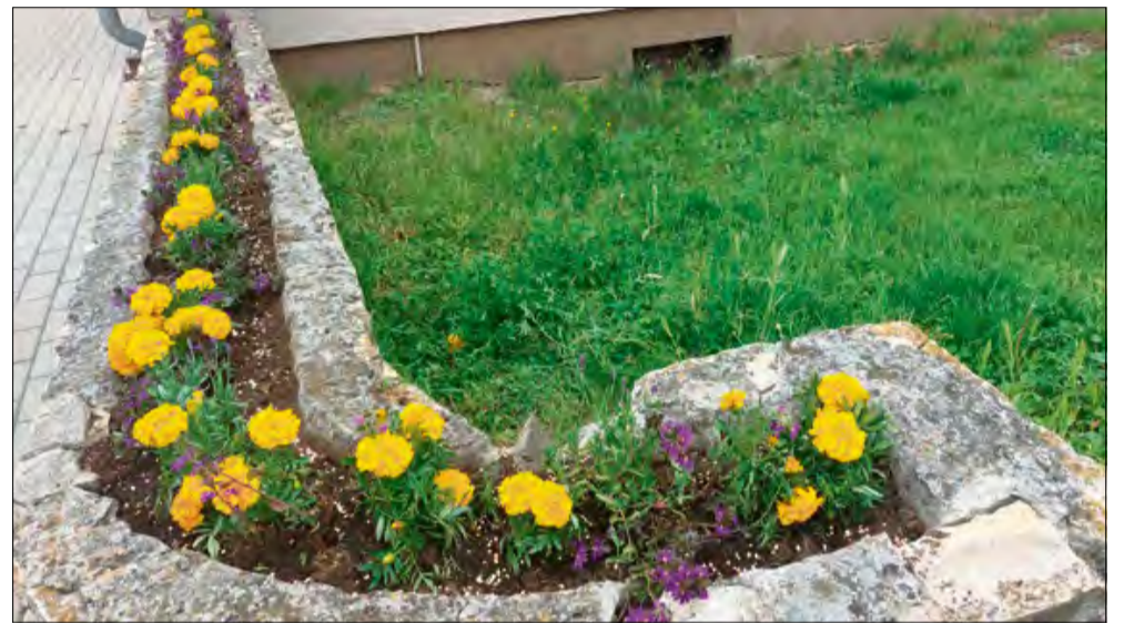
- Czujemy, że komuś zależy - mówi jeden z mieszkańców Krapkowic.

Kiedy redakcja „Tygodnika Krapkowickiego” przeniosła się do nowej siedziby przy ulicy Opolskiej, nikt nie spodziewał się, że wkrótce ta część miasta zyska nie tylko nowych sąsiadów, ale i zupełnie nowe oblicze. Dzięki redakcyjnej inicjatywie i szczerzej chęci zadbania o wspólne otoczenie, 15 maja przestrzeń wokół budynku zaczęła po prostu... kwitnąć.