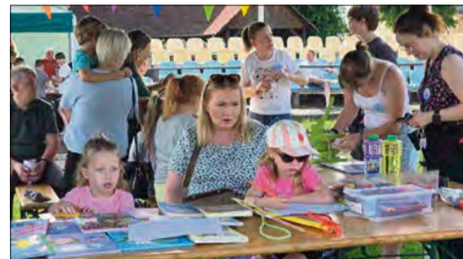
Ogromnym zainteresowaniem cieszyła się również strefa kreatywna.

- Było też stoisko z książkami dla małych czytelników, chwila relaksu przy kawie i słodkim poczęstunku