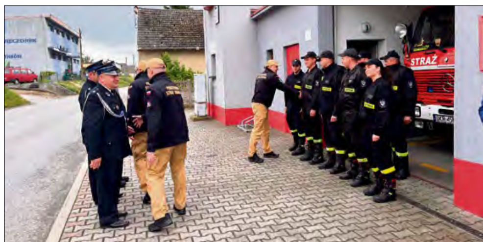
Wizyta ta była symbolicznym podkreśleniem roli, jaką odgrywają ochotnicze strażnice pożarne.

Podczas spotkania druhowie z Walce oprowadzili gości po strażnicy, prezentując nie tylko zaplecze techniczne jednostki, ale przede wszystkim jej osiągnięcia, działania na rzecz społeczności lokalnej oraz plany dotyczące dalszego rozwoju. Nie zabrakło także chwili refleksji – przypomniano historię jednostki i drogę, jaką przeszła, by stać się jedną