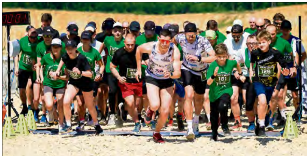
Zawodnicy wystartowali w II już biegu po kopalni.

Wszyscy pochwalili się kapitalną formą, pokonując wyznaczone dystanse znacznie wcześniej niż w ustalonym regulaminowo czasie. Niektóre wyniki jednak imponowały szczególnie, a ich „właściciele” uhonorowaliśmy statuetkami i medalami na podium w aż dziesięciu kategoriach. Poznajcie zwycięzców i ich czasy: