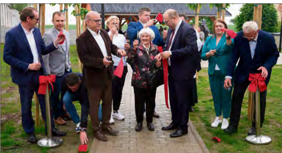
Oficjalne otwarcie obiektu rekreacyjnego z udziałem mieszkańców.

Więcej zdjęć na www.tygodnik-krapkowicki.pl .