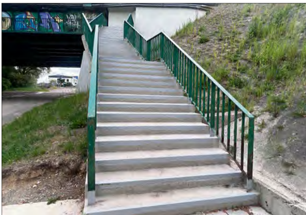
Schody po opadach deszczu są bardzo śliskie.

W ostatnim czasie zostały wyremontowane schody umożliwiające pieszym i rowerzystom wejście na most autostradowy łączący Rogów Opolski i Odrowąż. Niestety po opadach deszczu stopnie są tak śliskie, że łatwo się na nich poślizgnąć. „Jest niebezpiecznie” - mówi interweniujący czytelnik.