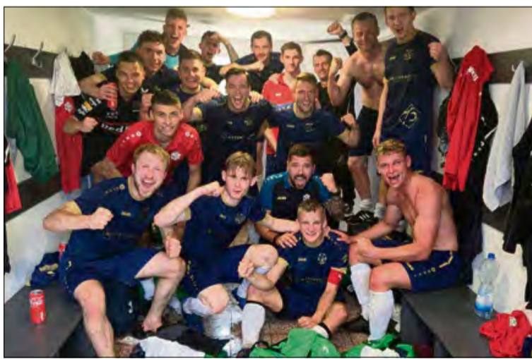
„Boiska w Raclawiczkach pewnie nie dożyjemy, ale pomnik dla pana z nr.10 myślę można już stawiać!” – tak brzmi jeden z wpisów na fejsbukowym koncie klubu po wygranej w Domaszkowicach.

W sobotnie popołudnie okazało się, że nasz zespół ma patent na lidera, z którym jesienią przed własną publicznością podzielił się punktami remisując 1-1. W rewanżu było jeszcze lepiej, bo po arcytrudnym pojedynku ekipa spod Strzeleczek, dosłownie w ostatniej chwili zdołała wyszarpać pełną pulę. – To był bardzo ciężki