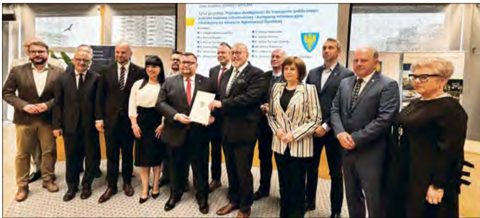
Dzięki unijnemu wsparciu powstaną ścieżki rowerowe i zrównoważony transport.

Jeśli chodzi o gminę Tarnów Opolski, to zaplanowano budowę ścieżki pieszo-rowerowej o długości 1,5 km w ciągu drogi powiatowej nr 1712 O na odcinku Miedziana – Przywory. W projekcie uwzględniono też budowę parkingu Bike&Ride w Miedzianej ze stanowiskami na rowery. Zadanie to będzie realizowane przez gminę Tarnów Opolski