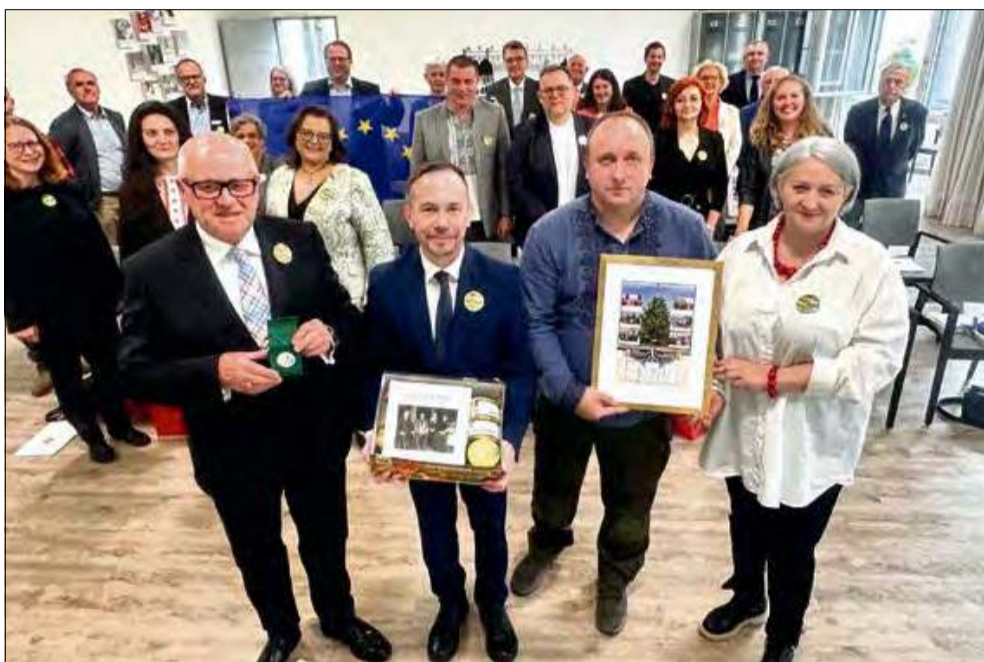
Delegacja z Polski przekazała przyjaciołom z powiatu Altenkirchen symboliczną grafikę przedstawiającą drzewo partnerstwa rosnące przy Starostwie Powiatowym w Krapkowicach.

Biorąc udział w wydarzeniu delegacja Rejonu Iwano-Frankińskiego podkreślała, że Ukraina z szacunkiem i wdzięcznością patrzy na europejską pomoc i współpracę, zaznaczając, że wojna tocząca się w ich kraju odarła życie z iluzji, przypominając o wartościach, które naprawdę się liczą – god-