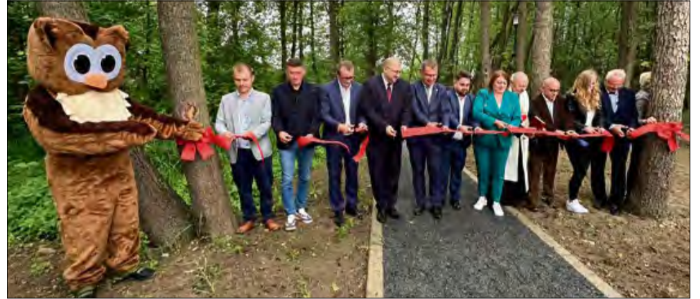
Symboliczne otwarcie nowej przestrzeni rekreacyjnej dla mieszkańców.

Zwianiem wydarzenia była symboliczna seria strzałów na bramkę – w roli bramkarza