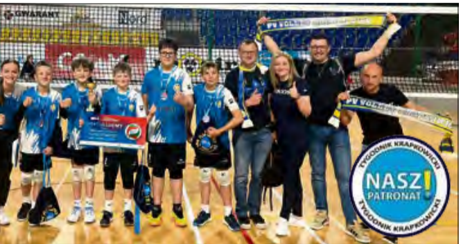
Młodzi siatkarze PV Volley Krapkowice sięgnęli po brąz w wojewódzkim finale Kinder Joy of Moving i wywalczyli awans do ogólnopolskiego turnieju.

W fazie finałowej przyszło się zmierzyć z mocnymi ekipami – Nysą I oraz ZAKSĄ I. Oba mecze, mimo walecznej