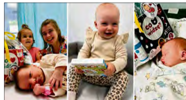
Maluszki otrzymały pierwsze swoje książeczki edukacyjne.

dość nie tylko dzieciom, ale również ich rodzicom.