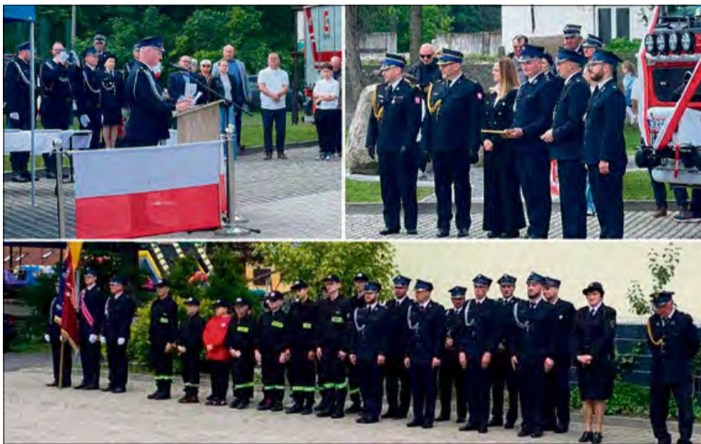
24 maja na placu przed remizą OSP w Rozwadzy świętowano 135. urodziny jednostki.

Sobotnie świętowanie (24 maja) rozpoczęło się od podniosłych chwil. Przed południem odbył się wymarsz spod remizy na jubileuszową mszę świętą sprawowaną w intencji strażaków. Po liturgii uczestnicy przemaszowali z powrotem pod remizę, gdzie miał miejsce uroczysty apel. Po południu nadszedł czas na dalsze świętowanie. Zorganizowany z tej wyjątkowej okazji festyn zgromadził nie tylko mieszkańców, ale też gości. Na scenie pojawiły się m.in.: dzieci z PSP 2 w Zdzieszowicach, zespół Rozśpiewane Serca Opol-szczyzny. Świętowanie tego