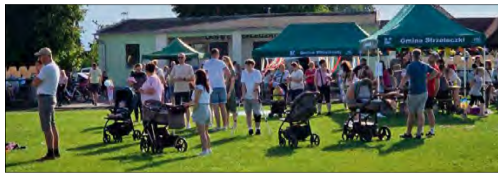
Na uczestników czekało moc atrakcji.

W Strzeleczyńskich odbyło się wielkie święto z okazji Dnia Dziecka. Wydarzenie miało miejsce w sobotę 31 maja na boisku sportowym.