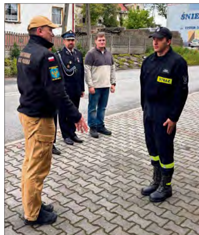
Druhowie oprowadzili gości po strażnicy.