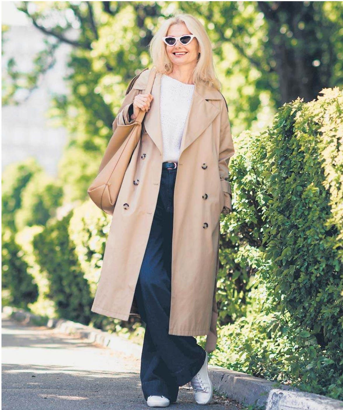
Trencz zazwyczaj ma luźny, lekko oversizowy krój, z szerokimi ramionami i paskiem w talii, który pozwala na optyczne modelowanie sylwetki

Trencz damski to rodzaj płaszcza. Jego klasyczna wersja ma dwurzędowe zapięcie i charakterystyczny pasek z kłamrą. Wywodzi się z mody męskiej. Sama nazwa pochodzi od angielskiego słowa, które oznacza „okop”. Za stwórcę tego okrycia wierzchniego uznaje się Thomasa Burberrego, który w latach 20. uszył dla żołnierzy długie, lekkie płaszcze wykonane z nieprzemakalnego i materiału, który chronił ich także od wiatru. Z czasem płaszcz wszedł do mody i nosili go popularni amanci lat 40., m.in. Humphrey Bogart. Przez wiele lat obecności na rynku płaszcz ten zmieniał także swój krój i przeznaczenie. Obecnie jest jednym z najbardziej pożądanych kobiecych okryć wierzchnich. A kto go rozpromował wśród pań? Oczywiście Audrey Hepburn w kultowym filmie „Śniadanie u Tiffaniego”. I tak trencz damski beżowy stał się elementem garderoby, który zawitał do każdej kobiecej szafy. Teraz występuje w innych kolorach, takich jak czarny, granatowy, czerwony, a nawet zielony. Trencz damski zapinany jest na 2 rzędy guzików.