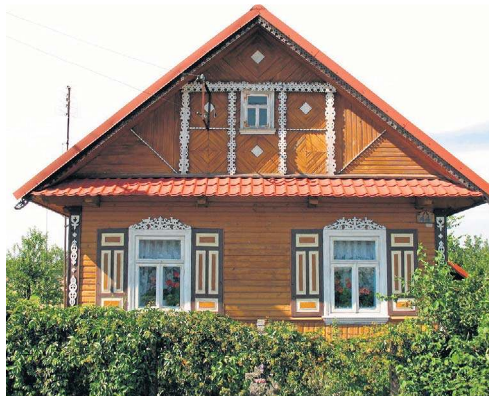
Misterne wyrezki i jasne kolory domów w Krainie Otwartych Okiennic urzekają o każdej porze roku

na z cudów ikona Matki Bożej, namalowana w XVIII w. Według lokalnej legendy właśnie do tej ikony, wiszącej wówczas jeszcze nie w cerkwi, lecz na drzewie, miał się Kraina Otwartych Okiennic słynie z zabytkowych drewnianych domów o charakterystycznych zdobieniach. Naroża ich ścian, okna, okiennice i dachy zdobią wycięte w drewnie wzory roślinne i geometryczne, pomalowane na jaskrawe kolory. To tzw. wyrezki