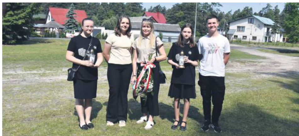
Młodzież oddała hołd bohaterom walki o wolność ojczyzny.