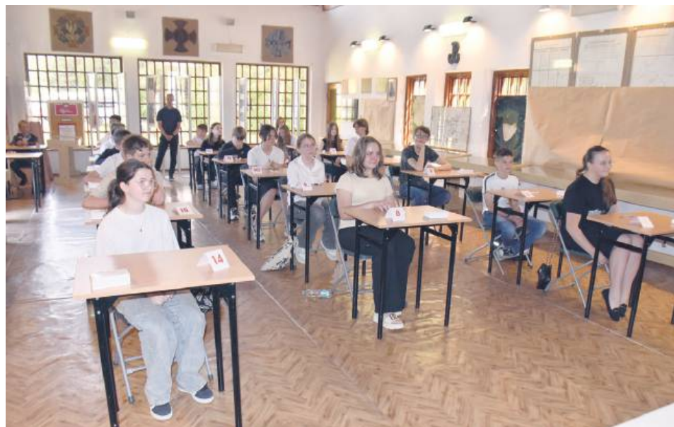
W konkursie udział wzięło 33 uczniów.