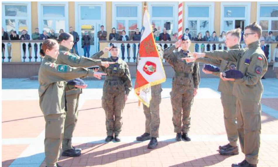
Ocenie podlegała m.in. liczba uczniów, którzy złożyli przysięgę wojskową.