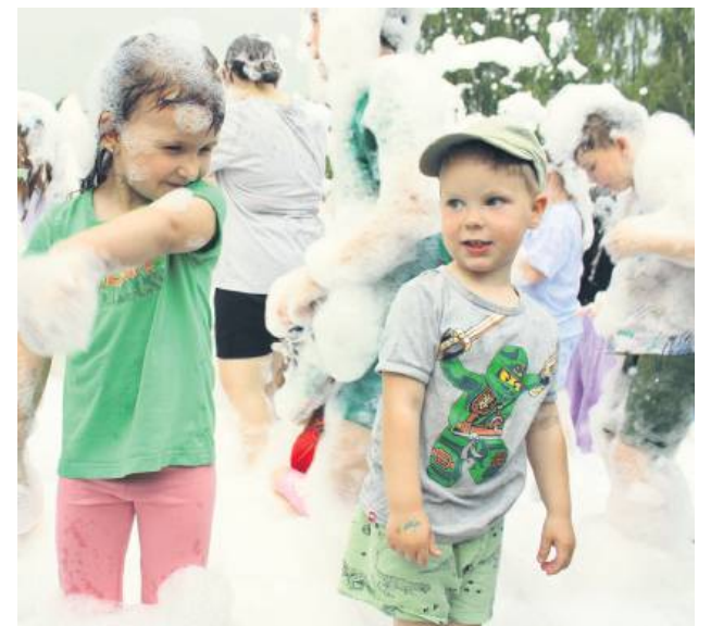
Zabawa w pianie – na to czekały wszystkie dzieci.

kąsek. Na miejscu były też stoiska z zabawkami i smakołykami. Panie z Koła Gospodyń Wiejskich „Sąsiadeczki” przygotowały stół pełen domowych wypieków i lokalnych przysmaków. Tradycyjnie dzieci otrzymały na imprezie drobne upominki przekazane przez firmę EDP Renewables.