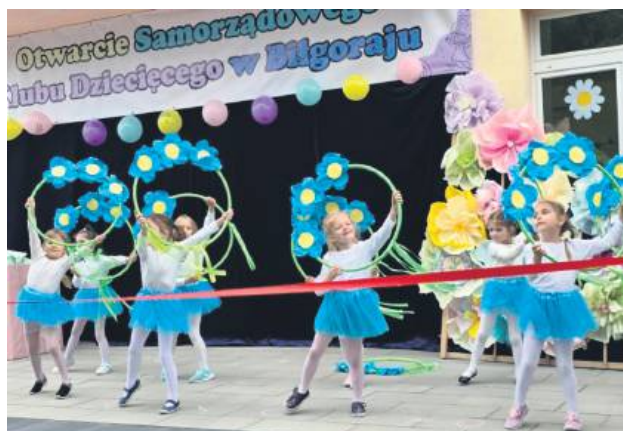
Część artystyczna w wykonaniu przedszkolaków.