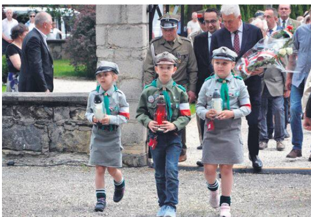
Obchody odbyły się 1 czerwca.

Dalsza część obchodów odbyła się przy pomniku ofiar pacyfikacji, zgodnie z ceremoniałem