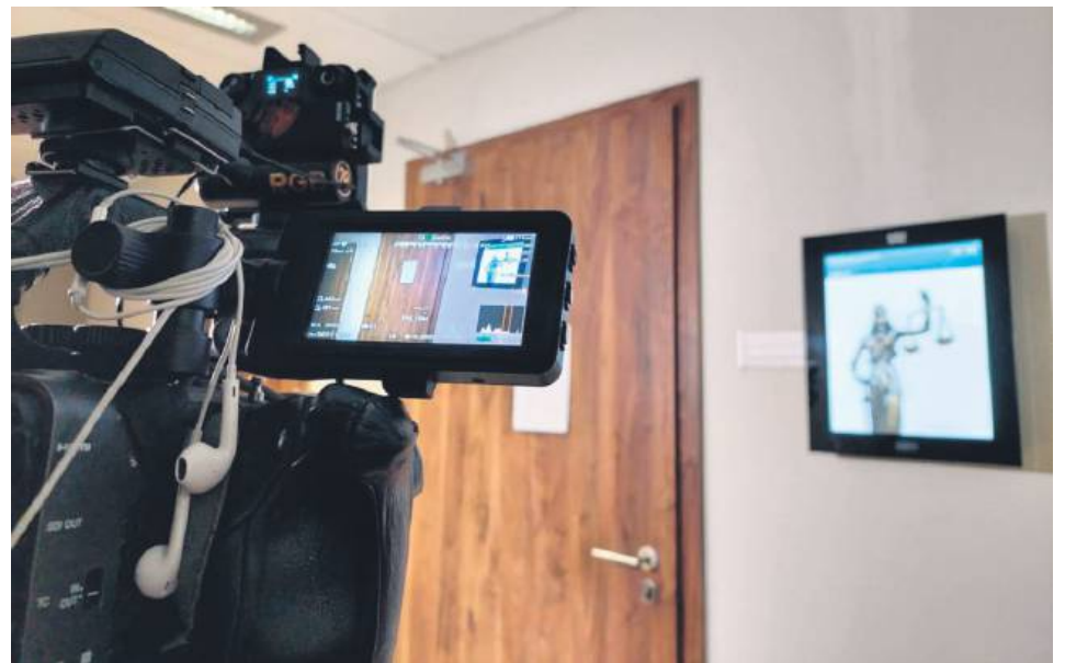
Sąd w Lublinie rozpozna sprawę od początku i dopiero wtedy ogłosi ostateczny wyrok.

Proces toczył się przed Sądem Okręgowym w Zamościu i za-