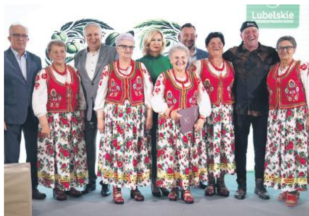
Reprezentantki KGW z Czartowczyka odbierają nagrodę za zajęcie pierwszego miejsca.

Drugie miejsce za tort tradycyjny przyznano Kołu Gospodyń Wiejskich „Wólcanka” z Wólki Pukarzowskiej, a trzecie – Kołu