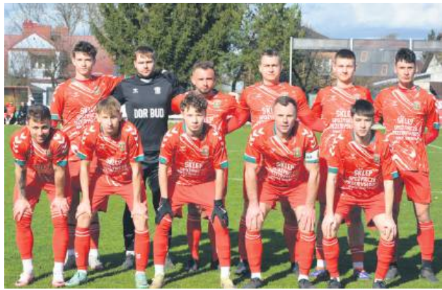
Roztocze Szczepieszyn przewodzi w rozgrywkach zamojskiej klasy A. Zespół ten po trzech latach przerwy znów będzie uczestniczył w rywalizacji w „okręgówce”, a jego awans zbliżył się do jubileuszu 100-lecia klubu sportowego ze Szczepieszyna.