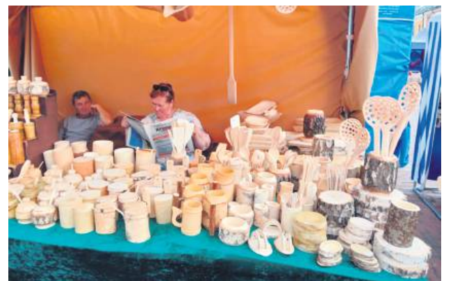
Odwiedzający mogli podziwiać i kupować rzeźby, koronki, ceramikę, biżuterię, ludowe zabawki, beczki, haftowane chusty, a także skosztować lokalnych przysmaków – od wędlin i serów po domowe pierożki i chałwy.