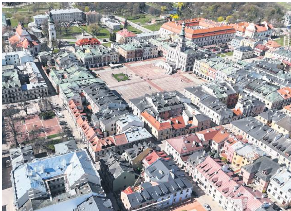
Zamość, który w latach swojej świetności „dobijał” do 70 tys. mieszkańców, zamieszkiwało na koniec ub. roku zaledwie 57,5 tys. osób.

GUS zwrócił też uwagę na wzrost indeksu starości. W 2024 roku wyniósł on 141 – oznacza to, że na 100 dzieci w wieku 0-14 lat przypada 141 seniorów, czyli osób w wieku