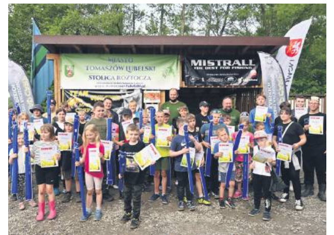
Zawody wędkarskie zorganizowane przez koło PZW „Tomasz” nr 12 w Tomaszowie Lubelskim przyciągnęło bardzo dużo dzieci i młodzieży.

Zawody przyciągnęły młodych pasjonatów wędkarstwa oraz ich rodziny, tworząc atmosferę pełną sportowej rywalizacji, radości i wspólnej zabawy. Uczestnicy mieli okazję nie tylko sprawdzić swoje umiejętności wędkarskie, ale również spędzić czas na świe-