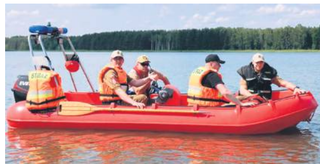
Działania odbywały się m.in. na zbiorniku wodnym w Biszczy.