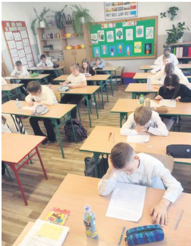
Od 1 września szkoła i przedszkole w Tyszowcach będą działały jako samodzielne jednostki.

Głos w sprawie zabrał inspektor ds. oświaty Paweł Kliszcz ,