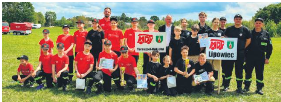
Młodzieżowe zawody pożarnicze cieszą się coraz większą popularnością.

Ogień pasji i ducha drużyny – tak w skrócie można opisać Powiatowe Zawody Młodzieżowych Drużyn Pożarniczych, które odbyły się 31 maja w Goraju. W szranki