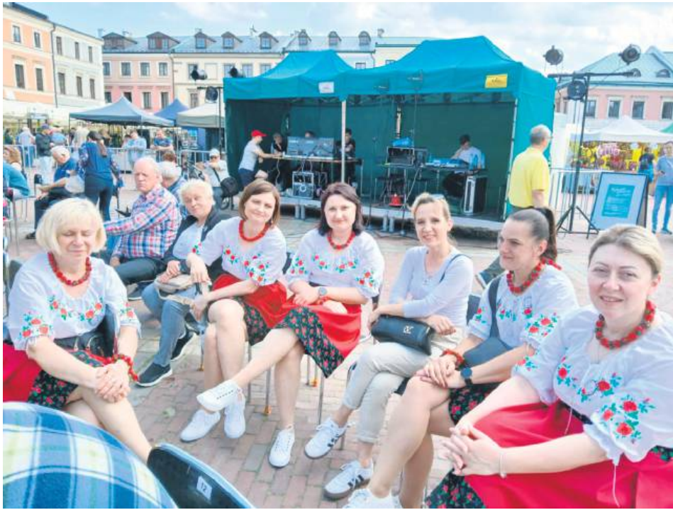
Pierwszego dnia na Rynku Wielkim podsumowano konkurs kulinarny „Smaki Zamościa i Roztocza”, organizowany przez Zamojski Dom Kultury i Lokalną Organizację Turystyczną „Zamość i Roztocze”.