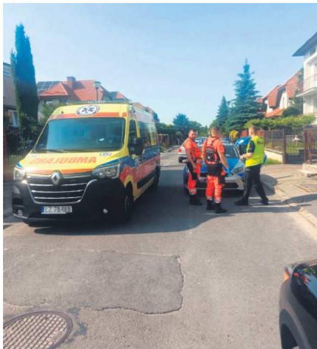
Karetka odwoziła 78-latkę do szpitala.