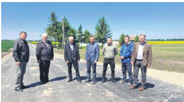
Nowe drogi to kolejny krok w kierunku poprawy jakości życia mieszkańców i bezpieczeństwa.

Już oficjalnie odebrano roboty drogowe realizowane w ramach zadania „Rozwój infrastruktury drogowej na terenie gminy Ulhówek”. To aż dziewięć odcinków dróg o długości prawie 4 kilometrów.