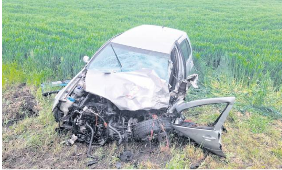
W wypadku drogowym w Sahryniu ranny został kierowca volkswagena golfa.