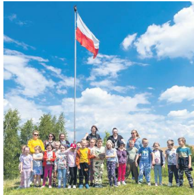
Jedną z wycieczek na Górę Ślimaka w Zadębcach były przedszkolaki z Miejskiego Przedszkola nr 1 im. Małego Księcia w Hrubieszowie.

– Pytali, czy to już Ukraina?! Byłem trochę zaskoczony tymi pytaniami, odparłem więc: „A niby co ma być?”. Oni naprawdę myśleli, że to już Ukraina. Mówię im więc: „Nie, tutaj jest Polska” i pokazuję na maszt z biało-czerwoną flagą na szczycie Góry Ślimaka. Przy okazji muszę podziękować dyrektorowi Realu z Nielewki, że sponsorował ten maszt. Najpierw stanął maszt, a na nim zawiesiłem flagę. Później tutej-