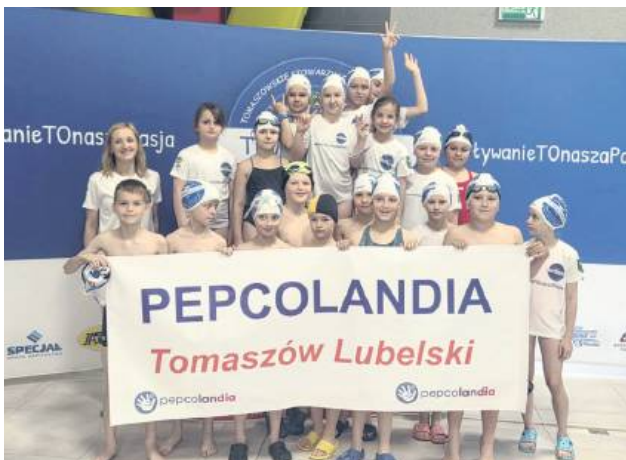
Dzieciaki bawiły się świetnie. Przy okazji wróciły do domu z pamiątkowymi medalami.

W zawodach udział wzięli zawodnicy z TSS Tomaszovia Tomaszów Lubelski, lokalnych szkółek pływackich, Klubu