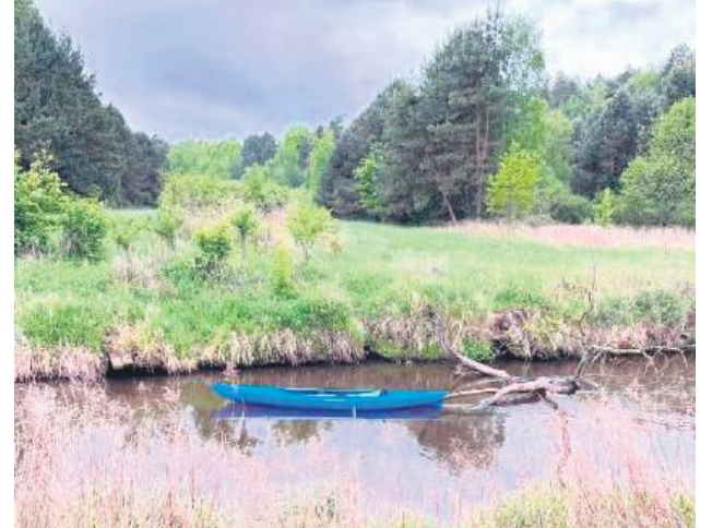
Podczas spływu kajakowego nastolatkiwie odłączyli się od grupy.

Chwile grozy przeżyli uczestnicy szkolnego spływu kajakowego na rzece Tanew, gdy dwóch chłopców odłączyło się od grupy i nie potrafiło odnaleźć drogi powrotnej. Jeden z nich wykazał się przytomnością umysłu i zadzwonił na numer alarmowy, informując, że nie wiedzą, gdzie się znajdują, a jego kolega doznał ataku paniki.