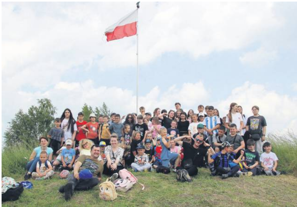
Świetne nastroje, uśmiechnięte twarze – uczniowie Szkoły Podstawowej z Malic (gmina Werbkowice) znakomicie bawili się na Górze Ślimaka.

Od ponad dwóch lat Góra Ślimaka jest miejscem spotkań, wizyt różnych wycieczek, a także sposobem na rekreację i wypoczynek okolicznych mieszkańców.