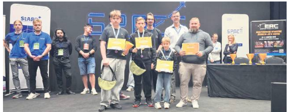
Drużyny Tech-Max SP2 w każdej z kategorii drużyny zdobyły podium.