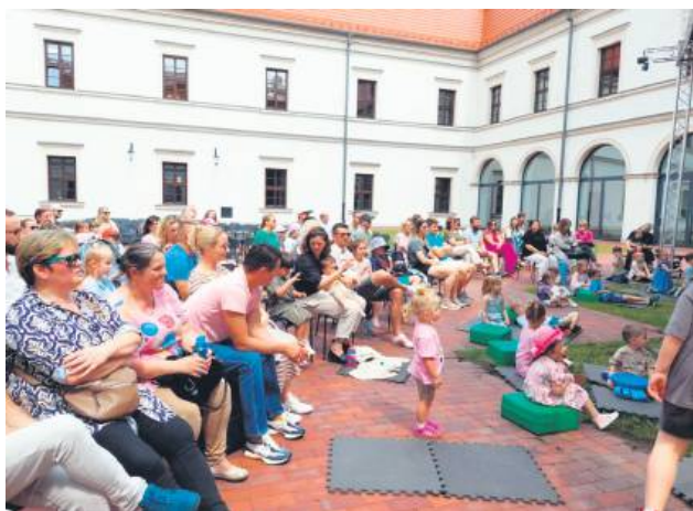
Na Dziedzińcu Zamojskiej Akademii Kultury Teatr Echo zagrał rodzinny spektakl „O kogutku co umiał działać do skutku”.