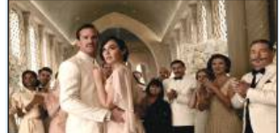
19.55 Śmierć na Nilu - film kryminalny, USA, Wielka Brytania, 2022, reż. Kenneth Branagh, wyk. Kenneth Branagh, Gal Gadot, Tom Bateman, Annette Bening, Russell Brand, Rose Leslie, Emma Mackey, Ali Fazel, Dawn French, Sophie Okonedo