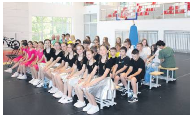
Hala będzie służyć społeczności lokalnej