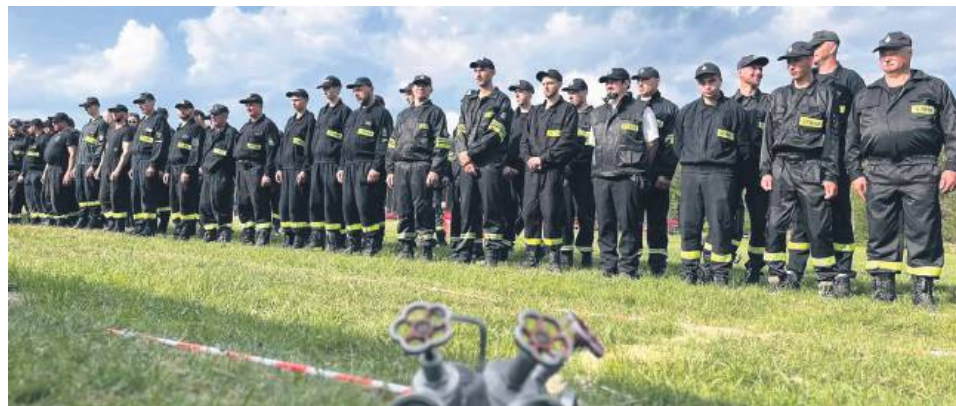
Druhowie z czterech gmin rywalizowali w Aleksandrowie.