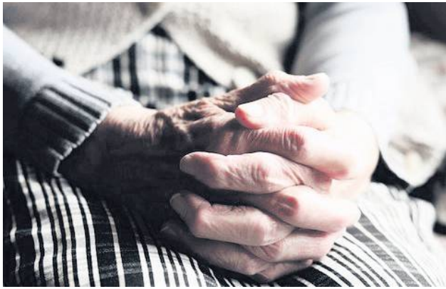
O tej bulwersującej sprawie pisaliśmy już wcześniej na łamach „Kroniki Tygodnia”.

O tym, że podopieczni jednego z prywatnych domów opieki w gm. Józefów mogą być źle traktowani, zawiadomiła organy ścigania zamojska delegatura Lubelskiego Urzędu Wojewódzkiego po przeprowadzonej kontroli w tej placówce. Śledztwo w tej sprawie wszczęła biłgorajska prokuratura, ale postępowanie – z uwagi na