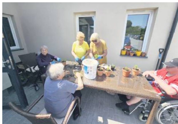
COM przy ul. Górnej w Zamościu rozpoczęło swoją działalność na początku roku.

Teren wokół Centrum Opiekuńczo-Mieszkalnego (COM) przy ul. Górnej 53 w Zamościu przez kilka godzin tętnił życiem. 5 czerwca zorganizowano tam wspólne sadzenie roślin w ramach projektu „Magiczny Ogród – EKO Serce Zamościa”, który jest realizowany w COM dzięki przyznanemu grantowi z Fundacji Santander Bank Polska.