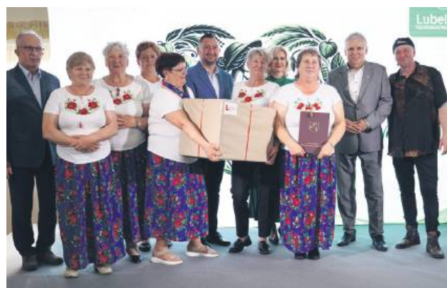
Na scenie KGW Kłocówka, zwyciężczynie konkursu w drugiej kategorii.