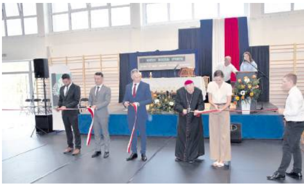
Po mszy św. miało miejsce przecięcie wstęgi.

– W mojej biskupiej posłudze miałem możliwość kilkakrotnie błogosławić hale sportowe – ta jest wyjątkowo imponująca. Sam również miałem w młodości doświadczenia ze sportem – oczywiście w wymiarze amatorskim, dla zdrowia i przyjemności. Piłka nożna, siatkówka, koszykówka, biegi przełajowe, siłownia czy strzelectwo – to były moje pasje