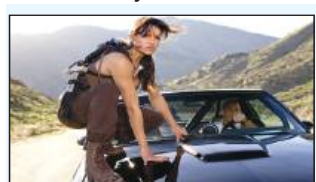
20.00 MEGA HIT - Szybko i wściekle - film sensacyjny, USA, Japonia, 2009, reż. Justin Lin, wyk. Vin Diesel, Paul Walker, Michelle Rodriguez, Gal Gadot, Jordana Brewster, John Ortiz