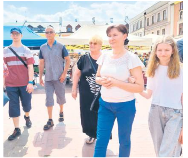
Jarmark Hetmański w Zamościu przyciągnął setki rękodzielników, wystawców, twórców ludowych i jeszcze więcej mieszkańców i turystów.