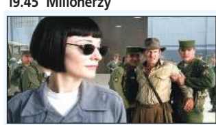
20.55 Indiana Jones i Królestwo Kryształowej Czaszki - film przygodowy, USA 2008, reż. Steven Spielberg, wyk. Harrison Ford, Cate Blanchett, Shia LaBeouf, Karen Allen