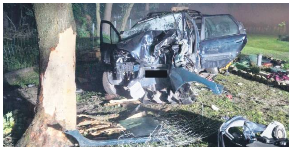
Tym samochodem kierowała pijana 22-latką bez prawa jazdy.

Ze wstępnych ustaleń policjantów pracujących na miejscu zdarzenia wynika, że kierująca samochodem osobowym marki