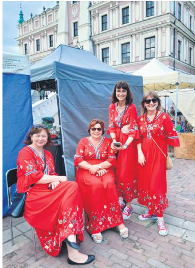
Na jarmarku nie mogło zabraknąć gospodyń, które dbają o lokalne tradycje.

Sobotni wieczór uświetnił spektakl obrzędowy „Chrciny w karczmie” w wykonaniu zespołu „Sołtycki” z Pawłowa, a niedzielne popołudnie – rodzinne przedstawienie „O kogutku, co umiał działać do skutku” przygotowane przez Teatr Echa. Dużym zainteresowaniem cieszył się także Konkurs Piosenki dla dzieci i młodzieży „Folk młodym głosem”, którego finałowy koncert odbył się w Dzień Dziecka na Rynku Wielkim.