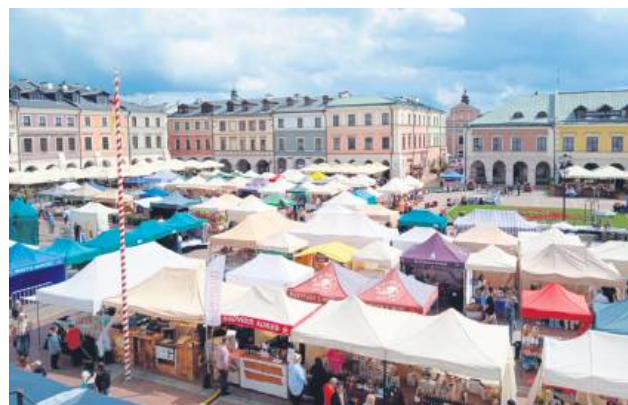
Od soboty rano w sercu Zamościa – na Rynku Wielkim, Wodnym i Solnym oraz na Dziedzińcu Zamojskiej Akademii Kultury – gromadzi się mieszkańcy i turyści, by wspólnie świętować jedno z najbardziej barwnych wydarzeń sezonu.