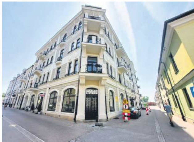
Jak usłyszeliśmy w magistracie, stawki bazowe czynszu nie były podnoszone od 2020 r., podczas gdy w tym czasie wzrosły wszystkie koszty mające wpływ na gospodarowanie lokalami.

Lokatorzy mieszkań znajdujących się w zasobach Zakładu Gospodarki Lokalowej w Zamościu skarżą się na kolejne podwyżki czynszu. Miejska spółka odpowiada, że w tym roku nastąpiła tylko jedna podwyżka opłaty zależnej od miasta.