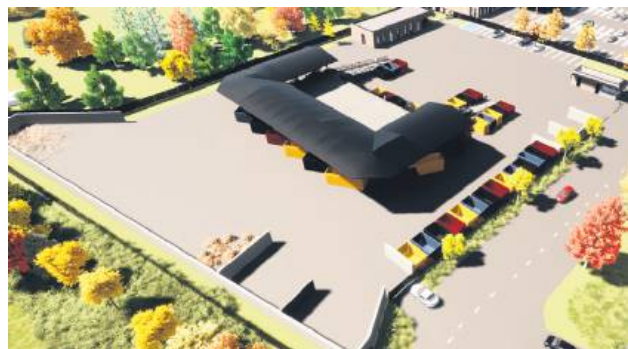
Tak ma wyglądać nowy Punkt Selektywnego Zbierania Odpadów Komunalnych w Zamościu.