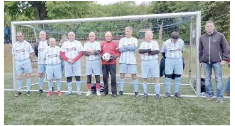
Drużyna Bosmana Nowogard z szóstym miejscem