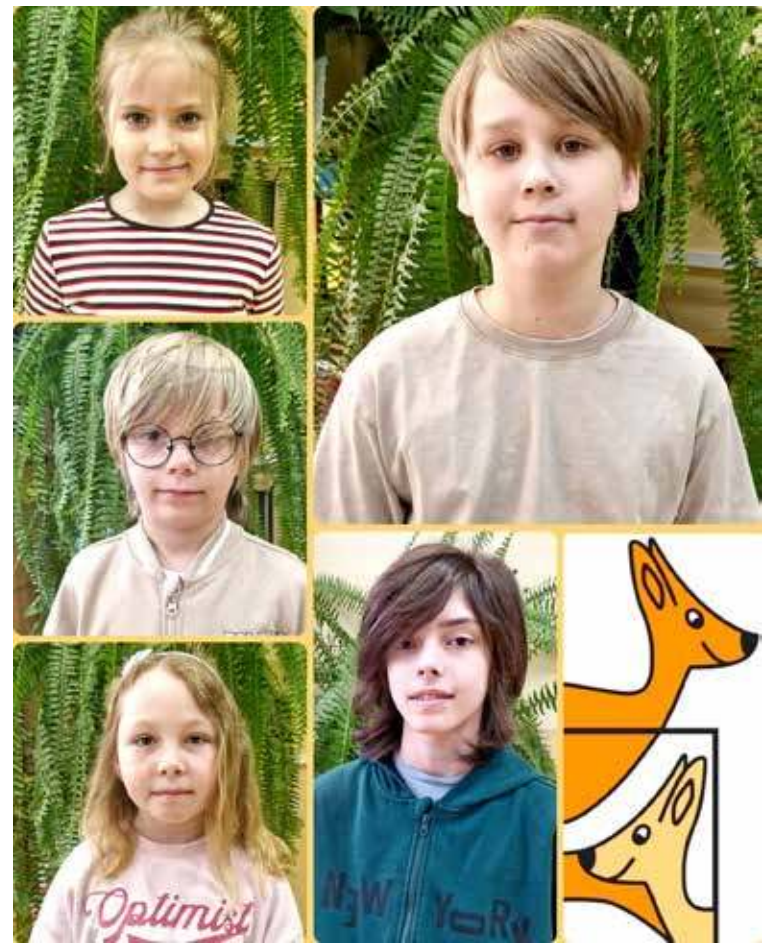
Uczniowie SP nr 3 pokazali, że warto rozwijać swoje pasje matematyczne