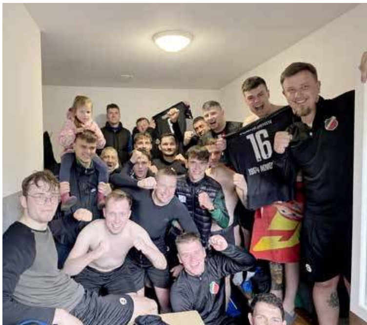
Kolejne trzy punkty zostały zdobyte w Małkocinie