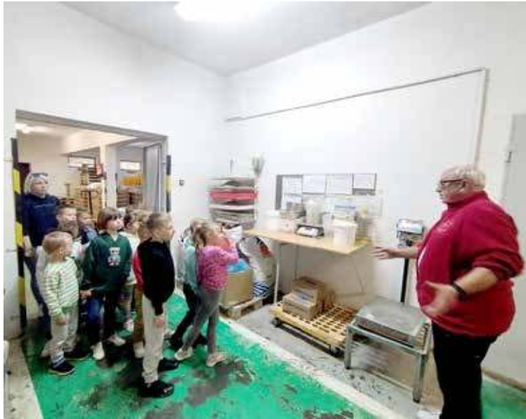
Uczniowie mieli możliwość osobiście przygotować bułki, które później dostali do spróbowania