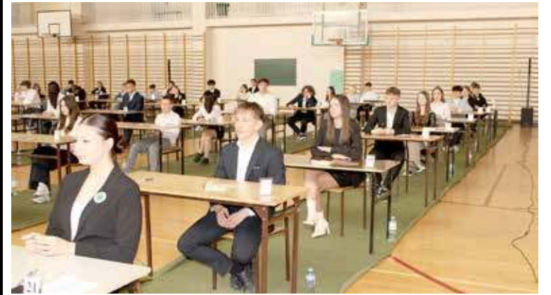
Uczniowie SP nr 3 przed swoim pierwszym egzaminem. W szkole olimpijczyków zdawało 69 uczniów