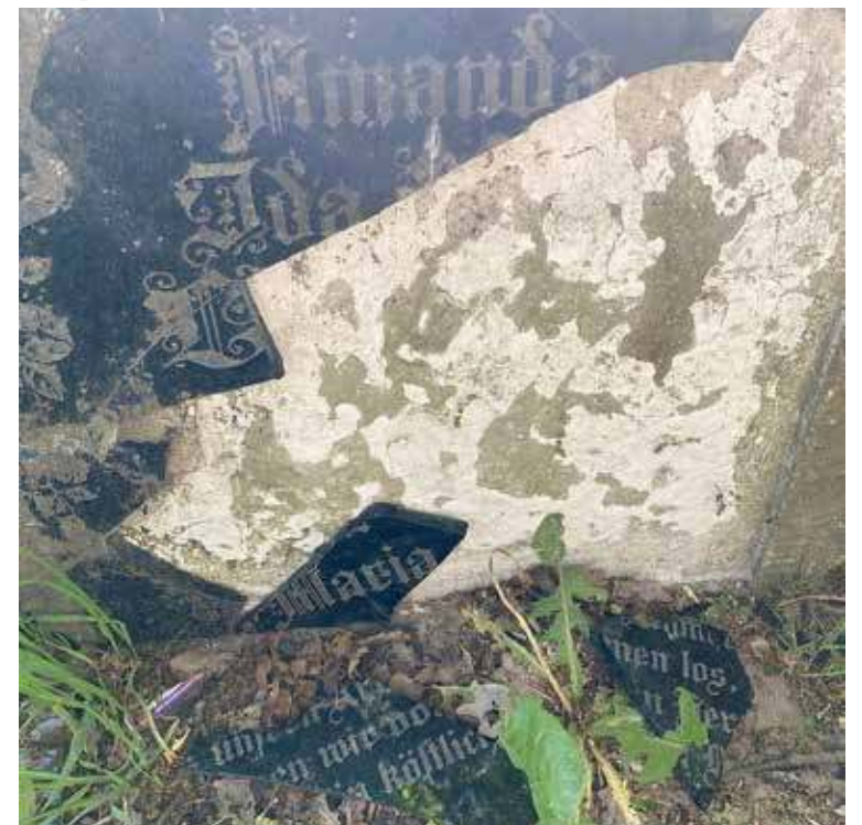
Uszkodzona płyt są znaczne