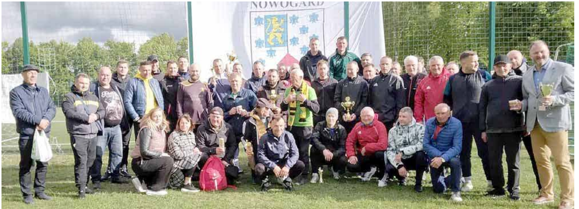
Pamiątkowe zdjęcie po rozdaniu nagród