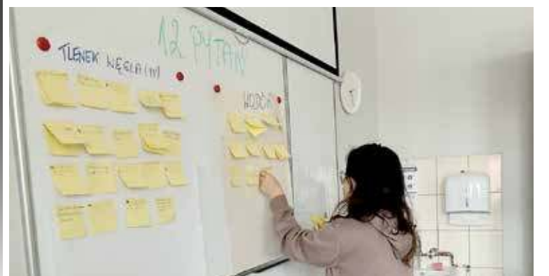
Uczniowie pytania zapisywali na karteczkach, które następnie przyklejali na dużą kartkę