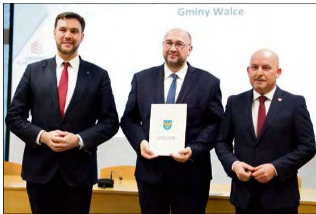
To kolejny krok w stronę nowoczesnej infrastruktury i poprawy jakości życia w gminie Walce.

Łącznie w ramach inwestycji powstanie 333,5 metra nowej sieci wodociągowej oraz 424 metry sieci kanalizacyjnej, co umożliwi wykonanie 31 przyłączy na terenach gminy położonych poza Aglomeracją Zdzieszowice. To istotny krok w kierunku poprawy dostęp-