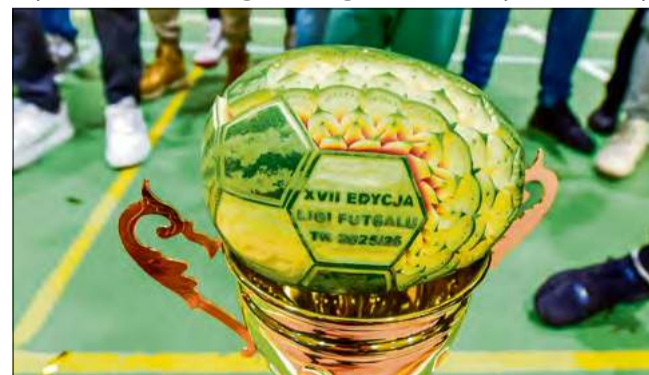
W ramach nagród znalazły się również arburowe piłki wykonane specjalnie na tę okazję przez mistrza Europy w Carvingu Daniela Bewkę.