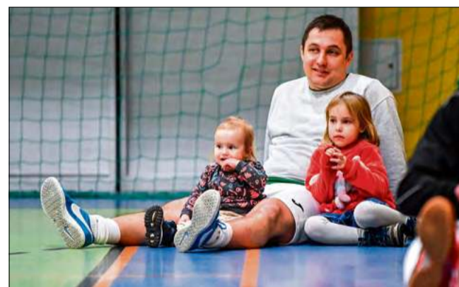
Wydarzenia ostatniego dnia ligi obserwowały całe rodziny.