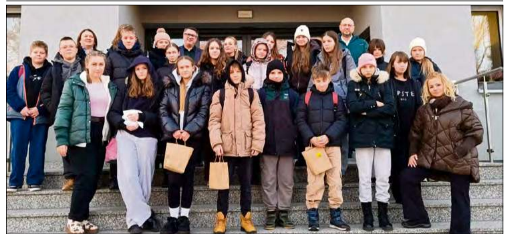
Te styczniowe dni na długo zapiszą się w pamięci młodych gości z Kobylnicy.

Współpraca samorządów to nie tylko zapisy w dokumentach, ale przede wszystkim żywe relacje między ludźmi. W drugiej połowie stycznia gmina Walce gościła młodych mieszkańców partnerskiej gminy Kobylnica, oferując im tydzień pełen wrażeń, nauki i integracji.