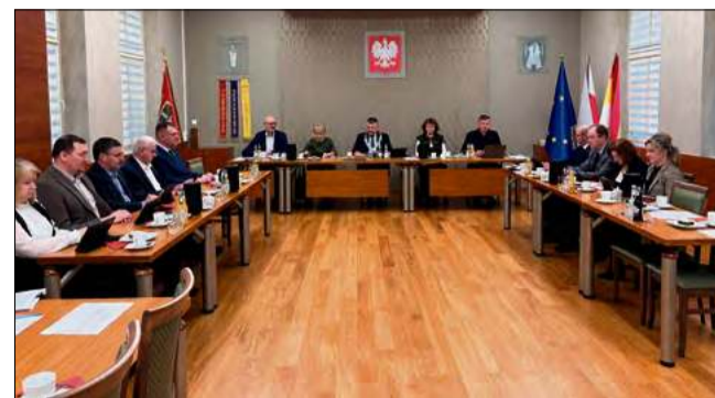
Radni wyrazili zgodę na udzielenie pożyczki podczas ostatniej sesji Rady Miejskiej w Gogolinie. Obrady miały miejsce we wtorek 27 stycznia.

mieszkańców są najważniejsze. To wyraźny sygnał, że lokalna władza nie zostawia swoich obywateli – i instytucji, które się nimi opiekują – samych w obliczu problemów systemowych. Dzięki takiej współpracy ośrodek zdrowia będzie mógł spokojnie pracować, nie przerywając