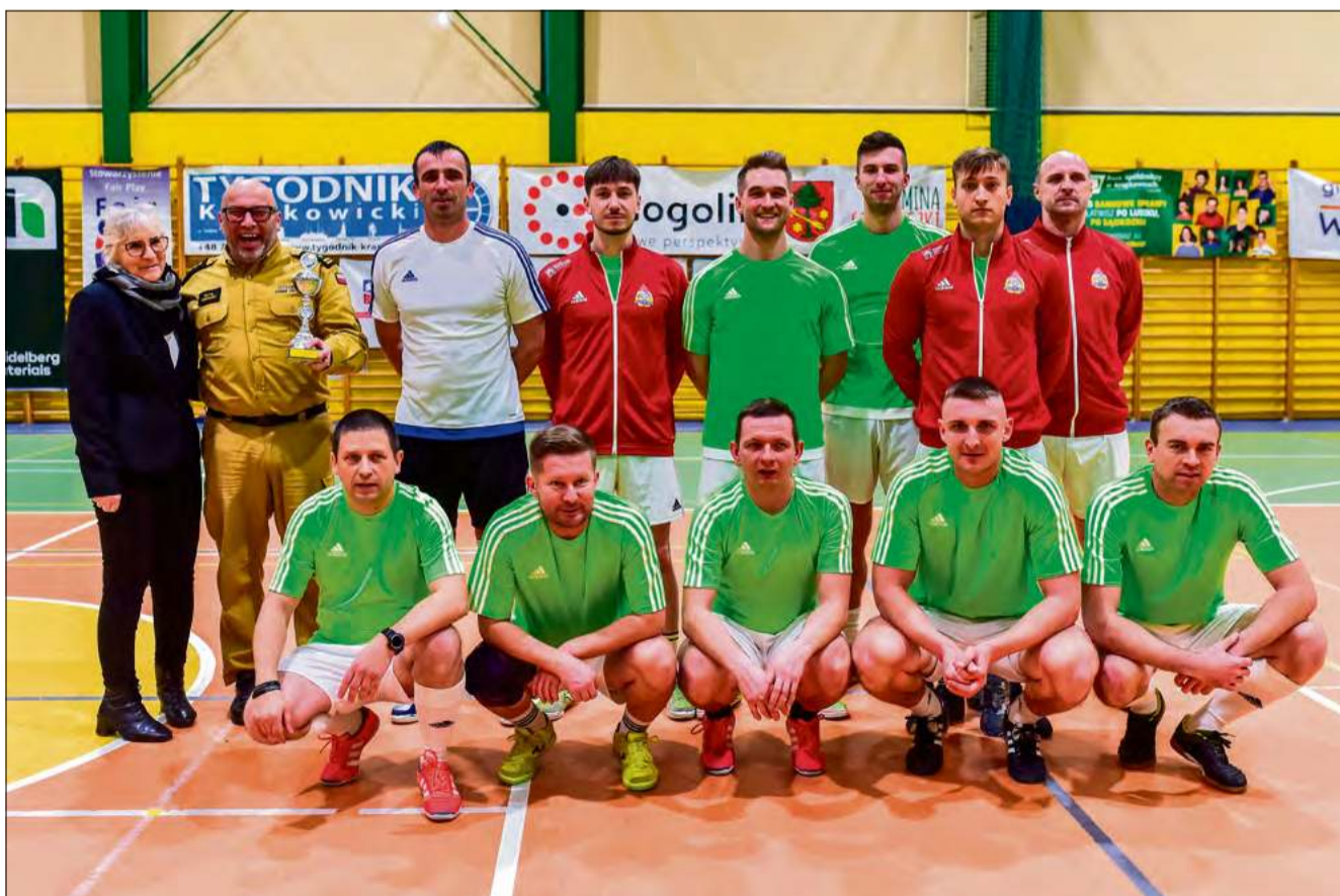
Tak prezentowała się na boisku kadra tych, którzy na co dzień są gotowi nieść nam pomoc. KPPSP w Krapkowicach w pełnej okazałości.