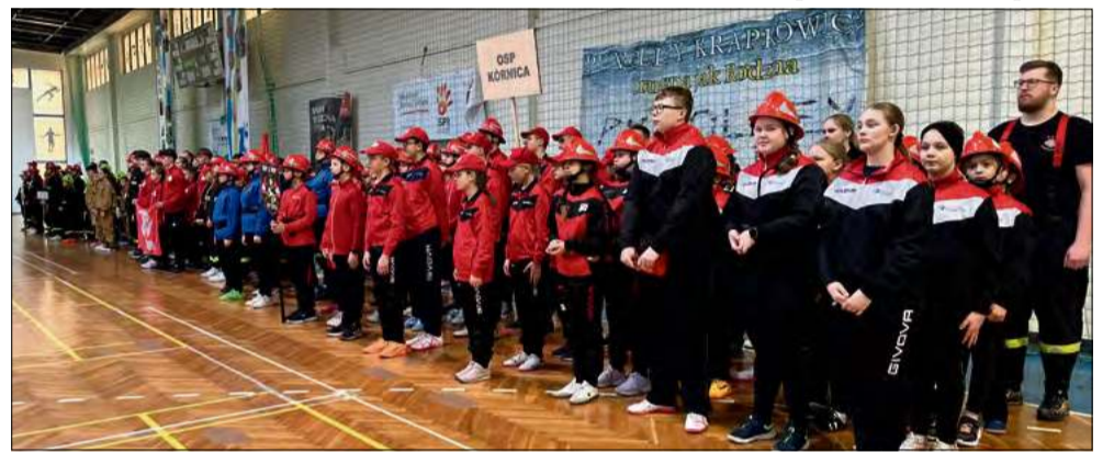
Młodzieżowe Drużyny Pożarnicze od najmłodszych lat uczą się zasad bezpieczeństwa.

Powiatowe Halowe Młodzieżowe Zawody Sportowo-Pożarnicze pokazały, że MDP są solidnym fundamentem przyszłych kadr Ochotniczych Straży Pożarnych. Młodzieżowe Drużyny Pożarnicze od najmłodszych lat uczą się zasad bezpieczeństwa, odpowie-