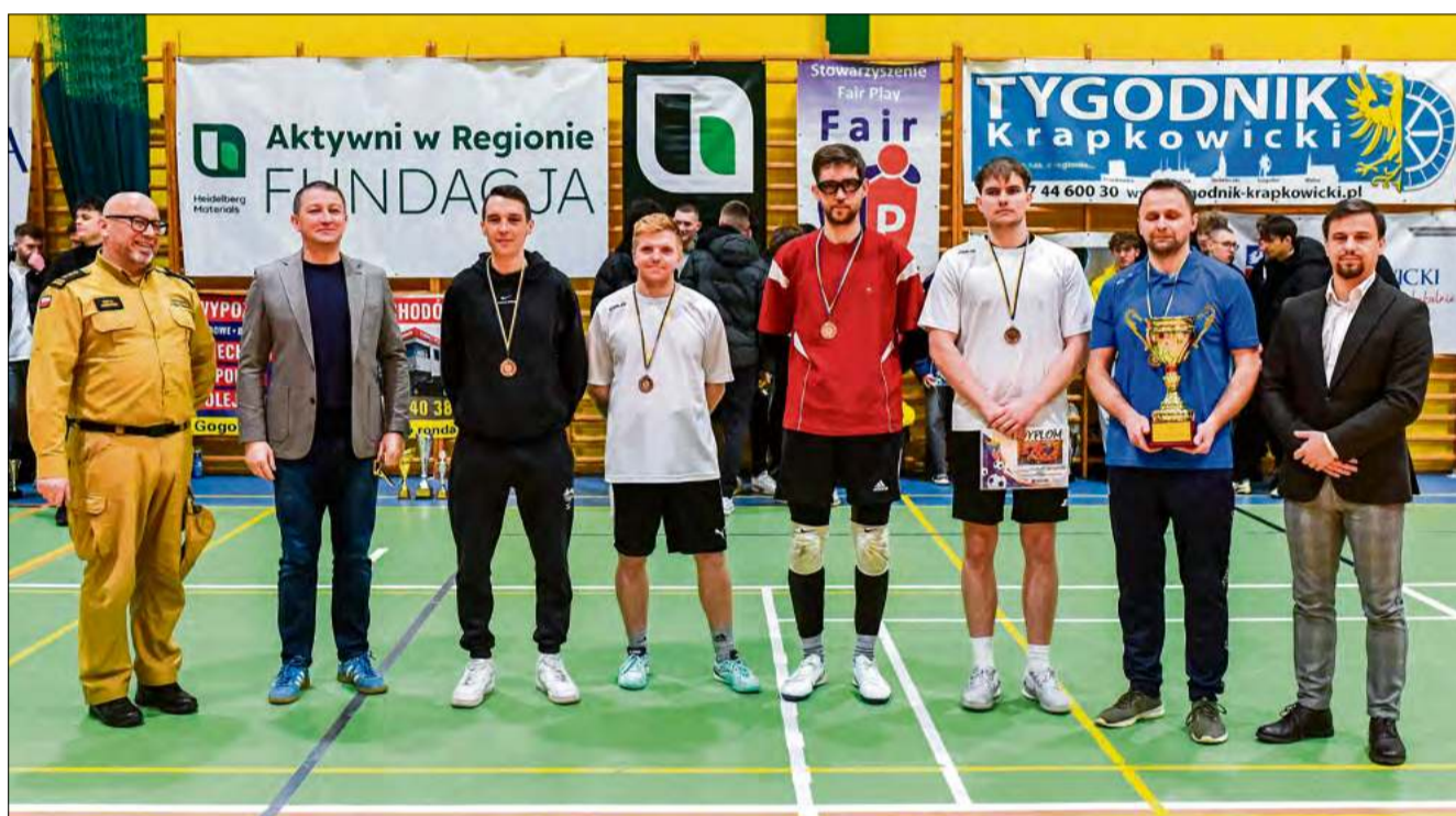
Filplast Głogówek sięgnął bo brązowy medal ligi i srebrny memoriał im. Konrada Basska.