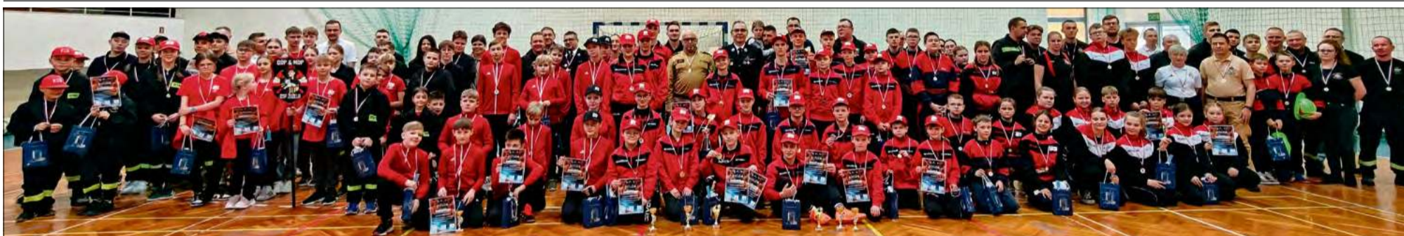
Krapkowicka Hala Widowiskowo-Sportowa przez dwa dni była areną zmagania młodych strażaków.

W miniony weekend w Hali Widowiskowo-Sportowej im. W. Piechoty w Krapkowicach odbyły się Gminne oraz Powiatowe Halowe, Młodzieżowe Zawody Sportowo-Pożarnicze. Przez dwa dni młodzi druhowie rywalizowali w sportowych konkurencjach, prezentując wysoki poziom przygotowania oraz duże zaangażowanie.