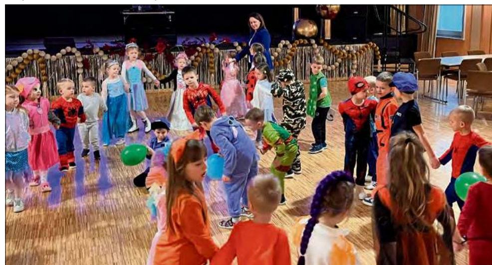
Te dni były prawdziwą, niezapomnianą frajdą.

– te dni były prawdziwą, niezapomnianą frajdą. W Gogolinie nie tylko dba się o zdrowie i infrastrukturę, ale też o