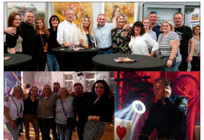
Wydarzenie było okazją do wspólnej zabawy, powrotu do muzycznych wspomnień.

O doskonałą oprawę muzyczną zadbał DJ Krystian