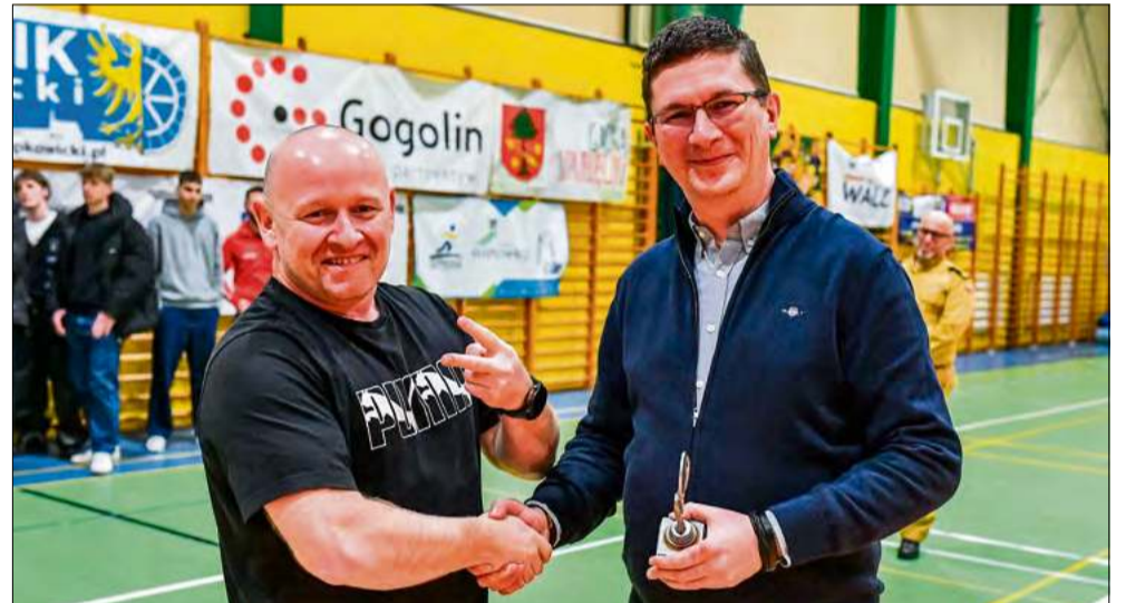
„Jak wino” – najstarszy uczestnik tygodnikowej zabawy w futsal jak widać był w wyborczej formie.