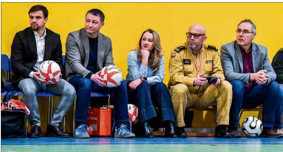
Zaproszeni goście z uwagą przyglądali się zmaganiom na parkiecie.