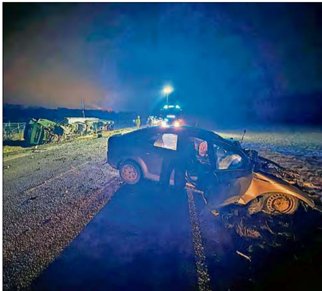
Mężczyzna kierujący samochodem osobowym marki ford mondeo czołowo zderzył się z ciężarówką przewożącą cement.

Na obwodnicy Malni i Choruli, na drodze wojewódzkiej nr 423, doszło do tragicznego wypadku, który zakończył się śmiercią kierowcy samochodu osobowego. Zderzenie z ciężarówką przewożącą cement nie dało mu żadnych szans.