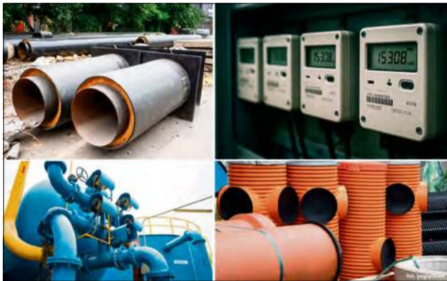
Władze gminy Zdzeszowice stawiają na innowacje.

Kluczowym elementem projektu jest dokończenie kanalizacji sanitarnej w Jasonej. Na ulicy Polnej powstanie ostatni, liczący około 1027 metrów, odcinek, który domknie system