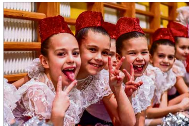
Mażoretki Ultra ze Zdzieszowic doskonale się bawiły nawet wtedy, gdy nie występowały.