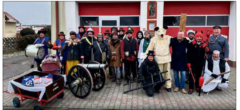
Barwny korowód przyniósł szczęście i radość mieszkańcom.

Kolorowy pochód wyruszył z inicjatywy Zespołu Folklorystycznego Wodzenie Niedźwiedzia przy OSP Dobra. Wesoła ekipa, na czele z tradycyjnym niedźwiedziem, przeszła ulicami Dobrej oraz Nowego Budu, odwiedzając domostwa i spotykając się z niezwykle życzliwym przyjęciem mieszkańców. Nie zabrakło muzyki, tańca, humoru i charakterystycz-