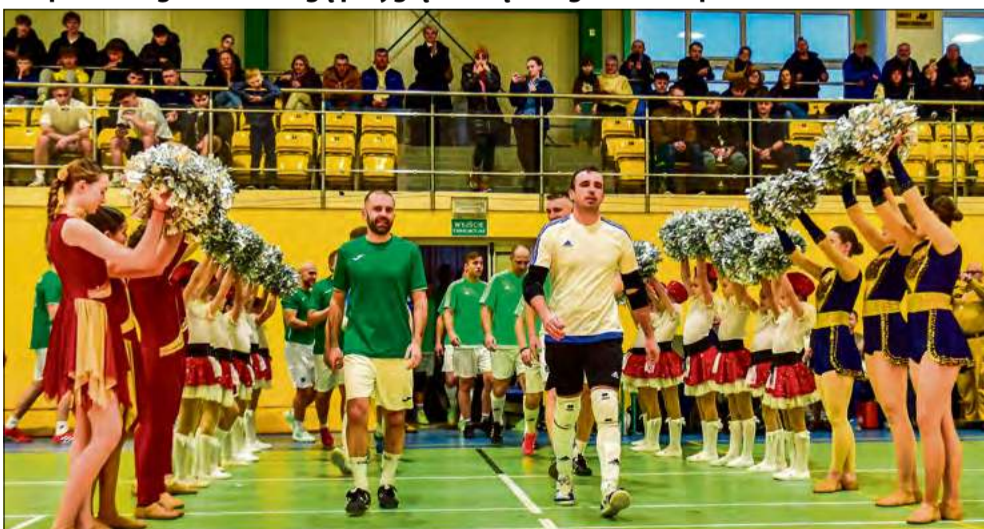
Pokazowy mecz Hestii i strażaków miał wyjątkową oprawę.