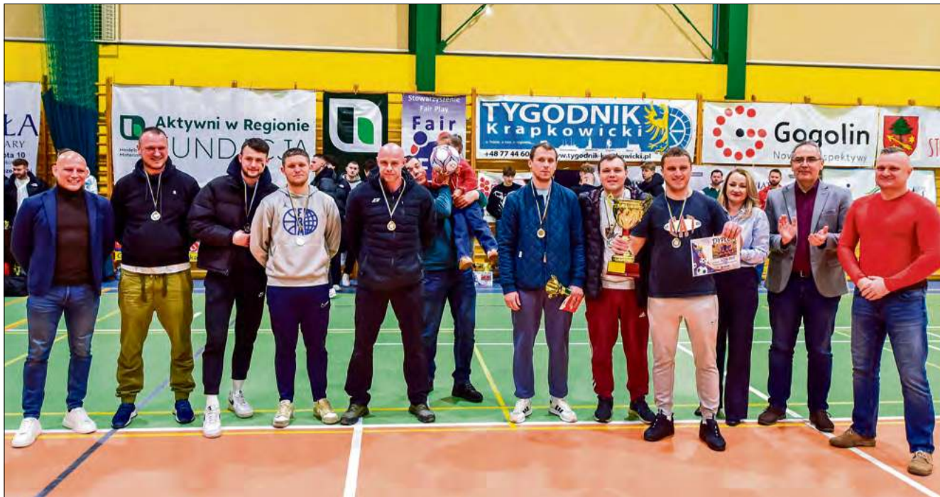
Szew Bud zakończył rywalizację na drugim stopniu podium.