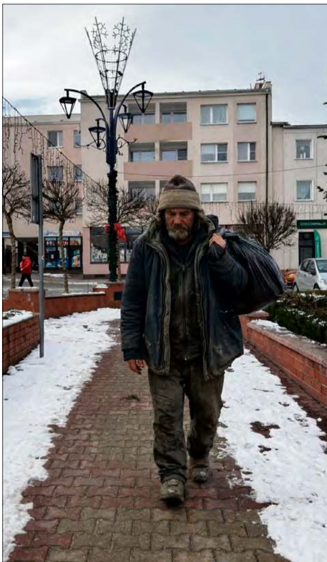
Nie wszyscy bezdomni decydują się na skorzystanie z instytucjonalnej pomocy.