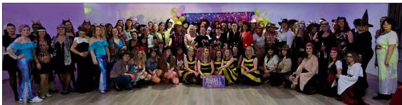
Tak bawiły się panie w Roźniątowie. Zabawa trwała do późnych godzin nocnych.

Prawdziwym hitem okazało się stanowisko przygotowane przez „Ina – Gabinet kosmetyczny”. Panie mogły skorzystać z