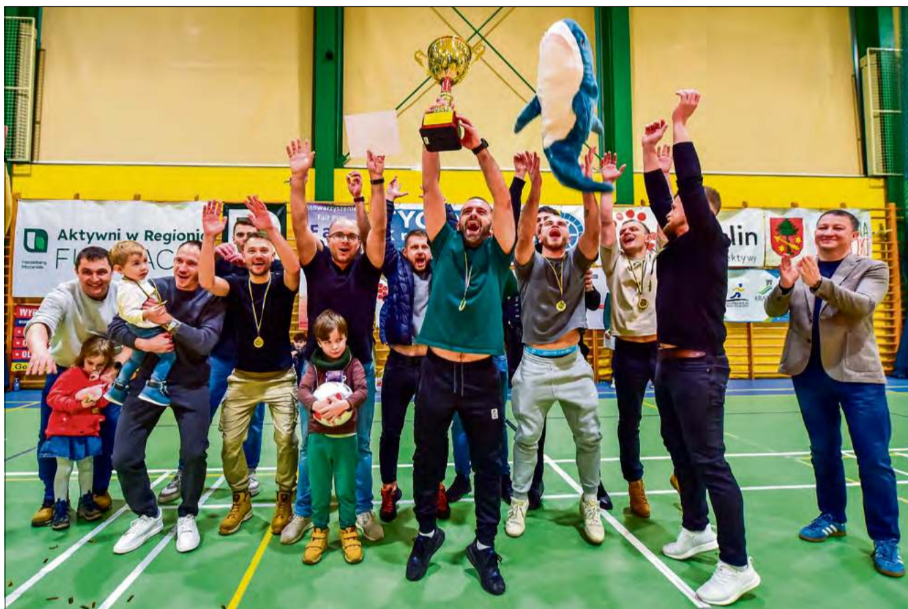
W tej edycji imprezy bezkonkurencyjna okazała się Hestia.

Sportowe emocje nie kończyły się jednak wyłącznie na triumfatorach. Drugie miejsce w rozgrywkach zajął międzynarodowy Szew Bud. Polsko-ukraińska drużyna na stałe wpisała się w futsalową rywalizację pod egidą Tygodnika Krapkowickiego, a w tym sezonie jej szeregi zasilili zawodnik o naprawdę impo-