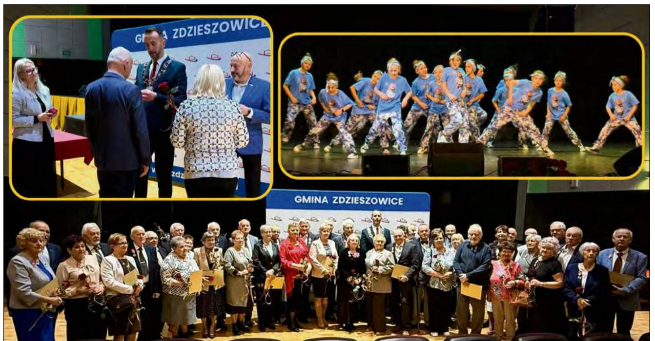
W Zdzeszowicach odbyła się uroczysta ceremonia wręczenia medali za długoletnie pożycie małżeńskie.