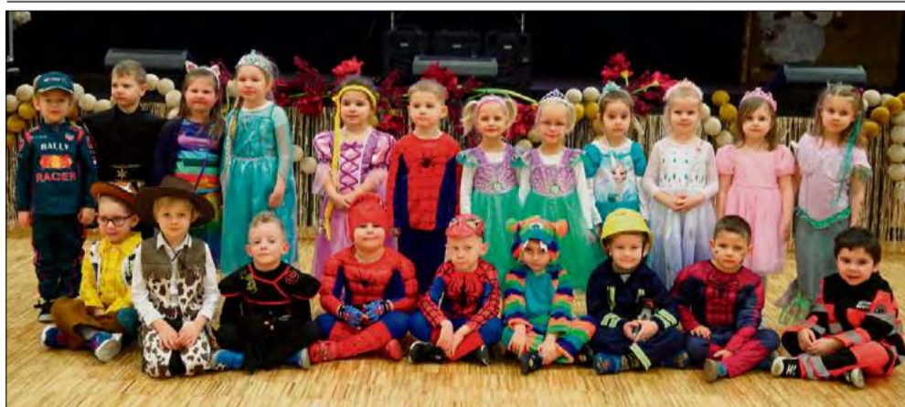
Zabawa rozpoczęła się od wizyty maluchów z Publicznego Przedszkola nr 1 w Gogolinie oraz Oddziału Przedszkolnego w Góraźdżach.

W Gminnym Ośrodku Kultury w Gogolinie zorganizowano trzy huczne bale przedszkolaka, które zgromadziły na parkiecie dzieci z całej gminy. Było głośno, wesoło i radośnie.