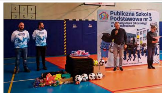
Nowy sprzęt ma fundamentalne znaczenie dla kształtowania pozytywnych nawyków i radości z ruchu wśród młodego pokolenia.

W kategorii sprzętu wspierającego rozwój koordynacji, zwinności i sprawności indywidualnej znalazły się: drabinka koordynacyjna, obręcz, dziesięć ringo, dziesięć hula-hop, cztery skakanki, dwadzieścia szarf, a także aż czterdzieści osiem piłeczek do żonglowania. Uczniowie będą