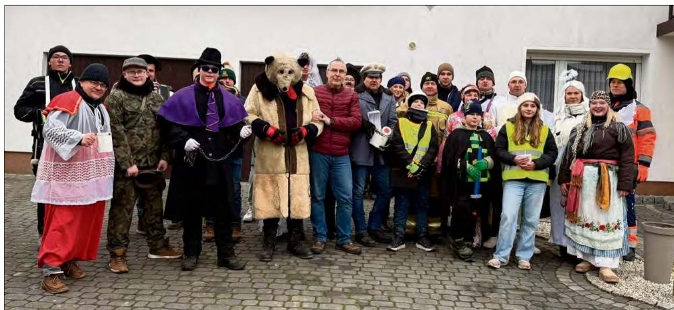
Rogowskie wodzenie niedźwiedzia to nie tylko zabawa, ale także forma pielęgnowania kulturowej pamięci, która, zgodnie z wierzeniami, ma moc odpędzania nieszczęść.

Organizatorami i strażnikami tej wielopokoleniowej tradycji są druhowie z OSP Rogów Opolski. To oni każdego roku, na przedwiośniu, ożywiają obyczaj, którego korzenie