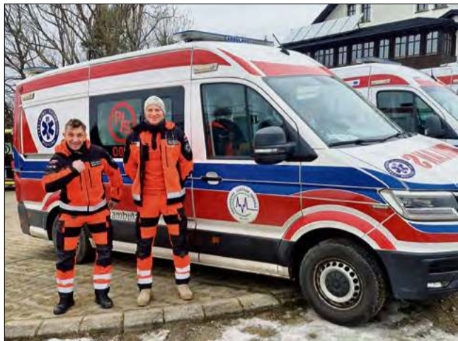
Ekipie udało się pokonać drużyny ratowników z Niemiec i Słowenii.

Ratownicy medyczni z Krapkowic odnieśli sukces podczas XX Międzynarodowych Zimowych Mistrzostw w Ratownictwie Medycznym w Szczyrku. W konkurencji z elitarnymi zespołami z Niemiec, Słowenii i licznych polskich miast, pokazali klasę.