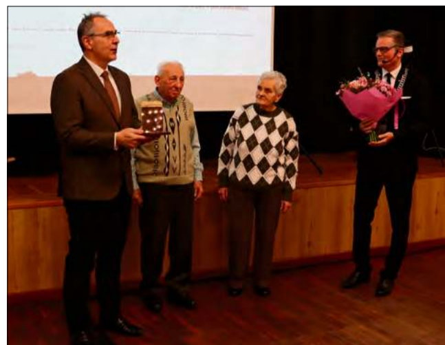
Spotkanie miało miejsce w sali tanecznej Krapkowickiego Domu Kultury.

Choć iluminacje przy ul. Chrobrego 77 już nie rozblyszą, pozostaną w pamięci mieszkańców jako coś więcej niż tylko dekoracja. Były one znakiem życzliwości, radości i wspólnoty – warto-