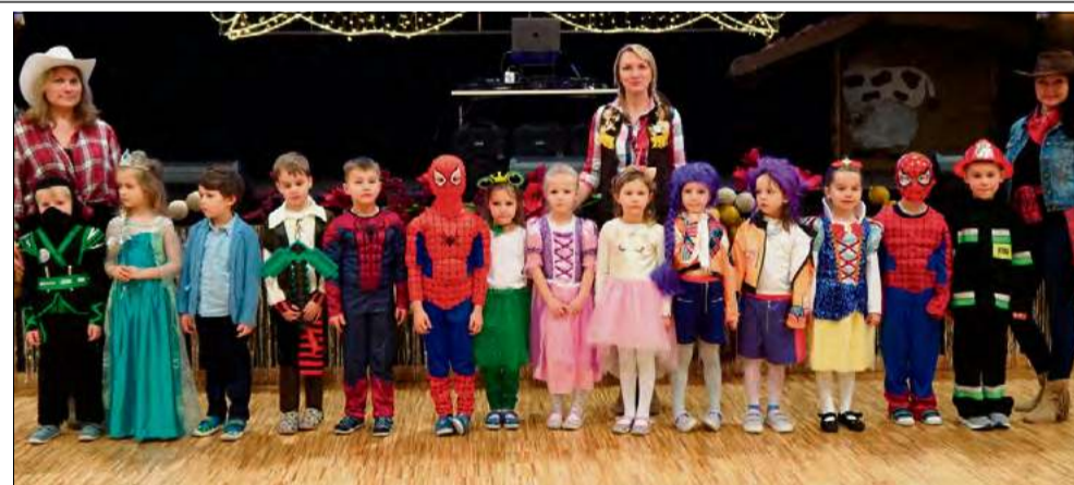
Było wesoło i kolorowo, jak to w karnawale.

Uśmiechy na dziecięcych twarzach mówiły wszystko