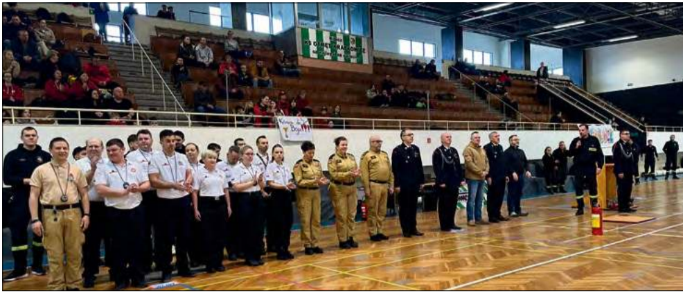
Zawody powiatowe odbyły się po raz drugi.

Krapkowice były areną wielkich emocji i strażackiej rywalizacji. Podczas II Powiatowych Halowych Młodzieżowych Zawodów Sportowo-Pożarniczych najlepsze drużyny MDP walczyły nie tylko o medale, ale przede wszystkim o awans do zawodów wojewódzkich.