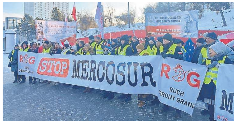
Do zatwierdzenia umowy doszło mimo protestów rolników w całej Europie, w tym w Polsce

W tym przypadku potrzebna będzie ratyfikacja Parlamentu Europejskiego i państw członkowskich. Parlament Europejski z powodu stwierdzo-