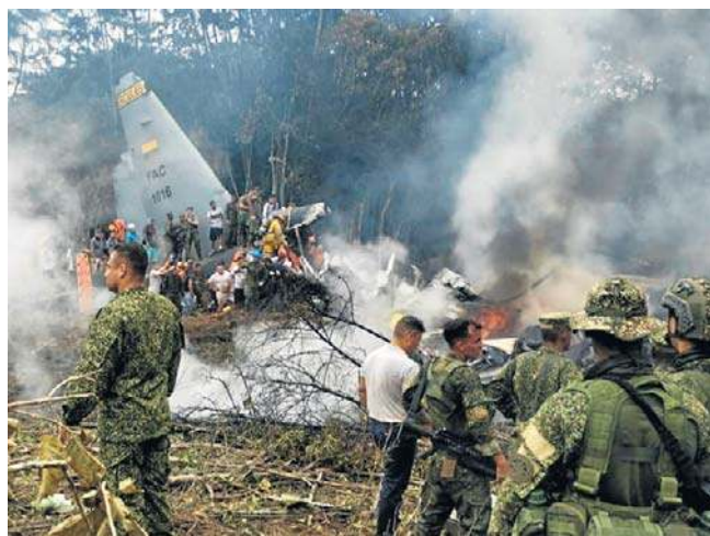
Do katastrofy doszło wkrótce po starcie samolotu z lotniska w Puerto Leguizamo