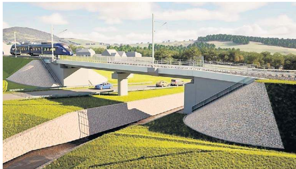
Tak będzie wyglądał nowy most kolejowy w przysiółku Fornale w Kasinie Wielkiej (wizualizacja)

Dzięki budowie nowego odcinka linii, który połączy Kraków ze zmodernizowanymi odcinkami linii 104 do Zakopanego i Nowego Sącza, znacznie skróci się czas przejazdu do stolicy województwa. Samorządowcy i mieszkańcy liczą na rozwój gospodarczy i społeczny, a także zwiększenie atrakcyjności turystycznej Sądectczyzny i Limanowszczyzny. Po zakończeniu prac najszybsze pociągi dojadą z Krakowa do Nowego Sącza w około 60 minut, do Limanowej w ok. 40 minut, a do Zakopanego w 90 minut. ©P