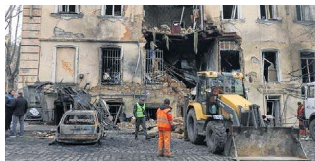
W nocy z poniedziałku na wtorek armia rosyjska użyła w atakach 34 rakiet i 392 dronów

Według wstępnych informacji armia rosyjska wykorzystała do ataku dron typu FPV,