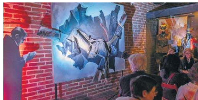
„Kłęska wrześniowa” Tadeusza Kantora w Muzeum Armii Krajowej

Wymowne dzieło przedstawia polskiego żołnierza rozpiętego krzyżem. Tłem jest mapa II Rzeczypospolitej, rozdarta przez dwóch najeźdźców - hitlerowskie Niemcy i sowiecką Rosję.