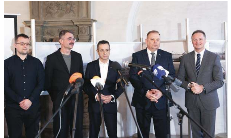
Ogłoszenie konkursu odbyło się podczas konferencji prasowej w Elblągu

Rozwój portu morskiego to także modernizacja infrastruktury