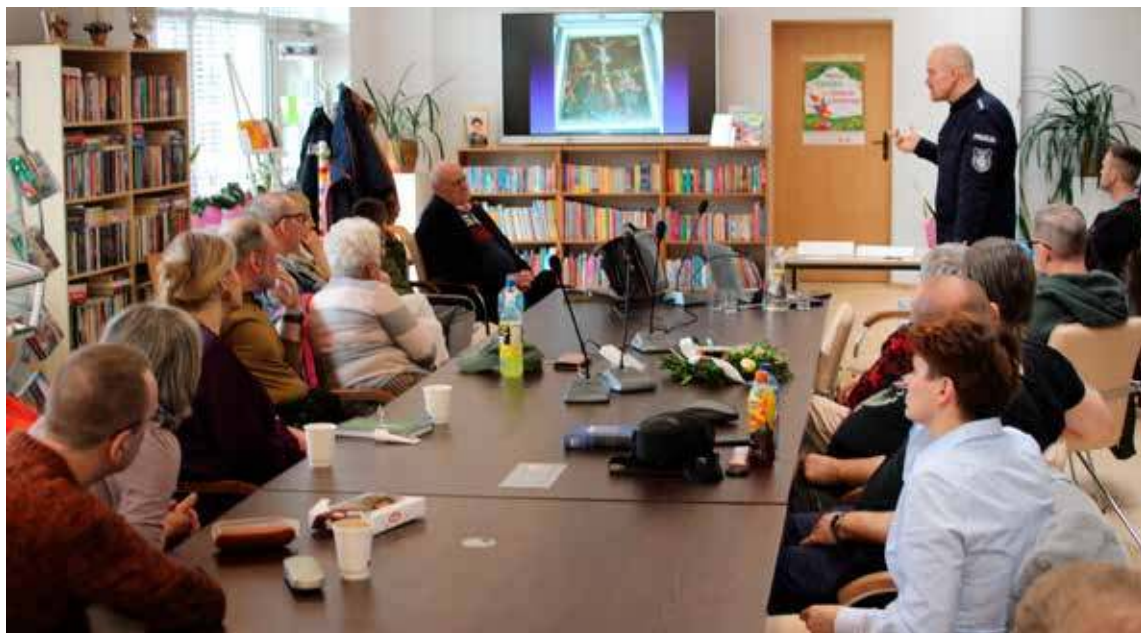
Prelekcja cieszyła się sporym zainteresowaniem