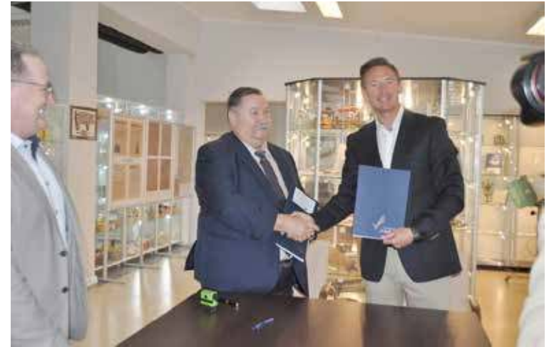
Umowy o dofinansowanie zostały podpisane

Drugą inwestycją jest projekt remontu przystani im. Hilgendorfa oraz rozbudowy bosmanatu. Jej zakres obejmuje remont