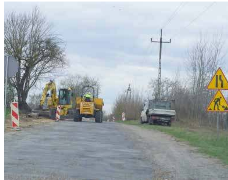
Rozpoczęły się prace związane z przebudową drogi w Mieszkowie