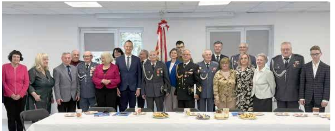
Obchody odbyły się w goleniowskim CAL-u