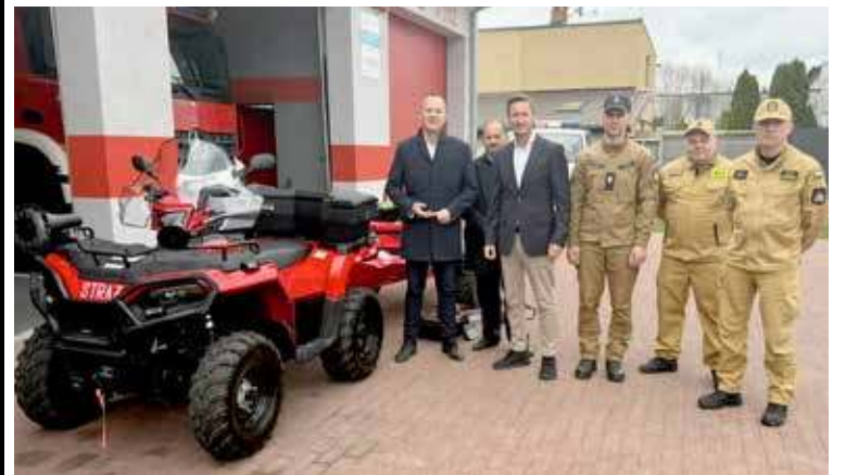
Nowy sprzęt został przekazany OSP Lubczyna