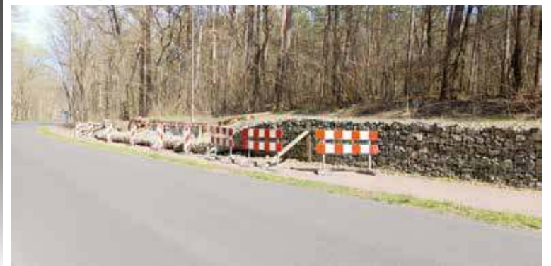
Murek podtrzymujący skarpe przewrócił się na chodnik