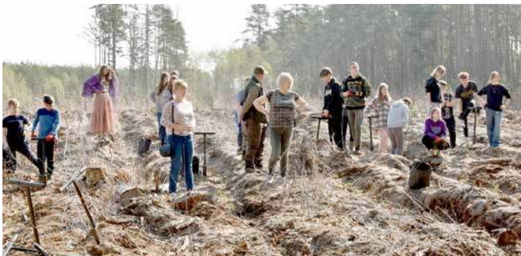
W akcji uczestniczyli uczniowie ze szkół powiatowych oraz szczecińskich

Cała ta akcja jest tylko częścią o wiele większej inicjatywy. Jest nią plan posadzenia stu tysięcy nowych drzew na terenie Pomorza Zachodniego. Akcja ta jest organizowana przez Marszałka