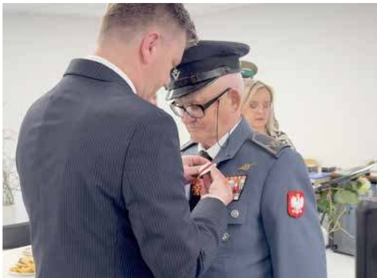
W trakcie uroczystości wręczane były odznaczenia