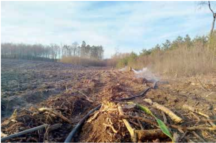
W gaszeniu pożaru lasu przed kilkoma dniami brali udział druhowie z OSP Mosty

Nieduże opady deszczu oraz rosnąca temperatura może i są przejawami wiosny, lecz nie są one bez wad. Jedną z nich jest rosnące ryzyko pożarowe. O tym właśnie ostrzega Nadleśnictwo Kliniska.