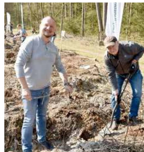
W Kliniskach odbyła się akcja sadzenia drzew