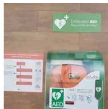
W Radzanku jest AED

Jest to nowoczesne urządzenie jest w stanie przywrócić prawidłową pracę serca w sytuacji nagłego zatrzymania krążenia. Jego użycie jest bardzo łatwe, urządzenie zostało zaprojektowane