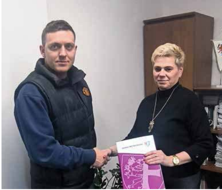
Umowa na dzierżawę plaży została podpisana