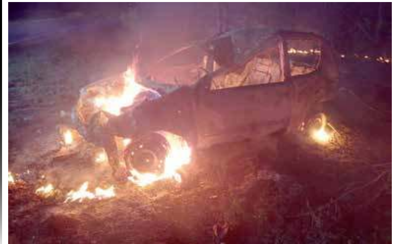
Samochód płonął w lesie