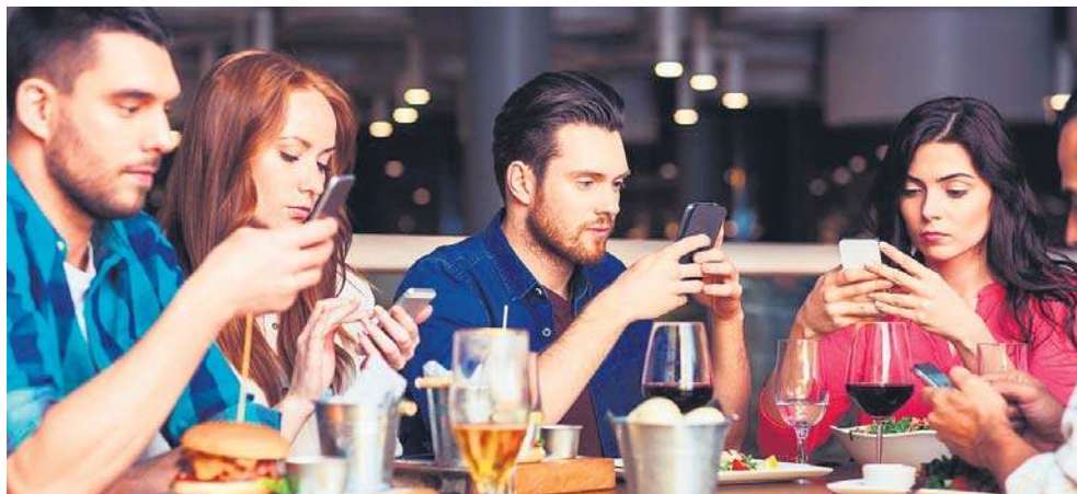
Umówiłeś się z kimś? Wyciszony telefon niech zostanie w torbie