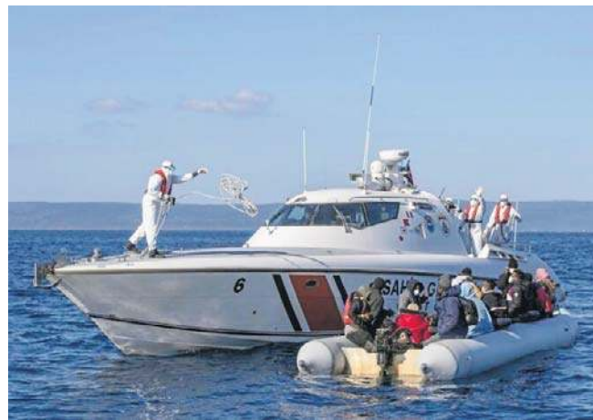
Siedem osób zostało uratowanych z morza przez straż przybrzeżną

Jak poinformowała agencja Anadolu, władze wszczęły w sprawie tego incydentu zarówno dochodzenie sądowe, jak i administracyjne. PAP