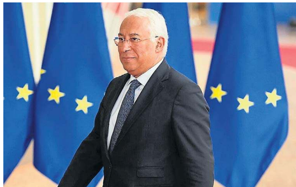
- Jednak wolności i praw człowieka nie da się osiągnąć za pomocą bomb. Tylko prawo międzynarodowe je gwarantuje - powiedział na konferencji ambasadorów Antonio Costa

Zaznaczył, że UE solidaryzuje się z Irańczykami i popiera