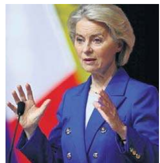
Ursula von der Leyen: UE dysponuje własnymi źródłami energii jądrowej

Szefowa KE zauważyła, że UE dysponuje własnymi źródłami energii jądrowej i odnawialnej, które połączone mogłyby się stać gwarantem bezpieczeństwa dostaw energii. Zwłaszcza że - jak