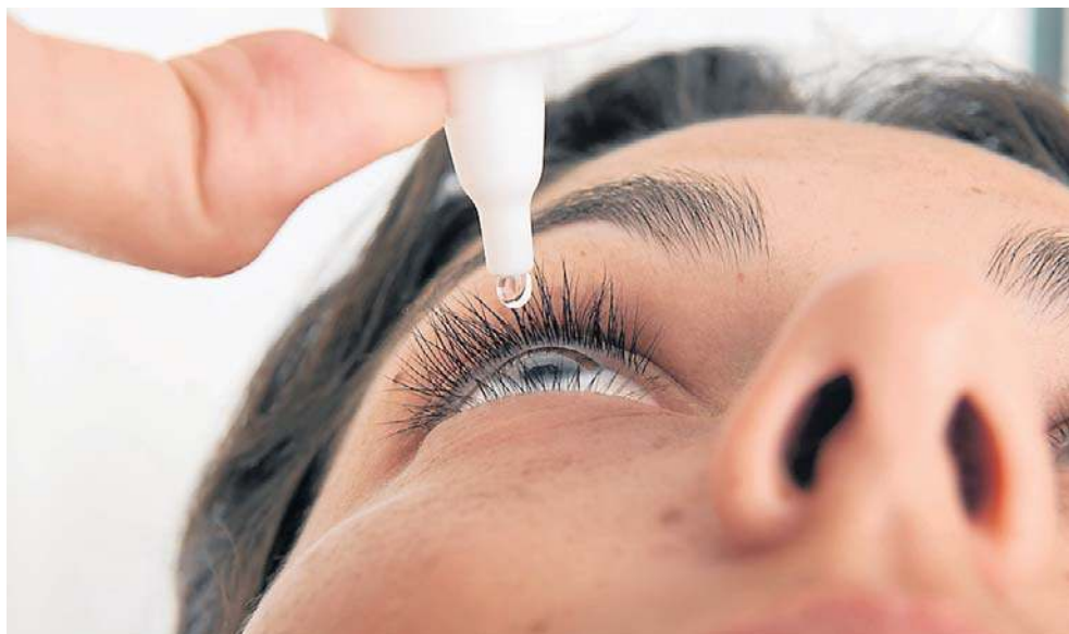
Wylew podspojówkowy zazwyczaj jest niegroźny. Objawia się nagłym pojawieniem się intensywnie czerwonej plamy, której nie towarzyszy ból ani pogorszenie widzenia

Krwiak najczęściej powstaje wskutek nagłego wzrostu ciśnienia w naczyniach krwionośnych, do którego może dojść podczas wysiłku fizycznego, gwałtownego kaszlu, kichania, intensywnego śmiechu czy wymiotów. Często krwiak pojawia się również w wyniku urazów mechanicznych, takich jak nieświadome pocieranie oka podczas snu lub ucisk gałki ocznej. U osób starszych przyczyną mogą być kruche naczynia