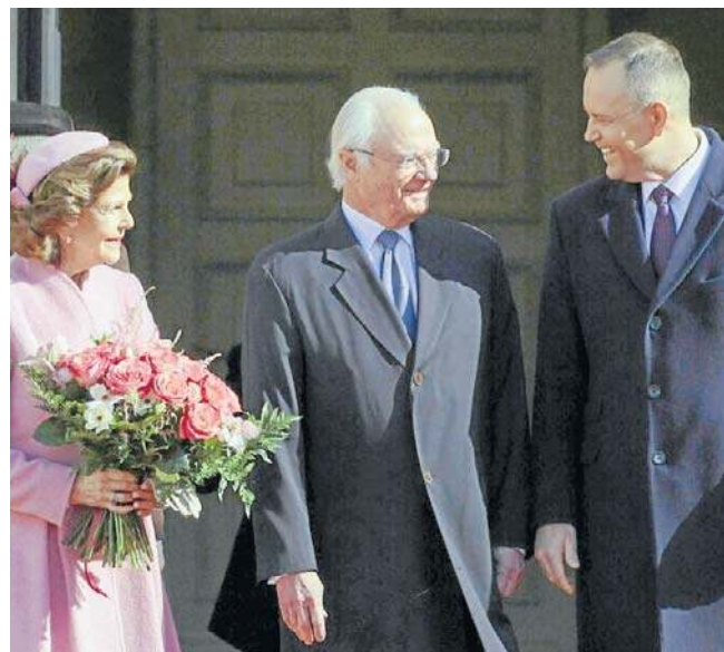
To trzecia wizyta w Polsce Karola XVI Gustawa, który jest królem Szwecji od 1973 roku

To trzecia wizyta w Polsce Karola XVI Gustawa, który jest królem Szwecji od 1973 roku. Wcześniej przyjechał w 1993 roku oraz w 2011 roku.