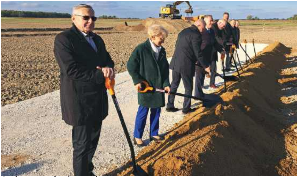
A tak to wszystko się zaczęło...